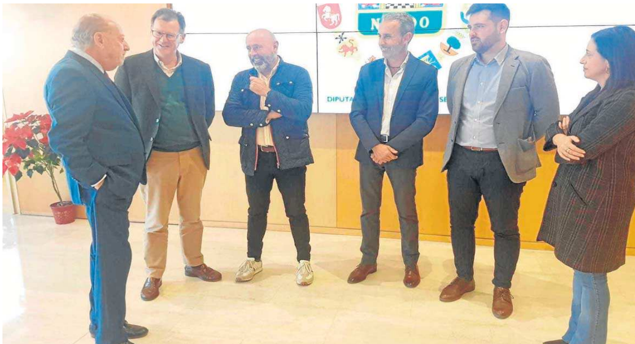
Villalobos conversa con los alcaldes beneficiados por estas ayudas a la cultura.