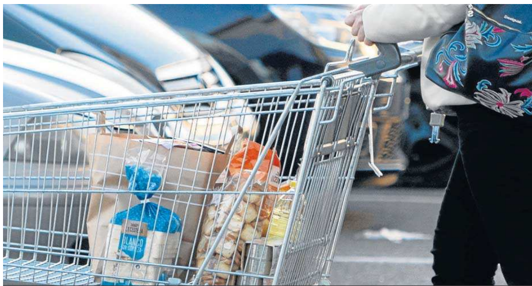
Una ciudadano pasea con un carrito tras hacer la compra en un supermercado.

● El Gobierno aprueba una rebaja de impuestos de los alimentos más básicos desde el 1 de enero hasta el 30 de junio y un cheque de 200 euros para familias con rentas inferiores a 27.000 euros