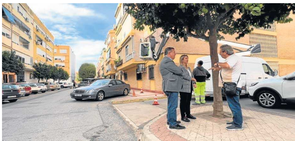
Un momento de la reunión en la calle.

La primera treintena de calles se pavimentan con fondos del Plan Actúa de Diputación de Sevilla con un importe de 506.000 euros. Así mismo, con cargo al superávit del presupuesto municipal se destinan otros 532.000 euros a la campaña de mejoras en viales públicos, que afecta a otra treintena de calles por la ciudad según el diagnóstico realizado que se darán a conocer en la