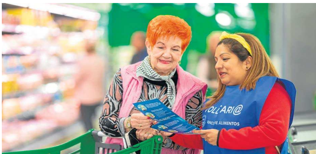
Voluntaria en una tienda de Mercadona durante la Gran Recogida de Alimentos.

● La cantidad donada se transformará de forma íntegra en más de 2.300 toneladas de productos de primera necesidad