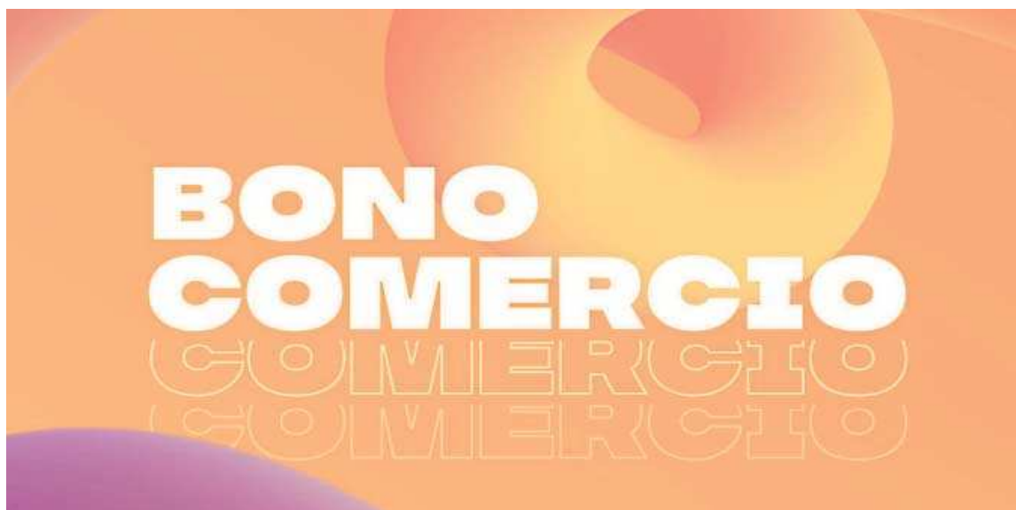
Detalle del cartel de promoción.