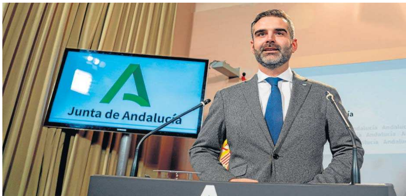
El portavoz de la Junta, Ramón Fernández-Pacheco, en la rueda de prensa celebrada ayer en el Palacio de San Telmo, en Sevilla.