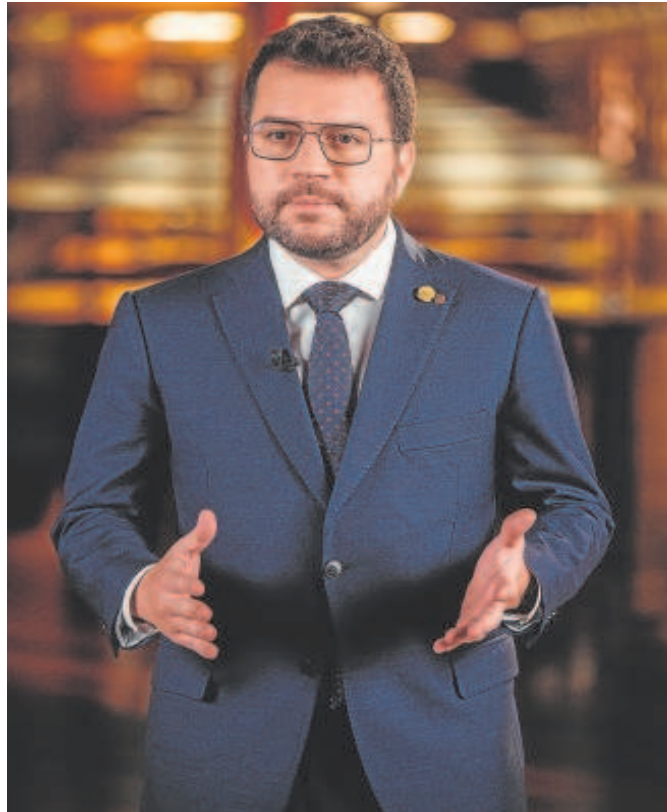
El presidente de Cataluña en su discurso de San Esteban

En este escenario, Fernández-Pacheco fue claro: «La postura del Gobierno andaluz es clara y somos la comunidad donde más españoles viven. El presidente de la Junta defenderá en