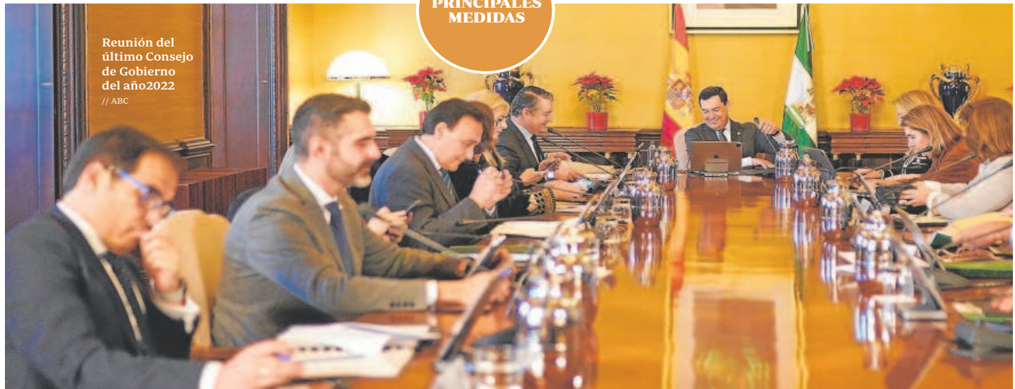
Reunión del último Consejo de Gobierno del año 2022