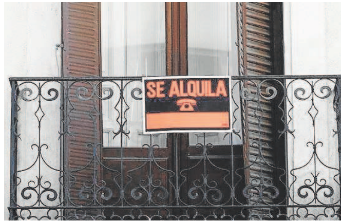
Los propietarios denuncian que se vulnera la seguridad jurídica // ABC

El lunes, el Ministerio de Transportes aseguraba tajantemente que la única medida respecto a la vivienda que