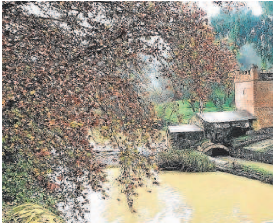
Imagen del río Guadaira a su paso por el municipio de Alcalá

El grueso del proyecto consiste en realizar un bombeo de aguas desde la salida de la depuradora de Ranilla hasta la cabecera del tramo urbano del Guadaíra en el Molino de la Aceña. El agua que finaliza su ciclo de tratamiento en la estación depuradora y que tie-