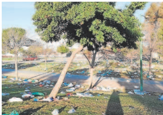
Estado en el que queda el parque tras las concentraciones

Los defensores del Pueblo de España y Andalucía ya han admitido a trámite la queja presentada por la Asociación Parque Vivo del Guadaíra, a la que han comunicado la solicitud de informes a la Policía y al Ayuntamiento.