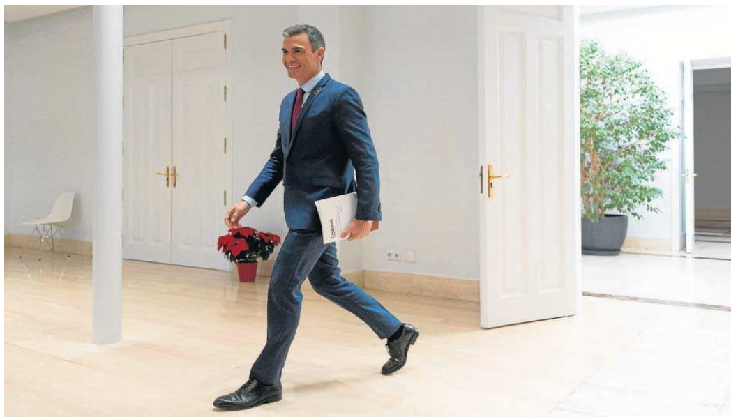
El presidente del Gobierno, Pedro Sánchez, a su llegada a la rueda de prensa tras el último Consejo de Ministros del año, ayer en La Moncloa.