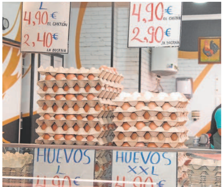
El IVA de alimentos como los huevos pasará del 4% al 0% // DE SAN BERNARDO

butan hasta el momento al 4% y en la práctica supondrá que huevos, verduras, frutas, legumbres, pan, queso, patatas, cereales y leche no sean gravados por el Impuesto al Valor añadido, al menos, hasta el próximo mes de julio. Una disposición a la que se añadirá una rebaja del mismo tributo desde el 10% al 5% para pastas y aceites y en la que finalmente no han sido in-