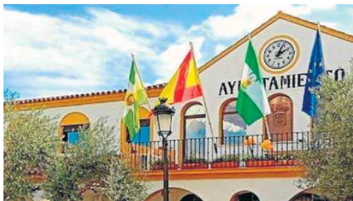
Detalle del Ayuntamiento de Bormujos.

Las cuentas contemplan la contratación de la concesión de servicios para la renovación, suministro de energía y mantenimiento del alumbrado público, lo que supondrá una mayor eficiencia y ahorro energético en los hogares de los bormujeros y bormujeras. Supondrá un coste de unos cuatro millones y medio y se desarrollará por un plazo de 14 años. Se trata de un proyecto que, en palabras del alcalde Francisco Molina, “repercuti-