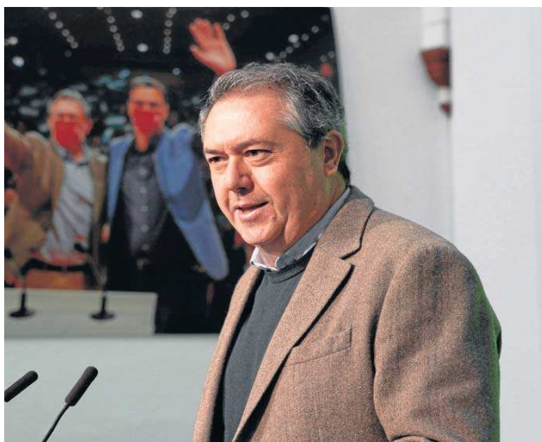
El secretario general del PSOE-A, Juan Espadas, durante la comparecencia de ayer en la sede del partido en Sevilla.

"No me cabe duda" de que así sucederá, añadió Espadas antes de mencionar la existencia de "una infinidad de precedentes" y que el simple cumplimiento de las normas obliga a las autoridades a que, acreditada esa enfermedad, como se va a producir en unas horas con resultados médicos e informes preceptivos, se tome la decisión correcta" para que Griñán "pueda tratarse adecuadamente su enfermedad".