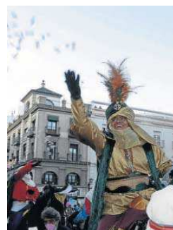
El Heraldo Real.

La Cabalgata de los Reyes Magos del Ateneo de Sevilla recuperará el itinerario habitual a la hora de acceder al centro histórico. El cortejo entrará por Feria como era costumbre y evitará el itinerario realizado el pasado año, cuando se tomaron medidas para reducir en lo posible la concentración de grandes cantidades de público en zonas estrechas. Entonces, una vez alcanzada la Resolana, continuó en dirección a la Barqueta para discurrir de forma excepcional por la calle Torneo. Antes de llegar al paso inferior de Arjona, el cortejo se desvió por San Laureano, Marqués de Paradas y Reyes Católicos para llegar al Paseo Colón y avanzar hasta el Pala-