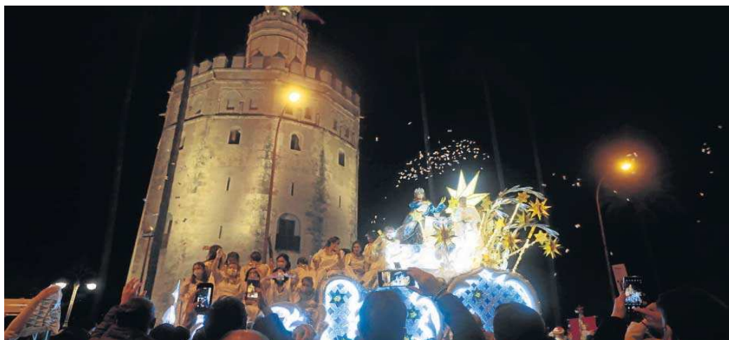
La cabalgata de 2023, a su paso por el Paseo de Colón.