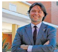
El rector de la UPO, Francisco Oliva.

centes; actuaciones deportivas como la Semana Europea del Deporte y el Centro de Estudios Olímpicos e Investigación; se dedica una partida a la coordinación de la Prueba de Acceso a la Uni-