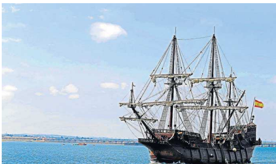
Un momento del paso del galeón 'Andalucía' por Huelva en uno de sus viajes.