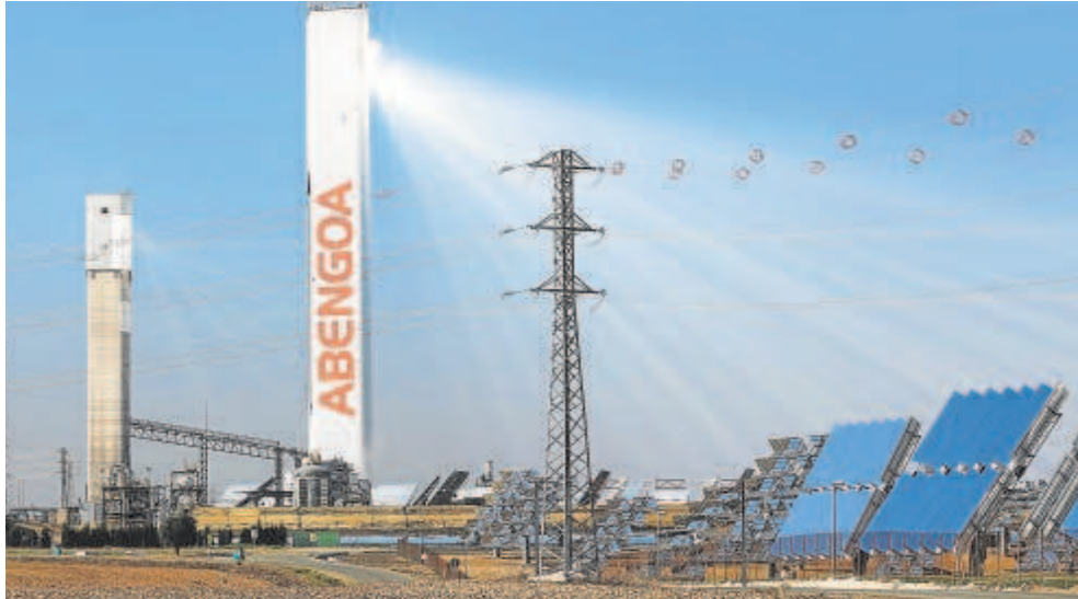
Aún está abierto el plazo para presentar ofertas de compra por el grupo Abengoa