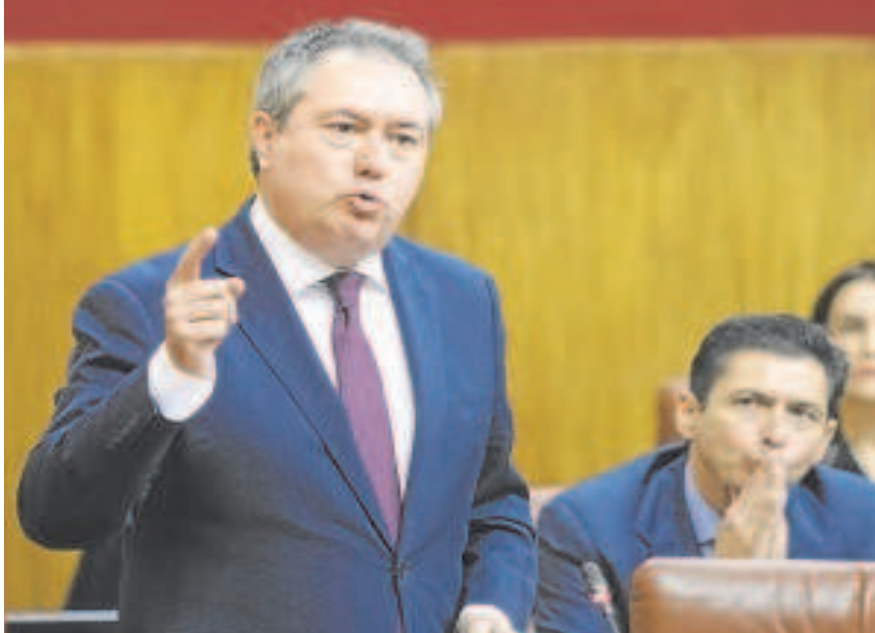
El secretario general del PSOE andaluz, Juan Espadas