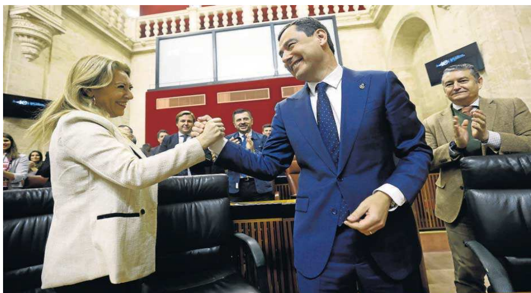
El presidente de la Junta, Juanma Moreno, felicita a la consejera de Hacienda, Carolina España, tras la aprobación definitiva de los Presupuestos.

fomentan la Marca Andalucía” y “los mejores que ha tenido la comunidad, ya que responden a lo que quieren los andaluces”.