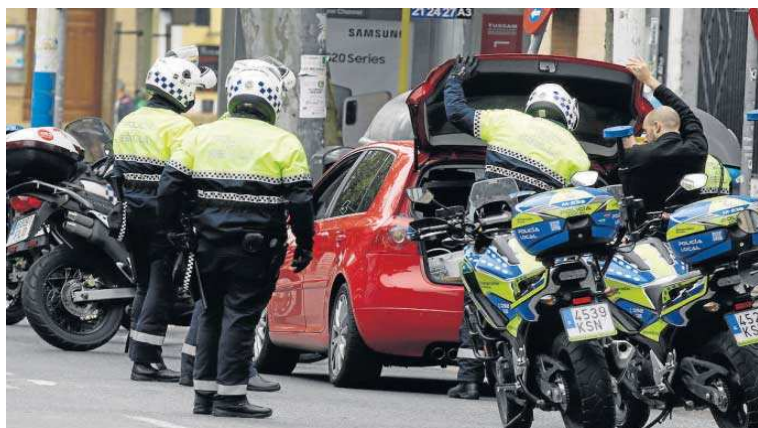
Policías locales de Sevilla, en una imagen de archivo.

En los últimos seis años y medio se han convocado para la Policía Local de Sevilla 265 nuevas plazas, a las que hay que añadir 27 de promoción interna. En estos momentos, están convocadas 102 nuevas plazas correspondientes a 2021 cuyo desarrollo es el siguiente: en enero de 2023 tomarán posesión 19 nuevos agentes por los turnos de movilidad horizontal y para las 83 plazas restantes se ha fijado el examen en el mes de marzo. Y en el primer trimestre de 2023, asimismo, se aprobará la convocatoria de una nueva oferta con 70 plazas, de acuer-