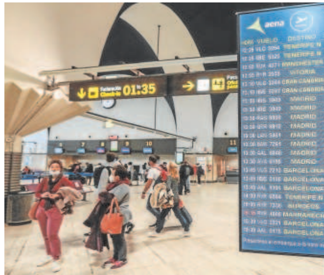
Movimiento en el aeropuerto de Sevilla

En cuanto a los días de más actividad, el 23 de diciembre, víspera de la Nochebuena hay 155 vuelos progra-