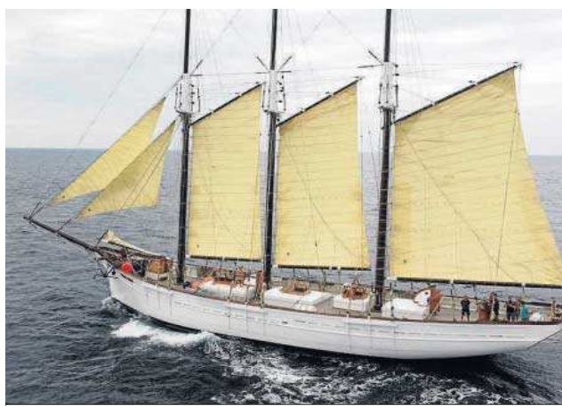
El pailebot 'Pascual Flores' también estará en el Muelle de las Delicias.

El barco llega además a Sevilla, convertido en el galeón de la ilusión, ya que actualmente alberga en una de sus cubiertas la exposición Lotería de Ida y Vuelta . Una muestra realizada por Loterías y Apuestas del Estado,