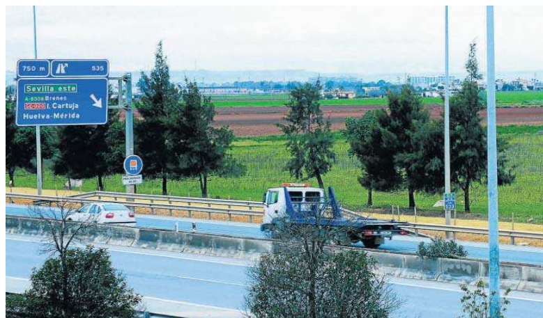
La conexión entre ambas carreteras servirá para enlazar con los futuros viarios de los terrenos de San Nicolás Oeste.

Con esta remodelación se podrán realizar todos los movimientos entre la autovía A-4 y la carre-