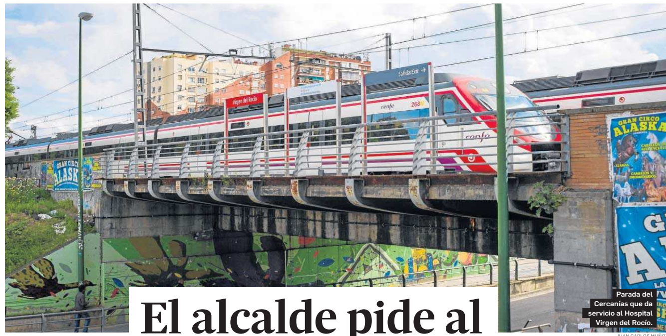
Parada del Cercanías que da servicio al Hospital Virgen del Rocío.

Distribuido para CONFEDERACIÓN DE EMPRESARIOS DE SEVILLA * Este artículo no puede distribuirse sin el consentimiento expreso del dueño de los derechos de autor.