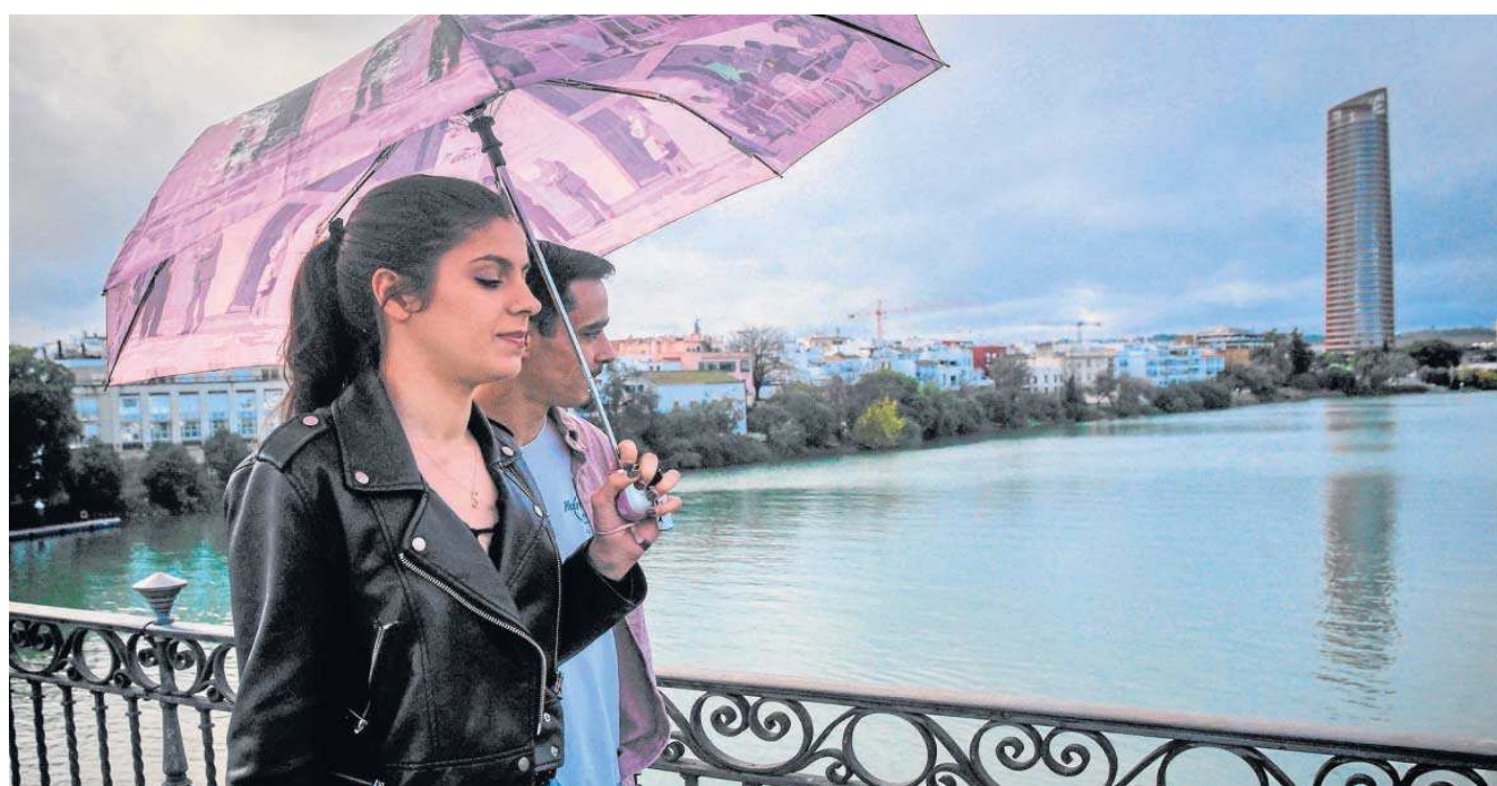
Estampa de lluvia en Sevilla a mediados de diciembre.

● Emasesa asegura que la alerta decretada por la sequía no puede levantarse porque las reservas de los pantanos están por debajo del nivel medio para esta época del año