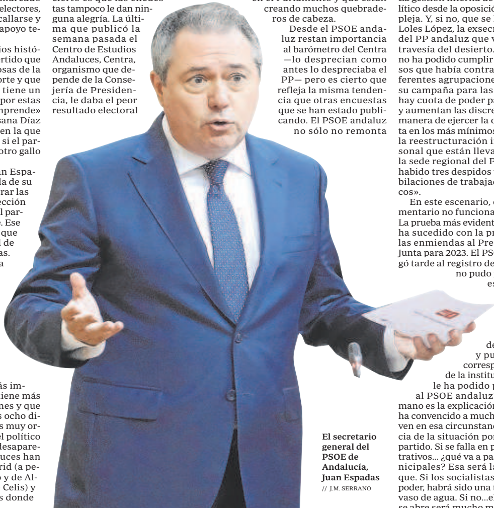
El secretario general del PSOE de Andalucía, Juan Espadas

Desde el PSOE andaluz restan importancia al barómetro del Centra —lo desprecian como antes lo despreciaba el PP— pero es cierto que refleja la misma tendencia que otras encuestas que se han estado publicando. El PSOE andaluz no sólo no remonta