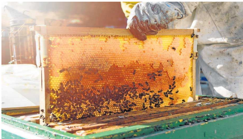
Recolección de miel de una colmena.