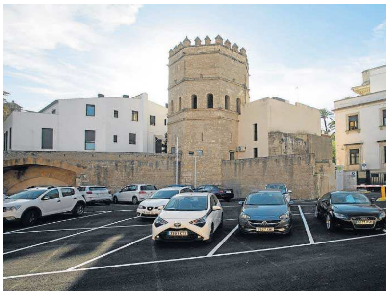
Coches aparcados ante la Torre de la Plata y la muralla islámica.

El objetivo municipal es dar forma a la parcela como una gran espacio libre que resalte el valor patrimonial de este entorno repleto de historia y que se pueda visitar la Torre de la Plata, la tercera en importancia de la ciudad que actualmente acoge unas oficinas. El planteamiento para llevarlo a buen puerto gira en torno