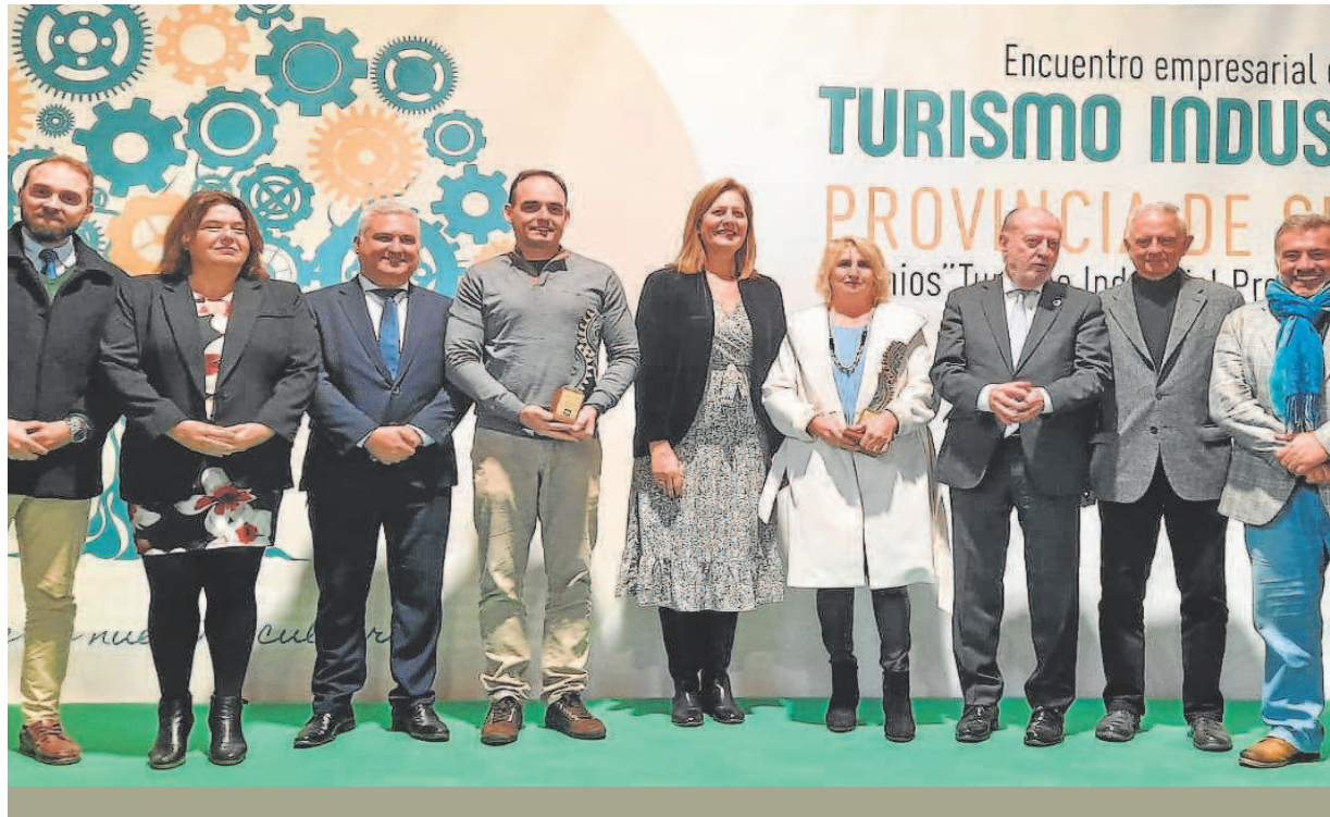
Foto de familia de los agasajados, junto con las autoridades políticas de la provincia, con el presidente de la Diputación de Sevilla al frente