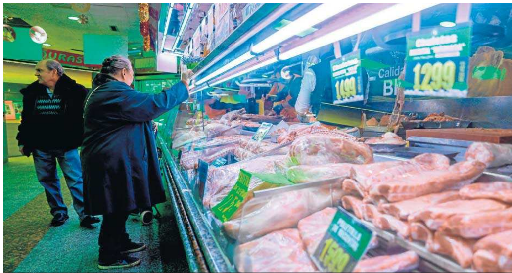
Puesto de carnes en un mercado de abastos.

Se trata de una las peticiones hechas desde Podemos, que también ha reclamado para este paquete de medidas un im-