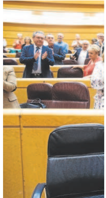
Pedro Sánchez y Yolanda Díaz

Pero la rebaja del IVA no conviene a la vicepresidenta segunda. La pasada semana fue clara cuando aseguró que solo servía para «ensanchar