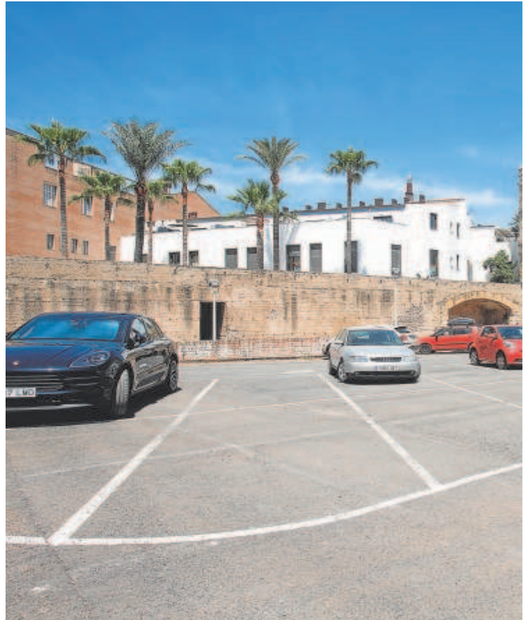
Aparcamiento de la Torre de la Plata, en pleno casco histórico de Sevilla