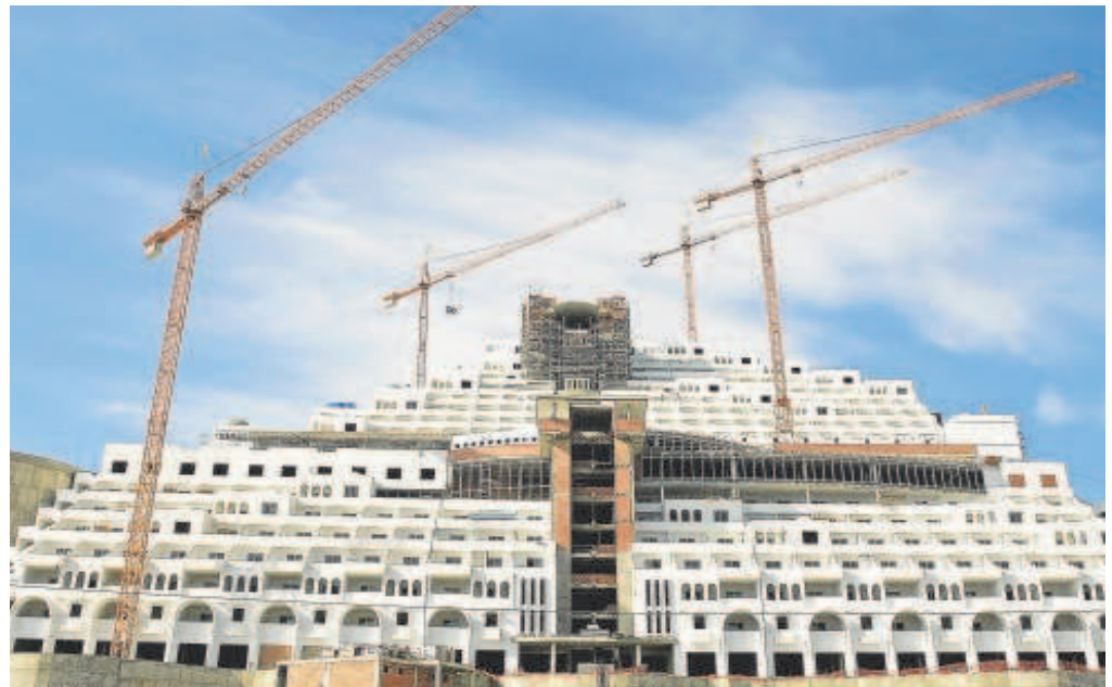
Hotel Algarrobico, construido en el Cabo de Gata, en Carboneras, Almería

«Dicho de otro modo, la demolición de lo edificado se opone frontalmente a la existencia de la licencia, como acto declarativo de derechos para el titular de la obra y que, tal y como indica la sentencia de instancia, supone un título jurídico válido que legitima las obras cuya demolición se pretende», traslada el Ayuntamiento para solicitar la desestimación del recurso.