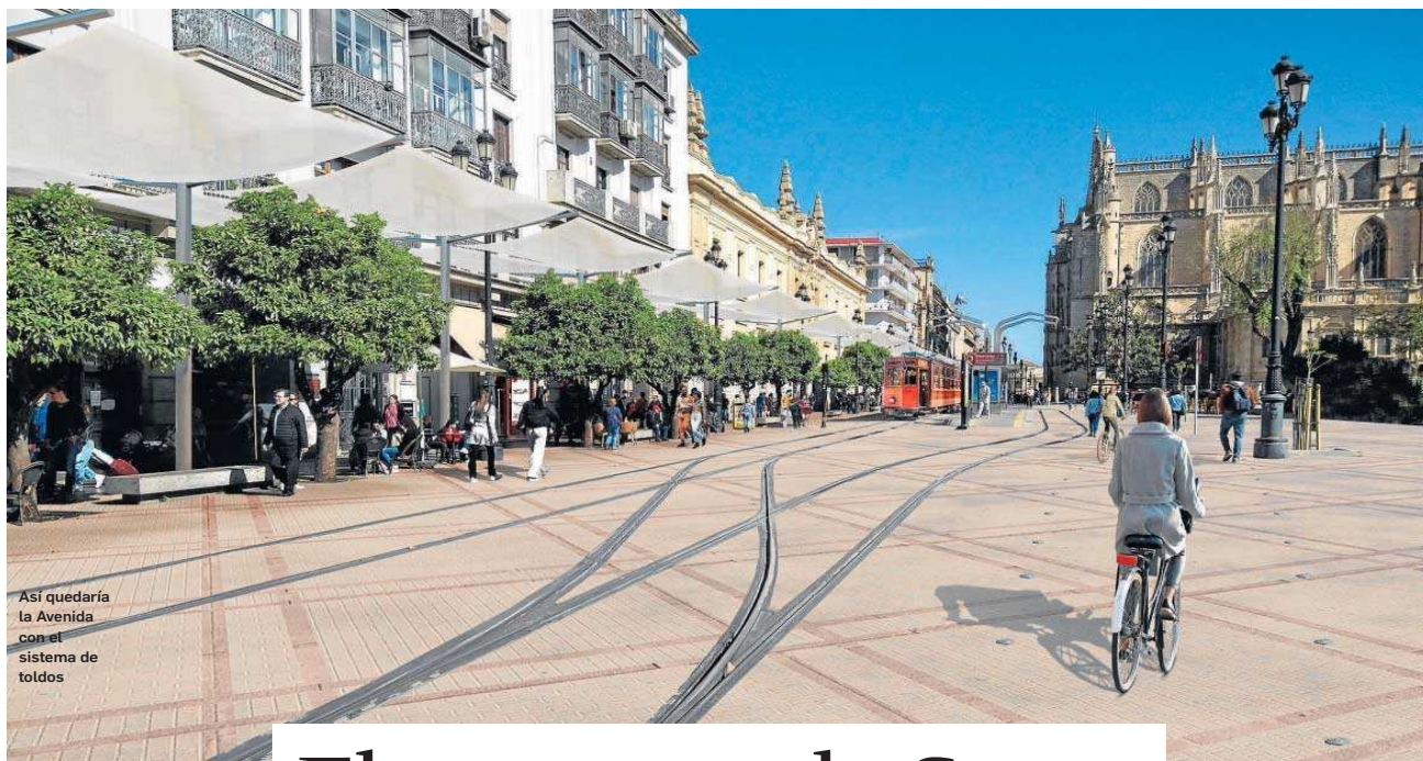
Así quedaría la Avenida con el sistema de toldos