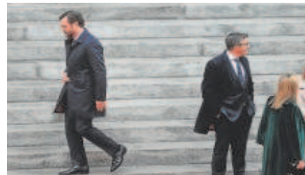
Iván Espinosa de los Monteros y Patxi López