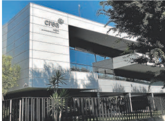
El CREA de San Jerónimo

En esta línea, el presidente del Gobierno de Aragón, Javier Lambán, afirmó ayer que la política contra la despoblación «queda muy desacreditada» al ganar la ciudad de Sevilla, y perder la de Teruel. «Nadie nos prometió la Agencia Espacial, pero cuando el Gobierno dijo que iba a descon-