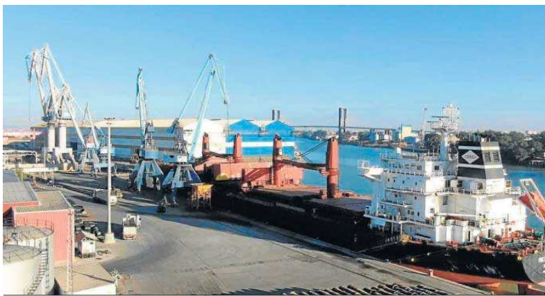
El buque ‘Mercurius’, en la terminal portuaria para la descarga.

En lo que llevamos de año el Puerto de Sevilla ha recibido 14 buques de grandes dimensiones, frente a los 3 de 2021. El más grande del año, según la eslora, fue el Lima Strait –188 metros–, que atracó en el mes de