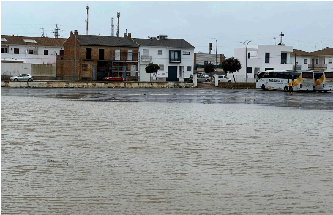
Inundaciones en Lepe.

Las lluvias que han marcado el inicio del puente festivo en Andalucía han dejado desde este lunes más de 70 litros por metro cuadrado en varios puntos de Huelva , según los datos consultados por EFE en la red Hidrosur de la Junta de Andalucía.