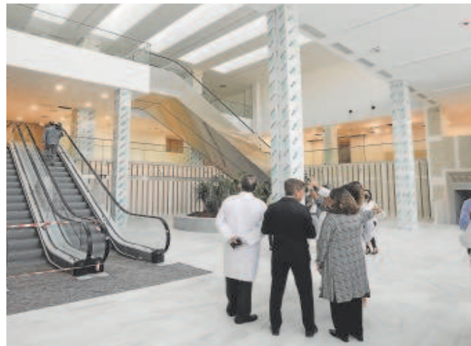
El Hospital Militar culmina en los próximos días sus últimas obras

Seguirá dependiendo administrativamente del Virgen del Rocío y ayudará a todos los hospitales públicos