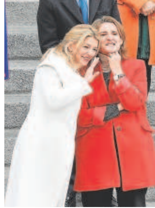
Yolanda Díaz y Teresa Ribera

que sea crispación y distancia entre Díaz y Podemos aleja cualquier posibilidad de reedición del Gobierno de coalición: la única opción de Pedro Sánchez para retener la Presidencia. Ayer, en el salón de los Pasos Perdidos del Congreso, en la celebración del día de la Constitución, se habló abiertamente de este asunto. En conversación informal con los periodistas, el equipo de Sumar admitió que están evaluando adelantar el anuncio de la candidatura de Yolanda Díaz como primer espada de Sumar. Es la fórmula para calmar la incertidumbre que rodea al proyecto y que Podemos utiliza para arremeter contra la vicepresidenta e intentar desgastarla. También explicaron que Díaz ayudará en las campañas de mayo donde la reclamen. No obstante, cuando se preguntó si sería en todas o solo en las que hubiera acuerdos de unidad entre Podemos e