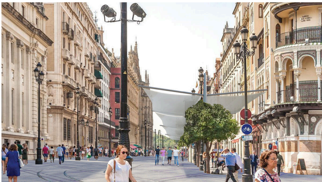
Otra perspectiva de la Avenida, según el proyecto del candidato José Luis Sanz.

Quizás las propuestas más llamativas sean las referidas al tranvía: Nuestro proyecto contempla la eliminación de una de las vías del tranvía en el tramo comprendido entre Plaza Nueva y el Archivo de Indias. Además la propuesta plantea la sustitución de los actuales vehículos del tranvía por otros que respondan a un modelo con menor impacto visual y de menor dimensión , así como más accesible. Respondiendo de forma más adecuada a lo que constituyó el motivo de su implantación que era facilitar el desplazamiento a las personas desde Puerta Jerez a Plaza Nueva, por lo que se implantará un vehículo que circulará a menos velocidad en este tramo y que su diseño sería deseable que permita, incluso, la subida y bajada del mismo en marcha . El objetivo de esta medida es claro: Con este cambio, conseguiremos liberar más espacio para el peatón y tener un vehículo con una imagen más adecuada al entorno y más integrado dimensional y materialmente al espacio por donde transita, en el que, incluso, la publicidad que pudiera portar, en su caso, no fagocite la imagen de los monumentos a su paso, debiendo quedar en un segundo plano casi subliminal. Este cambio no exigiría cambios en el trazado de la vía ni en el trayecto libre de catenarias que también se mantendría. Sí quedaría eliminado el doble sentido de circulación desde la parada del Archivo hasta la Plaza Nueva para que el peatón gane espacio.