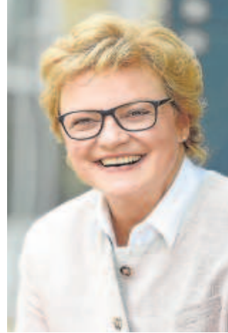
Monika Hohlmeier, presidenta de la Comisión de Control Presupuestario

Pero el plato fuerte del viaje estará en la reunión que mantendrán los eurodiputados con el director general del Plan y del Mecanismo de Recuperación y Resiliencia, Jorge Fabra Portela, y su antecesora en el cargo, Rocío Frutos Ibor: