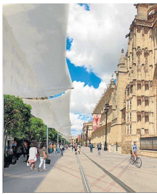
Otro fotomontaje que recrea el resultado del proyecto.

Sanz cree que la vocación de la Plaza Nueva sí es la de un “espacio ocupado” en contraposición a la Plaza de San Francisco como “espacio libre”. Por eso mantiene la tesis: “La Plaza Nueva debe ser el espacio de referencia para acoger los acontecimientos institucionales de la ciudad, referente de espacio colectivo conformado en el imaginario de todos los sevillanos con la que cuenta la Plaza Nueva. Junto a la recuperación del mármol cuyo abujardado no ha sido perdido (especialmente en su frente sur), se mejorará el mobiliario urbano generando una gran zona wifi gratuita en este punto neurálgico de la ciudad”. Ambiciona es la propuesta de aparcamiento soterrado en la Plaza Nueva: “Se eliminarán de la superficie los