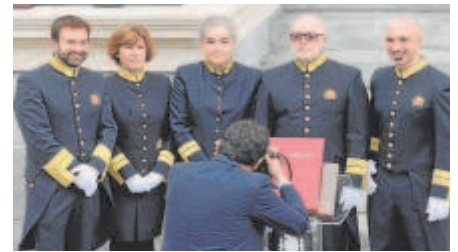
Ujieres del Congreso // J. GARCÍA