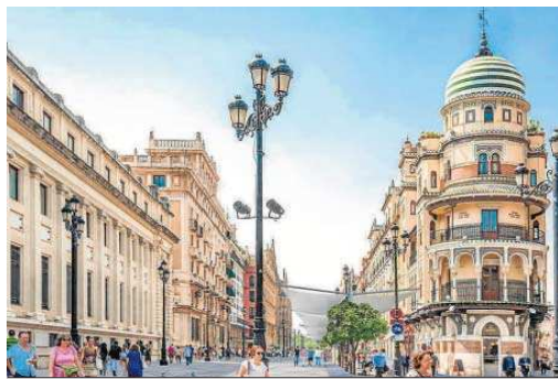
Así quedaría la acera con toldos de la Avenida.

Quizás las propuestas más llamativas sean las referidas al tranvía: “Nuestro proyecto contempla la eliminación de una de las vías del tranvía en el tramo comprendido entre Plaza Nueva y el Archi-