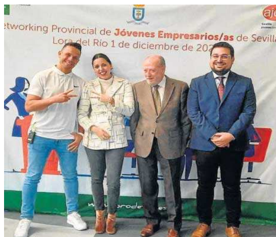
El presidente Villalobos durante la jornada de 'networking' en Lora del Río.

El objetivo de esta iniciativa es el de contribuir a la competitividad de la joven empresa de la provincia, al tiempo que se pretende generar un espacio de intercambio y de reuniones de trabajo entre empresarios de distintos sectores, tanto para la venta de sus pro-