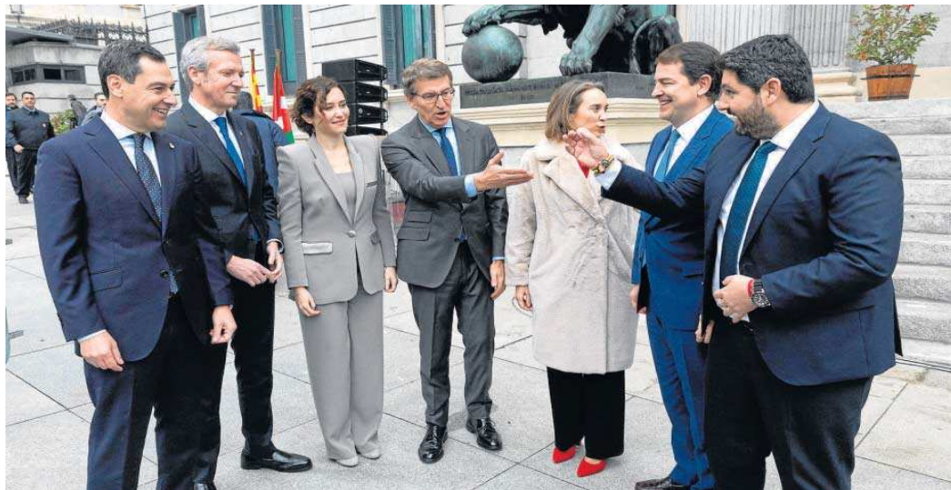
Juanma Moreno, Alfonso Rueda, Isabel Díaz Ayuso, Alberto Núñez Feijóo, Cuca Gamarra, Alfonso Fernández Mañueco y Fernando López Miras, ayer.