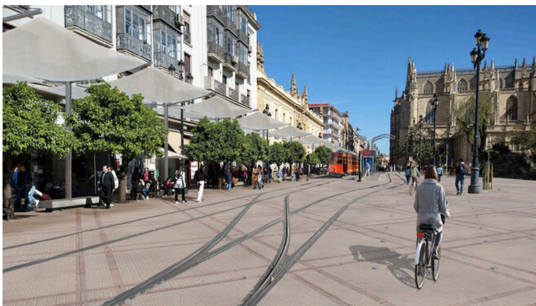
Así quedaría la Avenida de la Constitución que plantea el candidato José Luis Sanz. / M. G. (Sevilla)

Un único raíl para la ida y la vuelta en el trayecto del tranvía entre la Plaza Nueva y el Archivo, vehículos más pequeños y menos agresivos con el paisaje que circulen a una velocidad que permitan subirse o bajarse en marcha en ese tramo del recorrido y un parking para motos en la Plaza Nueva aprovechando la obra del Metro efectuada en los años ochenta. Un IBI especialmente reducido para viviendas del centro con residentes empadronados, oficinas de negocios y comercios tradicionales debidamente censados como medidas para evitar la fuga de sevillanos de la zona monumental. El candidato del PP a la Alcaldía, el senador José Luis Sanz , apuesta por descongestionar la Avenida y tiene claro que el peatón debe recuperar el espacio perdido en esta arteria principal de la ciudad invadida por los veladores, los mupis , los patinetes, las bicicletas y el propio Metrocentro. Por supuesto, el cabeza de lista del PP a las próximas municipales tiene diseñado el sistema de toldos que se podrá instalar después de cada Semana Santa si se tiene en cuenta el espacio que quedará libre al suprimir un raíl. En su agenda de promesas figuran ya medidas fiscales para compensar a los vecinos del centro las molestias de un turismo excesivo y procurar un equilibrio deseable entre residentes y visitantes.