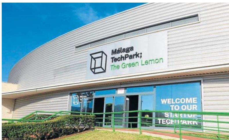
El parque tecnológico de Málaga, 'Málaga Techpark'.

En lo que respecta a los puestos de trabajo generados supusieron un 1,81 por ciento del total regional, la contribución en la provincia alcanzó el 9,14 por ciento del total y en términos de la ciudad