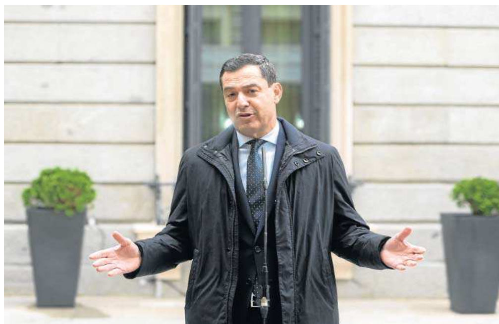
Juanma Moreno en los exteriores del Congreso de los Diputados, ayer, en Madrid.

Durante los actos con motivo del Día de la Constitución en el Congreso de los Diputados en Madrid, Moreno reiteró la "satisfacción" del Gobierno andaluz por la designación de Sevilla –que "reúne todos los requisitos", apostilló–, al tiempo que insistió en "lamentar