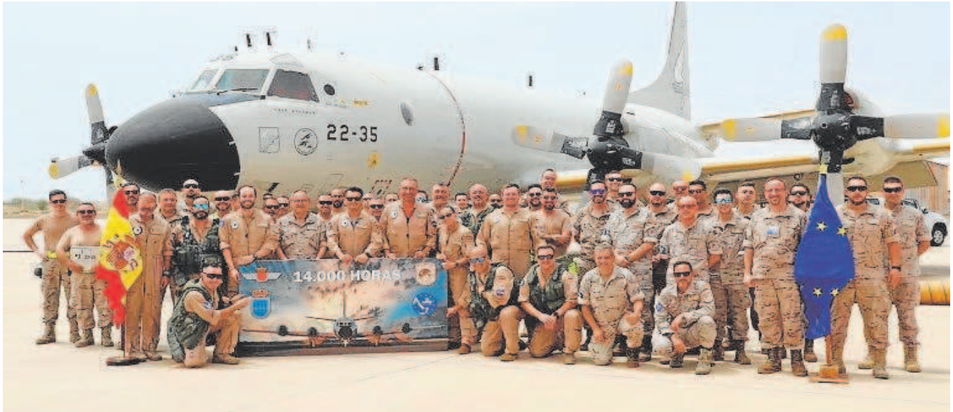
El pasado mes de julio se celebró las 14.000 horas de vuelo en el Índico de la veterana aeronave