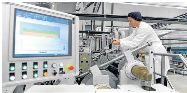
Las sociedades más grandes son las que más se han beneficiado.

Hasta ahora, la comunidad andaluza es la región española que más dinero tiene asignado (3.800 millones de euros). Sin