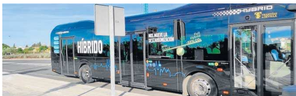
El autobús híbrido en pruebas en el Aljarafe.