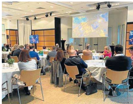
Uno de los actos de promoción de Sevilla en la feria de Cannes.

Durante dicho evento, el destino Sevilla proyectó un vídeo con