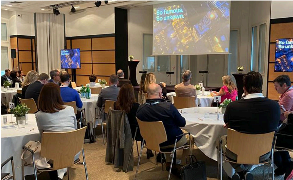
La acción promocional en Cannes. Ayto

El Ayuntamiento, a través de Sevilla City Office, adscrita a la empresa municipal Congresos y Turismo de Sevilla, está promocionando la ciudad como destino premium y de lujo en la mayor feria de turismo y viajes de lujo de Europa, la Internacional Travel Luxury Market (ITLM), que se celebra en Cannes.