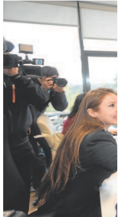
La ministra Diana Morant saluda a una trabajadora del edificio CREA durante su visita a la futura sede de la Agencia Espacial Española

Por ello en los próximos meses se va a poner en marcha una estrategia que incluye la configuración de un hub de impulso y dinamización del sector del espacio que funcione como una oficina de coordinación, de apoyo a iniciativas y de captación de proyectos. El objetivo es presentar su estructura y contenidos en marzo de 2023, y que el hub esté en funcionamiento durante el año 2023, coinci-