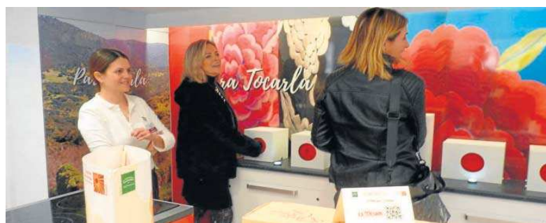
Detalle de una de las visitas de la promoción.

puede tocar, la provincia que se siente, sus aromas, sus sabores... Todo eso que la hace única e inolvidable", explica el presidente.