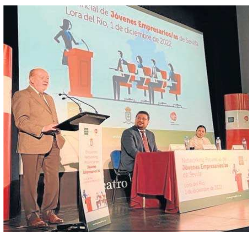
El presidente de la Diputación, Fernando Rodríguez Villalobos.

Como complemento a este encuentro, ha tenido lugar la ponencia 'Yo pude, tú puedes', impartida por Sergio López, más conocido por su nombre artístico Haze, cantante rapero y profesor funcionario de Lengua y Literatura española, natural de Sevilla, del barrio