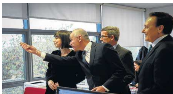
Otra instantánea del alcalde señalando la cercanía del río.