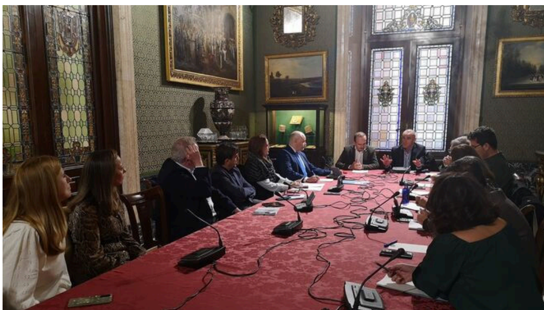
Propuesta municipal para impulsar un hub de economía social dentro del proyecto de Hytasa / M. G.

El alcalde de Sevilla, Antonio Muñoz , ha planteado a la Federación Andaluza de Empresas Cooperativas de Trabajo ( Faecta-Sevilla ) avanzar en el convenio de colaboración que firmó el pasado junio con el Ayuntamiento y concretar en las próximas semanas iniciativas que contribuyan a impulsar el protagonismo de las cooperativas en el cambio del modelo productivo y, en consecuencia, a reforzar la diversificación de la economía y el emprendimiento. Entre estas, el regidor hispalense ha analizado con ellas la propuesta de crear un hub de cooperativas aprovechando el ambicioso proyecto residencial, empresarial y con espacios libres y equipamientos en las fincas de titularidad pública de la antigua Hytasa , desbloqueado recientemente tras un acuerdo con el Ministerio de Hacienda.