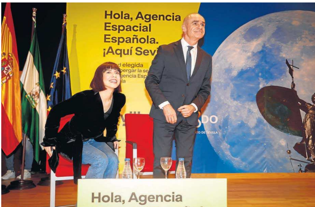
La ministra de Ciencia, Diana Morant, junto al alcalde de Sevilla, Antonio Muñoz, en la visita ayer al edificio CREA de San Jerónimo.

La ministra elogió el liderazgo del alcalde de Sevilla, Antonio Muñoz, al frente de la candidatura de la capital para acoger este organismo estatal e involucrarse “como ninguna otra ciudad”. “Quiero felicitarte por tu lidera-