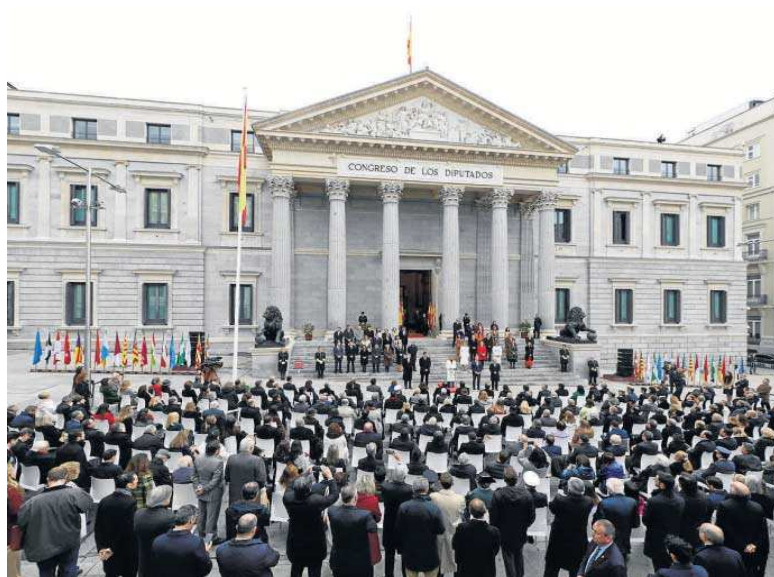
Vista del Congreso durante el acto institucional de celebración del Día de la Constitución.

Lo cierto es que aprobados los Presupuestos Generales de 2023 en el Congreso y aprobada la proposición de ley que re-