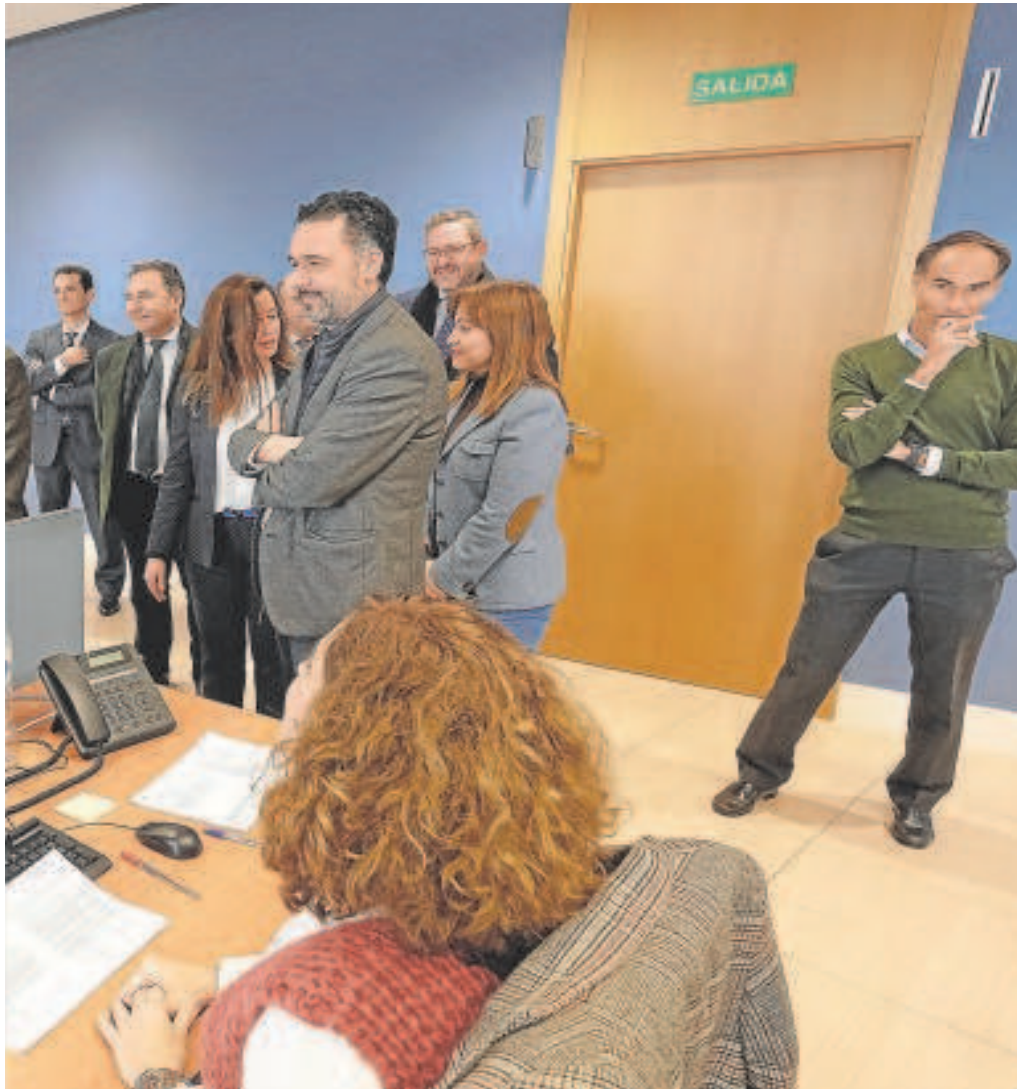
trabajadores públicos

Administración Pública de la Consejería de Justicia, Administración Local y Función Pública, implica también la implementación de cambios internos que faciliten esa agilización de los trámites y su correspondiente accesibilidad mediante la Red.