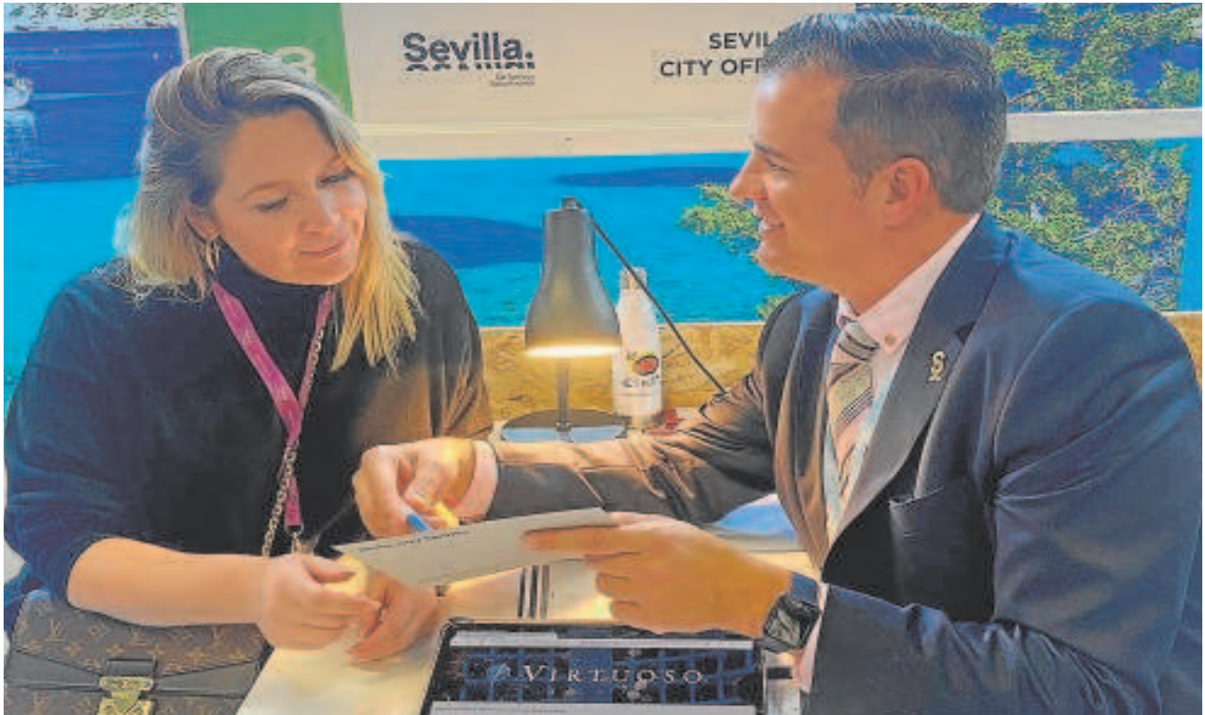
La marca Sevilla protagonizó el evento de EMEA Virtuoso Forum, líder en viajes de este segmento