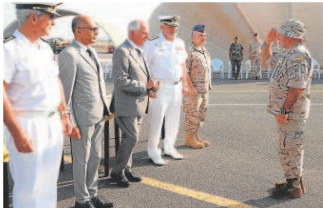
El comandante de la operación saluda a las autoridades.

Desde la oficina de comunicación de la Operación Atalanta destacaban hace unos días el papel desempeñado