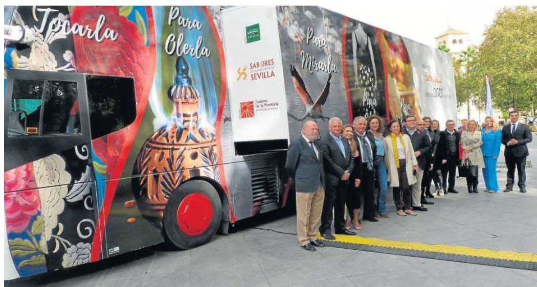
Foto de familia, junto al presidente de la Diputación de Sevilla, Fernando Rodríguez Villalobos, al lado del autobús promocional.

"En este mercado de cercanía, el andaluz, y en fechas navideñas reforzamos la promoción de los recursos naturales, culturales y gastronómicos del territorio apelando a la experiencia a través de los cinco sentidos". De esta forma, el autobús tematizado con imágenes de gran tamaño, expone en su interior una muestra de las riquezas turísticas de la provincia agrupadas según el sentido por el que se pueda percibir: la vista, el tacto, el oído, el olfato y el gusto o sabor. "La Sevilla que se