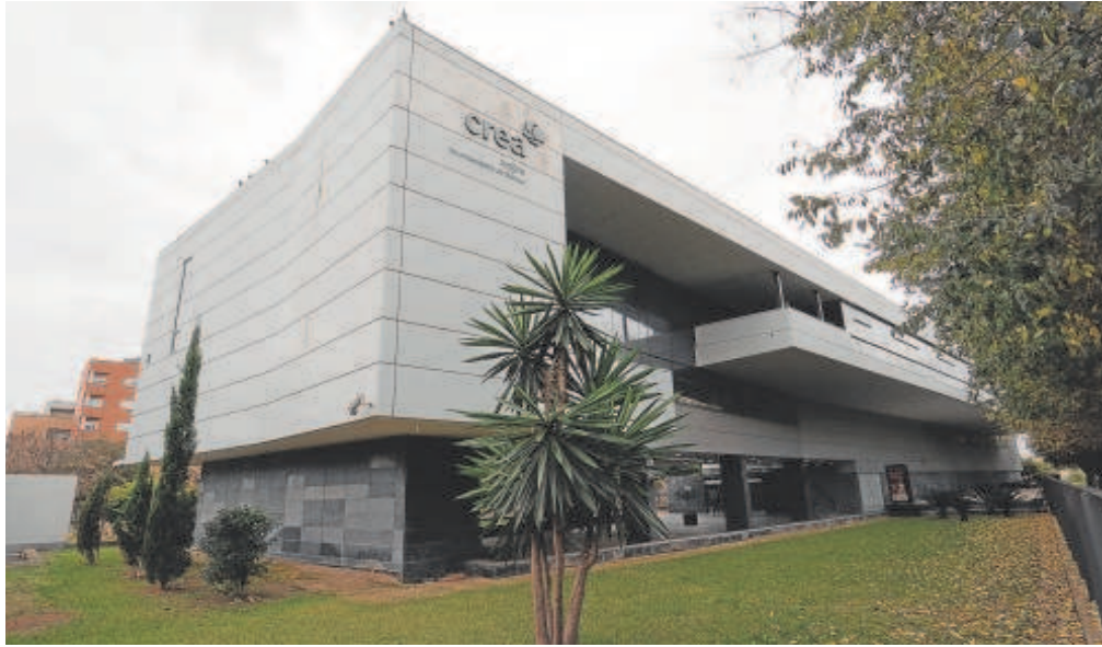
Edificio del CREA, en San Jerónimo, donde se instalará la Agencia Espacial // EP