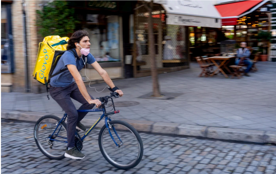
Un rider.

España ha liderado el bloque de diez países que este jueves ha bloqueado el acuerdo sobre una 'ley Rider' europea por considerar que el marco común para los trabajadores de plataformas que recogía la última propuesta para el acuerdo a 27 suponía una reducción de los derechos laborales.