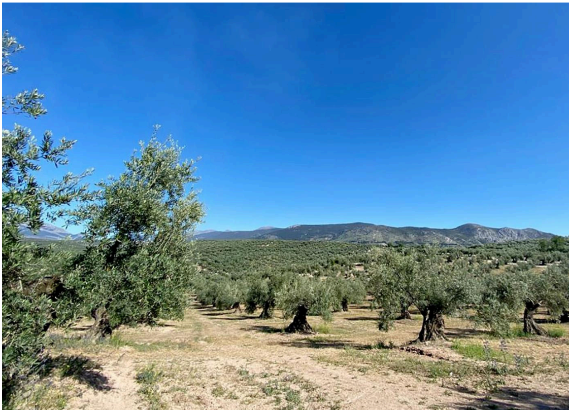
Campo de olivos. UJA

El sindicato provincial de Industria, Construcción y Agro de UGT Sevilla (UGT-FICA Sevilla) ha expresado este miércoles su "rechazo total" a las manifestaciones tanto de la patronal Asaja Sevilla como del sindicato CCOO Industria Sevilla en relación a las negociaciones en torno al convenio del campo. En una nota de prensa, UGT Sevilla ha asegurado que "es falso que no tuvimos voluntad de negociar, que hayamos eludido nuestra responsabilidad, que hayamos rechazado posibilidad de acuerdo y que hayamos torpedeado la negociación".