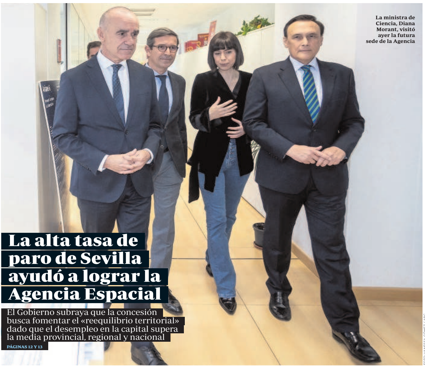
La ministra de Ciencia, Diana Morant, visitó ayer la futura sede de la Agencia