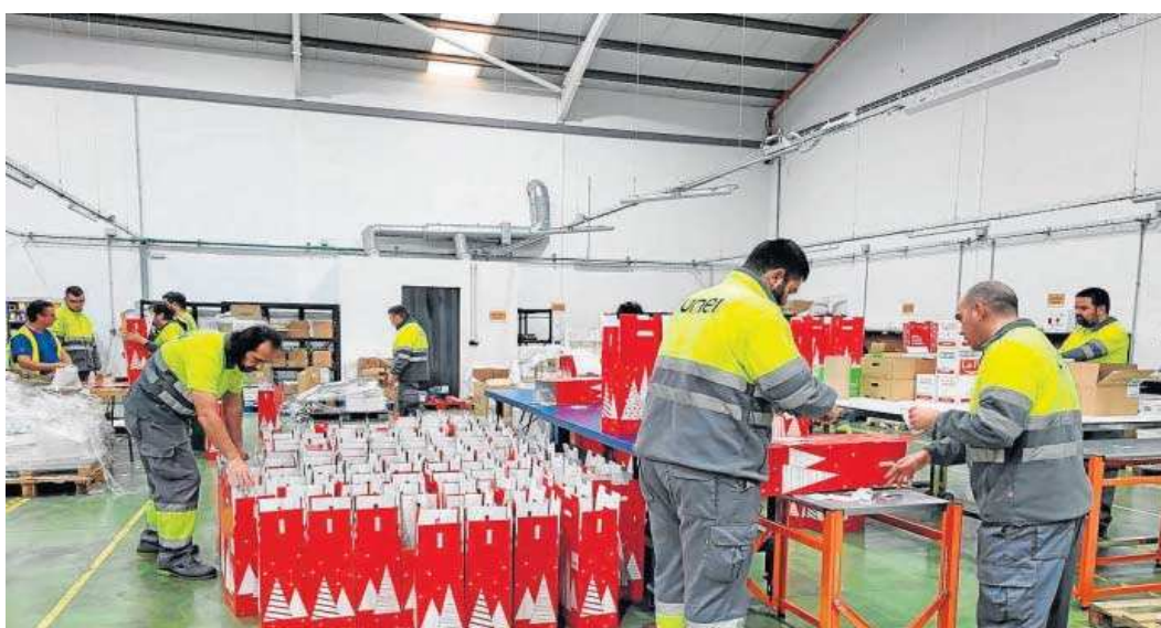
La empresa da trabajo a más de 1.000 personas discapacitadas.

● La empresa social andaluza sumará 3.000 metros cuadrados de almacenamiento para responder a los picos de demanda