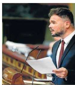
Gabriel Rufián en el Congreso.

tado actualmente, el delito de malversación no diferencia entre las personas que se lucran personalmente del crimen y las que no y establece condenas de entre dos a seis años de cárcel para quien cometa esta infracción. Con esta propuesta de ERC, habría una distinción entre los que se lucran personalmente de este delito, y la pena de cárcel oscilaría para los que saquen un beneficio propio.