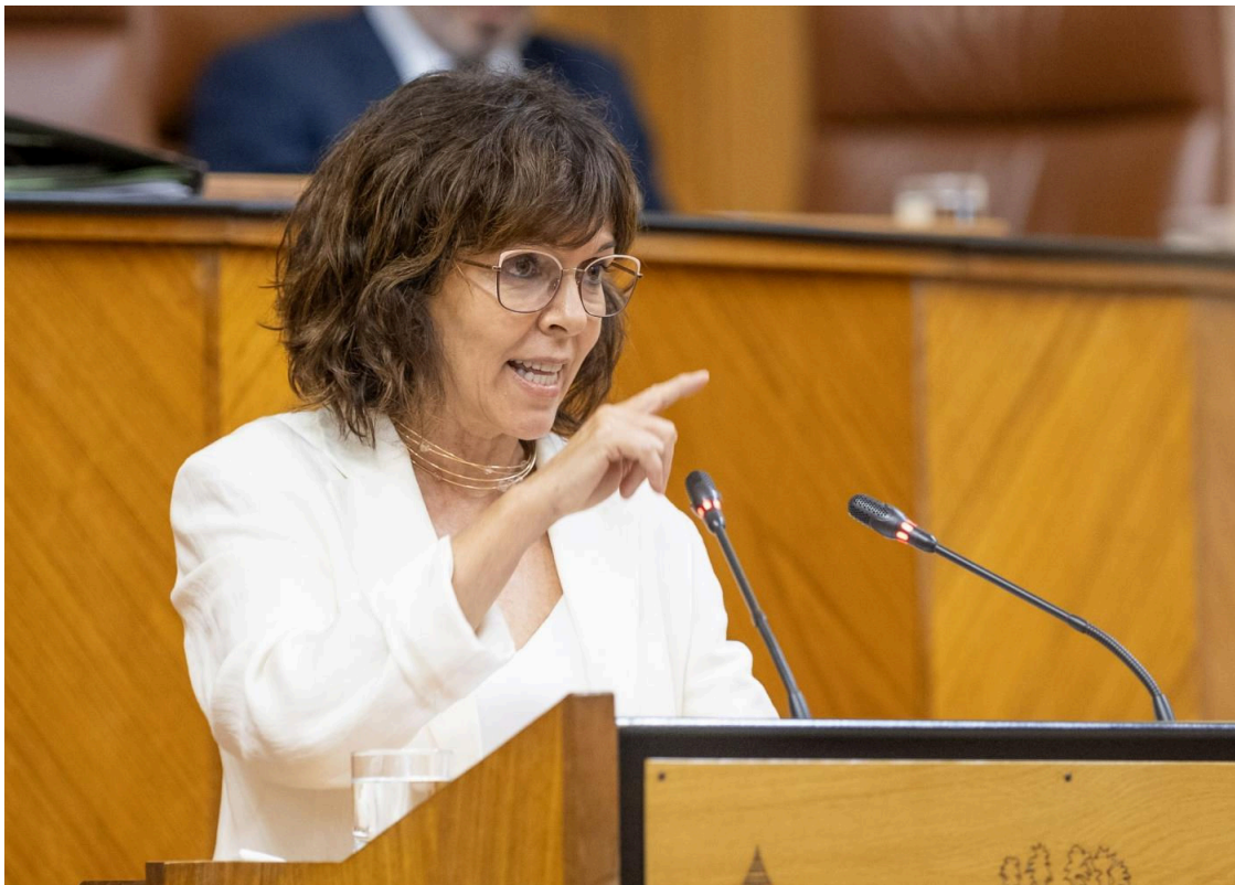
La parlamentaria del PSOE-A Ángeles Prieto, en una foto de archivo.