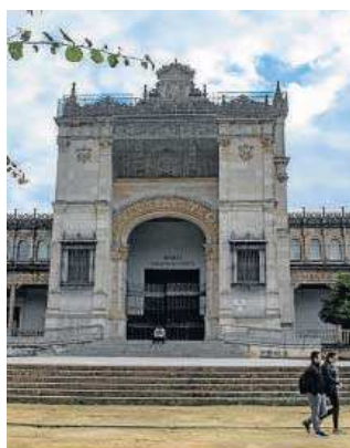
JUAN CARLOS VÁZQUEZ Fachada del Museo Arqueológico.

Esta licencia es posible después de que la Comisión Provincial de Patrimonio Histórico de la Junta de Andalucía emitiera a principios de diciembre su informe favorable a la rehabilitación, condición sine qua non para que la Gerencia pudiera pronunciarse al respecto. “De hecho, se ha acelerado al máximo el trabajo en el seno de este organismo mu-