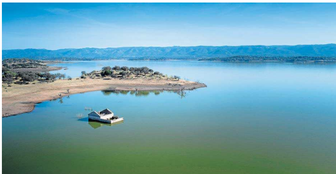
El pantano de Melonares en septiembre pasado. ANTONIO PIZARRO