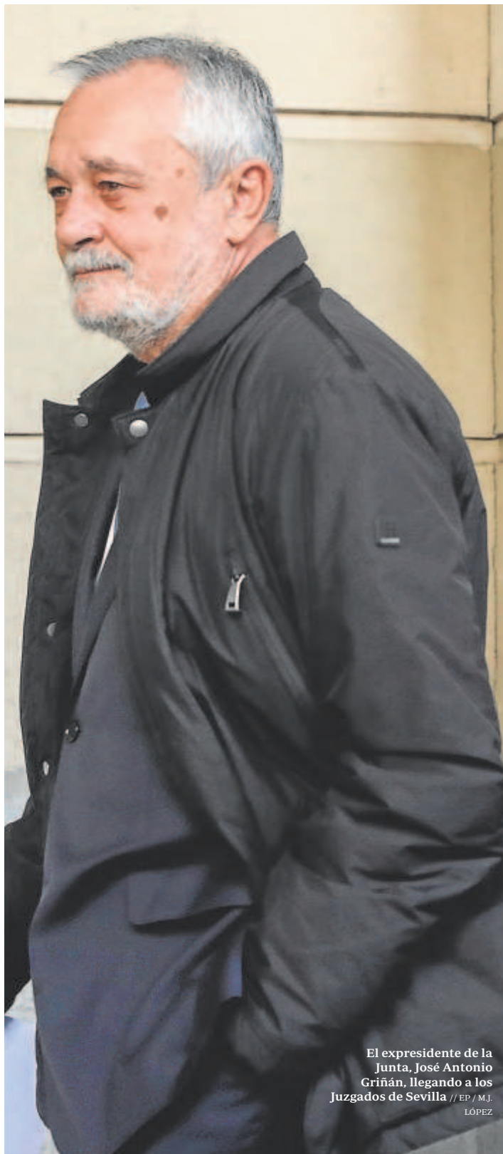
El expresidente de la Junta, José Antonio Griñán, llegando a los Juzgados de Sevilla