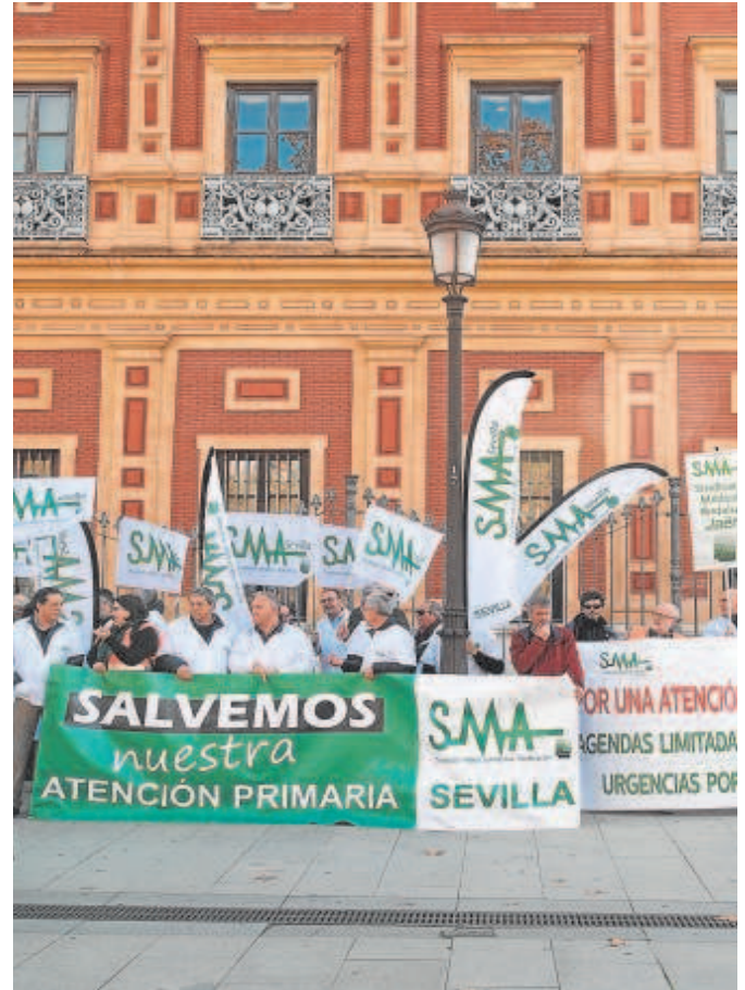
Concentración del Sindicato Andaluz en el Palacio de San Telmo

en conversaciones con la Consejería de Salud para intentar solventar la situación actual.