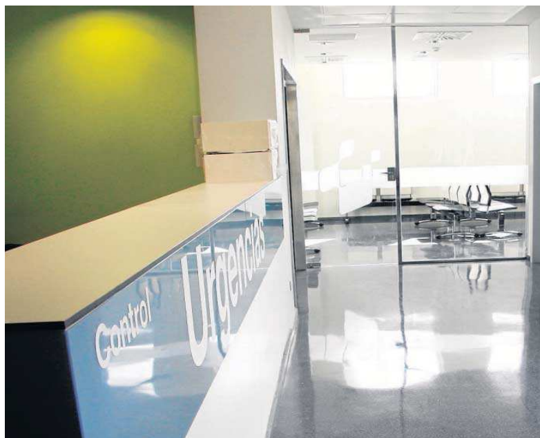
Control de Urgencias en el centro privado.

Tras atender a esta mujer que se encontraba ingresada en planta, el médico regresó a su puesto en Urgencias cuando recibió una llamada alertándole de que los familiares “le iban a matar”. En ese instante el doctor subió de nuevo a la habita-