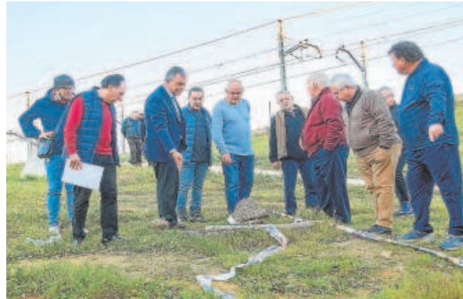
El candidato del PP a la Alcaldía en el barrio de Su Eminencia