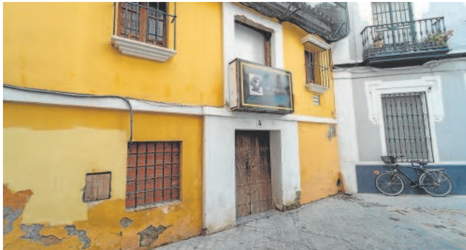
La rehabilitación de la casa natal de Velázquez culminará en febrero y a partir de ahí comenzará su musealización