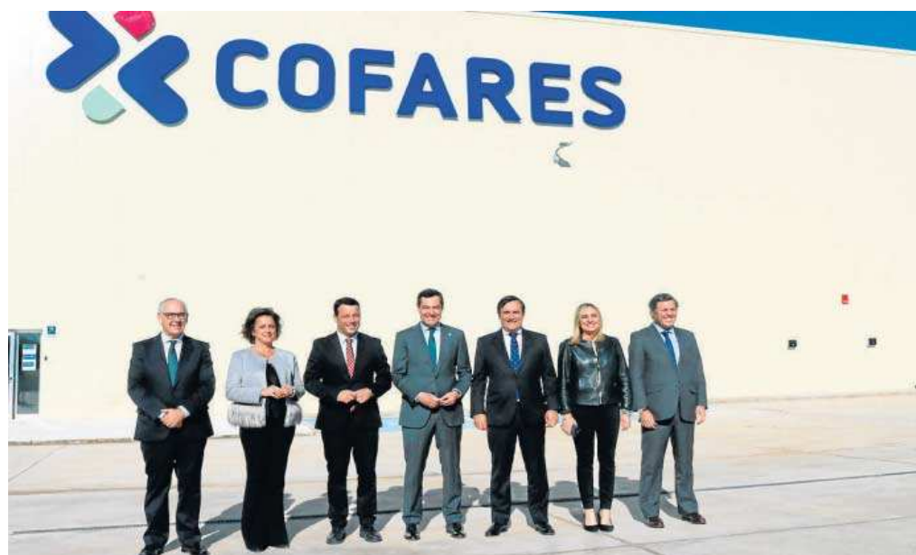
Juanma Moreno junto al resto de representantes institucionales, ayer durante la inauguración del nuevo centro. M. G.

Este almacén, ubicado en el polígono industrial Los Rubiales II, ha sido construido sobre una superficie total de 10.529 metros cuadrados. El centro tiene una capacidad de reparto de más de 19.500 referencias de medicamentos y otros productos de sa-