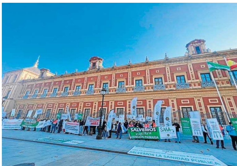
Delegados del Sindicato Médico Andaluz protestan en el Palacio de San Telmo en Sevilla.

Para evitarla, los médicos exigen implementar medidas efica-