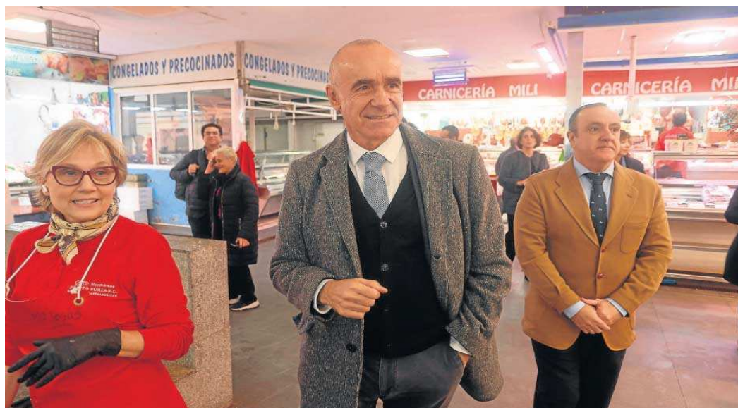
El alcalde de Sevilla, Antonio Muñoz, durante su visita al mercado de abastos Las Palmeritas.