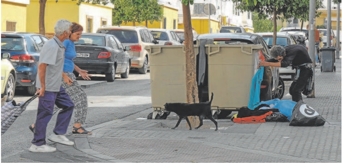
Dos personas pasean con un carro de la compra por uno de los barrios más pobres de España, Los Pajaritos, en Sevilla