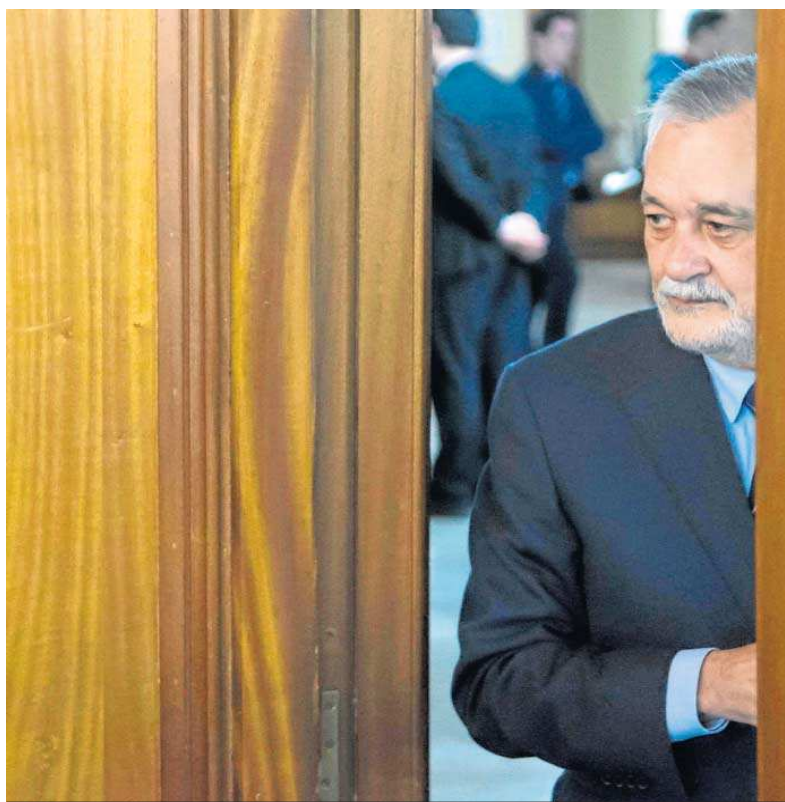
José Antonio Griñán, en la Audiencia de Sevilla.

El informe forense, que se elaboró sin disponer de esa información de los servicios médicos de la cárcel de Sevilla, señalaba que, tras la entrevista personal con el