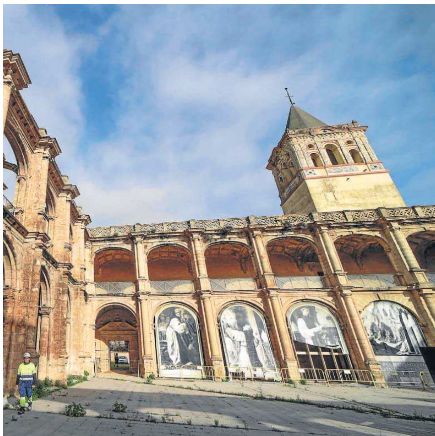
El fabuloso claustro del monasterio de San Jerónimo de Buenavista, una joya renacentista.