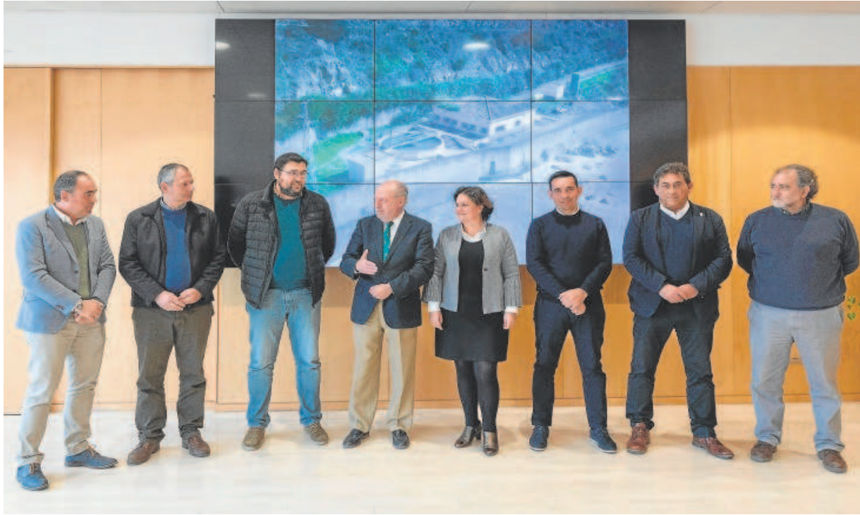
El presidente de la Diputación de Sevilla junto a los alcaldes de municipios pequeños beneficiados con seis millones de euros