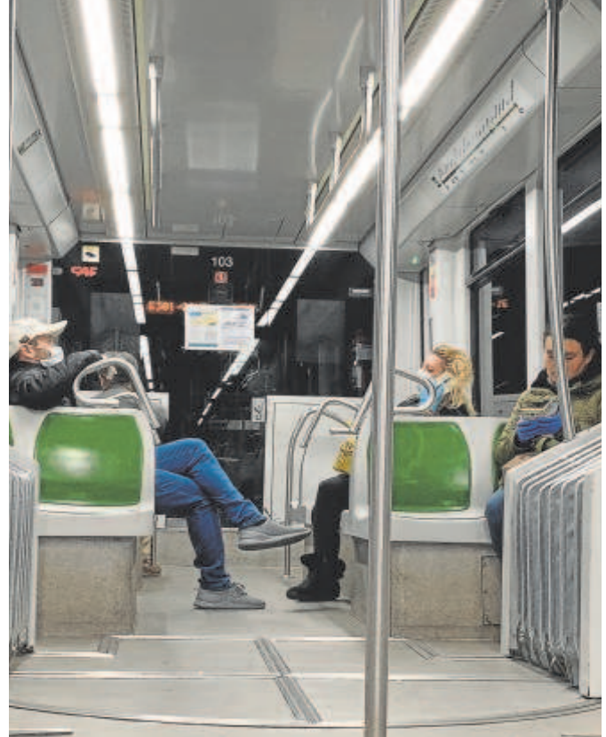
Viajeros en la línea 1 del Metro de Sevilla

El convenio de la línea 3 se volverá a tratar en La Moncloa tras haberlo hecho el 29 de noviembre de 2022