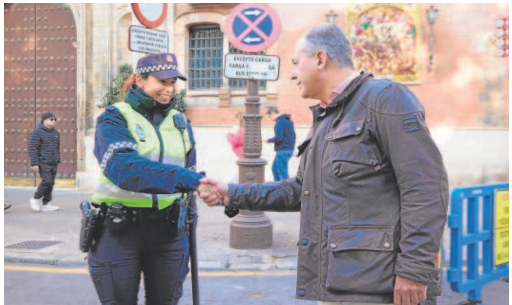
José Luis Sanz saluda a una policía local de Sevilla

Las críticas del candidato popular van dirigidas también a los responsables del cuerpo, a los que culpa de una mala gestión. «La Policía Local está mal dirigida, no es lógico que haya material anti-trauma en los almacenes del estadio olímpico guardado desde hace más de un año; no es normal que la unidad de intervención nocturna cuente solo con cuatro patrulleros para toda Sevilla los días entre semana o que haya casi 400 vacantes sin cubrir». Además, anuncia que volverá a rediseñar la plantilla con una nueva relación de puestos de trabajo (RPT); una tarea nada fácil en la que el actual Gobierno dedicó varios años hasta aprobar la que está actualmente vigente en 2017. Los sindicatos han denunciado que esa RPT se ha quedado obsoleta.