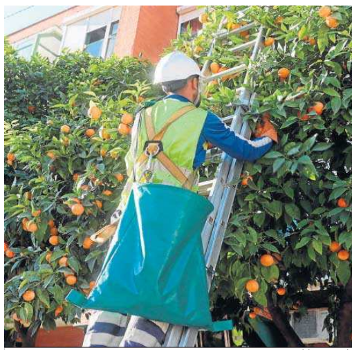
Recogida de naranjas en las calles de Sevilla.

tomacal. Las infusiones de estas flores son carminativas y también sedantes. Además, la esencia de azahar es buen antiespasmódico y tiene un uso alimentario. Así, del gozo estético de los Jardines del Real Alcázar se pasó a la conciencia urbana y, a partir de 1929, con motivo de la Exposición Iberoamericana, y, especialmente, en la década de los años 60 y 70, el naranjo dejó los jardines y las huertas para asentarse en las calles y convertirse en el árbol urbano por excelencia.