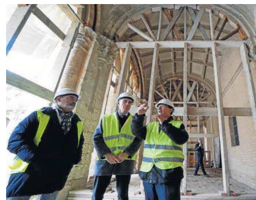
El alcalde durante la visita al monasterio.

En 1823 se autorizó a los jerónimos a reintegrarse a sus conventos y recuperar sus enseres en depósito. La destrucción de la iglesia era tal que no fue posible su reutilización. Se reincorporaron unos pocos frailes, y aún éstos, no tardarían en solicitar dispensas por razones diversas. “En tales condiciones se produce la definitiva extinción de la orden en 1835, tras la