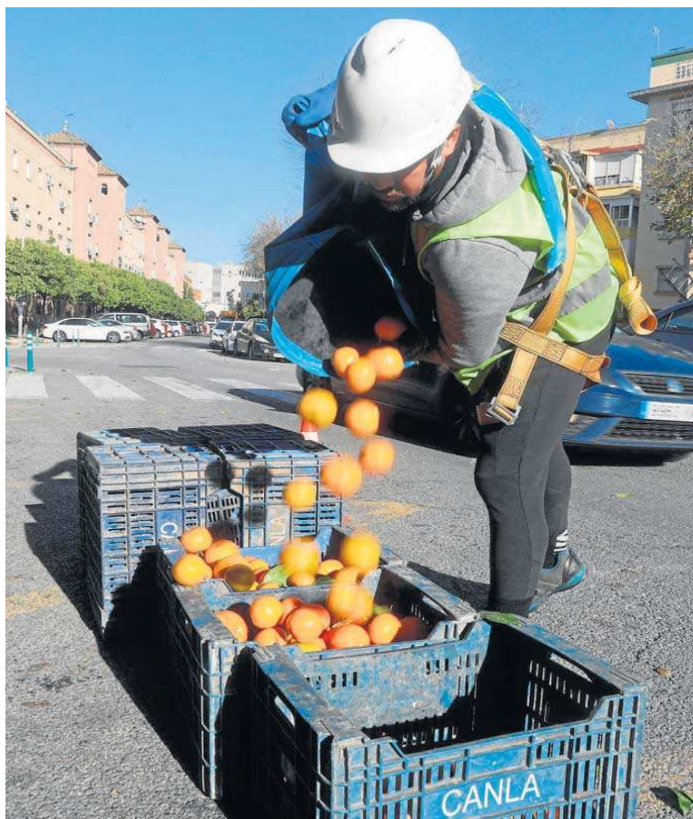
Un operario deposita las naranjas amargas en cajas para su posterior provecho.