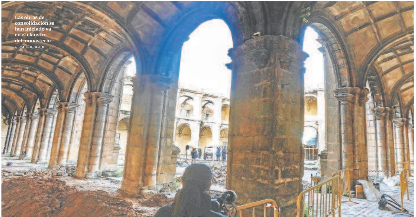
Las obras de consolidación se han iniciado ya en el claustro del monasterio // RAÚL DOBLADO