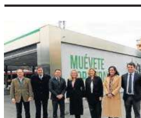
Carazo en Puerta de Jerez. M. G.

El inicio de las obras del ramal técnico de la línea 3 será finalmente en febrero, no en enero