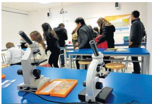
Alumnos del Liceo Francés en el laboratorio que posee este colegio.

En este sentido, el Liceo Francés Internacional de Sevilla, centro organizador de este encuentro 2023 junto a la dirección ge-