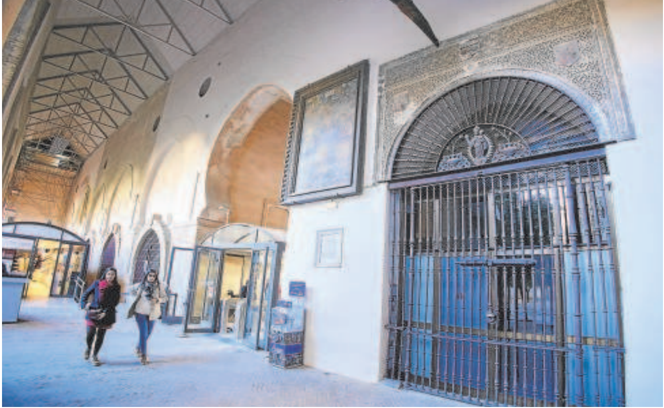
Dos personas pasean por la Nave del Lagarto en el Patio de los Naranjos