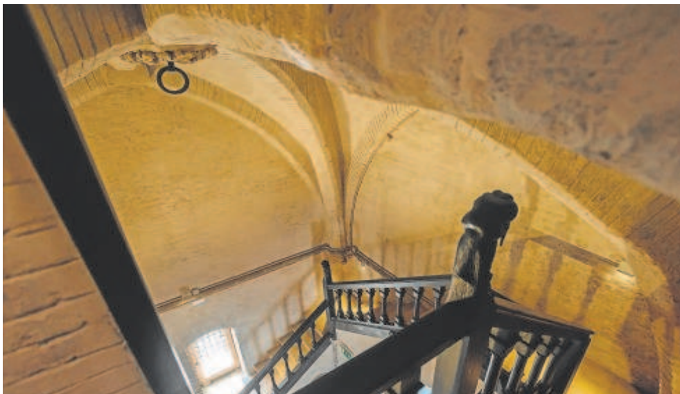
La Torre de don Fadrique, la cual forma parte del conjunto del convento de Santa Clara