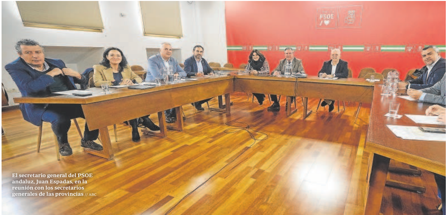
El secretario general del PSOE andaluz, Juan Espadas, en la reunión con los secretarios generales de las provincias