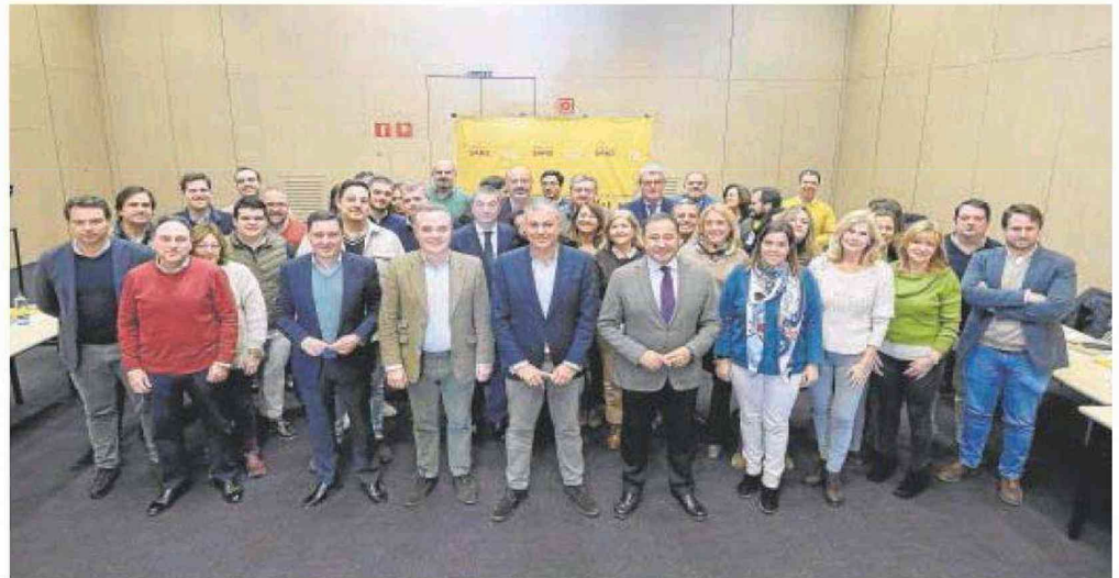
Foto de familia del equipo de campaña del candidato del PP a la Alcaldía de Sevilla, José Luis Sanz

«Hay que estar muy pendiente, sobre todo a partir del 3 de abril, del uso que pueda hacer el alcalde como candidato socialista de las instituciones. No podrá hacer inauguraciones, principalmente porque después de 8 años de gestión no tienen nada que inaugurar, pero habrá que estar pendientes de las presentaciones o anuncios que pretenda hacer el alcalde de Sevilla», recordó José Luis Sanz, quien puntualizó que «lo hemos comentado en la reunión, como va a poder presentar muy poca gestión lo que intentará es hacerse en este periodo muchas fotos, pero con fotos no se pueden ganar unas elecciones, sino con trabajo y estando en el día a día. Muñoz presentará muchas fotos pero poca gestión».