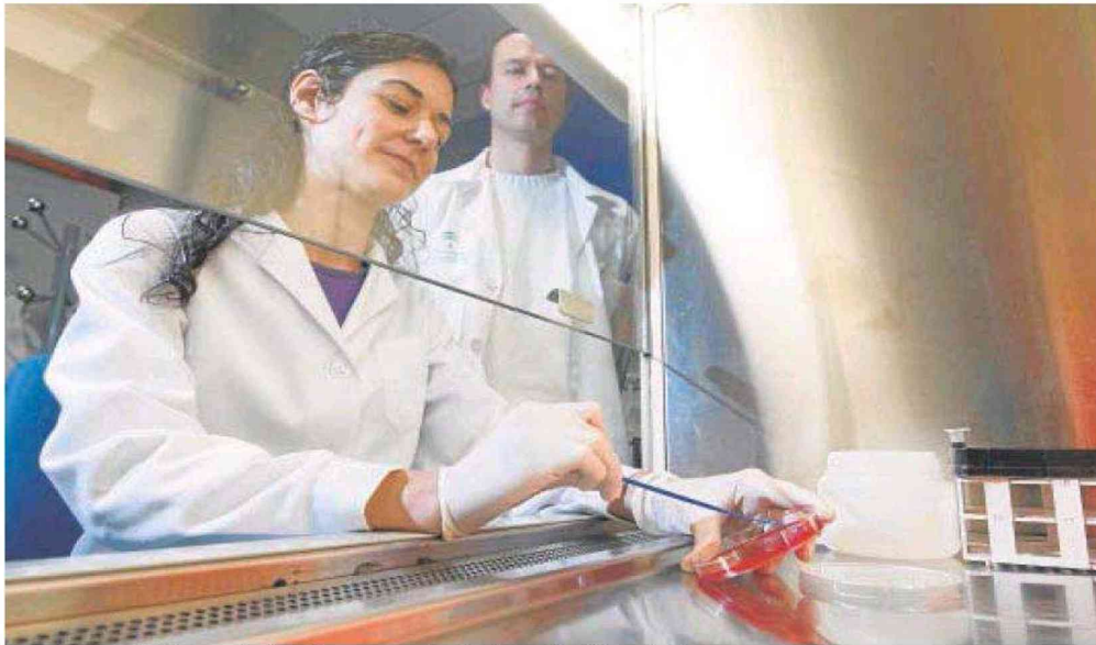
Las empresas de biotecnología piden que los fondos de capital riesgo inviertan en ese sector // ABC