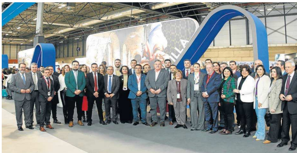
El presidente de la Diputación en el stand de la Provincia de Sevilla en FITUR 2023, este pasado miércoles.

El presidente del organismo provincial ha afirmado que Sevilla "vuelve a ser uno de las grandes referentes de Fitur", y ha recordado que con esta cita de Madrid arrancan las misiones comerciales que se realizan por parte de Prodetur durante el año, "porque conseguir que el turismo de calidad llegue a nuestra provincia es un reto de enero a diciembre, y es objetivo por el que trabajamos de forma conjunta empresas y administraciones". Además, ha puesto el foco en que "mientras desde Europa y distintos organismos nos piden que seamos sostenibles y trabajemos en los objetivos del milenio, en la Diputación de Sevilla es un camino que hemos empezado a recorrer hace ya varios años, y podemos presumir de te-