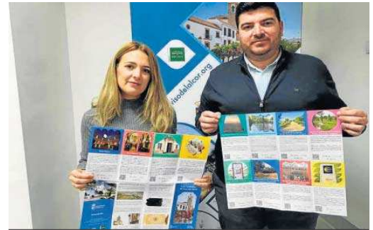
Pose y detalle de la cartelería informativa.

Además, no sólo habrá en Madrid folletos turísticos, sino también material fotográfico y audiovisual e, incluso, gastronómico para “mostrar en toda su esencia El Viso del Alcor y su idiosincrasia”.