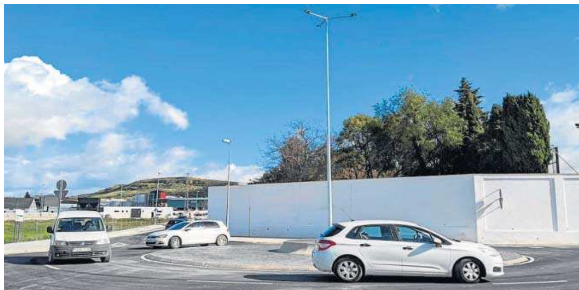
Detalle de la zona con las obras finalizadas.