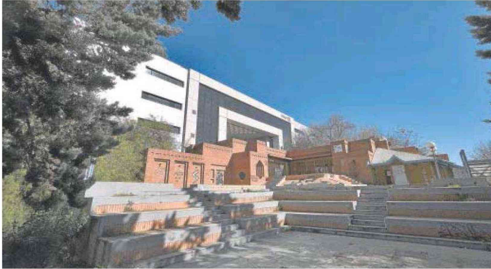
Estado actual que presenta el pabellón de Turquía, en la isla de la Cartuja