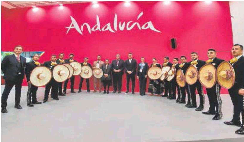
Presentación en Fitur de Icónica Sevilla Fest, que contará con México como país invitado este año