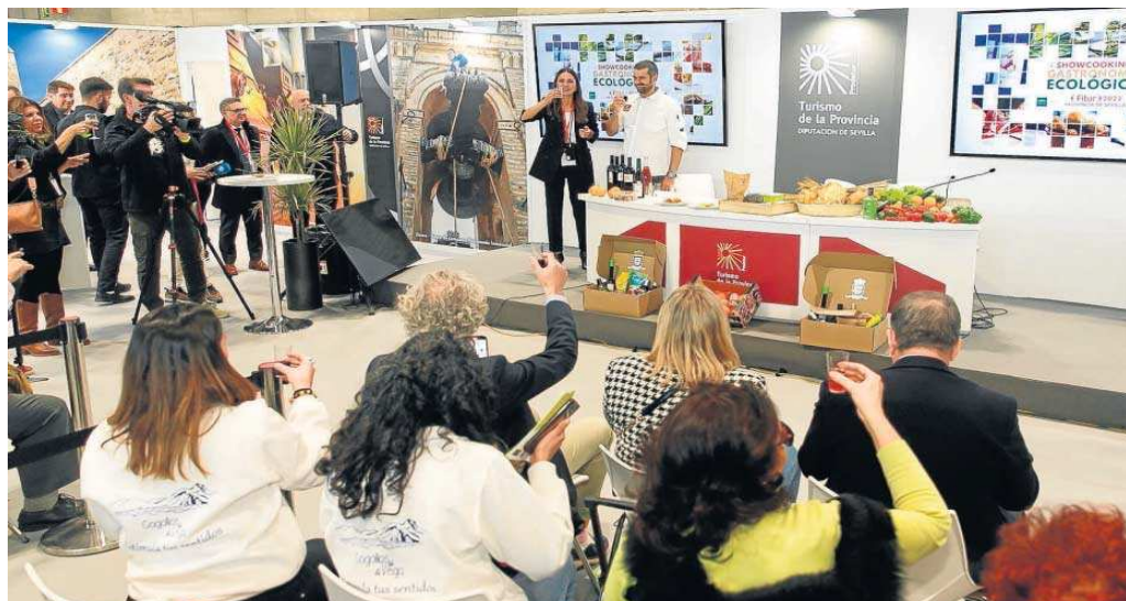
Un momento de la presentación ayer en Fitur por parte de la Diputación de Sevilla.