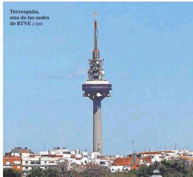
Torrespaña, una de las sedes de RTVE

Ese agujero real, descontadas subvenciones, fue un 27% mayor en 2021 que en 2020: en doce meses, los números rojos estructurales pasaron de los -914,7 millones de euros a los -1.158,2 millones. Es decir, empeoraron en 243,7 millones de euros.