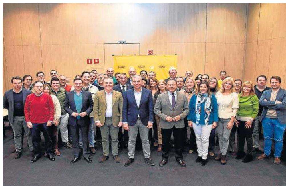
Sanz con su equipo de campaña.