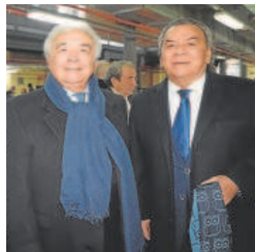
Antonio Romero y Rafael Ruiz, 'Los del Río'