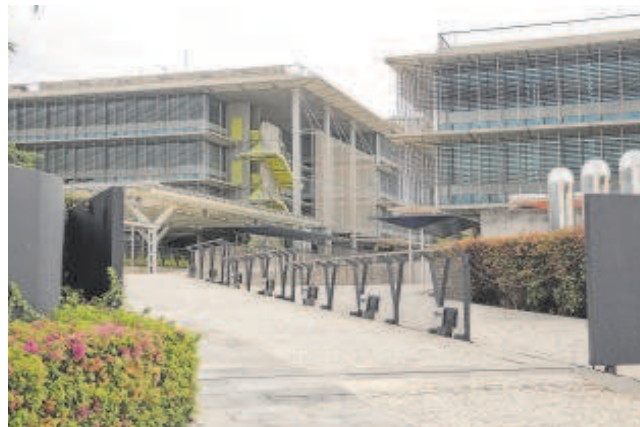
Entrada al complejo de oficinas de Palmas Altas

«Ocurre en otras ciudades, pero con Palmas Altas se dará un paso adelante. Será la Ciudad de la Justicia más grande de Andalucía y la más completa y moderna de España. Nos beneficiaremos todos y no sólo los sectores judiciales», afirmó el presidente de la Junta.