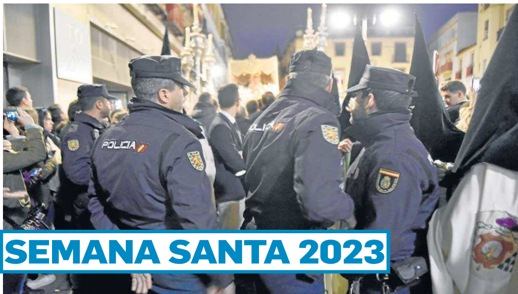
Un grupo de Policías ante el paso de la Virgen de la Esperanza por la Cuesta del Rosario.