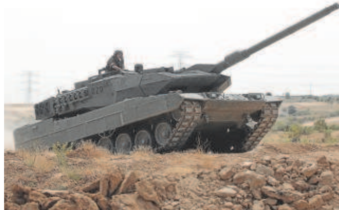
Carro Leopard en Colmenar Viejo (Madrid)