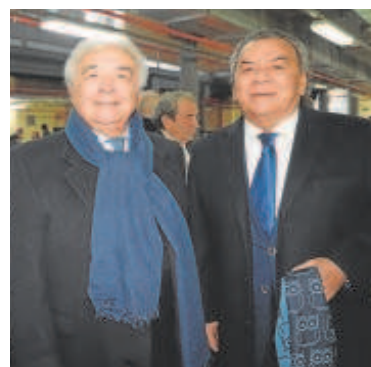
Antonio Romero y Rafael Ruiz, 'Los del Río'