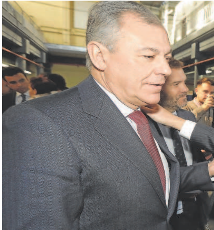
El presidente del Gobierno andaluz, Juanma Moreno, saluda, ayer, al candidato del PP a