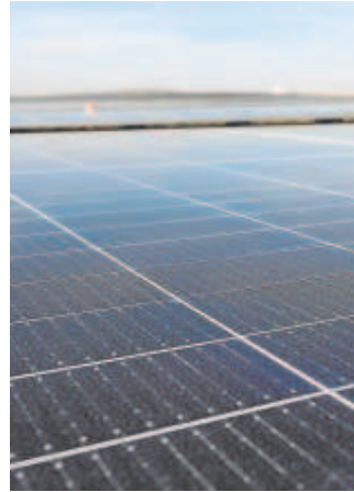
Plantas fotovoltaicas

También trazó buenas expectativas para el sector aeronáutico andaluz. Según adelantó, el gigante aeronáutico británico BAE System tiene interés