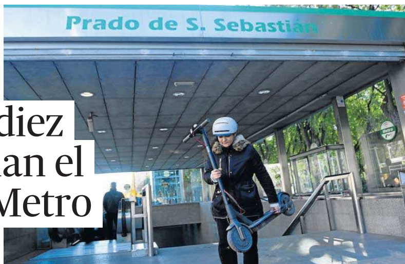
Una usuaria de Metro sale de la estación del Prado con su patinete.

En estas primeras semanas, los jefes de línea del Metro y el personal de seguridad se están organizando en patrullas para informar a los viajeros de la obligación de llevar el patinete plegado y aconsejan guardarlo en una bolsa para evitar molestias al resto de usuarios.