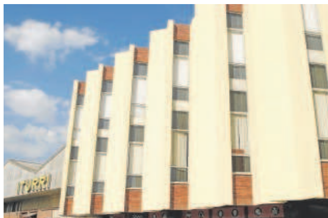
Fábrica de Iturri en el Polígono Carretera Amarilla de Sevilla