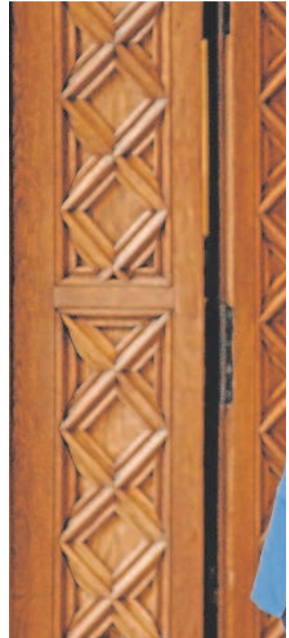
Escenificación, ayer, del acuerdo entre ERC y PSC, con Pere Aragonès y Salvador Illa al frente

Ciertamente, el pacto para los Presupuestos entre comunes, ERC y PSC reedita de facto el pacto de izquierdas que gobernó Cataluña entre 2003 y 2010, aunque su traslación a un futu-