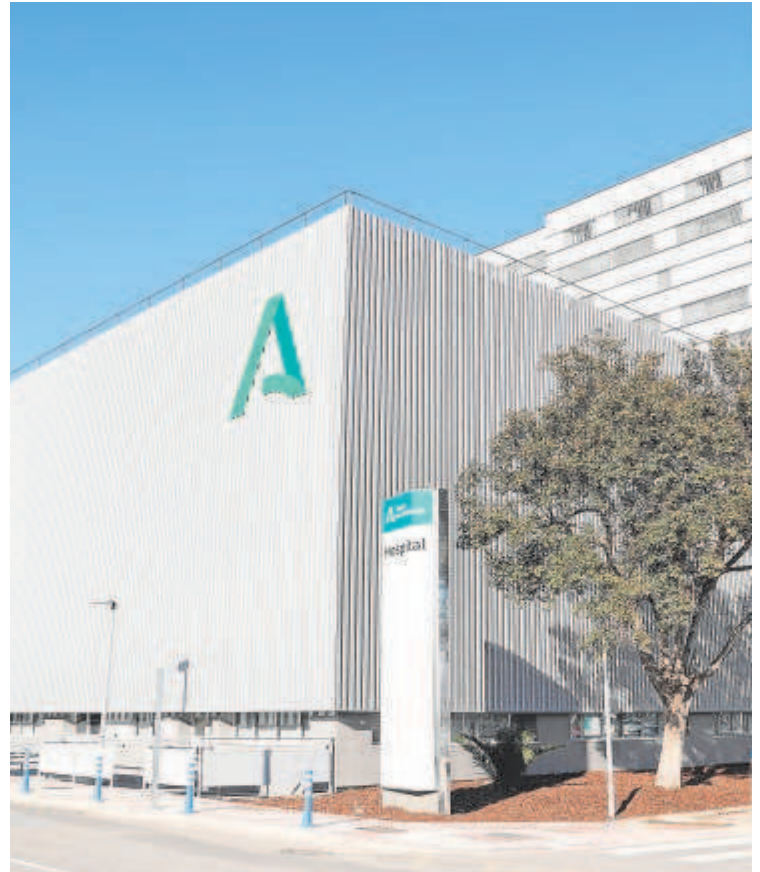
Fachada del Hospital Militar de Sevilla // ROCÍO RUZ

Asimismo, Moreno confirmó la venta de las naves de Santa Bárbara en Sevilla por 27,4 millones de euros. «Estamos sacando a subasta terrenos que son patrimonio de la Junta de Anda-