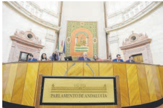
La Mesa del Parlamento de Andalucía en una sesión

«Feijóo será presidente del Gobierno este mismo año, estoy convencido», indicó ayer Moreno