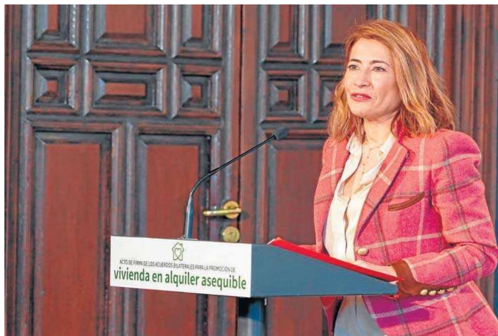
La ministra Raquel Sánchez, durante la firma del acuerdo con la Junta de Andalucía.

La titular del Ministerio de Transportes, Movilidad y Agenda Urbana, apuntó al año 2026 como el de finalización de las promociones que tendrán un límite para acogerse a la ayuda de 700 euros por metro cuadrado hasta las 50.000 euros por vivienda. A estas 1.039 viviendas englobadas en el denominado Plan de Vivienda de Alquiler Asequible, se suman "las que desarrolla la Entidad Pública Estatal del Suelo (Sepes), en concreto las 1.245 que se levantarán en el antiguo Regimiento de Artillería de Sevilla, además de las procedentes de la SAREB y del Fondo Social de Viviendas". Sánchez señaló que en los próximos tres años (perío-