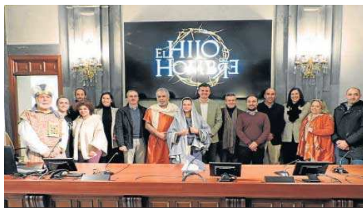
Momento de la presentación del espectáculo en la Casa de la Provincia.

Se acerca la Cuaresma y con ella las actividades relacionadas con la Semana Santa. El hijo del hombre es un espectáculo cofrade, en el que se visualiza la Pasión de Jesucristo mediante la fusión de teatro, cine y música, lo que convierte esta propuesta en una producción única: se cuenta en primera persona por los seguidores y detractores del Nazareno y estas escenas se combinan con una selección de cortometrajes de hermandades y cofradías de la Semana Santa de Andalucía, sumadas a imágenes de cuadros de Goya, Velázquez o El Greco y una banda sonora con música cofrade en directo.