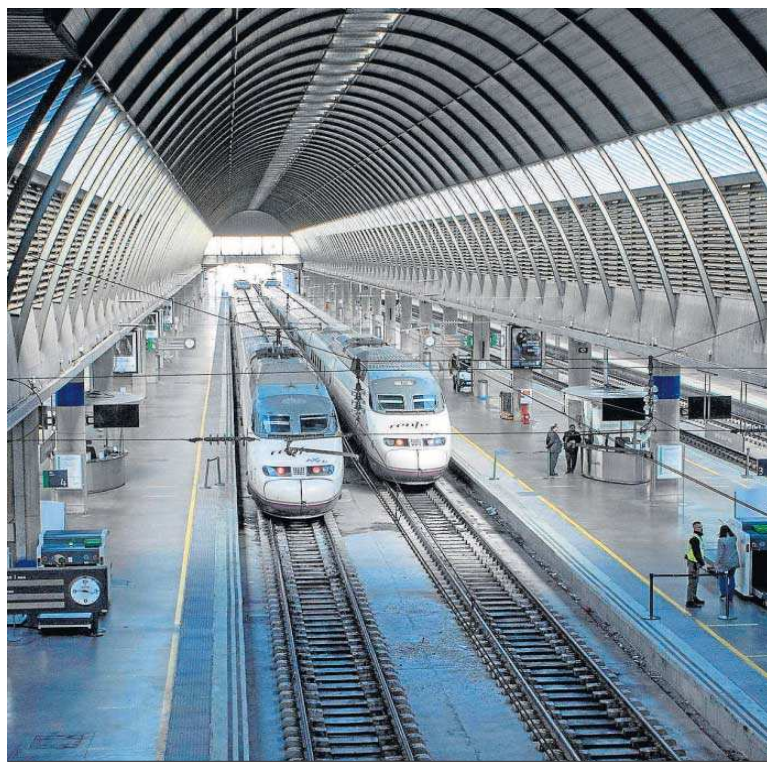
Trenes en la estación de Santa Justa de Sevilla.

El presidente de la Junta de Andalucía, Juanma Moreno, se dirigió a la titular de Transportes y puso el estudio informativo realizado por el Gobierno andaluz a disposición del Gobierno de España, ya que "puede ser interesante porque he-