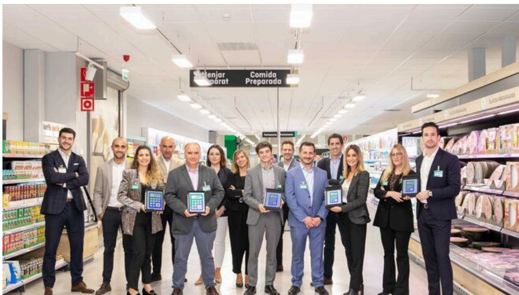
Equipo de la División de Costes del Proceso de Mercadona

El Institut Cerdà ha dado a conocer este jueves, durante la celebración de su sexta edición del Observatorio de Innovación en Gran Consumo en España que ha tenido lugar en el Ministerio de Ciencia e Innovación, las innovaciones del sector en 2022.