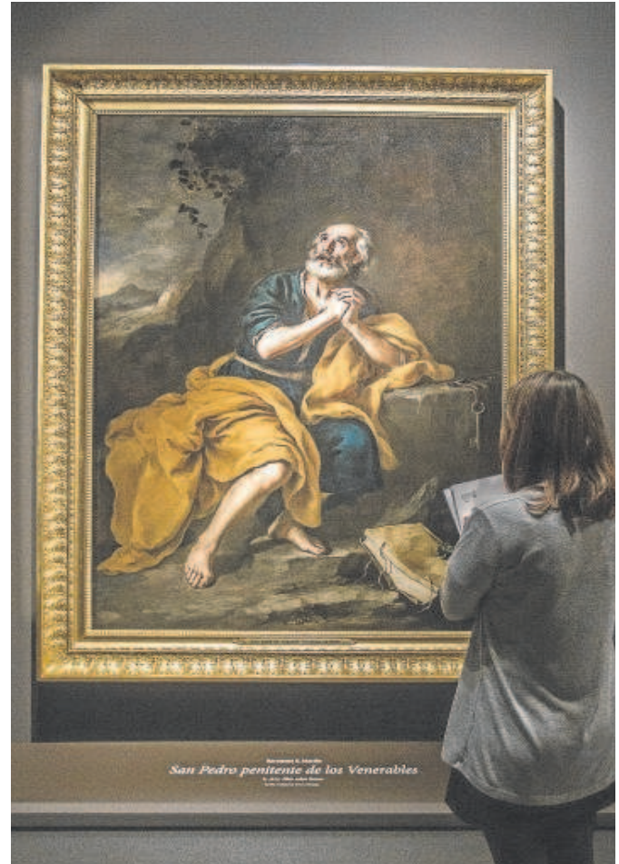
El 'San Pedro' cuando regresó a los Venerables en 2016

La restitución de la pintura para el patrimonio español y el estado de conservación son dos factores que incrementan su valor