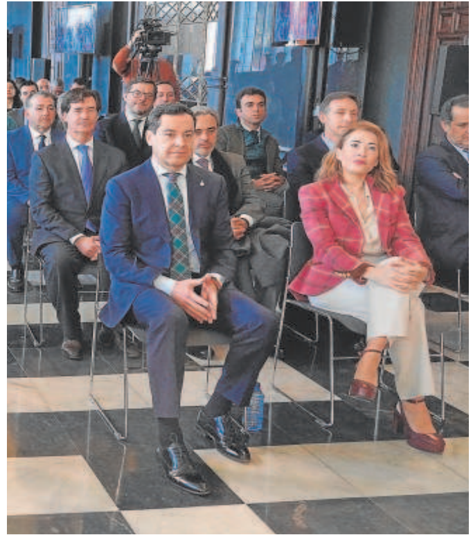
Raquel Sánchez firmó ayer con Juanma Moreno un acuerdo de vivienda

La falta de acuerdos entre administraciones, y el posterior menosprecio estatal a la actuación previa del Gobierno autonómico, motivará que el proyecto se vaya a retrasar más de dos años,