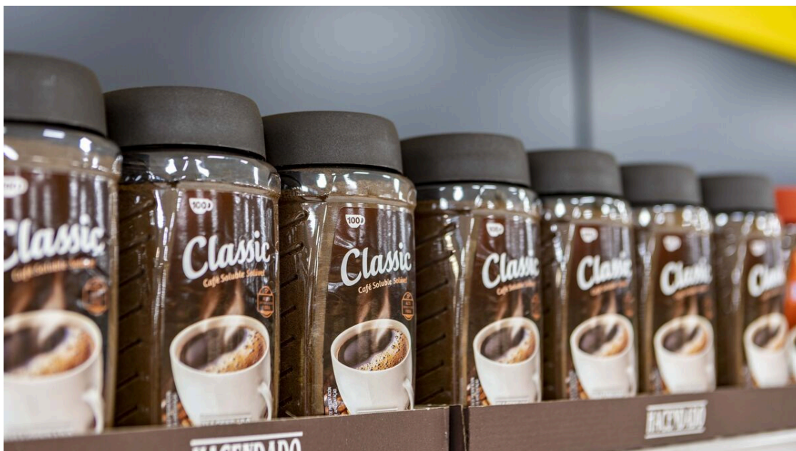
Café soluble Hacendado

Además, también ha sido reconocido como innovación en producto el sistema abrefácil que la compañía, en colaboración con el Proveedor Totaler Prosol, ha incorporado en el opérculo de su gama de café soluble Hacendado (Classic, Descafeinado y Espresso Creme).