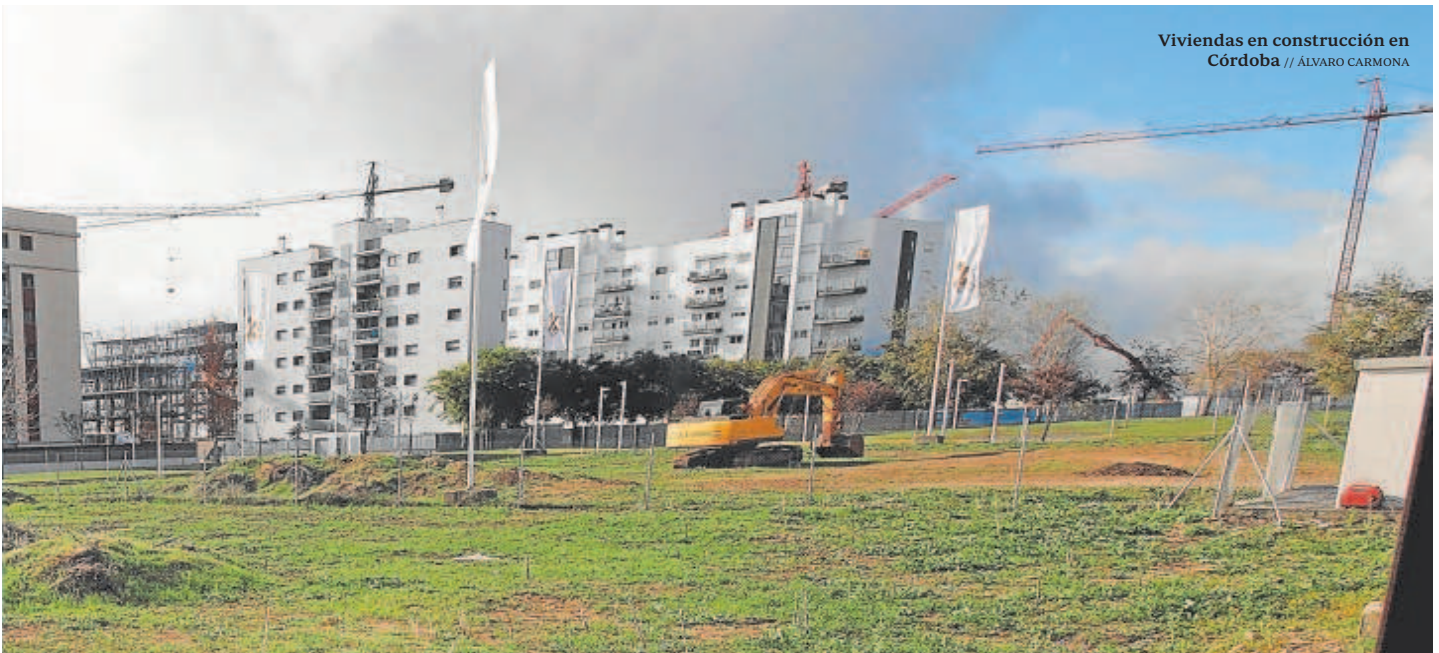
Viviendas en construcción en Córdoba

Esas VPO, señalan en la Consejería de Fomento, tienen unos precios de alquiler de entre 200 y 400 euros. Se trata de 87 promociones por toda la comunidad que levantó viviendas, sobre todo, en Sevilla y Málaga.