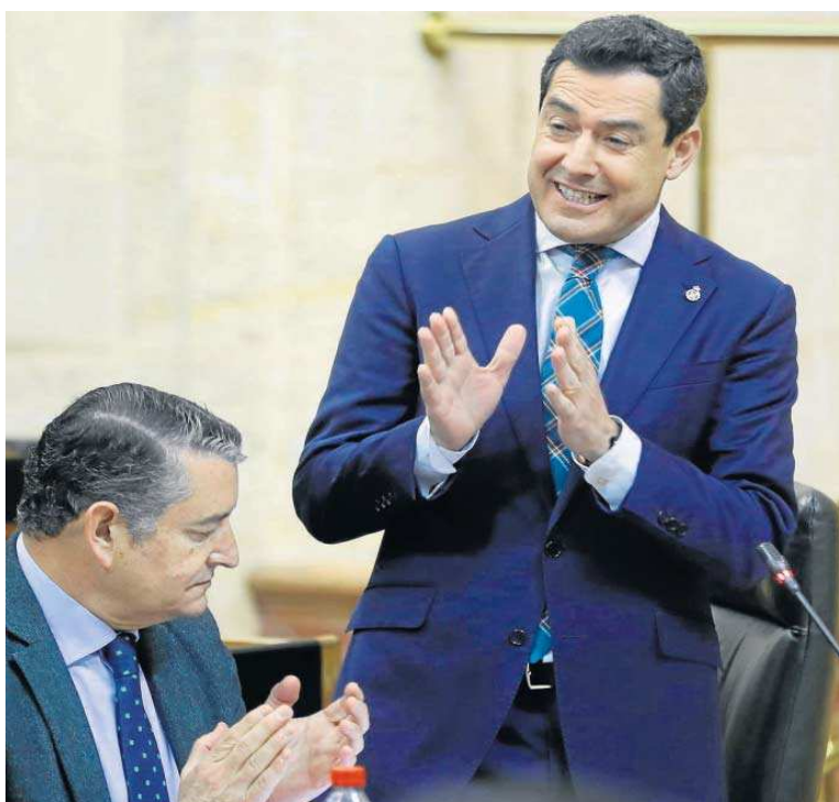
Juanma Moreno, durante el pleno de ayer.

En este contexto, las elecciones municipales del 28 de mayo se sitúan como un examen para los líderes del PSOE y del PP. En esto, Andalucía va a jugar un papel