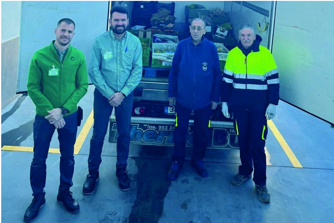
Voluntarios del Banco de Alimentos de Jaén recogiendo los alimentos.

Mercadona ha reforzado su práctica de donaciones en la provincia de Jaén con nuevos acuerdos y ha firmado un convenio de colaboración con el Banco de Alimentos de Jaén para entregar diariamente productos de primera necesidad a nueve entidades de Jaén capital y la provincia.