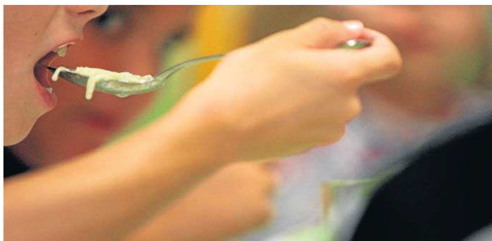
Imagen de archivo de un alumno almorzando en un comedor escolar.

Por esta razón, los técnicos de Evacole asesoran a la citada empresa “en la cantidad y la calidad del menú” que sirven a los menores, en concreto, a 63 alumnos del segundo ciclo de Educación Infantil y a 141 de Primaria. “El asunto se está gestionando”, ase-