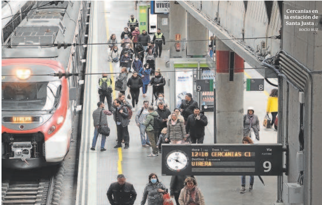
Cercanías en la estación de Santa Justa