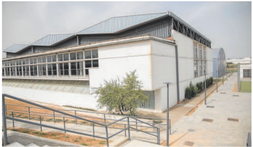
Instalaciones del CEU en su campus universitario de Bormujos