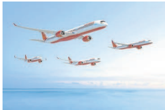
Flota de aviones de Air India

«Este es un momento histórico para Airbus y para Air India. India está a punto de vivir una revolución en el transporte aéreo internacional y nos honra que nuestra colaboración con el grupo Tata y nuestras soluciones de aviación escriban ese nuevo capítulo de la conectividad aérea en el país», afirmó Christian Scherer, Chief Commercial Officer de Airbus y Director de Airbus International.