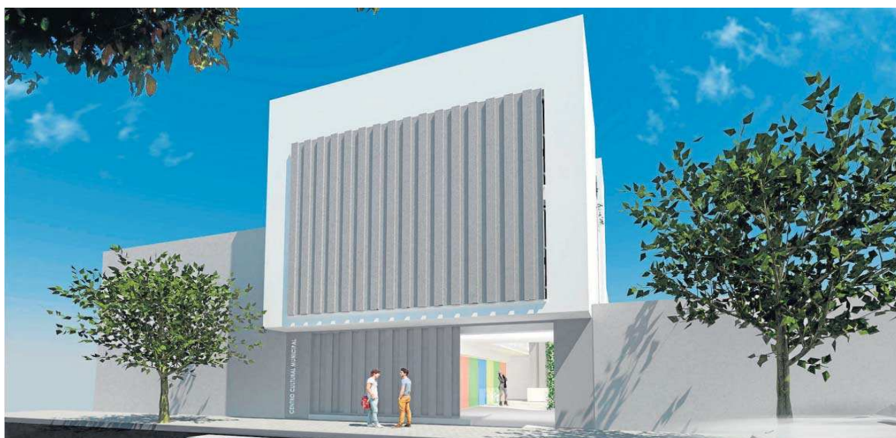
Recreación de cómo quedaría el centro. Abajo, visita a las obras y otra imagen recreada.