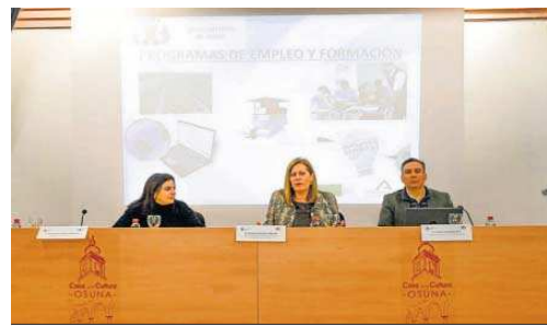
Momento de la presentación.

Además, ha habido una tercera reunión informativa dirigida al cuerpo técnico que dirigirá y coordinará estos programas, es decir, los profesionales que aspiran a la dirección de los mismos, el personal de orientación laboral, el personal docente y el personal administrativo, siendo más de medio centenar las personas que se han presentado para poder optar al mismo.