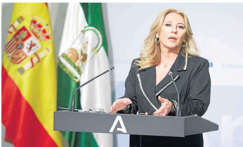
La consejera de Economía y Hacienda, Carolina España, en la rueda de prensa posterior al Consejo de Gobierno de la Junta, celebrado ayer en Sevilla.

● El voto de calidad de la presidenta resolvió el dictamen favorable a la cuestión de inconstitucionalidad planteada por la Junta ● El Gobierno andaluz pide la suspensión