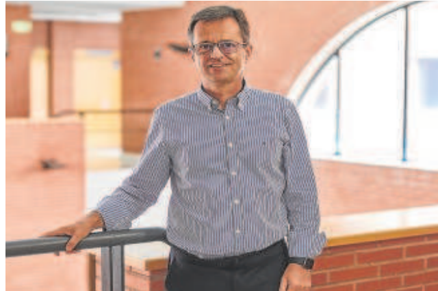
El economista Antonio Cabrales // GUILLERMO NAVARRO