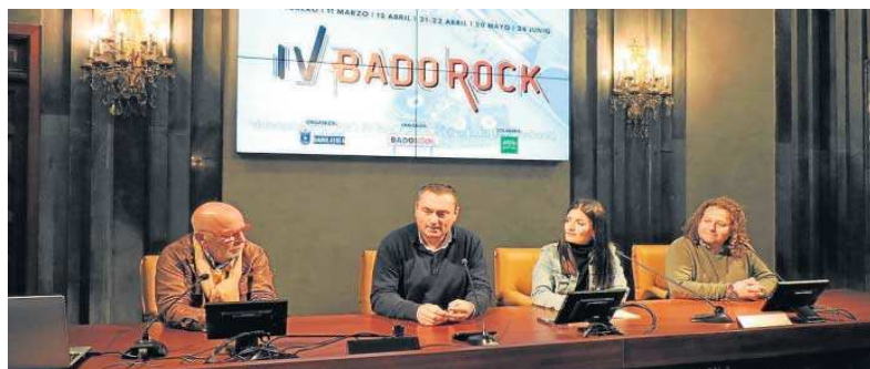
El alcalde de Badolatos en su intervención durante la presentación de 'Badorock' en la Casa de la Provincia.

"Dado el éxito y la buenísima aceptación que tuvo en 2022 la