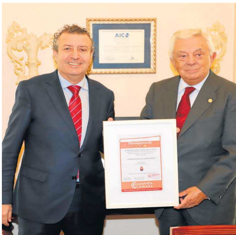
Momento de la entrega de la certificación.

De acuerdo con los niveles de Reconocimiento de Transparencia, la Corporación municipal ha obtenido un 83,18