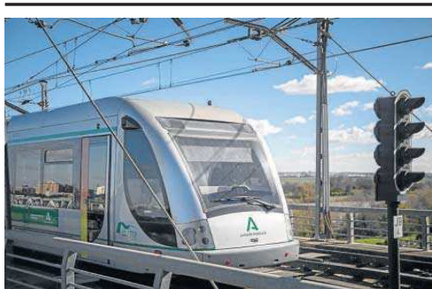
La línea 1 del Metro de Sevilla.

La Consejería de Fomento, Articulación del Territorio y Vivienda de la Junta ya ha adjudicado la actualización de este tramo Sur de la línea 3, de 9,2 kilómetros, doce estaciones y