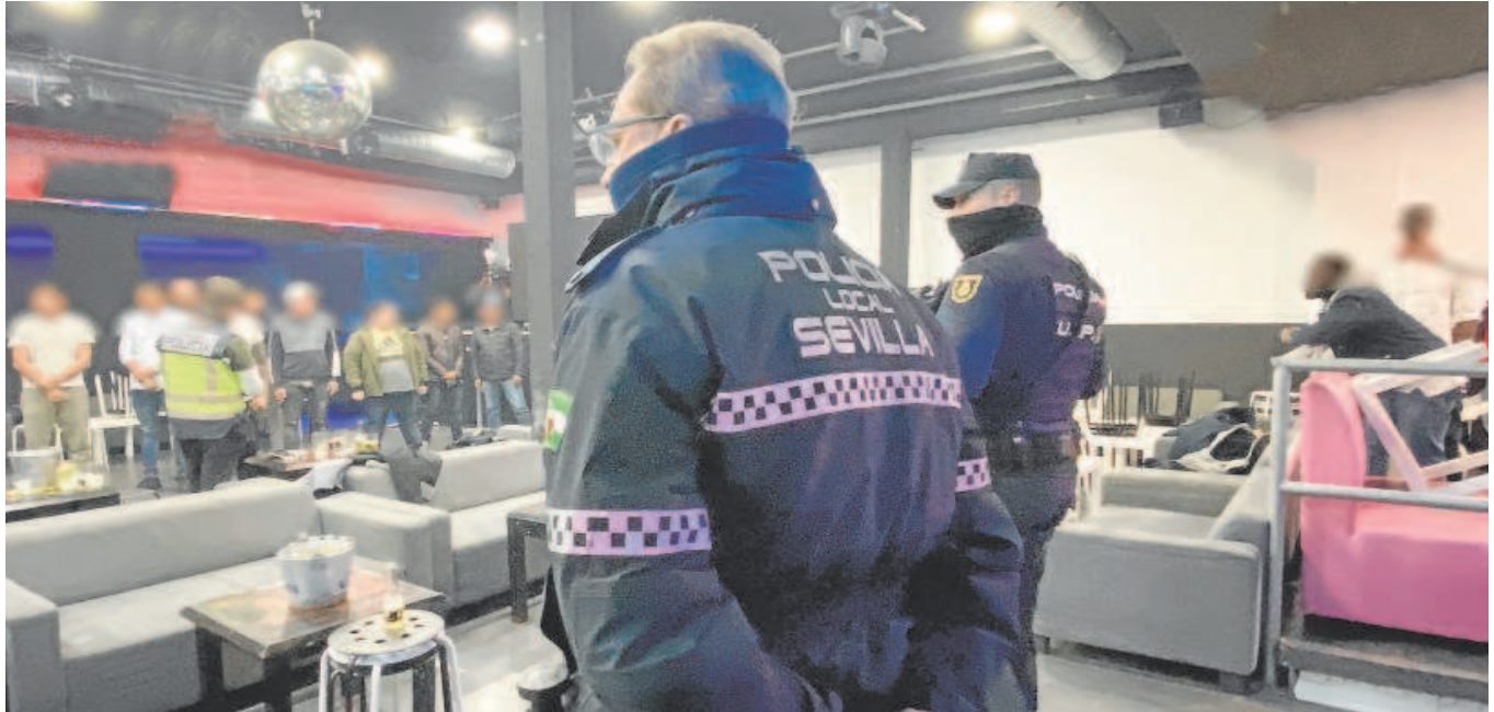
Dos agentes de Policía durante la inspección en uno de los locales de ocio