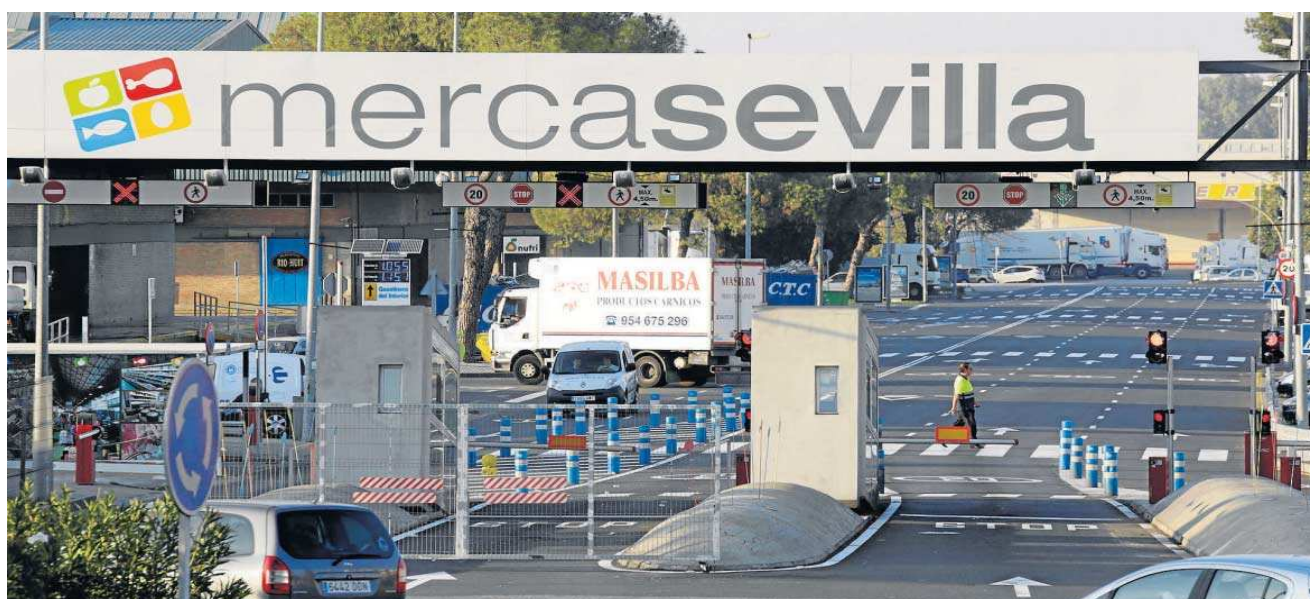
Vista general del acceso a las instalaciones de Mercasevilla, en una imagen de archivo.

● El informe elaborado por una consultora especializada aconseja mantener y ampliar las instalaciones actuales tras analizar siete ubicaciones como Majarabique o Higuera Norte