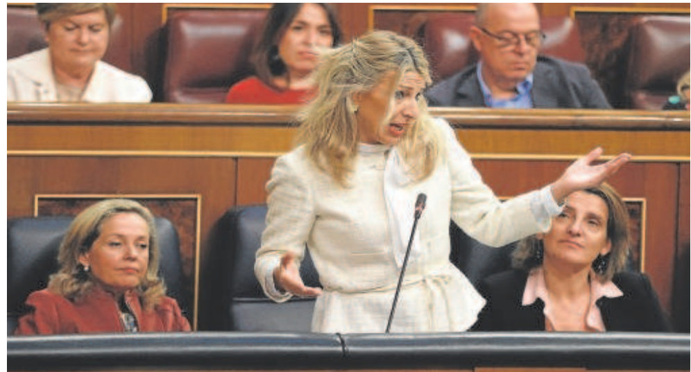
La vicepresidenta del Gobierno y ministra de Trabajo, Yolanda Díaz, ayer en el Congreso