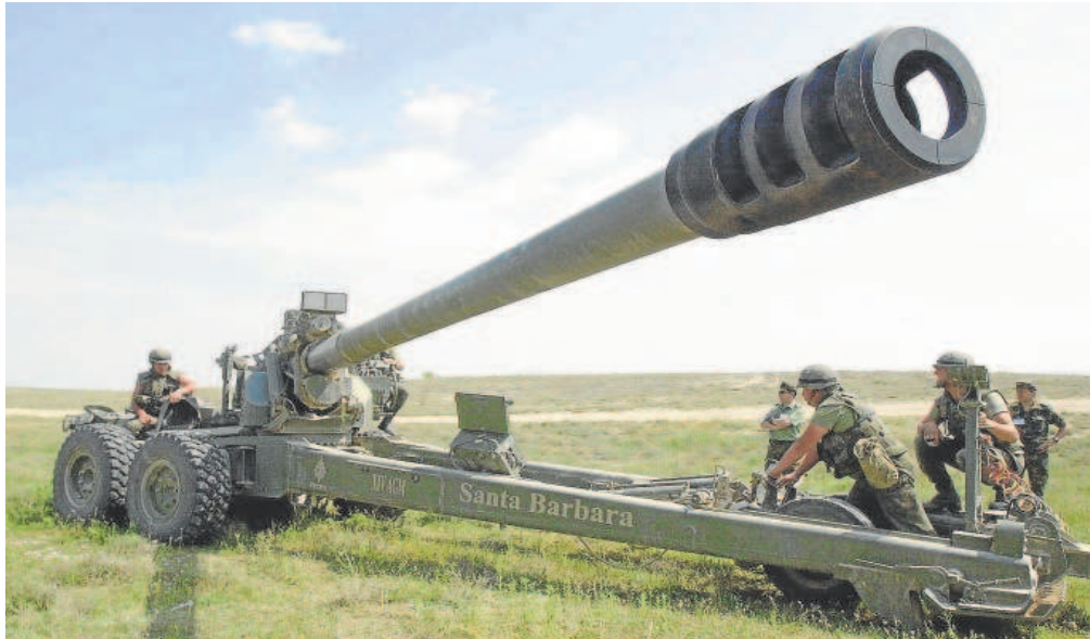
La factoría de Alcalá de Guadaíra de SBS mantendrá los obuses del Ejército de Tierra