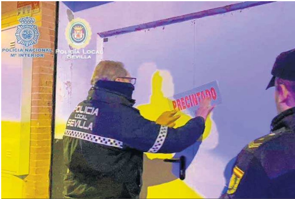
Precinto de uno de los locales.