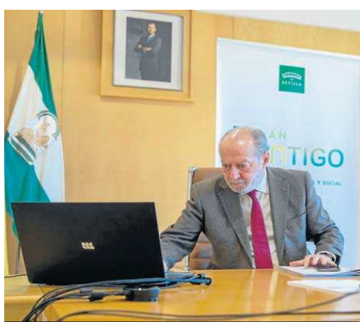
El presidente de la Diputación en la sede de la institución provincial.