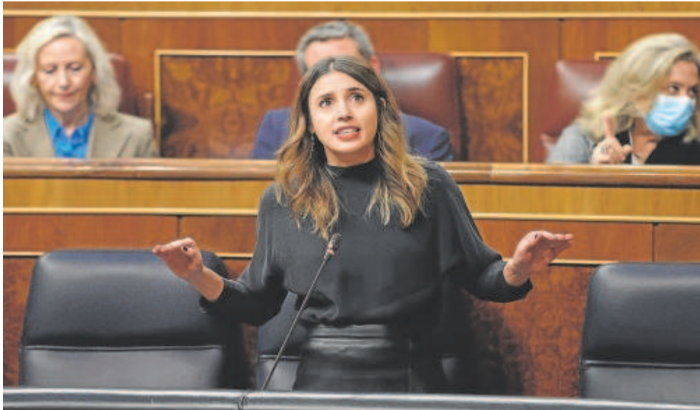
La ministra de Igualdad, Irene Montero, en la sesión de control