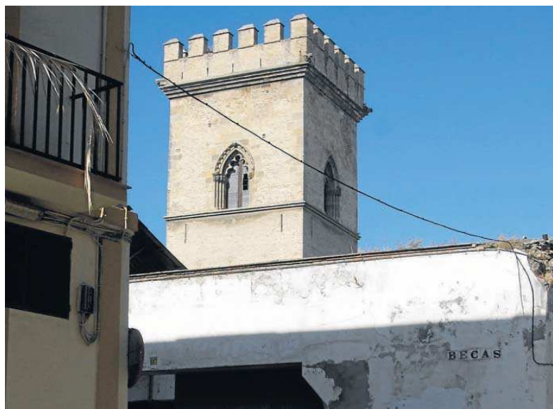
La Torre de Don Fadrique, vista desde el este, con el antiguo garaje donde irá un bloque de tres plantas.

La recuperación de Santa Clara y Don Fadrique debe ir mucho más allá, por todo lo que significó el convento de clarisas, exclaustro en 1996, y lo que sigue significan-