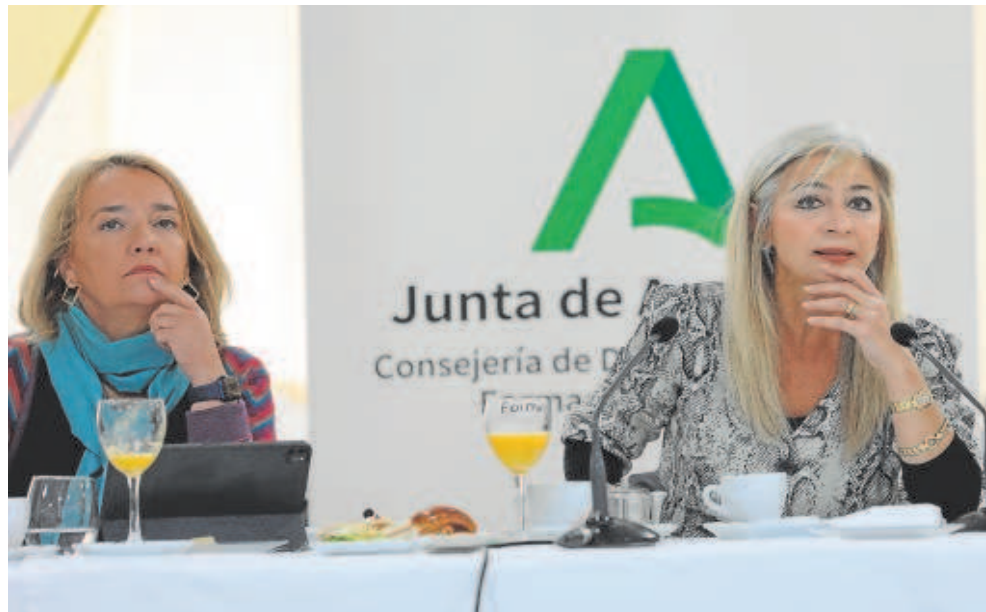
A la izquierda, la viceconsejera de Educación y a la derecha, la consejera, ayer en Sevilla

Además, destacaron ayer desde la Consejería de Educación, el nuevo plan de contenido para los alumnos —que se aplicará ya el curso de viene con asignaturas como Flamenco o Debate— tiene como uno de sus ejes centrales «la apuesta por la excelencia y la cultura del esfuerzo».