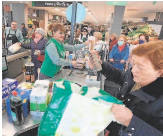
La cesta de la compra está cada vez más cara

El Consejo de Ministros dio luz verde el pasado martes a un alza del 8% del SMI hasta dejarlo en 1.080 euros al mes, 80 euros de subida que tendrá su impacto en los precios de alimentos. Así lo advierte la patronal agraria Asaja, después de considerar que el incremento de la renta mínima, que tendrá efectos retroactivos al 1 de enero, «será dramática». «Este tipo de subidas reiteradas pueden conllevar otras, no tan deseadas, por ejemplo, en el precio de