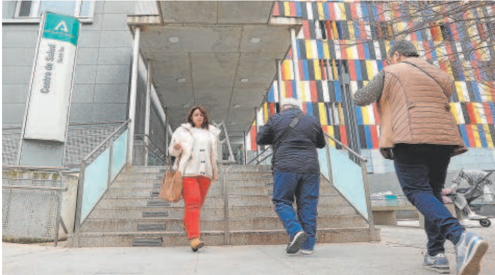
Usuarios en la entrada de un centro de salud de Córdoba