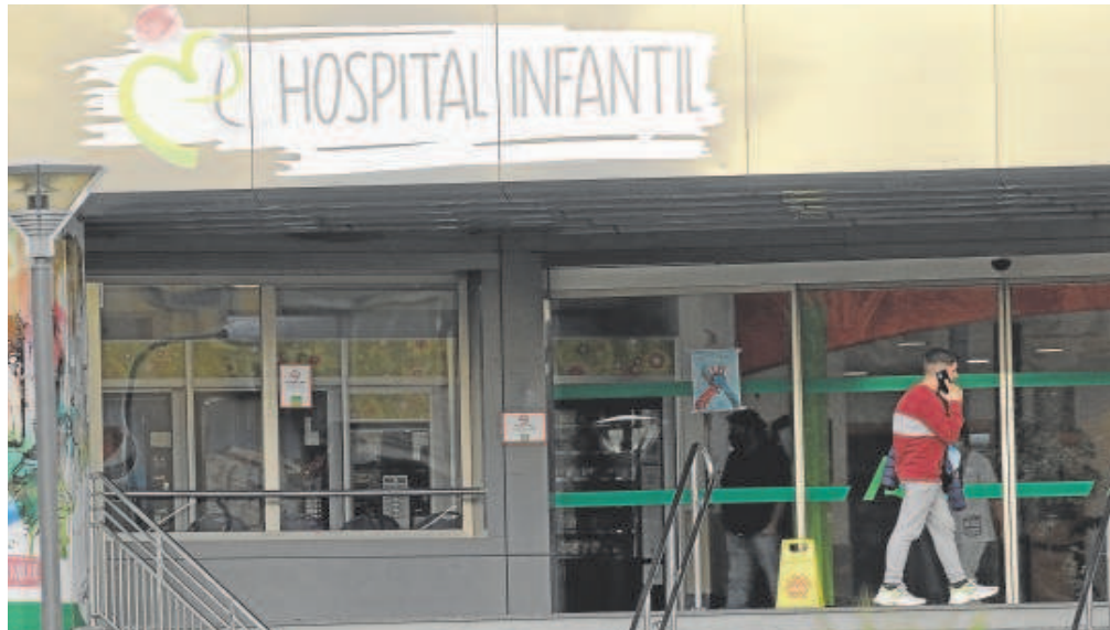
Hospital Infantil del complejo sanitario Virgen del Rocío