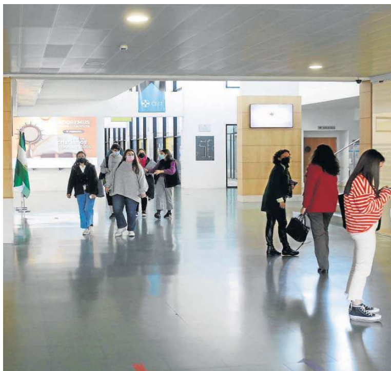
Estudiantes en las instalaciones del CEU San Pablo en Bormujos.

Por tal motivo, los rectores expresaron ayer esta oposición en un comunicado conjunto en el que recuerdan que tal