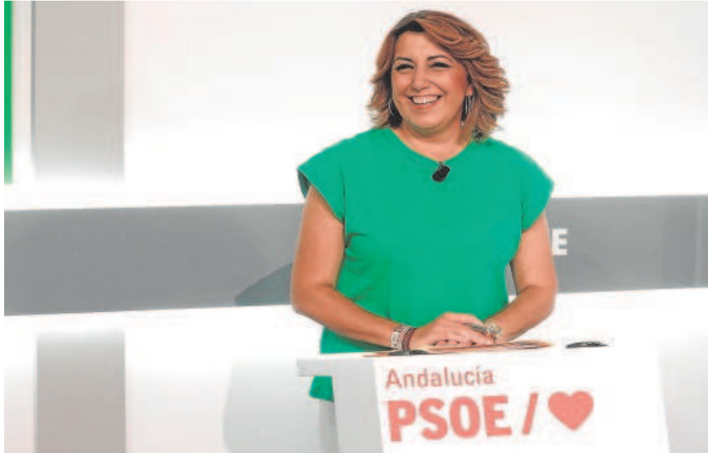
La expresidenta de la Junta, Susana Díaz, en un acto de su partido