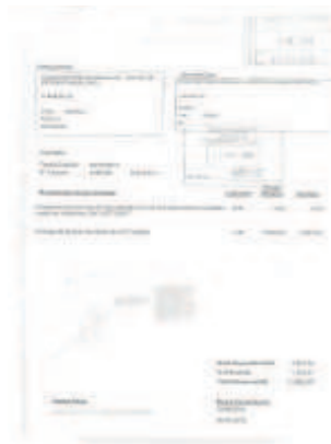
Factura abonada por la Junta

con una pregunta: «¿Me puede decir porque hicieron una encuesta que no llegaron a publicar? En 2018, noviembre, elecciones... ¿les suena? ¿Tan mala era la opinión de los ciudadanos sobre su gobierno que se gastaron más de 10.000 euros de todos los andaluces en una encuesta que no se atrevieron a publicar? Seguramente esa encuesta adelantaba lo que pasó, que ustedes no iban a volver a gobernar», explicó.