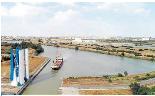
Vista de la esclusa y de la dársena del Cuarto.

La nueva concesión supone un impulso al posicionamiento del Puerto de Sevilla ante sectores industriales estratégicos como son las energías renovables. “Somos un gran núcleo de actividad industrial para Sevilla, un nodo logístico clave para el desarrollo de la re-