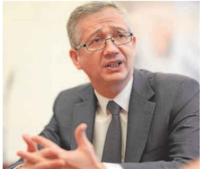
El gobernador del Banco de España, Pablo Hernández de Cos

Ese, precisamente, es el modelo que han puesto sobre la mesa los altos fun-