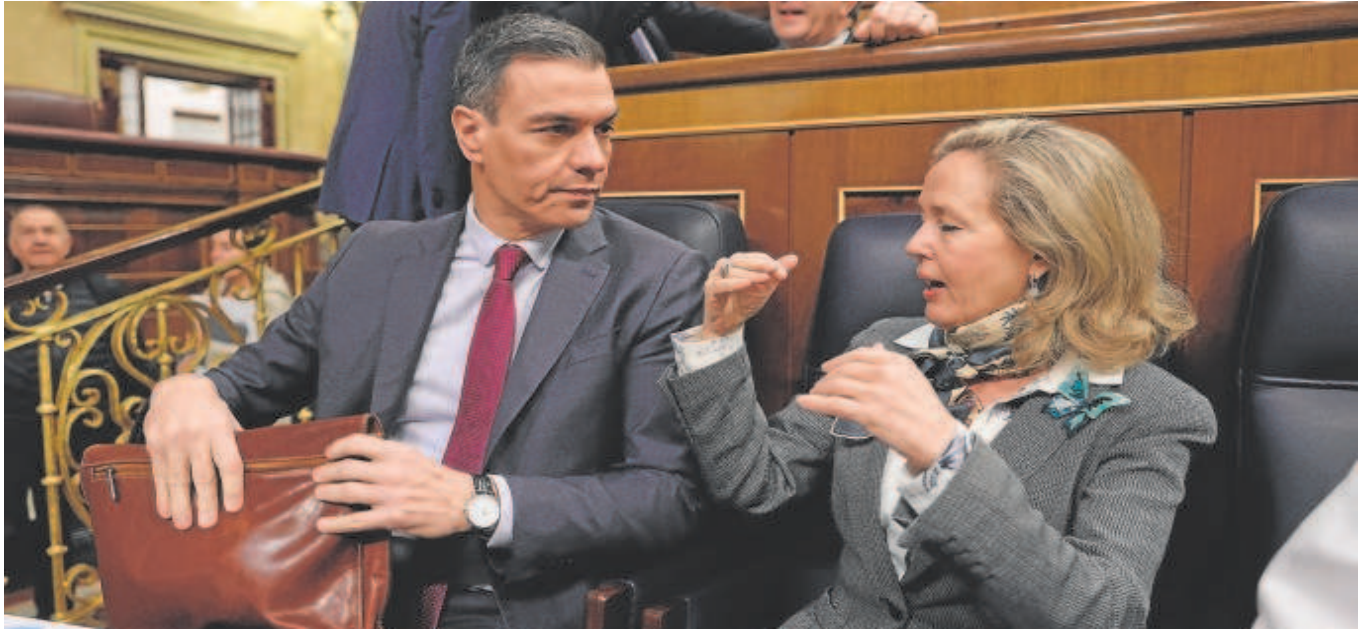
El presidente del Gobierno, Pedro Sánchez, en la imagen con Nadia Calviño, dijo ayer que tiene «costumbre de dar la cara y asumir responsabilidades»