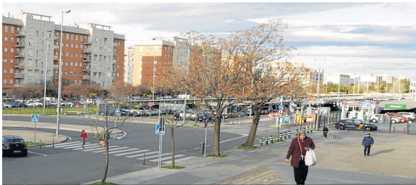
Zona de la avenida Pablo Iglesias en la que se levantará el centro cívico para el barrio.