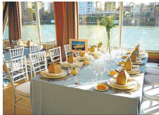
Embarcadero junto a la Torre del Oro, en Marqués de Contadero.

Existe la posibilidad de trazar otro plan diferente, lleno de historia y riqueza para los sentidos, como es la excursión en barco por el río Guadalquivir desde Sevilla hasta su desembocadura en Sanlúcar de Barrameda, donde se puede disfrutar de su gastronomía, pasear por la playa o visitar alguna de sus muchas bodegas. Este viaje de día sólo está disponible de abril a septiembre y las plazas se agotan en cuestión de horas.