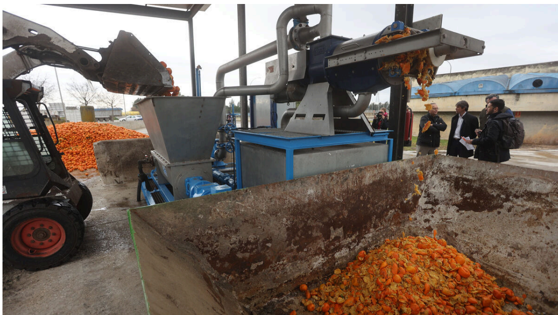
Proceso de codigestión de las naranjas de Sevilla. / José Ángel García