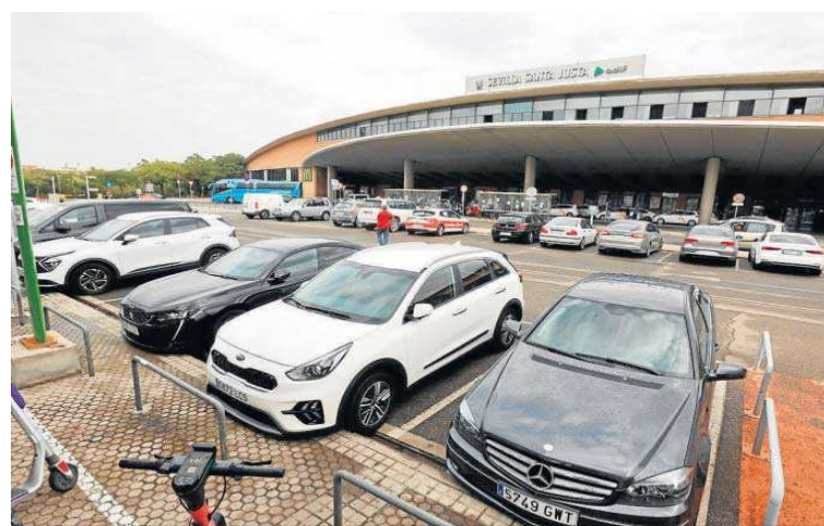
Vehículos aparcados junto a la entrada principal de la estación de trenes.

Alternativa Tartessos, que pedía un equipamiento público, que se resuelve con ese centro cívico en la avenida Pablo Iglesias en su cruce con el puente de la calle Samaniego, o la elevada por la Asociación Sevillasemueve, para la inclusión de una parcela junto a la calle José Laguillo, calificada de Transportes e Infraestructuras, Intercambiador de Transporte para que se implante en la misma el intercambiador de transporte previsto en la ordenación. Esta última solicitud también se planteó por parte de la empresa municipal Tussam y ha sido atendida con la reserva de una superficie de 3.000 metros cuadrados en la cabecera de la estación.