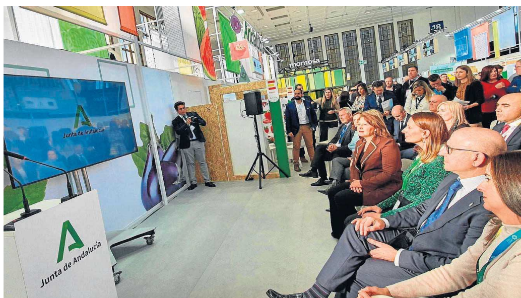
Vídeo de bienvenida en el stand de Extenda para la comitiva andaluza desplazada a Fruit Logística.

● La Junta y las empresas se dan la mano en Berlín para seguir avanzando y conquistar nuevos mercados ● La consejera destaca a la comunidad como referente ecológico al concentrar el 50% de la producción española