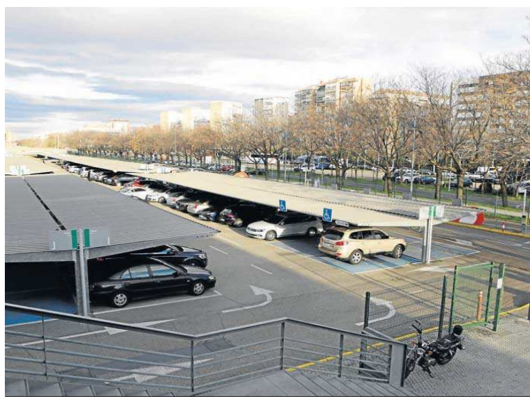
Zona del exterior de Santa Justa reservada principalmente para usos terciarios.

El diseño de esta gran plataforma central deberá respetar e integrar el arbolado que ya existe; la iluminación se diseñará con postes de baja altura que creen ambientes agradables; no se permitirá el cerramiento de estos espacios peatonales, el mobiliario urbano deberá estar concentrado en determinadas