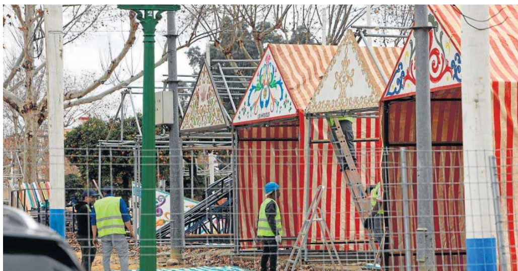
El real de Los Remedios registra gran actividad con el montaje de las casetas, a más de dos meses de la Feria.