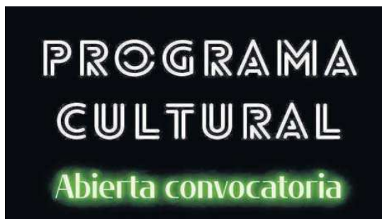
Cartel de la convocatoria 2023/2024, abierta hasta el 28 de febrero.

En esta ocasión y como novedad, el acceso de los interesados en ofertar sus propuestas de artes