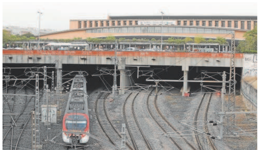
El plan urbanístico remodelará el entorno de la estación de trenes para su integración en la ciudad

El plan no está exento de polémica ya que desde sectores profesionales como los arquitectos se ha reclamado mayor ambición al proyecto elaborando los técnicos de Urbanismo, tras desecher el Ayuntamiento el estudio encargado al estudio Cruz y Ortiz, autores de la estación en 1989.