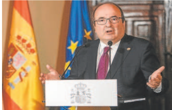
El ministro de Cultura, Miquel Iceta