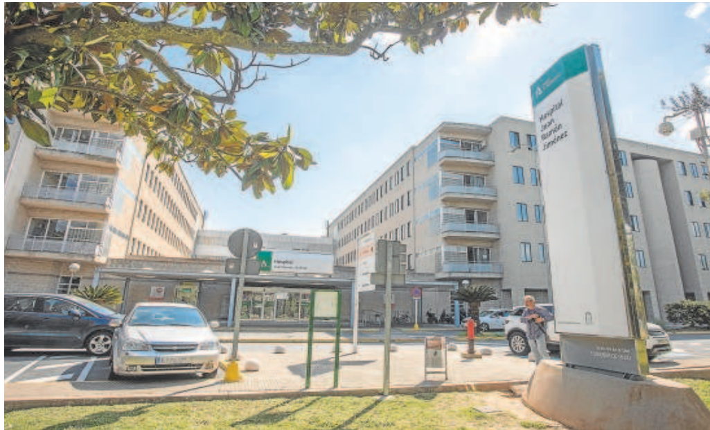
Entrada principal del hospital Juan Ramón Jiménez de Huelva