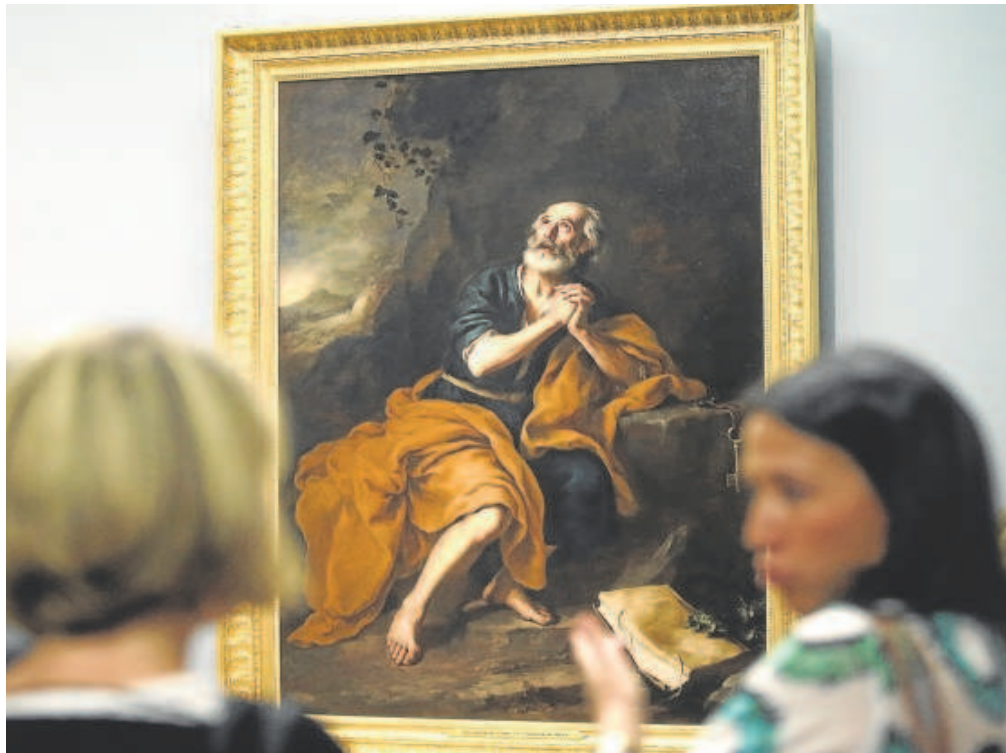
El cuadro 'San Pedro Penitente' de los Venerables de Murillo

La Junta pide al Gobierno un «compromiso» para que el cuadro no salga de Sevilla, que podría pasar por su adquisición