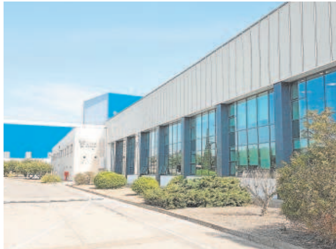
Fábrica de MP Ascensores en Malpica (Zaragoza)

La empresa vendió en 2022 un total de 4.100 ascensores, un 5% menos que el ejercicio anterior, y modernizó otros 1.200, un 15% más que en 2021. Además, tiene contratos para el man-