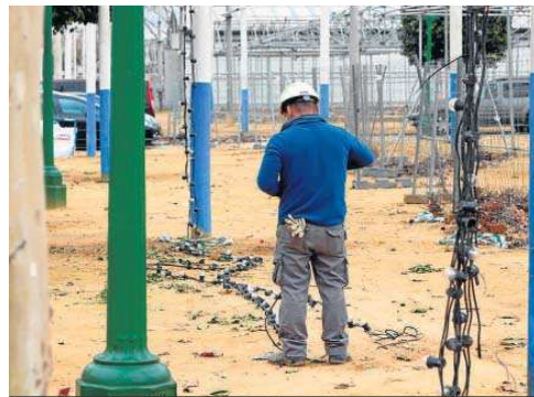
Un operario coloca los cables con bombillas que alumbrarán los farolillos.

puede acceder al real de Los Remedios para acometer dicha labor, lo que incluye los fines de semana. Desde Fiestas Mayores se mantiene un contacto permanente con el sector de los montadores para hacer frente a cualquier problema que pudiera surgir en próximas fechas. "Estamos convencidos que estas cuestiones, relativas a las empresas que se encargan del montaje y gestión de las casetas, quedarán resueltas, como el año pasado, antes de que comience la Feria", aseveró Juan Carlos Cabrera.