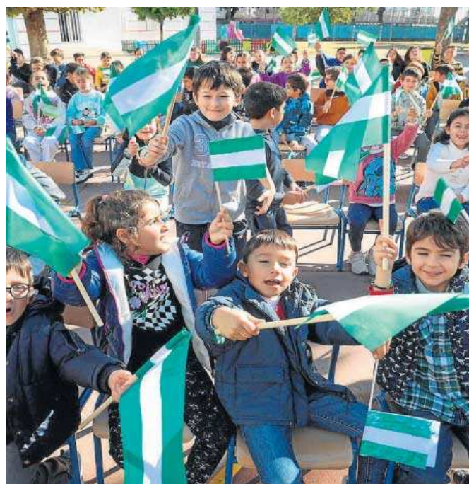
Commemoración del Día de la Bandera en un colegio en Sevilla.