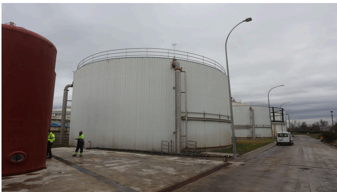
Instalaciones de la EDAR Copero.

Concretamente, en la estación de Copero en 2.022 se han generado 11.453.645 kWh/anuales equivalentes al consumo anual de 3.500 hogares, mientras que en el conjunto de las EDAR se han alcanzado los 20.600.069 KWh/anuales, lo que supone 6.400 viviendas.