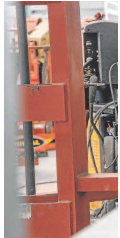
Un empleado de una fabrica de casas prefabricadas en Toledo

Y la tendencia es que continúe por esa senda en los trimestres siguientes. «Para el primer trimestre de 2023, las entidades de las dos áreas (España y zona euro) esperan que se produzca, de nuevo, una contracción generalizada de la oferta y de la demanda de crédito, en un contexto de elevada incertidumbre sobre la evolución macroeconómica y en el que se espera que