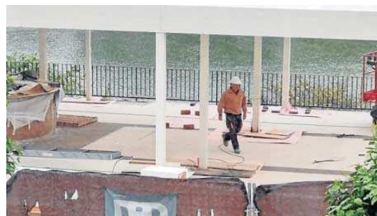
Un operario con casco en la parcela.