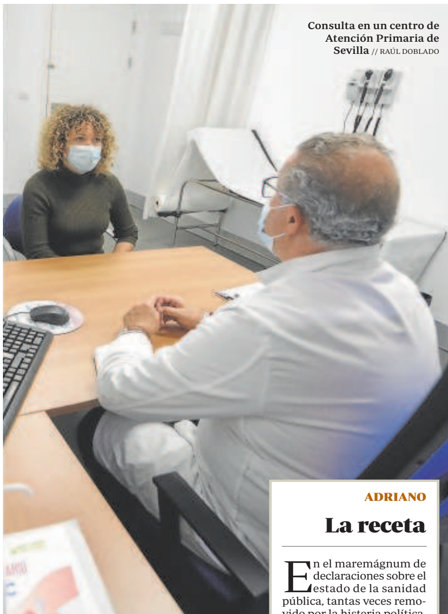
Consulta en un centro de Atención Primaria de Sevilla