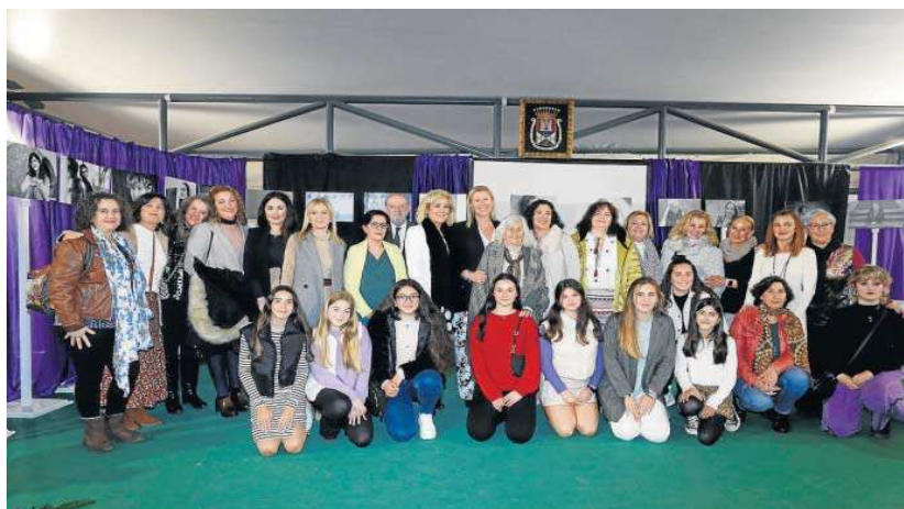
Villalobos junto a la alcaldesa de Castilleja de la Cuesta y las mujeres que han recibido el homenaje en esta edición.

Rodríguez Villalobos ha felicitado a las veinticinco mujeres protagonistas de la gala, “por ponerle a ese mundo propio que demandáis vuestro rostro, vuestra piel”. Villalobos, quien considera que “queda trecho por recorrer todavía en el camino de la igual-