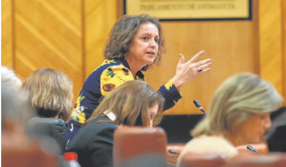
Catalina García, consejera de Salud y Consumo, en el Pleno del Parlamento andaluz