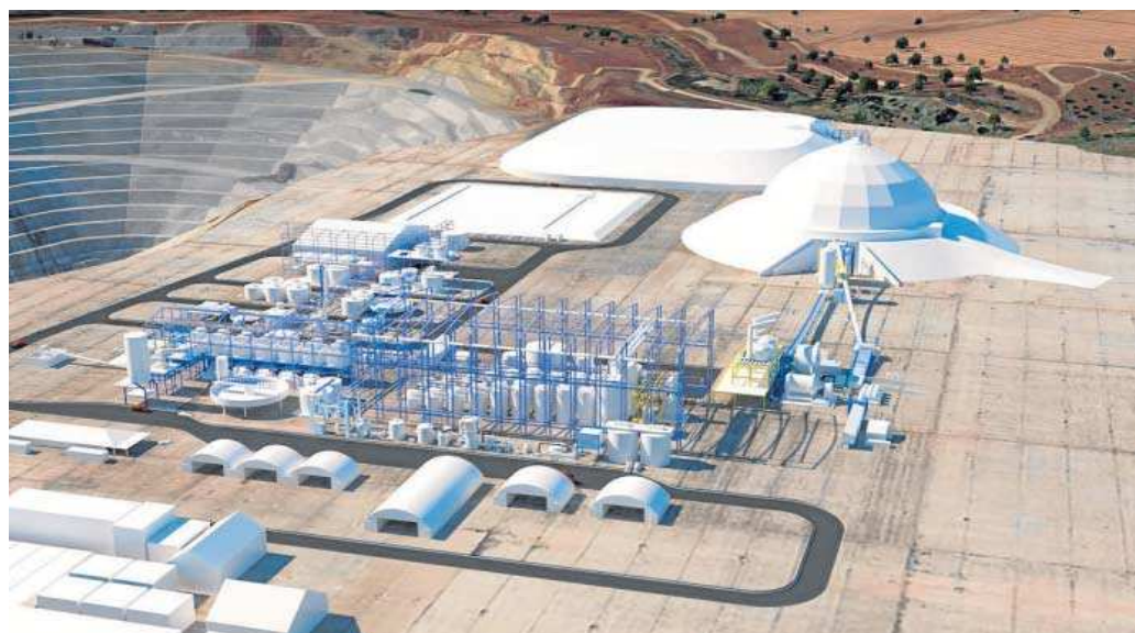
Recreación de cómo será la nueva planta metalúrgica de Cobre las Cruces.

Durante 2023 se ha activado una partida inicial de 16,5 millones de euros que se destinará a tres bloques de acciones: el desarrollo de la ingeniería de la nueva explotación subterránea y las nuevas instalaciones metalúrgicas; el acondicionamiento de la rampa de acceso a la futura explotación; y la construcción de una nueva planta