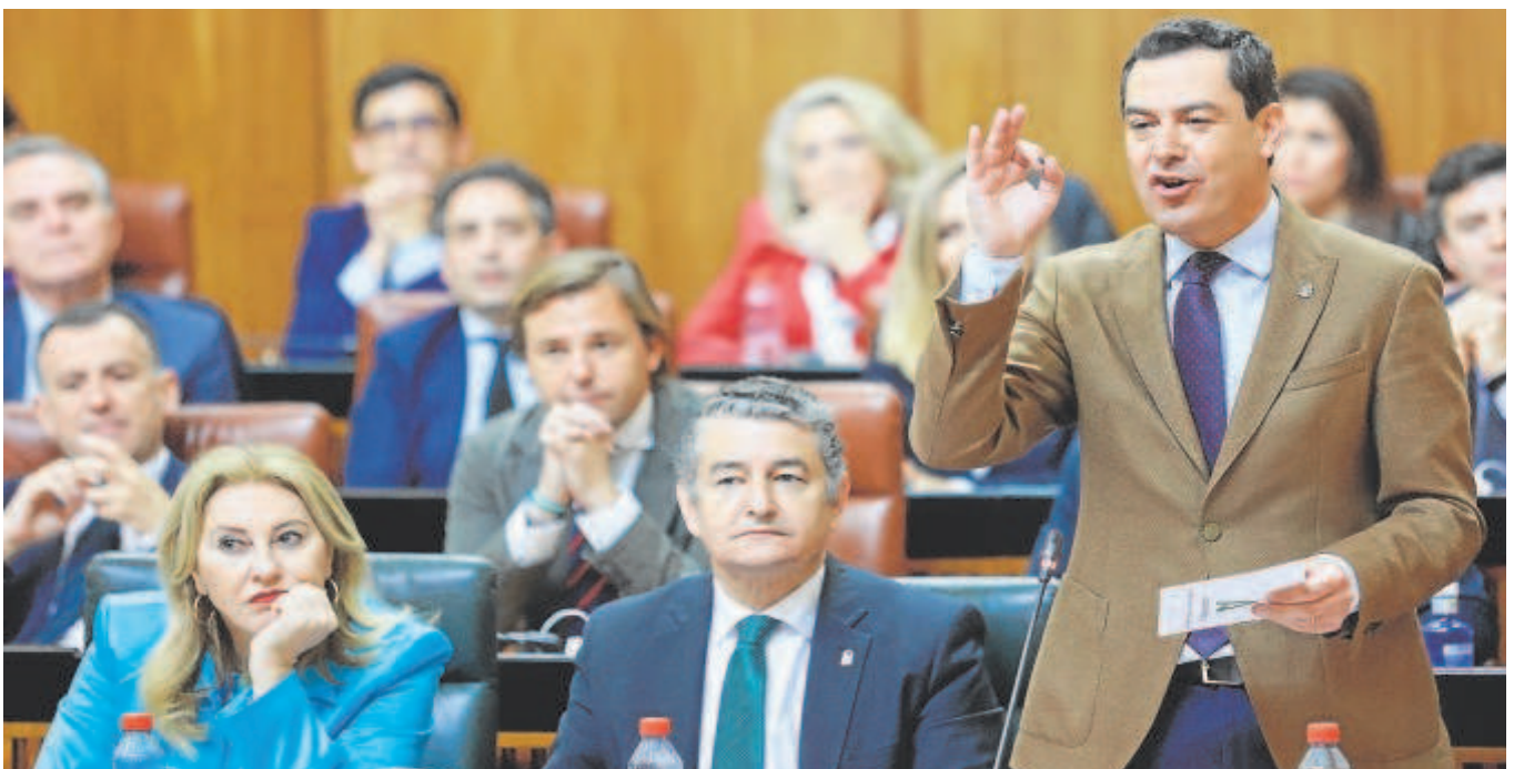
El presidente de la Junta, Juanma Moreno, se dirige al Parlamento andaluz ayer durante el Pleno

Según fuentes de Adelante Andalucía, el diputado calificó a Vox como «partido de maltratadores» porque «al negar permanentemente la existencia de la violencia machista, están en contra de medidas que protegen a las víctimas y la invisibilización. Además, abonan el terreno de los maltratadores porque se posicionan a su lado y no en el de las mujeres y las víctimas», justifican.