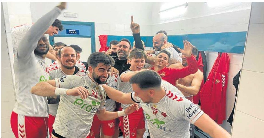
Los jugadores del Proim Bm Triana festejan con euforia el último triunfo del pasado domingo en Almería al llegar al vestuario.

forzar el proyecto del Proim BM Triana en estos momentos trascendentales del curso.