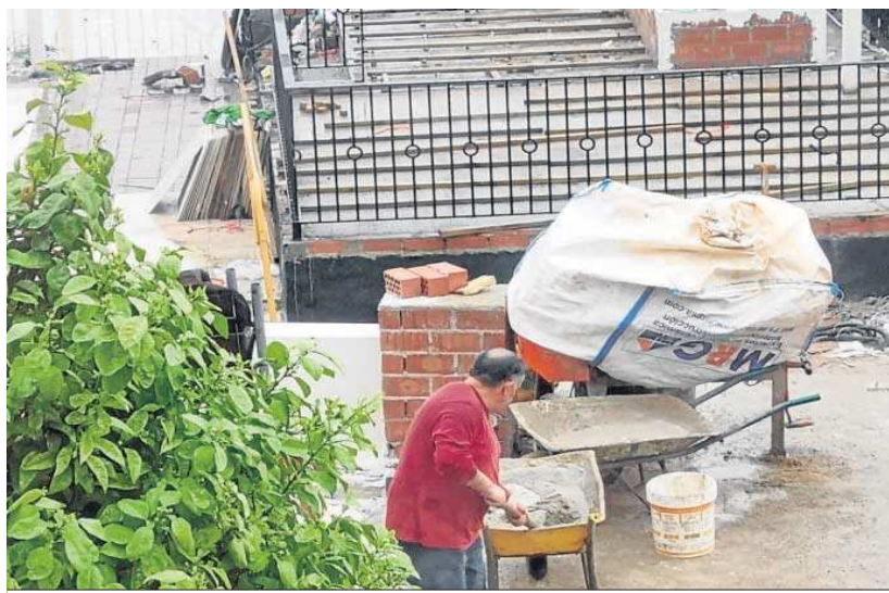
Un operario hace mezcla para completar el muro de la terraza, estos días atrás.

Es la comunidad autónoma (Consejería de Sostenibilidad, Medio Ambiente y Economía