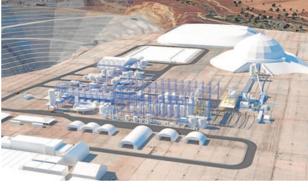
Recreación del proyecto denominado Polymetallurgical Refinery (PMR) de Cobre Las Cruces