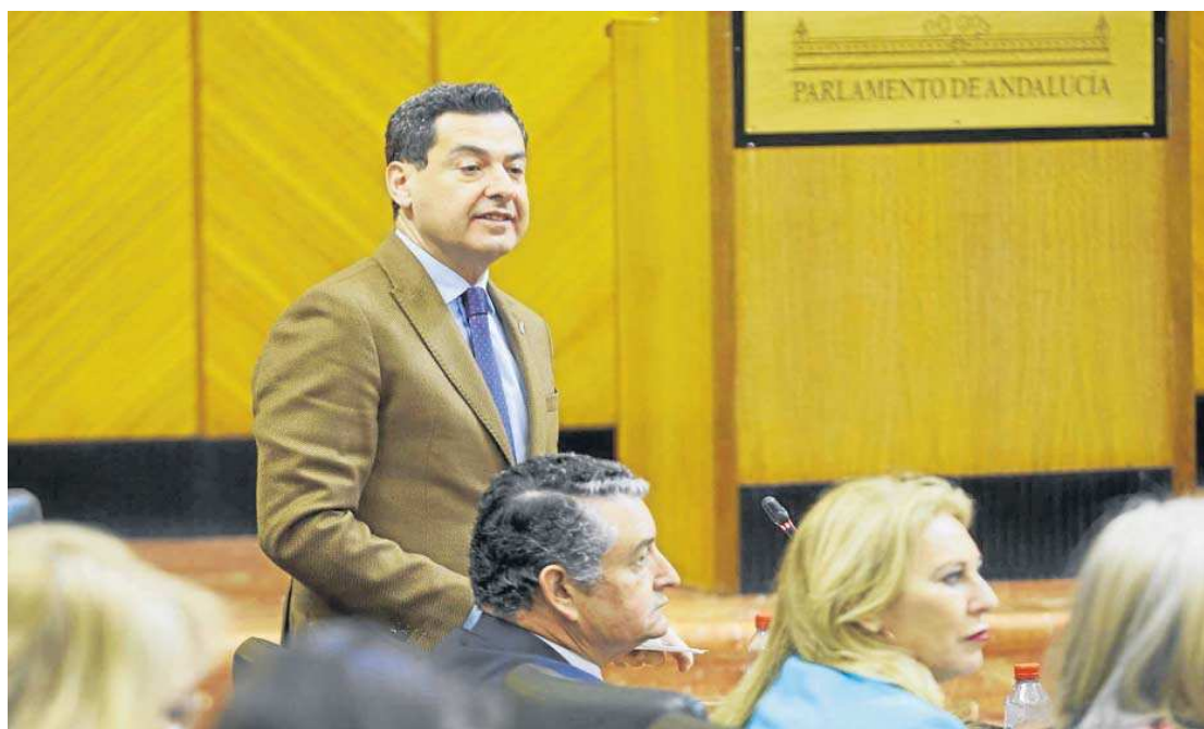
Juanma Moreno, ayer en la sesión de control del Parlamento.