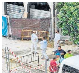
Operarios en la parcela de Río Grande.