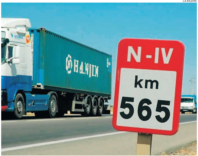
La N-IV, a su paso por la provincia de Sevilla, es una de las carreteras con más siniestralidad de España