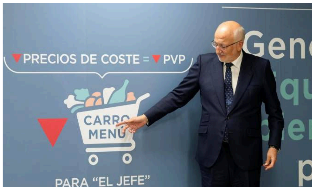
El presidente de Mercadona, Juan Roig.

El presidente de Mercadona, Juan Roig, ha asegurado este martes que la empresa ha subido «una burrada los precios» pero de no haberlo hecho, habría sido «un desastre» , y ha argumentado que hay que hacer sostenible la cadena de montaje.