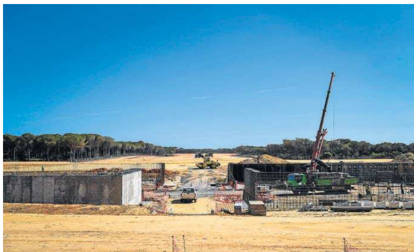
La cimentación de los hangares en primer término con la pista de rodaje y la de aterrizaje al fondo.

El emplazamiento del CEUS, próximo El Arenosillo, tendrá varias ventajas, como contar con los sistemas optrónicos y de radar y las herramientas de comunicaciones y procesado de datos del INTA, la existencia de una zona de exclusión aérea de un millón de hectáreas, las buenas condi-