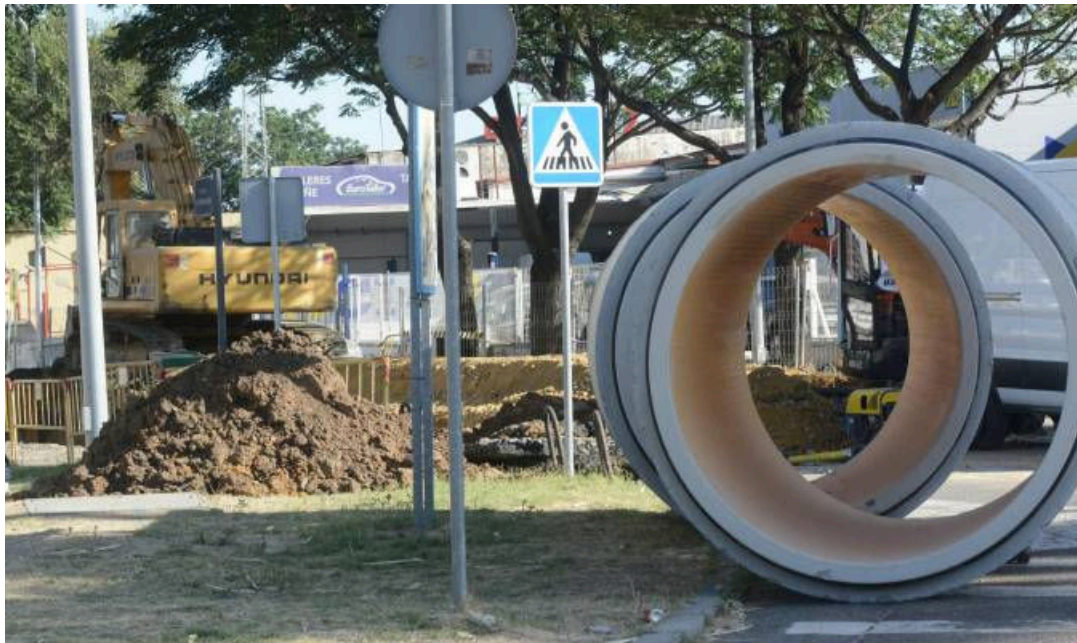
Obras de Emasesa en una imagen de archivo.