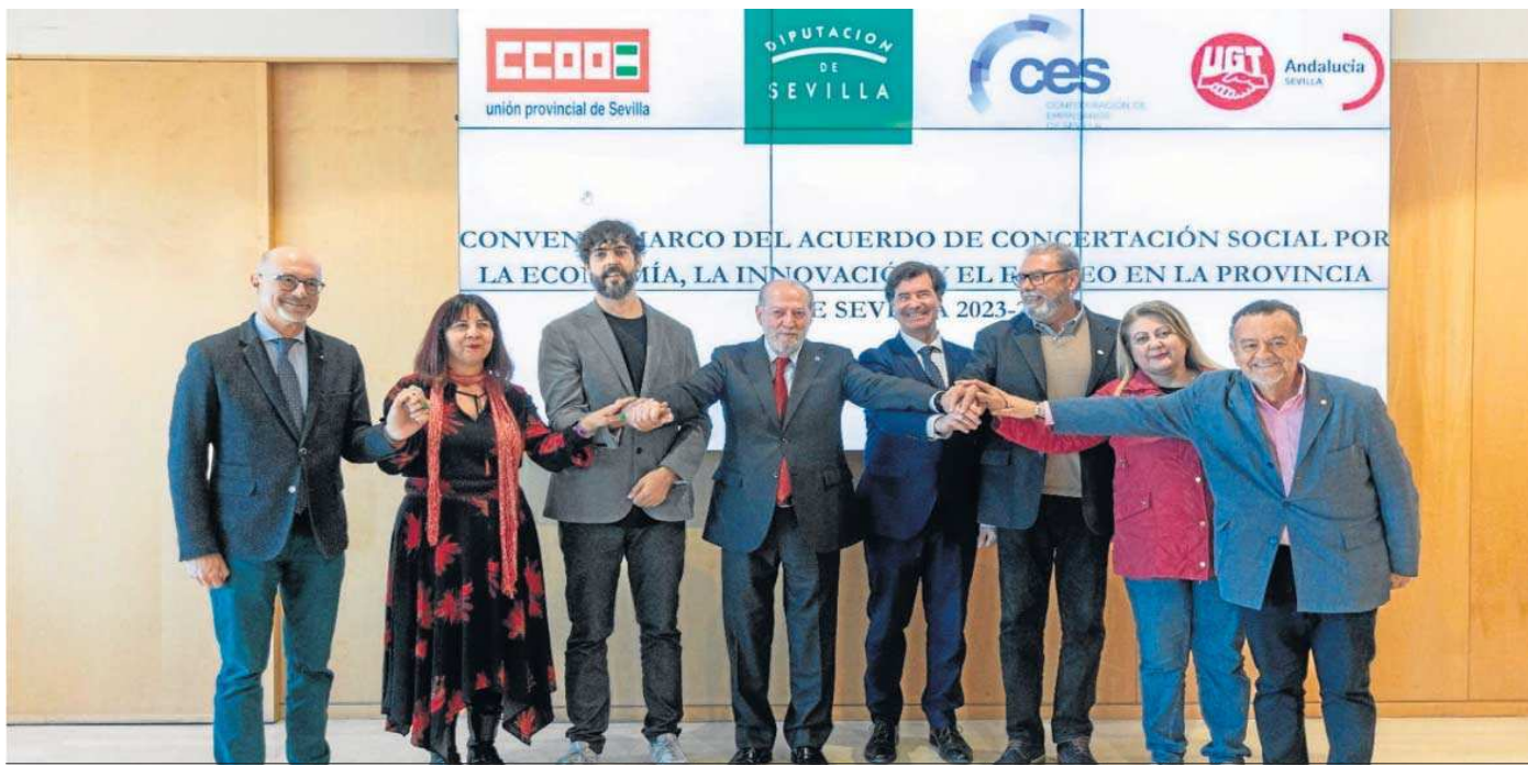
El presidente Villalobos, en el encuentro que ha mantenido este martes con los representantes del sector empresarial y las centrales sindicales, en la sede de la Diputación.