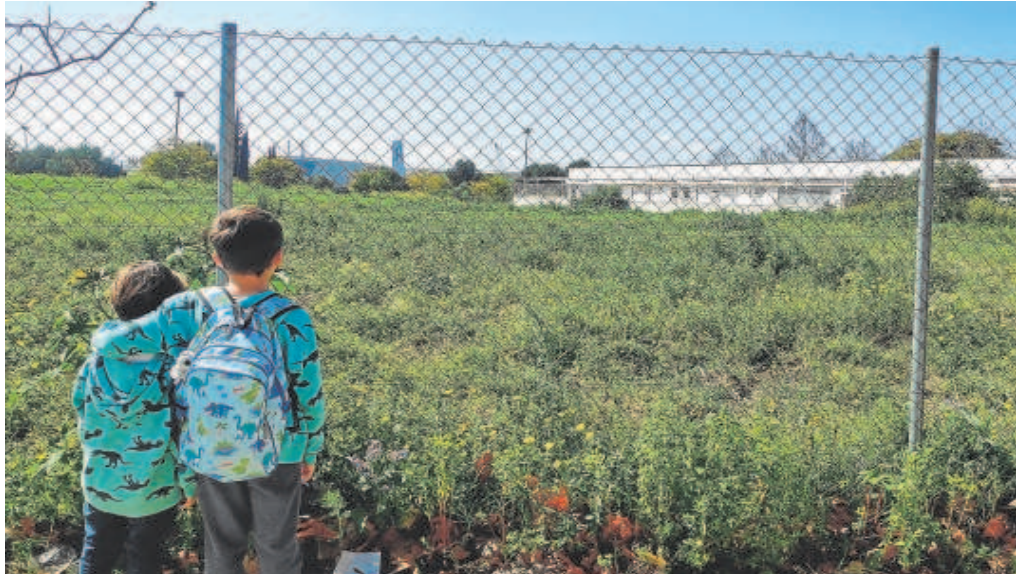
Dos niños frente a la parcela de Los Bermejales donde se proyecta un nuevo instituto