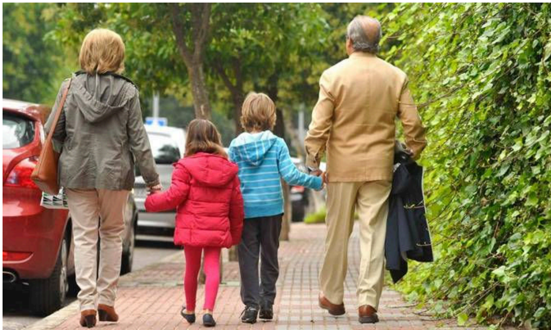
Abuelos con sus nietos.

BBVA Research ha advertido este martes de que la reforma de pensiones planteada por el Gobierno "no garantiza la sostenibilidad del sistema a largo plazo" y ha alertado sobre sus efectos sobre la economía, el empleo y la inversión.