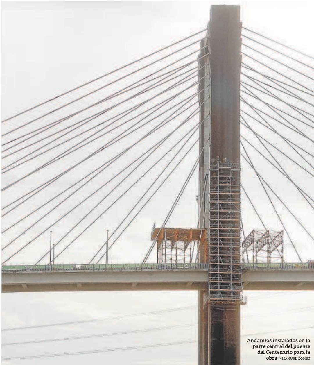
Andamios instalados en la parte central del puente del Centenario para la obra

nelada de acero estaba en 860 euros y hoy alcanza alrededor de los 1.400 euros. También ha subido el coste del hormigón, pero en menos medida.