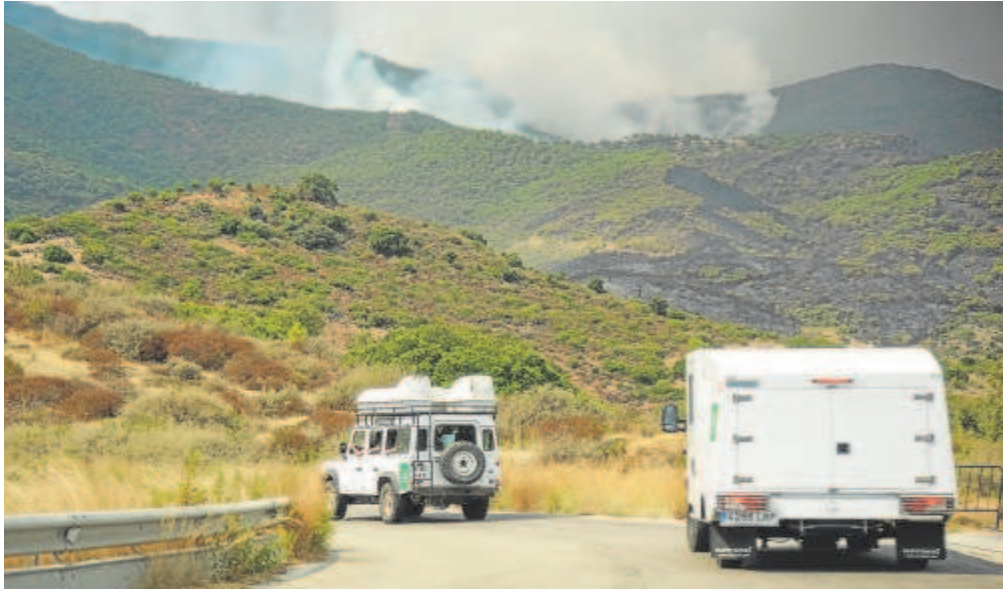
Vehículos empleados por bomberos forestales en el incendio de Sierra Bermeja en Málaga