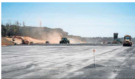
La pista con el tramo de zahorra compactada y la maquinaria trabajando.

La secretaria de Estado de Defensa, Amparo Valcarce, visitó este lunes las obras para ver su avance y verificar que se cumplirán los plazos. Se trata de un proyecto transversal que cuenta con el impulso del Gobierno central a través del INTA (Defensa) y el CDTI (Ciencia), la Junta de Andalucía y la colaboración del Ayuntamiento de Moguer, como destacó Valcarce. Con esta obra "impulsamos que Moguer se posiciona dentro del polo aeronáutico de Andalucía con el corredor de industrias ubicadas entre Sevilla y la Bahía de Cádiz". Defensa valoró la ubicación especial del CEUS "con un millón de metros cuadrados de exclusión aérea, que es esencial para cualquier centro de ensayos". Las horas de luz y la climatología redundan en la idoneidad del espacio. La secretaria de Estado de Defensa recordó que el CEUS estará al servicio de "la iniciativa pública y también privada". En sus pistas "muchas empresas vendrán a probar sus prototipos así como el mantenimiento de sus equipos". El Gobierno entiende que "toda la importante industria auxiliar de Huelva ten-