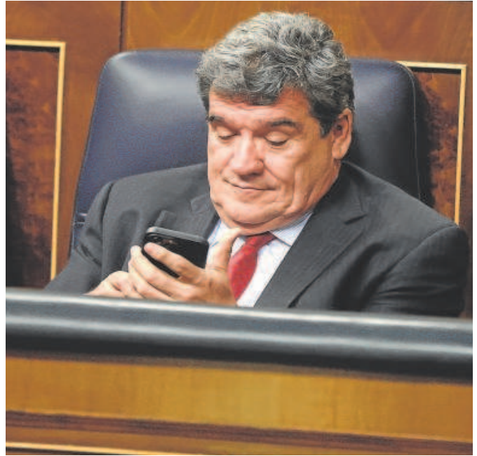
El ministro Escrivá en el Congreso// JAIME GARCÍA

El pacto entre Escrivá y Podemos desbarata el mecanismo de equidad intergeneracional (MEI), aprobado en la primera fase de la reforma, y que en su configuración estaba llamado a sostener el sistema. Este mecanismo sube un 0,6% las cotizaciones (0,5% a cargo de la cuota empresarial y 0,1% a cargo del trabajador). Y a partir de la entra-