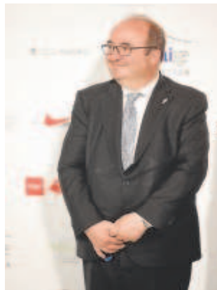
Miquel Iceta

La proposición no de ley –la herramienta que tienen los grupos parlamentarios para instar al Gobierno a realizar una política determinada– fue rechazada por una amplia mayoría. Solo siete diputados (de Podemos y del Grupo Plural) votaron a favor, por 28 que la rechazaron (entre ellos, PSOE, PP y Vox, en una imagen poco habitual) y otro diputado se abstuvo. La iniciativa pretendía derogar la ley que regula la tauromaquia como patrimonio cultural, suprimir las medidas de fomento y protección de estos espectáculos por parte de los poderes políticos, suprimir el premio Nacional de Tauromaquia, eliminar la concesión de las Medallas de Bellas Artes para los toros y acabar con cualquier for-