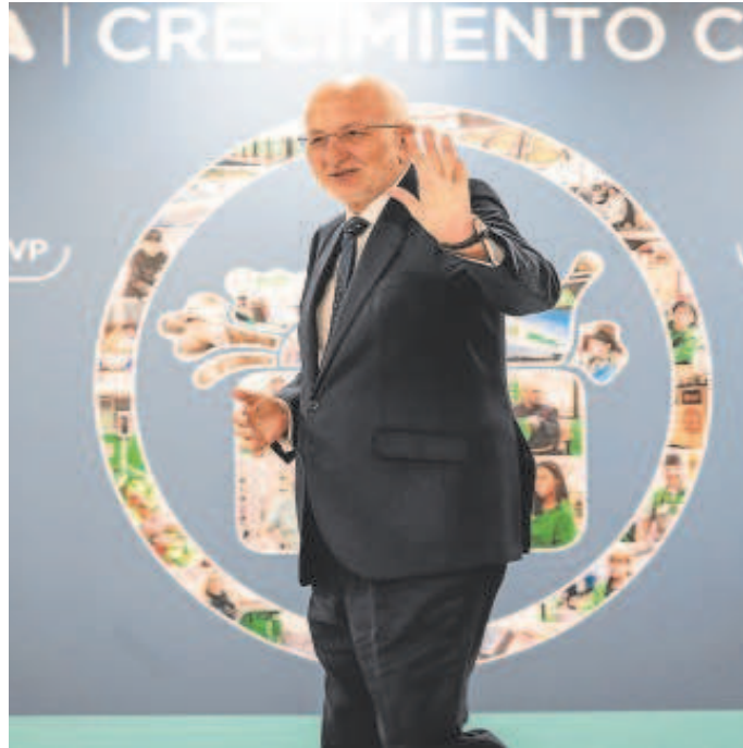
Imagen del presidente de Mercadona, Juan Roig, tomada ayer

de incremento los costes a sus proveedores y subió un 10% los precios en sus supermercados. Al respecto, Juan Roig mostró su «preocupación» por la escalada de la inflación, que afecta especialmente a sus clientes de rentas más bajas. El presidente de Mercadona admitió que, «si te pasas, los consumidores se marchan».