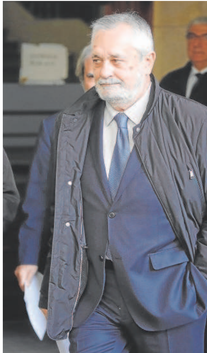
El expresidente de la Junta de Andalucía José Antonio Griñán

«Son múltiples los pacientes que desde las distintas especialidades han sido y son atendidos de forma conti-