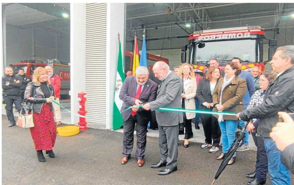
Momento del acto de inauguración del nuevo Parque de Bomberos de Écija, con el presidente de la Diputación de Sevilla, Fernando Rodríguez Villalobos.