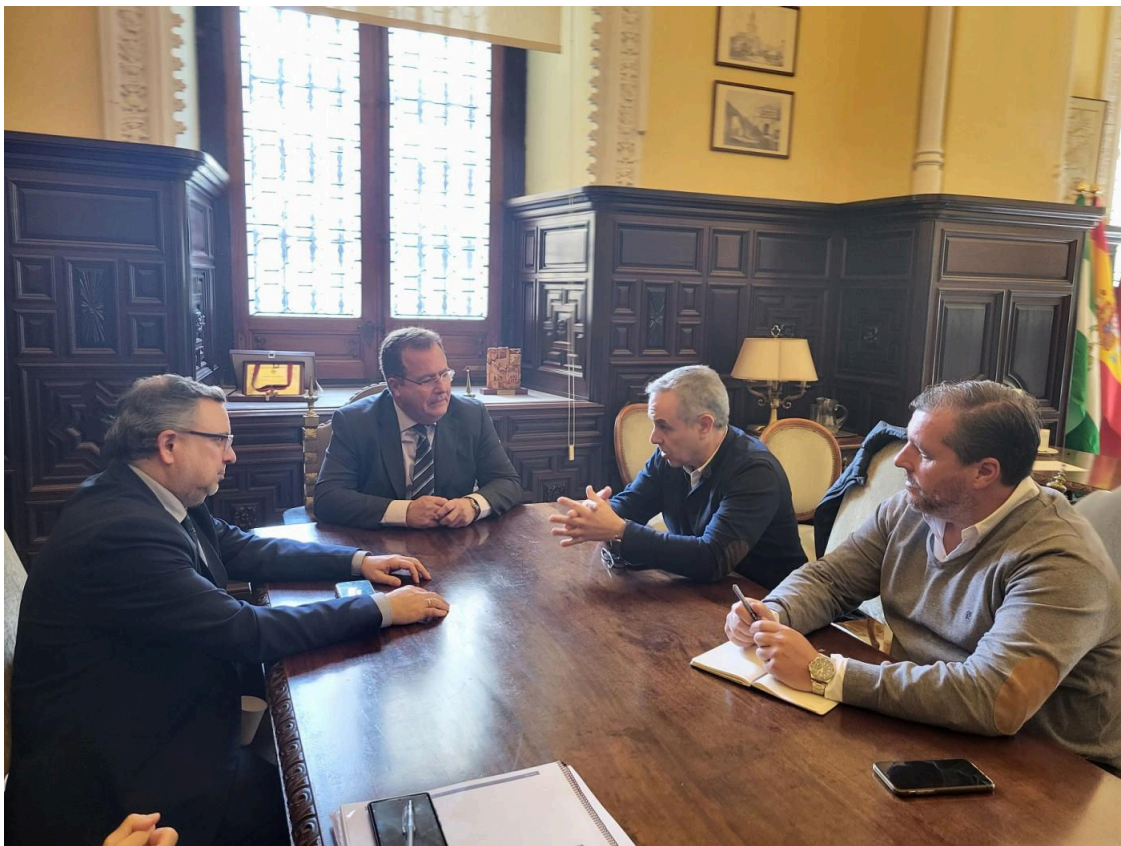
Un momento de la reunión.