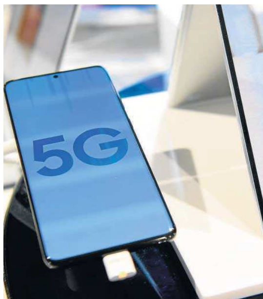
El foro sirve para dar a conocer los avances en la tecnología 5G.

Cabe destacar la gran relevancia a nivel mundial que ha logrado el 5G Forum , fruto del "buen hacer" en las cinco ediciones previas. La pasada edición contó con el respaldo de patrocinadores de distintas multinacionales de numerosos países del mundo, como Qualcomm, Cisco, Tesla, Huawei, Toshiba, Telefónica, Axión y RTVE, entre otras. Asimismo, el pasado 5G Forum tuvo el lujo de contar con la asistencia de alguna de las