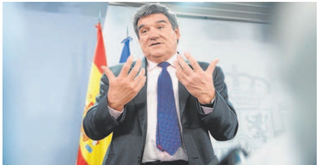
El ministro de Inclusión, Seguridad Social y Migraciones, José Luis Escrivá

La reforma elevará hasta 1.200 euros en doce pagas (15.120 euros brutos anuales) la pensión mínima de jubilación durante los próximos cuatro años. «Desde 2027 la cuantía mínima de la pensión de jubilación contributiva para un titular mayor de 65 años con cónyuge a cargo no podrá ser inferior al umbral de la pobreza calculado para un hogar compuesto por dos adultos», relata el texto. La Seguridad Social detalla que se multiplicará por 1,5 el umbral de la pobreza correspondiente a un hogar unipersonal en los términos concretados para España en el último dato disponible de la Encuesta de Condiciones de Vida del INE.