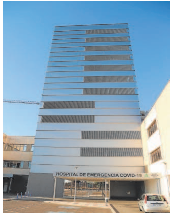
Imaen de una entrada lateral del antiguo Hospital Militar