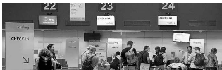
Viajeros en la facturación de equipajes. JOSÉ ÁNGEL GARCÍA

Los mercados foráneos que más crecen en esta temporada en términos de plazas ofertadas por las compañías respecto a 2019 son Irlanda (+122%), Portugal (+73%) y Marruecos (+46%). Respecto a Portugal, en verano, numerosos pasajeros hacen conexión con Lisboa para viajar a