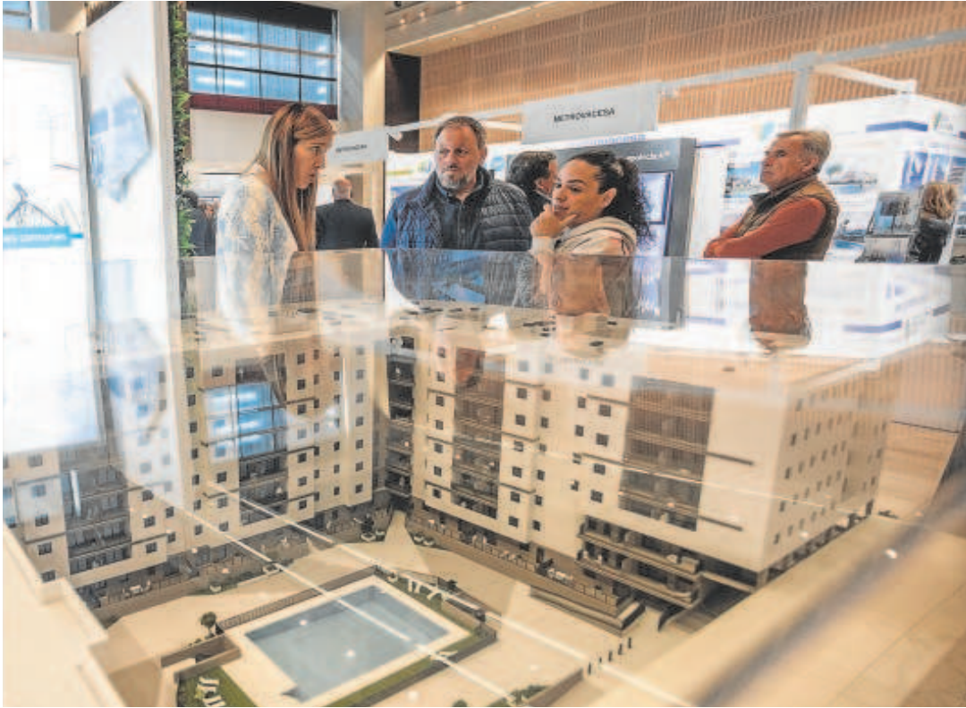
a Welcome Home Sevillana

Distribuido para CONFEDERACIÓN DE EMPRESARIOS DE SEVILLA * Este artículo no puede distribuirse sin el consentimiento expreso del dueño de los derechos de autor