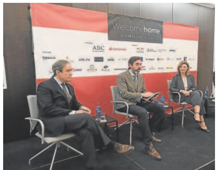
Los participantes de la mesa redonda 'Situación del mercado inmobiliario'

Durante el acto, la secretaria general de Vivienda desgranó algunas de