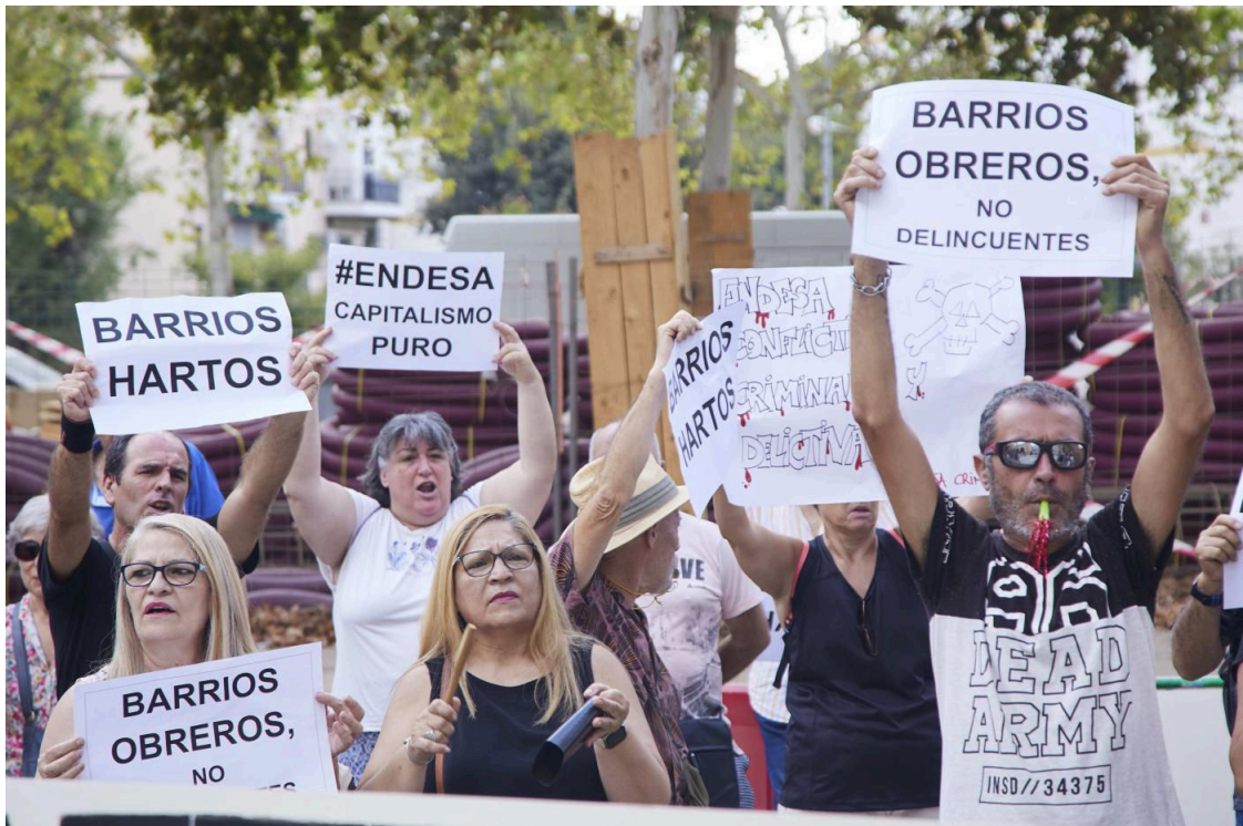
Protesta contra los cortes de luz.