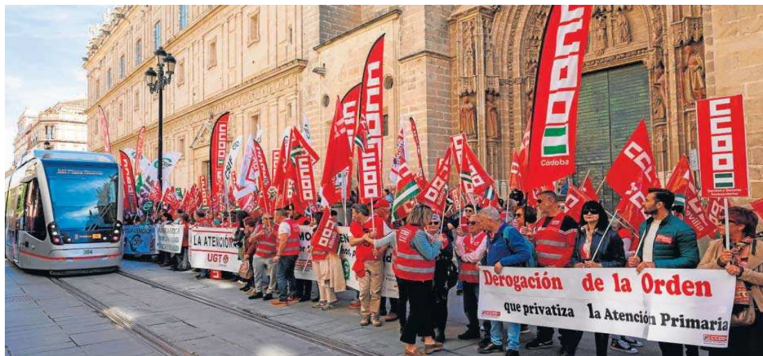
Protesta de los sindicatos sanitarios, ayer, frente a la Catedral Sevilla.