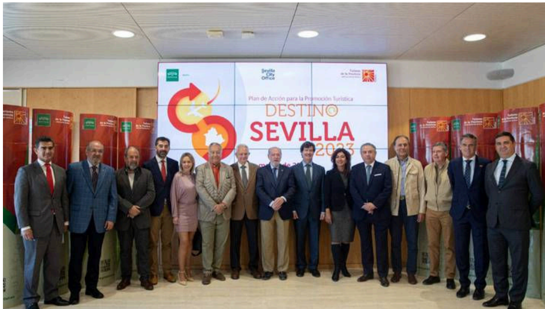
Presentación "Destino Sevilla" en la Diputación provincial de Sevilla