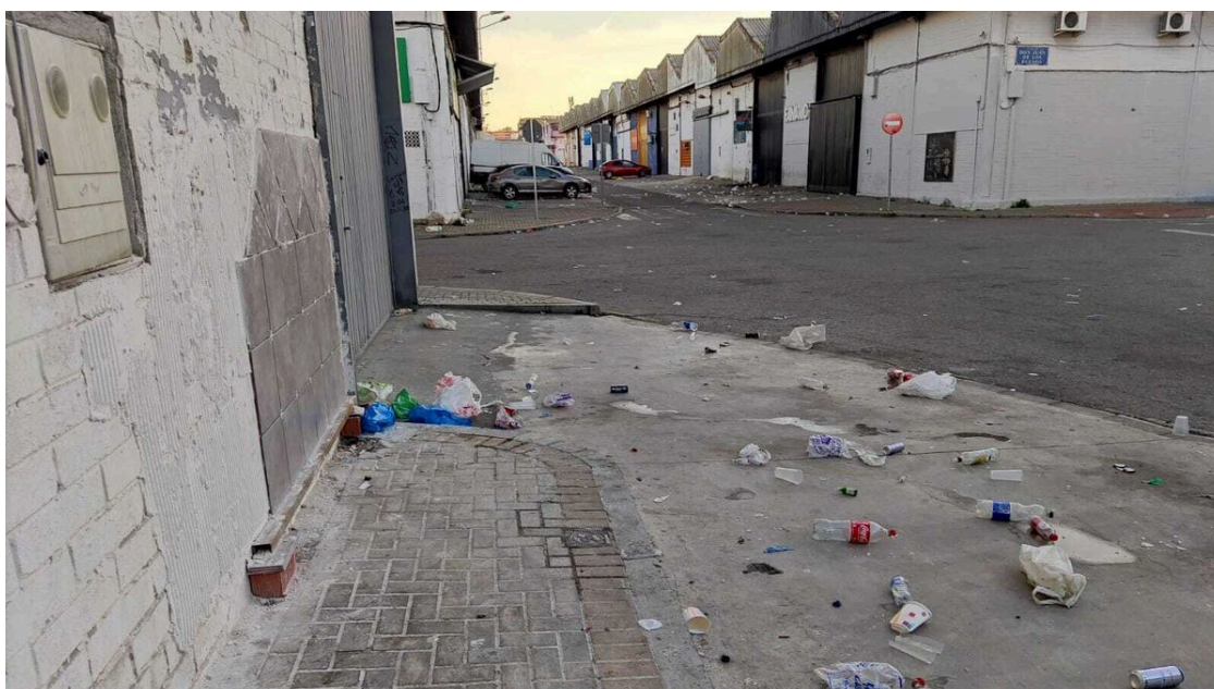
Restos de botellona en las calles del Navisa.

Los propietarios del polígono industrial Navisa se encuentran indignados ante la "difícil situación" que afrontan debido a la suciedad y el vandalismo. Desde hace años, la botellona es uno de los problemas que sufren en este importante centro económico y de empleo de la ciudad, según aseguró la Asociación de Parques Empresariales de Sevilla en una nota de prensa.