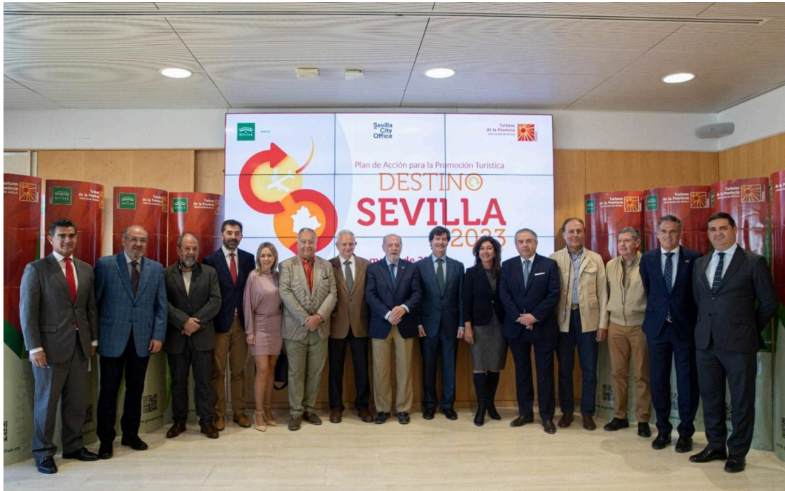
Villalobos y el tejido empresarial de la provincia. - DIPUTACIÓN

El presidente de la Diputación de Sevilla, Fernando Rodríguez Villalobos se ha reunido este jueves con el presidente de la Confederación de Empresarios de Sevilla (CES), Miguel Rus, y con los presidentes y gerentes de las asociaciones empresariales turísticas de la provincia, con las que Prodetur ha elaborado un programa de actuaciones de promoción del territorio en distintos destinos nacionales e internacionales.