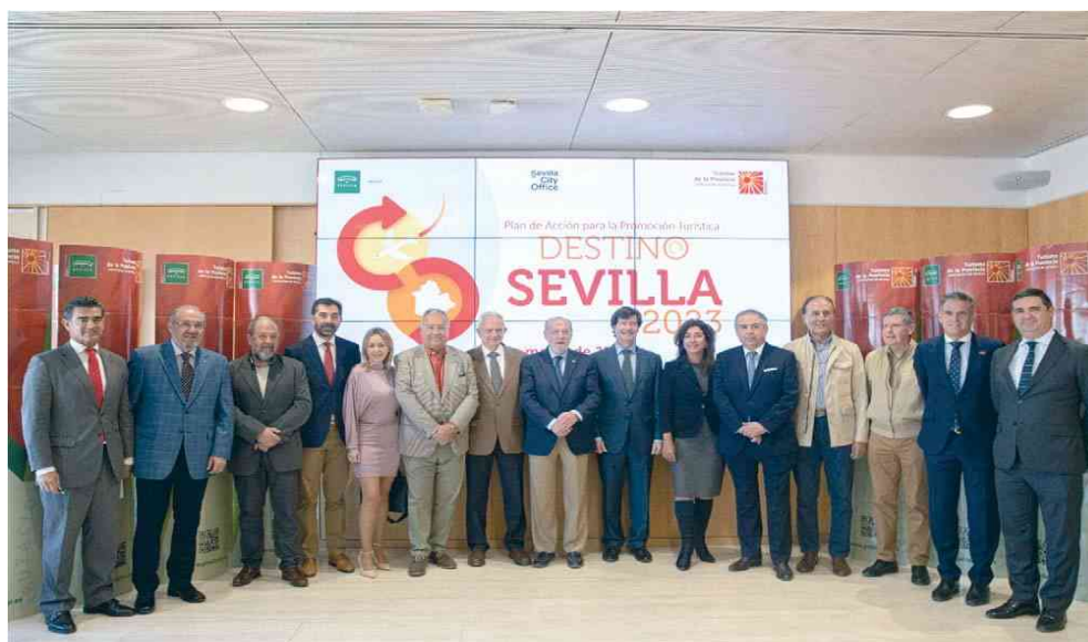
La foto de familia de la presentación del nuevo programa de acciones de promoción turística.