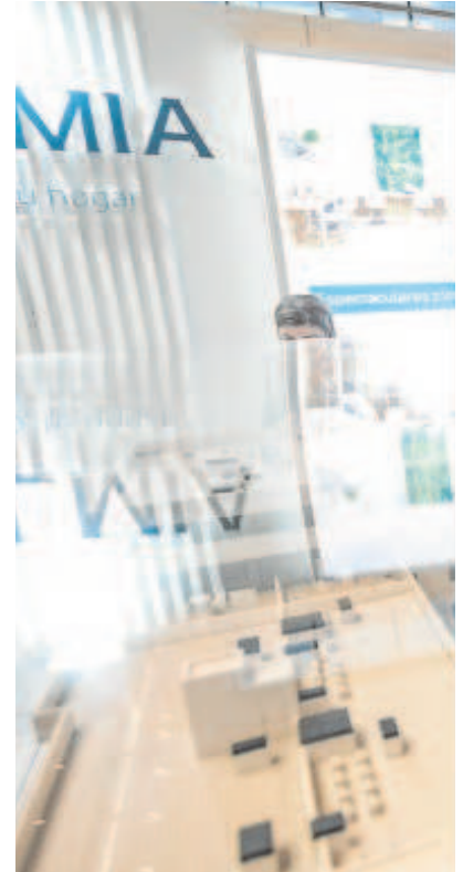
El público puede asistir de forma gratuita

lución por la poca producción», auguró Pumar, que consideró que la mayoría de las promotoras tienen una tasa de cobertura de ventas muy elevada.