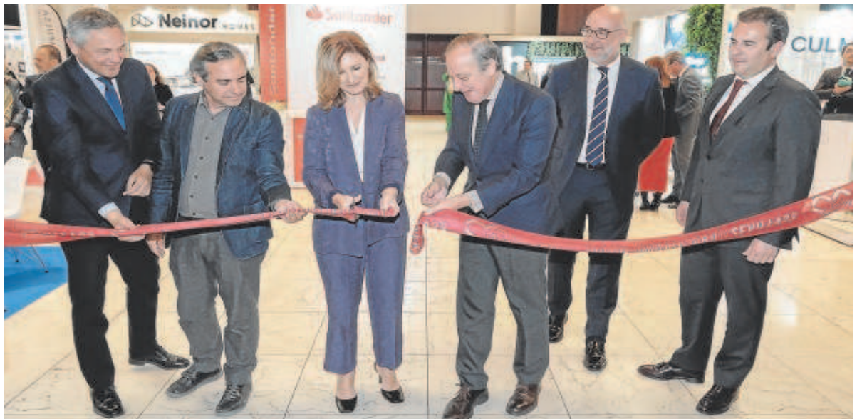
Inauguración de la novena edición del salón inmobiliario