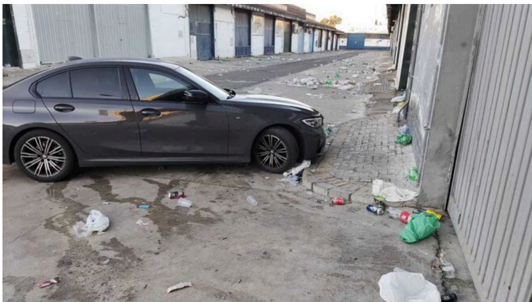
Estado habitual de una de las calles del polígono Navisa.

Los propietarios del polígono industrial Navisa se encuentran indignados ante la "difícil situación" que afrontan debido a la suciedad y el vandalismo. Desde hace años, la botellona es uno de los problemas que sufren en este importante centro económico y de empleo de la ciudad, según aseguró la Asociación de Parques Empresariales de Sevilla en una nota de prensa.