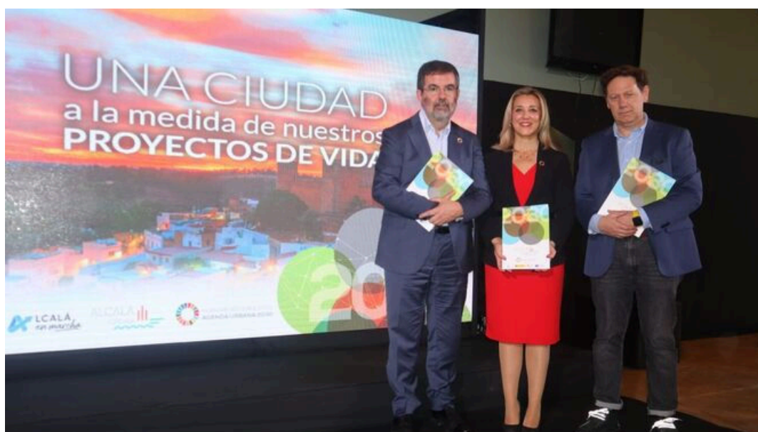
Alcalá presenta su Agenda Urbana 2030 para transformar la ciudad y afrontar los retos del futuro