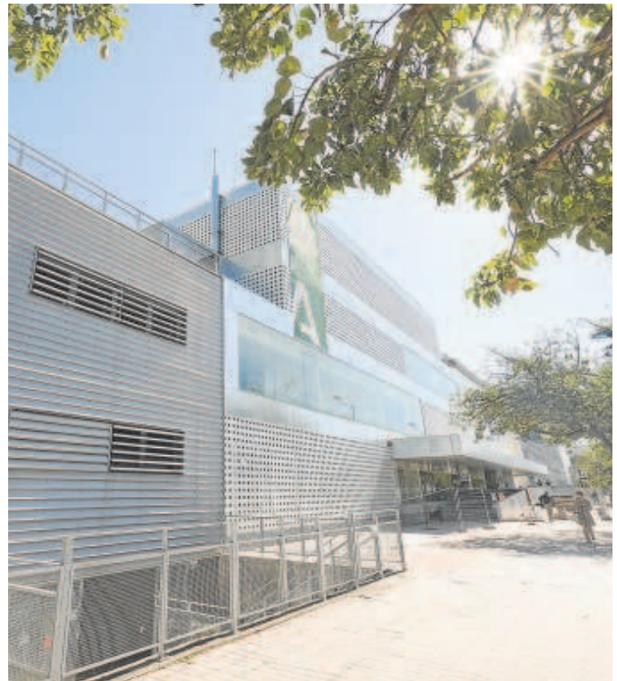
Las obras en el nuevo hospital están a punto de concluirse

En la segunda fase se terminarán los quirófanos y las plantas subterráneas del edificio de tres plantas