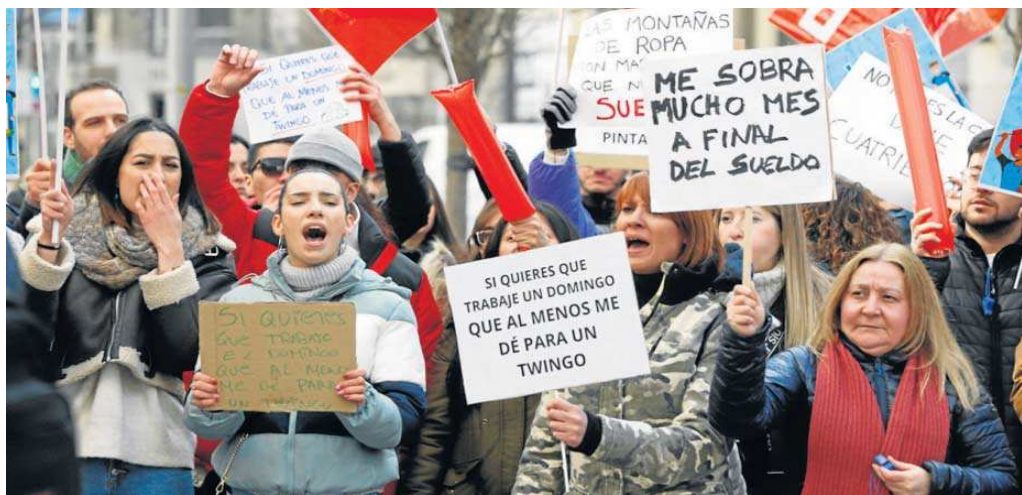
Concentración de trabajadores de Primark, ayer en Madrid.