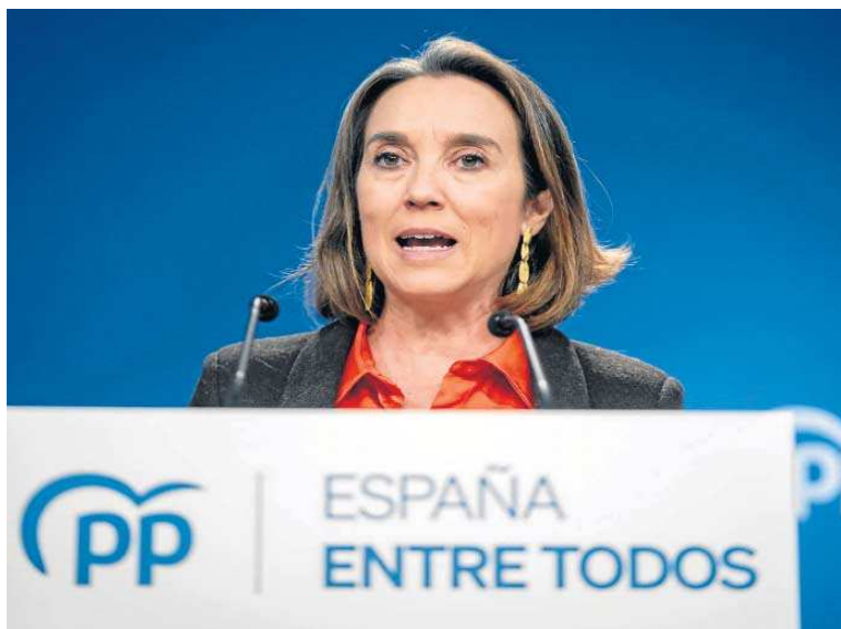
La portavoz del Partido Popular, Cuca Gamarra, durante una rueda de prensa.

Por su parte, la dirección del grupo parlamentario socialista en el Congreso ha enviado un escrito a sus diputados en el que asegura que defenderá a los que están siendo "señalados de manera intencionada y totalmente injusta" con motivo del caso Mediator y les