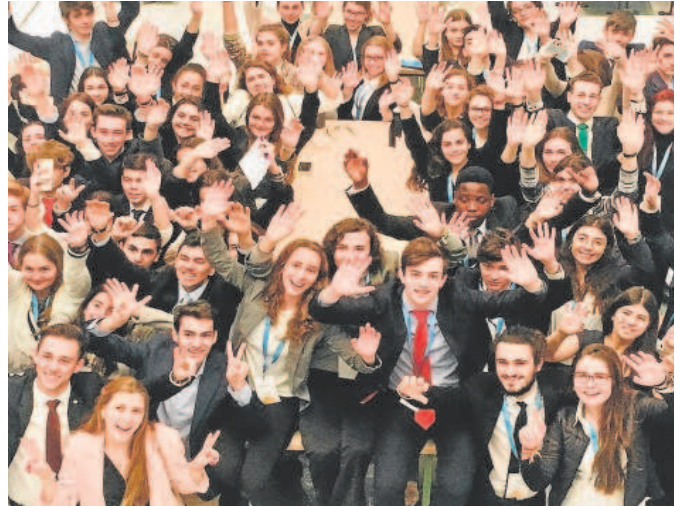
Participantes del Joven Parlamento Europeo //ABC

Con la colaboración de la Cámara de Comercio de Sevilla y el Ayuntamiento de Sevilla, el debate final junto con la asamblea general se celebrará en el espacio de la Fábrica de Sevilla en los bajos de Marqués de Contadero, contando con la presencia de representantes de estas instituciones. La Fábrica de Sevilla impulsa la creación de startups tecnológicas en la ciudad y el Joven Parlamento Europeo reconoce dentro de los ocho retos de análisis que se debaten en toda Europa y dentro del reto 3, la importancia del desarrollo de Startups Tecnológicas europeas y los ejemplos de colaboración público privados ha-