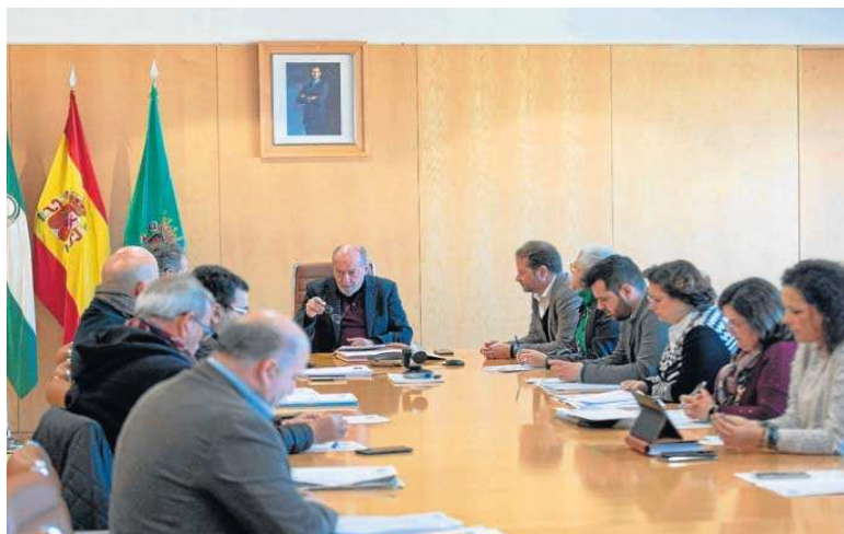
Un instante de la junta de Gobierno de la Diputación en el que se ha aprobado esta convocatoria de subvenciones.

El Plan Estratégico del Área de Concertación para el año 2022-2023 establece entre las líneas de subvenciones que se desarrollarán en el mismo y para esta anualidad una línea para el "impulso a la colaboración con Asociaciones, Uniones, Agrupaciones Empresariales, Sindicatos o Entidades de Derecho Privado sin ánimo de lucro, así como Mancomunidades que realicen actividades de interés local para el Desarrollo Socioeconómico en el ámbito municipal o/y provincial".