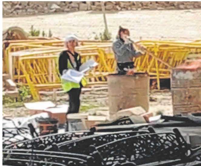
Captura del vídeo donde dos personas queman documentos en Marchena