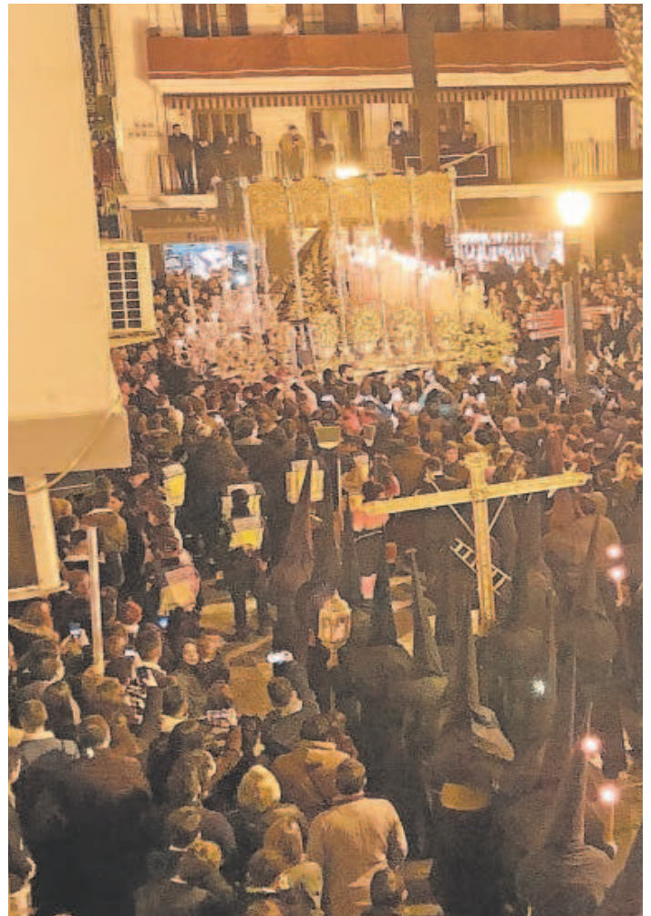
El cruce de la Esperanza de Triana con el Gran Poder en San Pablo

Por otro lado, y en un tono mucho más colaborativo, San Roque y la Amargura tratarán de fijar unos horarios y un ritmo de paso que garanticen a esta última la salida en hora de la Catedral. El ritmo de la de San Juan de la Palma era alto al regreso al no tener a nadie por delante. Y, tradicionalmente, el de San