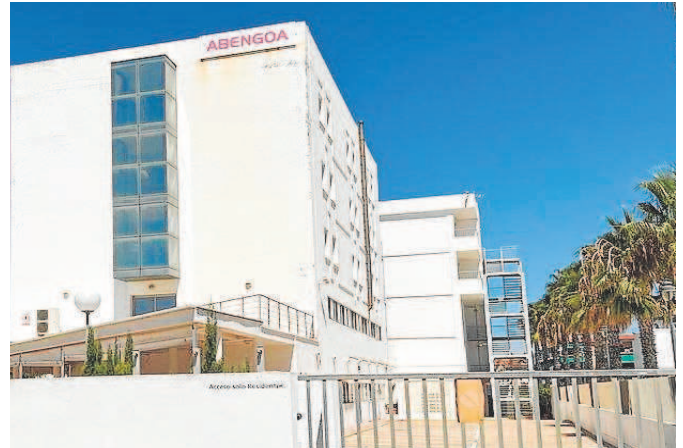
La residencia que Abengoa tenía para sus trabajadores

Este 'hotelito' se había destinado al uso vacacional de los empleados de la multinacional andaluza y se encuentra a escasos dos minutos a pie de la playa. El inmueble, que no está operativo desde hace más de cinco años, tuvo un valor de adquisición de