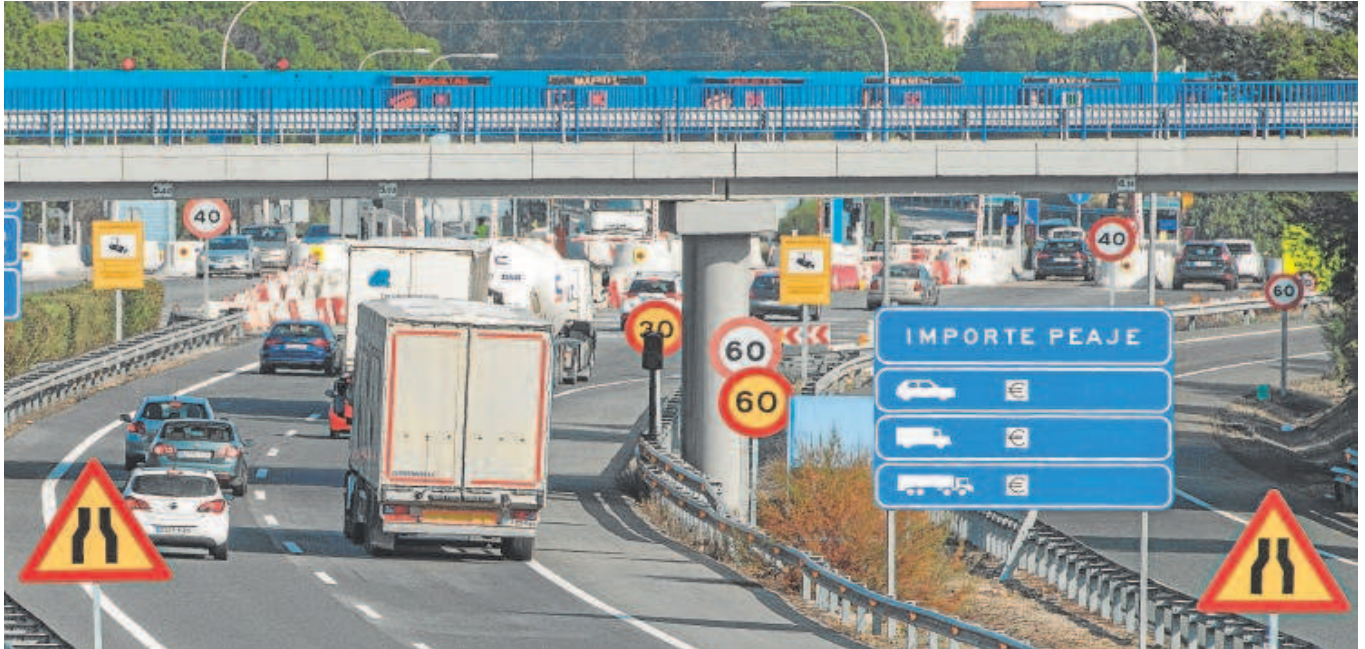
Imagen de archivo de las antiguas cabinas de cobro del peaje de la autopista del Sur, a la altura de Las Cabezas de San Juan