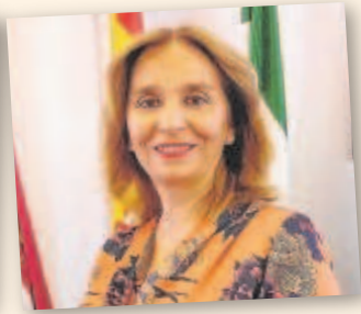
ANGELINES GARCÍA Alcaldesa de Cantillana durante 11 años