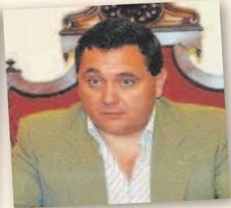
JOAQUÍN FERNÁNDEZ GARRO Alcalde de Umbrete durante 20 años