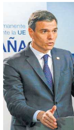
El presidente Pedro Sánchez.

Además, recordó que se han incorporado por primera vez en