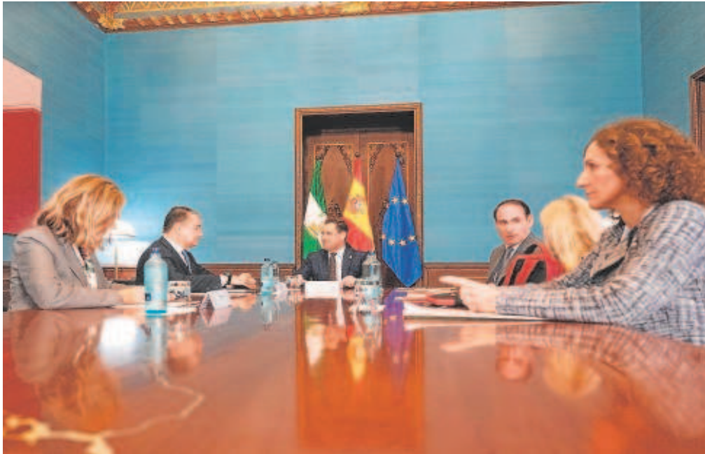
Juanma Moreno preside la primera reunión del pacto, que tuvo lugar en San Telmo el pasado 21 de noviembre

Distribuido para CONFEDERACIÓN N DE EMPRESARIOS DE SEVILLA * Este artículo no puede distribuirse sin el consentimiento expreso del dueño de los derechos de autor.