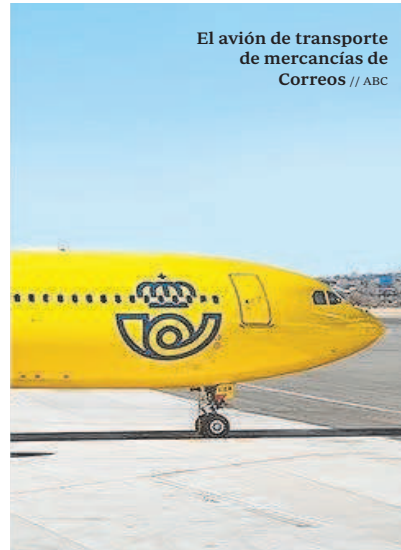
El avión de transporte de mercancías de Correos // ABC

ingresos brutos esperados llegaban a cerca de 52,5 millones de euros, pero finalmente fueron de 9,7 millones. Es decir, facturó cinco veces menos de lo estimado en un principio. Algo que esperaban conseguir al ingresar 252.216 euros de media por frecuencia, pero finalmente generaron 125.503 euros por cada vez que el avión iba y venía desde Madrid a Hong Kong.