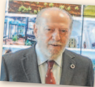
FERNANDO RODRÍGUEZ VILLALOBOS Presidente de la Diputación de Sevilla durante 19 años