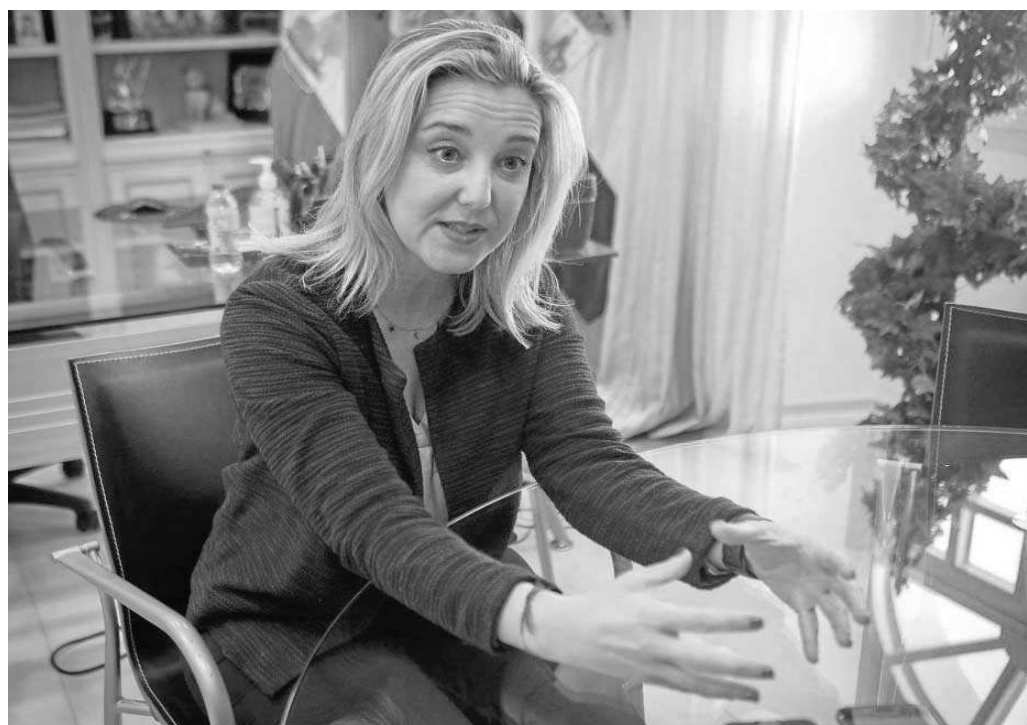
Ana Isabel Jiménez durante la entrevista en su despacho.

● Aspira a revalidar la Alcaldía en las elecciones del 28 de mayo y lograr suficientes apoyos para gobernar en solitario, sin pactos con otras fuerzas políticas