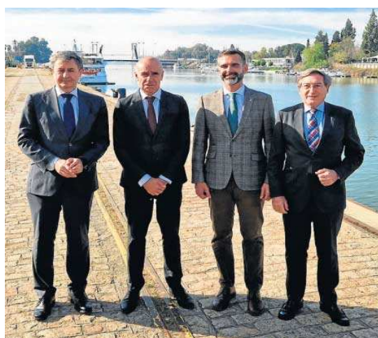
Las autoridades, ayer en las instalaciones portuarias.

En este sentido, concretó que está previsto licitar la mejora del alumbrado del puerto con el cambio de luminaria a led en zonas como la esclusa, los muelles de Armamento y Batán Norte, el polígono industrial de Astilleros