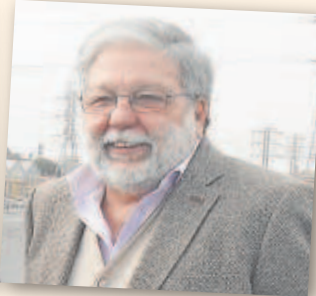
FRANCISCO TOSCANO Alcalde de Dos Hermanas durante 38 años