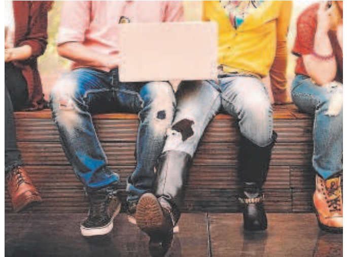
ESIC y ABC de Sevilla ofrecen prácticas en empresas a 25 candidatos

A través de talleres dinámicos y charlas formativas, los jóvenes seleccionados, podrán saber de primera