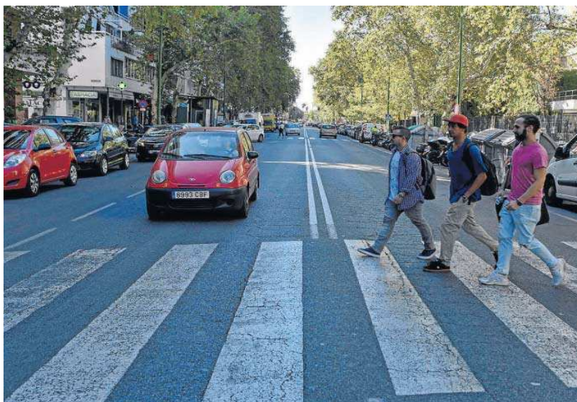
Tres jóvenes cruzan un paso de peatones de la avenida Reina Mercedes.

Además, la oportunidad que ofrecen las cubiertas del conjunto de almacenes, naves y tinglados existentes (308.219 m 2 de techo para nuevas actividades económicas en la zona portuaria