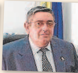
CARLOS LÓPEZ BARRERA Alcalde de Alcolea durante 27 años