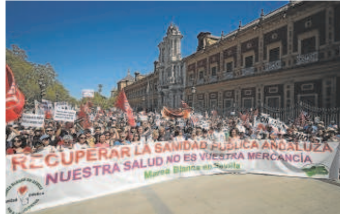
Manifestación en Sevilla para reclamar mejoras en la sanidad