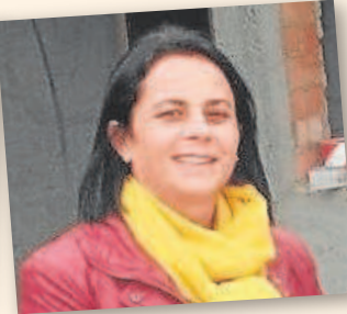
ISABEL MARÍA ROMERO Alcaldesa de Algámitas durante 12 años