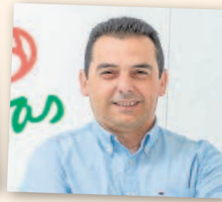
BASILIO CARRIÓN Alcalde de Casariche durante 12 años