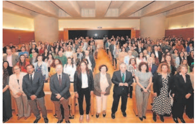
Foto de familia de los responsables de proyectos

A nivel municipal, los proyectos seleccionados se desarrollarán en 85 localidades andaluzas distintas, 18 de ellos en la provincia de Sevilla. La ciudad de Sevilla, con 54 iniciativas se-