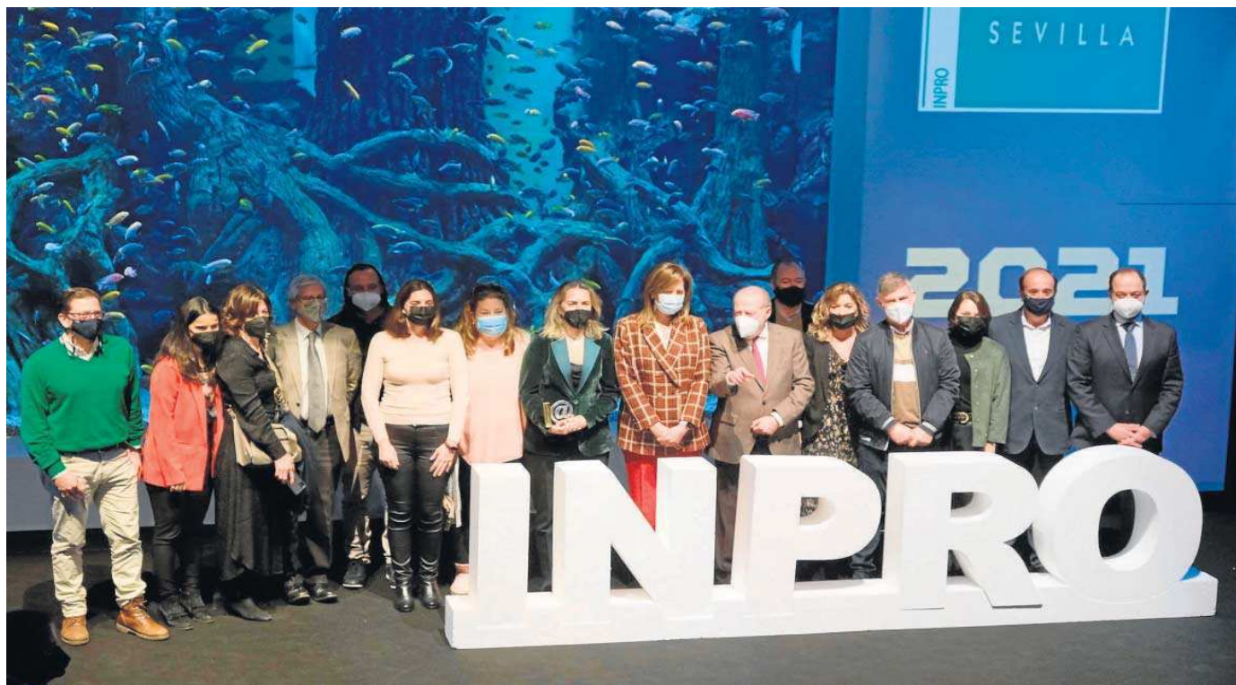
Imagen de archivo de la entrega de premios en febrero de 2022, con el presidente de la Diputación de Sevilla en el centro.