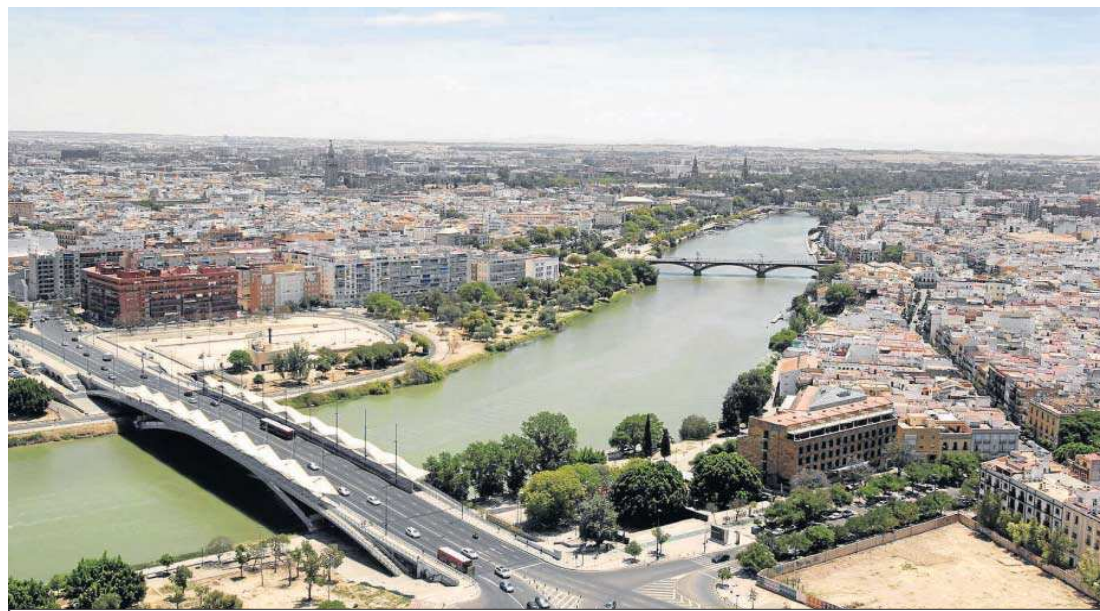
Vista panorámica de la ciudad en torno al Guadalquivir.