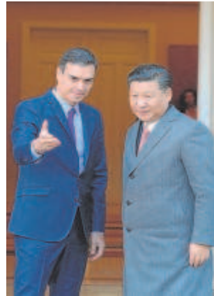
Sánchez y Xi Jinping

Y es que si el presidente del PP, Alberto Núñez Feijóo , se hizo el sueco haciendo coincidir la moción de censura con una visita a la Embajada de aquel país, Sánchez