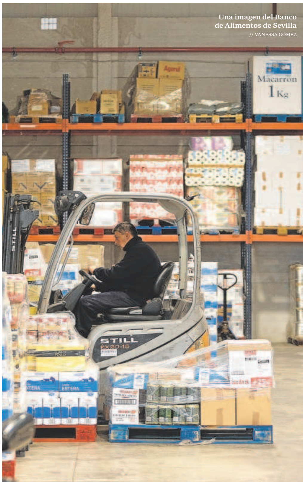
Una imagen del Banco de Alimentos de Sevilla