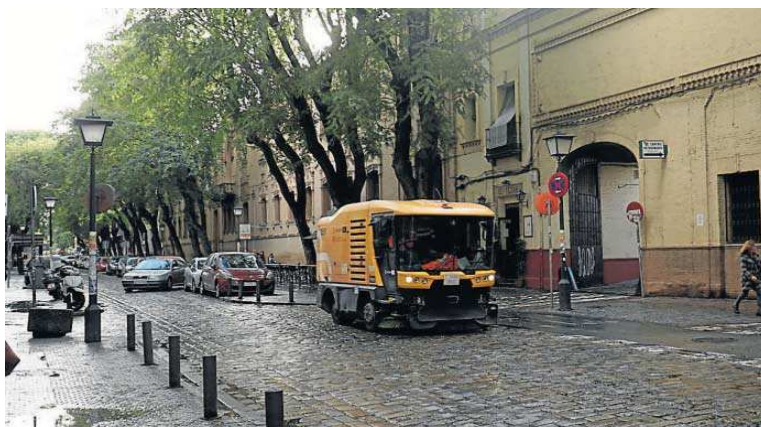
Un vehículo de Lipasam circula por la calle San Jacinto.

En concreto, atañe a la contratación de una asistencia técnica para el diseño técnico, la redacción y el estudio de viabilidad económico-financiera de los proyectos para ambos aparcamientos y la intervención en San