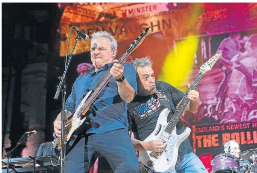
Los Hombres G durante el concierto que ofrecieron en la segunda edición del Icónica Fest.

Dentro de estos mismos datos se recogieron los 98.423 asistentes que tuvo el evento durante 2022 (sin contar los asistentes al evento paralelo Icónica Lights),