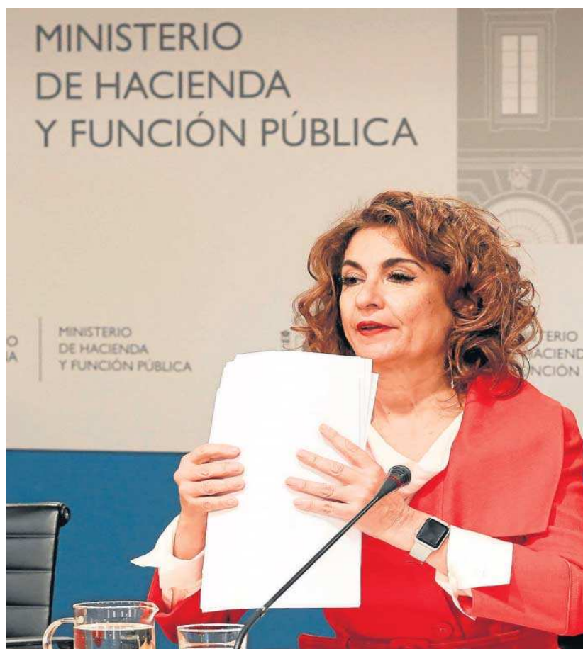
La ministra de Hacienda y Función Pública, María Jesús Montero, ayer en rueda de prensa.

Dentro de la evolución de los ingresos públicos, destaca el incremento del 20,8% del Impuesto de Sociedades, hasta los 32.176 millones de euros, ante el buen comportamiento de los beneficios empresariales tanto en