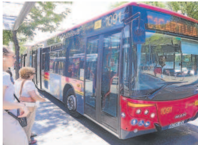
Tussam prestará servicio durante toda la Semana Santa

La petición se trasladó a las autoridades pertinentes y la Junta informó de los servicios mínimos, que en este caso debían alcanzar el 70%, al tratarse de horas punta. Los paros parciales no se iban a quedar sólo en la Semana Santa, se convocaron tam-