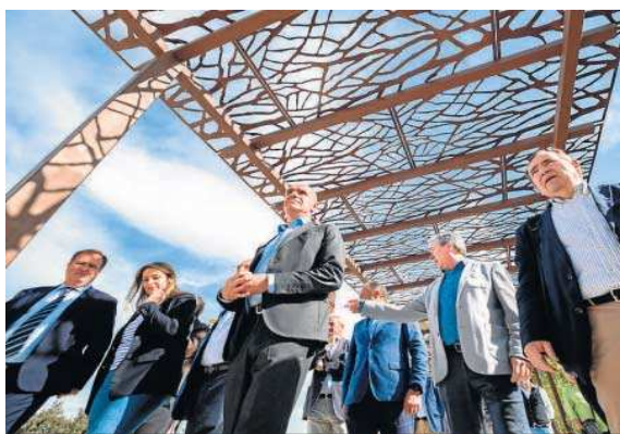
Antonio Muñoz y Juan Espadas durante la visita ayer a las obras.

“Un entorno que hemos convertido en un modelo completamente accesible, sostenible, habitable, saludable y que será un nuevo espacio de convivencia y uso ciudadano para toda Sevilla, pero especialmente para vecinos de los barrios más próximos, como Casco Antiguo, Macarena, Triana o incluso San Jerónimo, desde donde se podrán completar el amplio paseo peatonal en torno al río”, explicó el alcalde socialista.