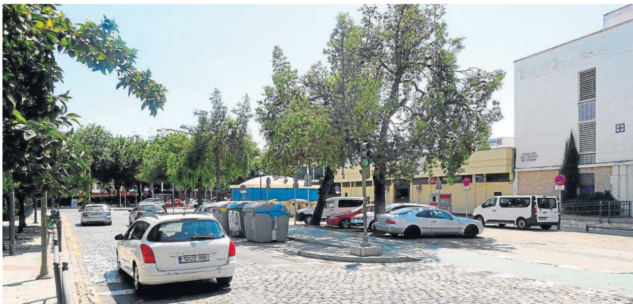
Varios coches en la plaza de San Martín de Porres, en una imagen de archivo.