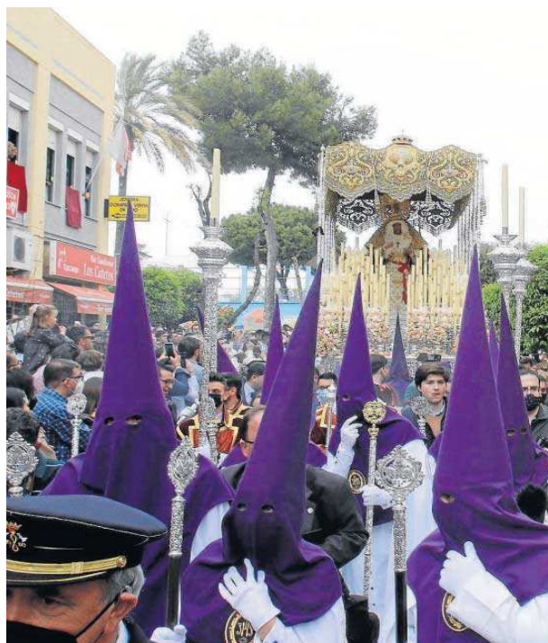
La Virgen del Amor por las calles de Pino Montano el pasado Viernes de Dolores.

Salida: A las 19:00 desde la parroquia de la parroquia del Sagrado Corazón de Jesús. Itinerario: Altares, Soria, Asencio y Toledo, cruce Alcuceros, Roque Barcia, Almirante Argandoña, Guadalajara, Laguna, Almenas, Caldereros, Enamorado, Almenas, Alcucero, Rosas y Ávila, Entrada (02:00).