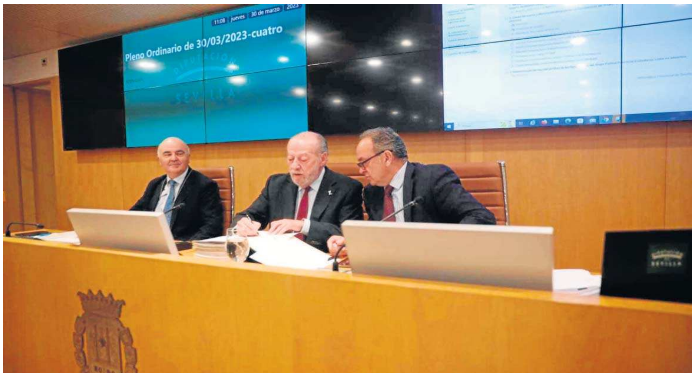
El presidente de la Diputación en un momento del Pleno celebrado ayer en la Diputación de Sevilla.