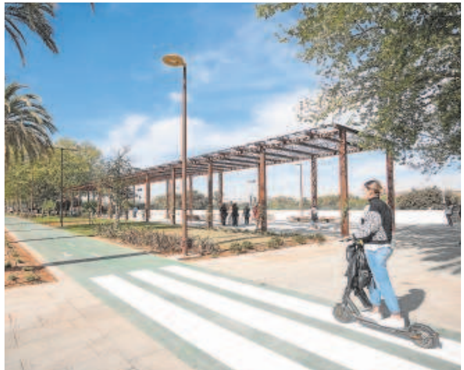
El paseo fluvial alto ha dejado atrás treinta años de degradación // V. GÓMEZ

Los primeros usuarios de la mañana convenían en la sustancial mejora del entorno, tras haberse convertido este paseo en una auténtica peripecia tanto a pie como en bicicleta, antes de la intervención. «¡Esto ha quedado tela de guapo, eh, alcalde!», decía uno,