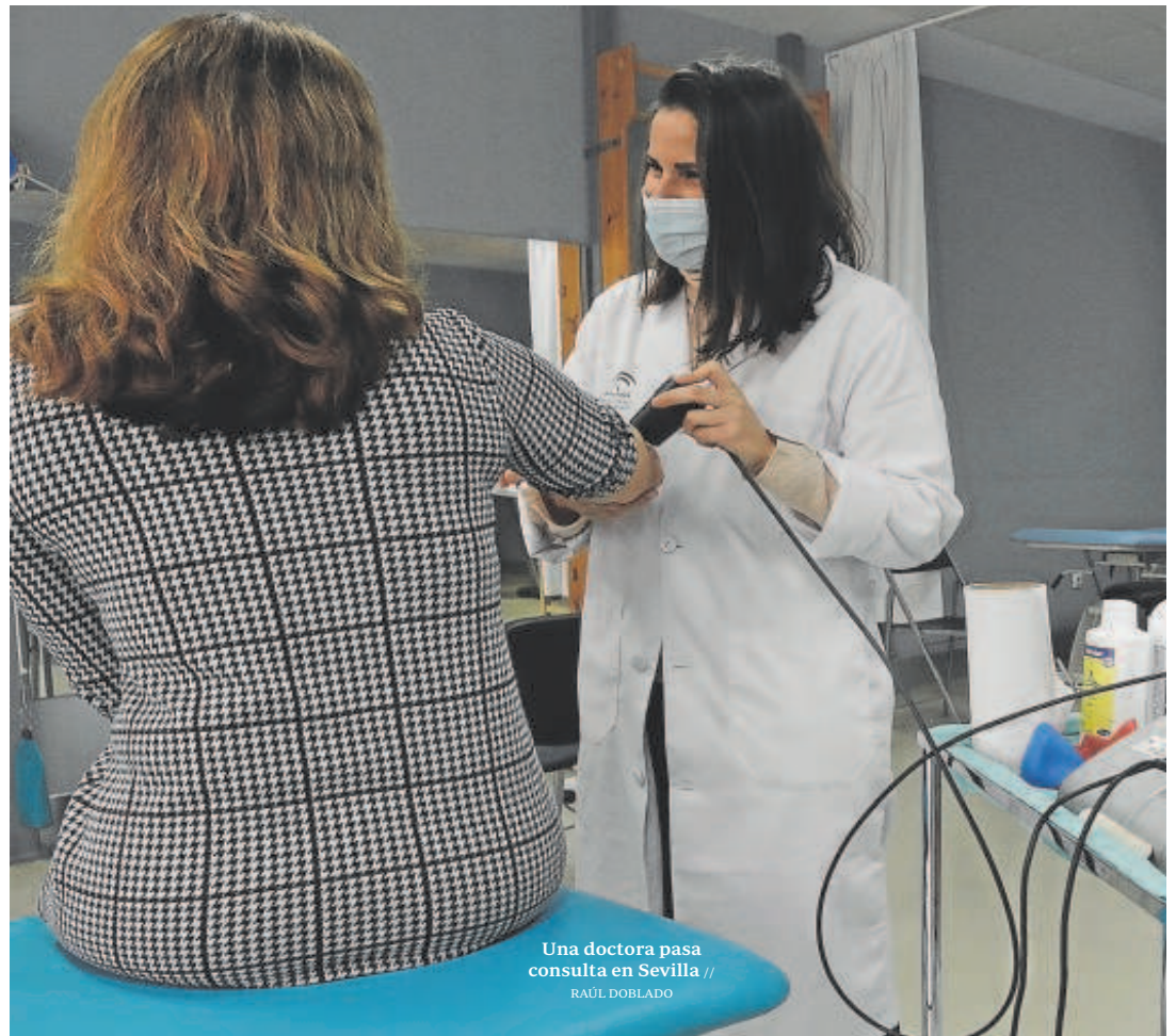
Una doctora pasa consulta en Sevilla

Otro de los puntos inéditos del nuevo documento de Salud hace referen-