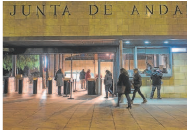
Empleados de la Junta entrando a Torre Triana, en Sevilla