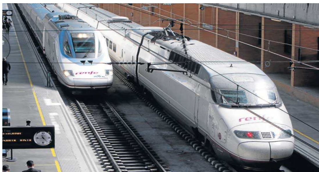
Trenes de Alta Velocidad de Renfe en la estación de Santa Justa.