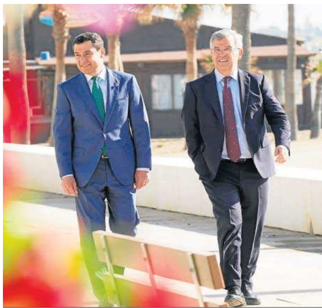
Juanma Moreno, ayer en Estepona junto al alcalde de la localidad malagueña.

● La ministra se comprometió a cambiar el sistema de 2009 que pedía “con vehemencia”, dice el portavoz del Ejecutivo