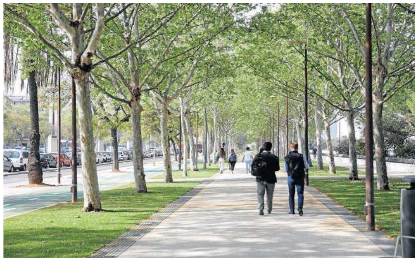
El último tramo abierto del paseo de Torneo cuenta con un nuevo espacio ajardinado.