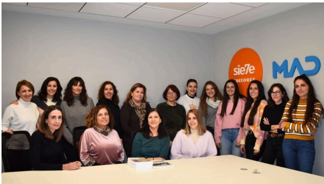
Algunas de las trabajadoras de MAD posan en la sede de la empresa, en Sevilla.