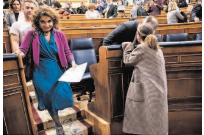
María Jesús Montero, ministra de Hacienda