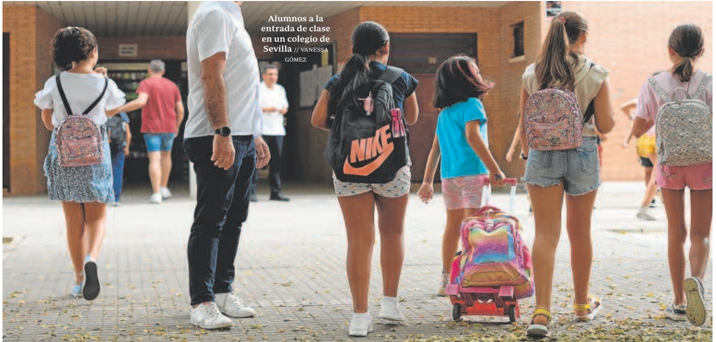
Alumnos a la entrada de clase en un colegio de Sevilla