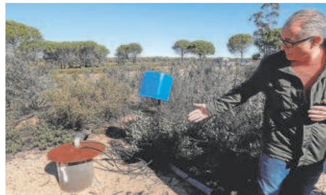
Un pozo en el parque de Doñana