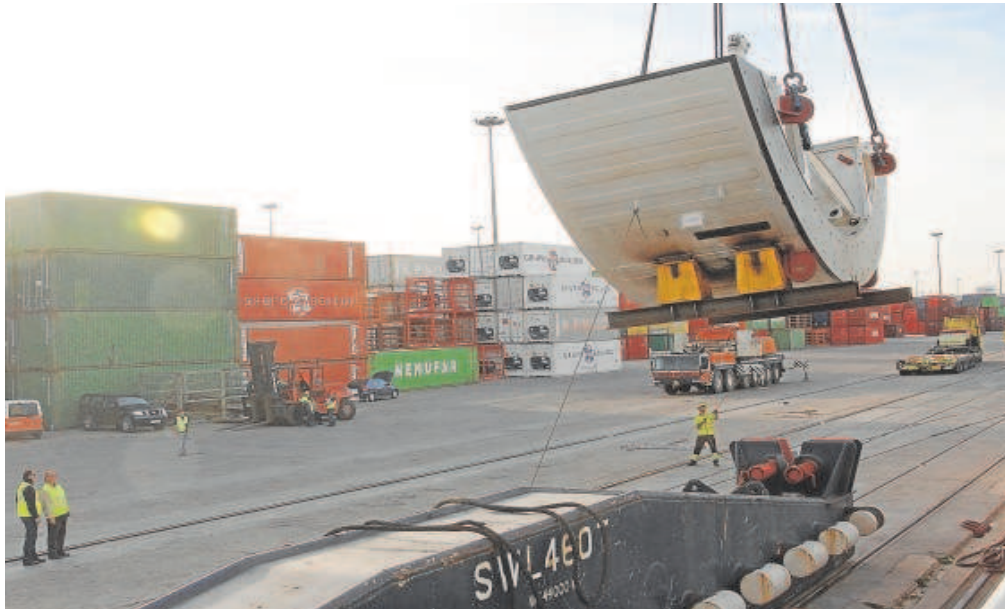
Desembarco de la tuneladora en el Puerto de Sevilla en 2012