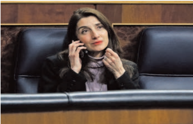
Pilar Llop, ministra de Justicia