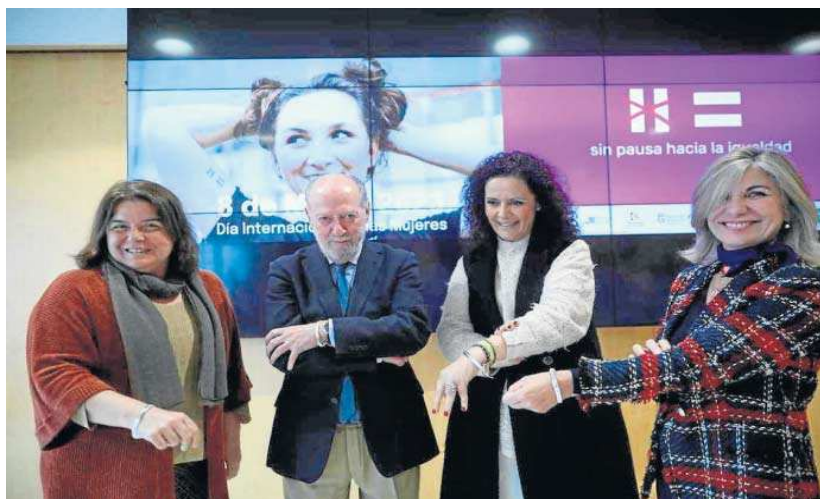
Un momento de la presentación de la campaña con motivo del 8 de marzo, en la Diputación de Sevilla.

Además de la puesta en marcha de la campaña institucional,