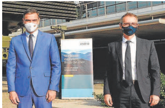
El presidente Pedro Sánchez y el de Indra, Marc Murtra

Por una vez, quizás, deberían dejar el politiquero –la política es otra cosa– y aplicar el criterio profesional y el cumplimiento de los objetivos financieros y no financieros para salvar el buen nombre de Indra, asegurar su solvencia y preservar la reputación de España y sus empresas ante la comunidad internacional. Igual es mucho pedir. Ese otro camino lleva directo a la destrucción de valor, a la inseguridad y al posterior despiece de la compañía con la cantinela de que las partes valen más que el todo. Quizás no es casualidad.