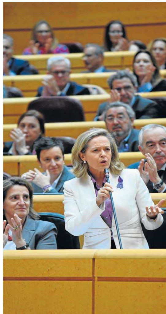
Nadia Calviño, ayer, en el Senado.