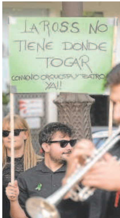
Músicos manifestándose

Por la mañana, el Consejo de Administración de la Real Orquesta Sinfónica