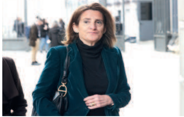
La ministra de Transición Ecológica, Teresa Ribera