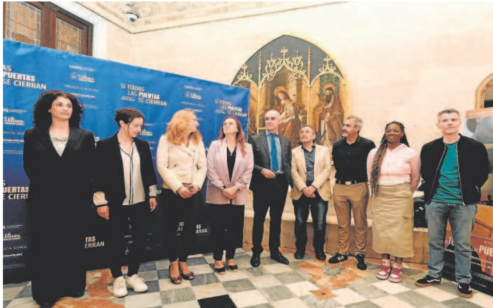
El alcalde de Sevilla con el director y el elenco de la película