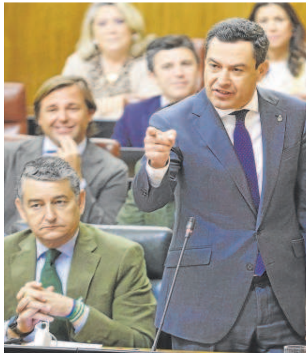
Juanma Moreno responde ayer a Juan Espadas en el Parlamento

El Parque Nacional de Doñana se localiza en el extremo meridional del sistema acuífero número 27. La recarga natural del acuífero se ha estimado en 200 hm 3 de media al año, pero la sobreexplotación y la merma en los aportes y recargas de las lagunas de El Brezo, Charco del Toro, Zahillo, Taraje, Laguna Dulce, Laguna de Santa Olalla, Las Pajas o El Sapo han puesto en serio peligro su equilibrio natural. Según un estudio de 2022, de los 16 sectores en los que se divide el acuífero, tan solo uno está en situación de normalidad; dos se hallan en estado de 'prealerta', diez en 'alerta' y otros tres en 'alarma'. En definitiva, la aorta que aporta agua a Doñana se seca y nuevos 'pinchazos' en forma de riego comprometerían aún más su supervivencia.