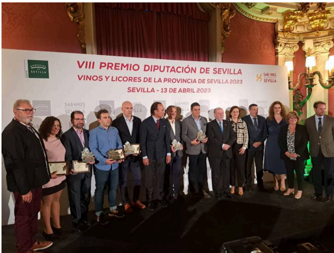
Gala de entrega del VIII Premio Vinos y Licores de la Provincia de Sevilla