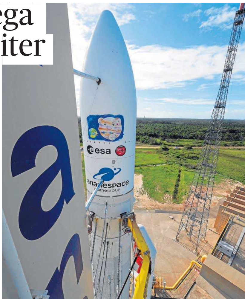
El cohete Ariane 5, en el que despegará la sonda Juice rumbo a Júpiter desde la Guayana Francesa.