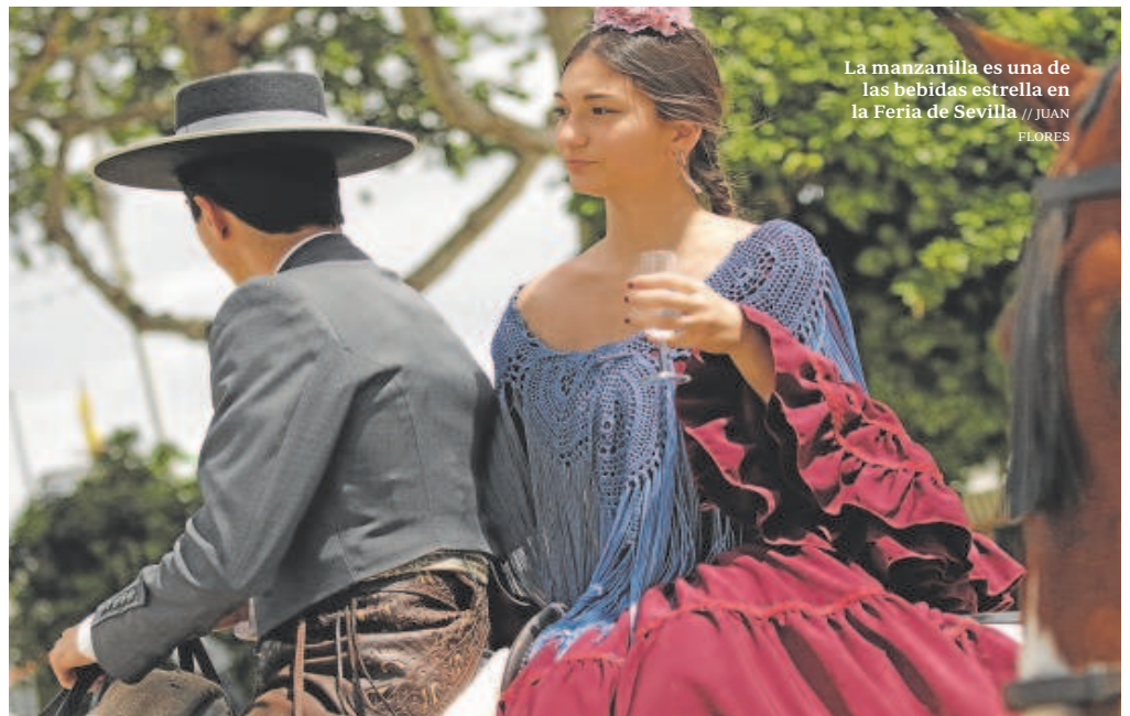
La manzanilla es una de las bebidas estrella en la Feria de Sevilla

Pero ¿Cuántos litros de cerveza se beberán en la Feria? En esas barras, la compañía cervecera prevé servir casi 1 millón de litros de Cruzcampo Especial, Cruzcampo Radler, Cruzcampo 0.0 y Cruzcampo Sin gluten. Esos supone una media de unas 529.100 cañas cada día de la celebración que supondrían alrededor de 3.700.000 de cañas durante toda la Feria. Hay quien piensa que, en realidad, serán muchas más.