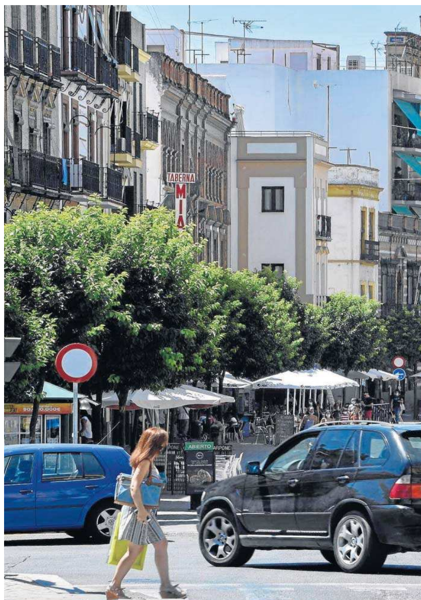
Una mujer cruza la plaza del Altozano, una de las zonas de la ciudad más saturadas de pisos turísticos.

Tras el final del terrorismo y una década de expansión del turismo en todo el mundo, el número de plazas de alojamiento turístico en la ciudad ha sufrido un importante incremento. De hecho, San Sebastián dispone ahora de unas 18.000 plazas de alojamiento, una cantidad que se ha incrementado en un 40%