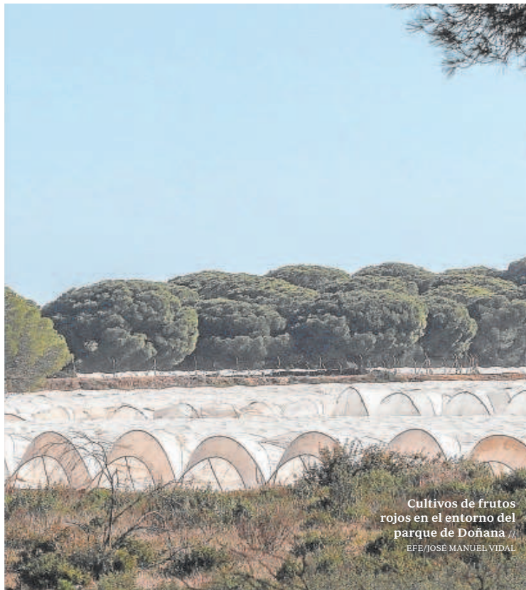
Cultivos de frutos rojos en el entorno del parque de Doñana

Feijóo insistió en que el Ejecutivo tiene una «errática política hidráulica» y se ha dedicado a «enfrentar a las comunidades entre sí sin resolver ningún problema». A su entender, es «muy difícil hablar con un Gobierno que insulta y que está de constantemente descalificando al resto de administraciones».