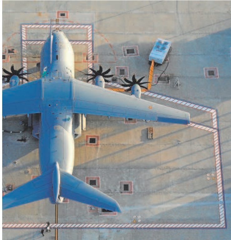
Un avión A400M para España, en la planta de Airbus en Sevilla