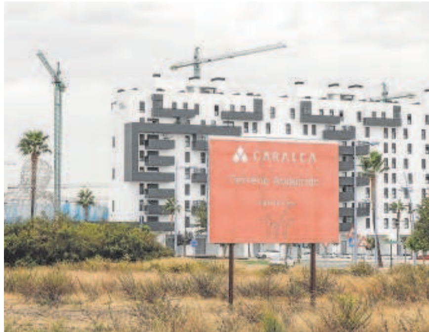
Una de las promociones construidas en Entrenúcleos // RAÚL DOBLADO

En total se entregarán 1.500 inmuebles a los que han participado en este proceso, que no es ni el 10% del total. La Junta, por su parte, no ha propuesto un plan de vivienda lo suficientemente atractivo como para competir con la oferta de ciudades vecinas. Y el último recurso es la oferta de pro-