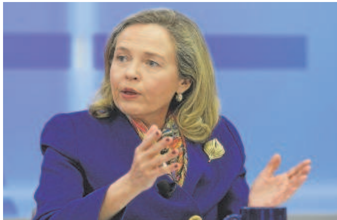
Nadia Calviño, vicepresidenta primera del Gobierno