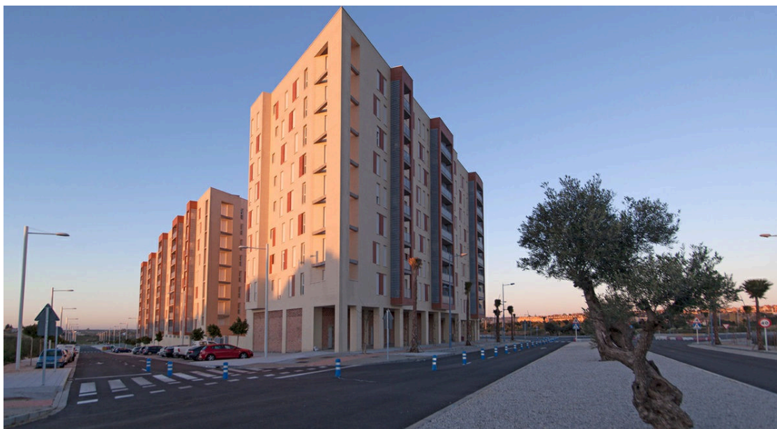
Promoción de Rusvel en Dos Hermanas.

Grupo Rusvel ha adquirido a través de su división de desarrollos inmobiliarios, RGI, terrenos para construir alrededor de 500 viviendas. Con esta operación la constructora sevillana desembarca en el mercado inmobiliario extremeño con un proyecto de 210 viviendas plurifamiliares en Mérida, a las que se suman otras 287 en El Puerto de Santa María (Cádiz).