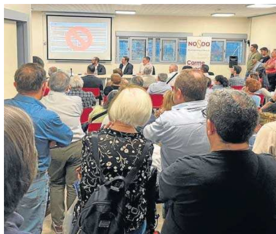
SEVILLA QUIERE METRO

A preguntas de este periódico, Fomento de la Junta señala que, "como se ha hecho con la Línea 3, es necesario actualizar el proyecto, no sólo adaptado a la normativa vigente, sino también a las