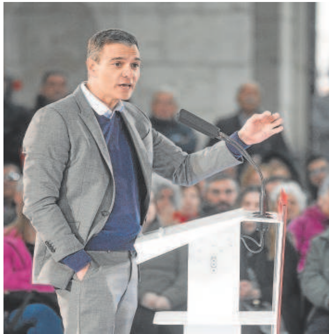
Sánchez, el miércoles en Burgos

En este sentido, los datos que ahora mismo tiene Ferraz no apuntan a que Sumar vaya a tener una gran capacidad para atraer voto socialista. «No nos genera temor. Lo que genera es una sensación interesante. Ilusión y capacidad de movilizar la abstención», señala un alto mando del Gobierno y del partido. Lo que se expresa con claridad en público como en privado es que se entiende más útil electoralmente que Podemos se inte-