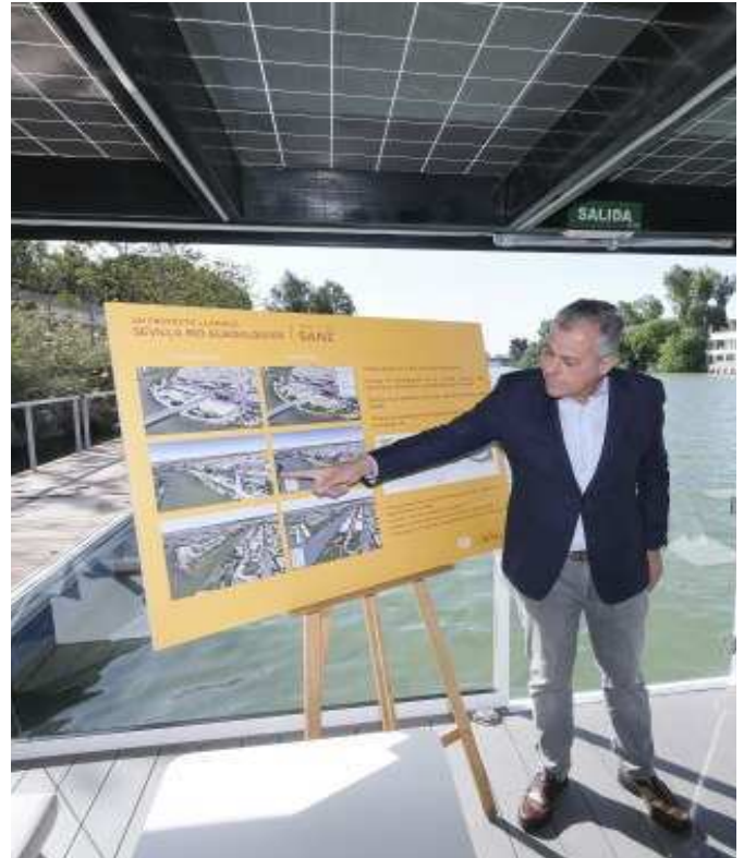
Sanz durante su comparecencia ante los medios

Igualmente, y entre otras iniciativas, Sanz concretó que «también junto con el Puerto llevaremos a cabo una revisión del proyecto del Distrito Portuario haciéndolo más ambicioso y po-