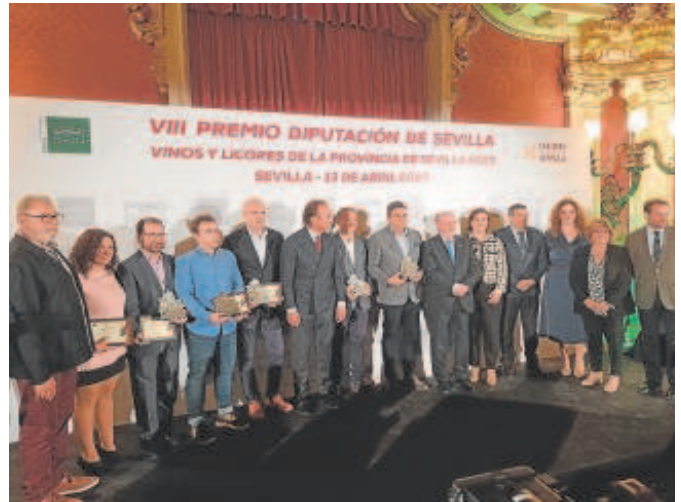
Foto de familia de todos los ganadores

Además, se han concedido 15 medallas, tres de oro y doce de plata. Las medallas de oro han correspondido a los siguientes vinos: 'Pago del Zancúo 2017 Roca Volcánica', de Bodega La Margarita (Constantina), en la categoría de Vinos Tintos Tranquilos; 'Vino Aromatizado de Naranja Florum Orange', de Vermut Florum (Alcalá de Guadaíra); y 'Vermut Florum Blanco', también de la misma bodega alcalaíña, y ambos productos, en la categoría de