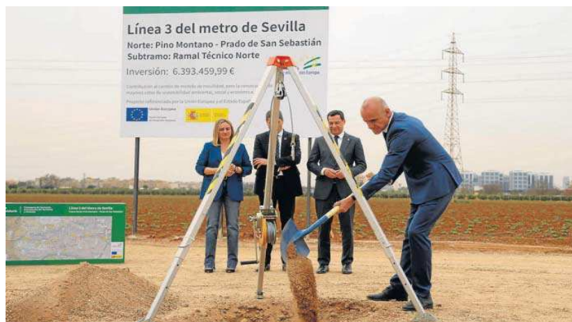
Primera piedra de las obras de la línea 3 del Metro a finales de febrero.

● El Ministerio apremia a Fomento a designar sus miembros de la Comisión de Seguimiento para recibir el pago estatal previsto