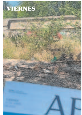
ISLA DE LA CARTUJA. El solar situado junto al muro del Monasterio de la Cartuja, en el Camino de los Descubrimientos, se ha convertido en un vertedero

▶▶▶ Más allá del tremendo déficit de mantenimiento y mobiliario urbano en esta área, pueden tomarse muchos ejemplos con respecto a la suciedad y la falta de un servicio suficiente. Uno de ellos son los jardines y sus respectivos paseos de la calle Juan de Mendoza Luna, en paralelo a Montes Sierra, que los fines de semana, además, son pasto del 'botellón'. Pero no se queda la cosa ahí. La basura 'ordinaria' genera otras molestias añadidas porque, como en tantos otros puntos de la ciudad, no se recoge debidamente. Sirven de ilustración paradigmática los desperdicios que se han ido acumulando esta pasada semana en uno de los caminos de esos jardines, donde envoltorios y latas de refresco se han ido 'asentando' sin que una sola escoba o barredora haya pasado en días. Y todo a pesar de tratarse de un camino en plenos jardines y junto a un transitado carril bici. De lunes a viernes, el mismo panorama de suciedad.