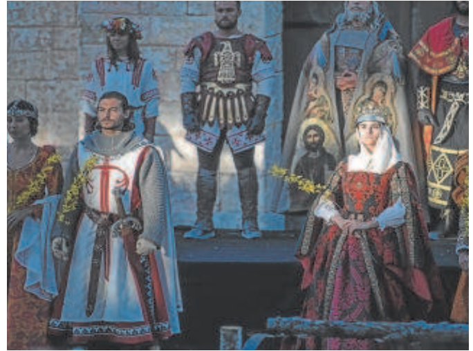
'El Misterio de Sorbaces', nuevo espectáculo del parque Puy du Fou

La presentación de la temporada se realizará en un acto en el patio del Archivo de Indias en el que intervendrán el vicepresidente de Puy du Fou Espa-