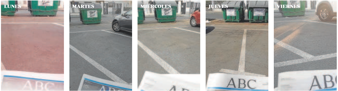
SANTA CLARA. En los aparcamientos situados en la plaza Fray Junípero Serra, los cristales rotos de un coche robado permanecen en el asfalto