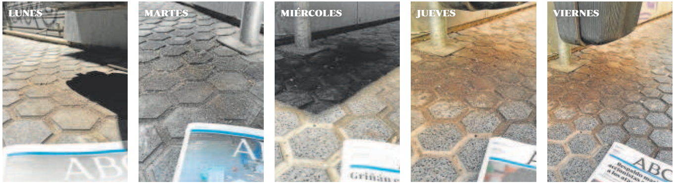
CALLE SAN VICENTE. Junto a la sede del PSOE andaluz, bajo una papelera, hay una mancha que evidencia que llevan meses sin baldear la calle