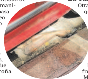
EL CASO DE LA PATA DE JAMÓN Durante semanas el pasado verano estuvo una pata de jamón en la calle Baños sin que Lipasam la retirase.

Otra de las zonas de Sevilla que presentan un estado indigno, pese a estar situado junto a un bien de interés cultural y en el principal acceso desde el Centro al puntal tecnológico y empresarial de Sevilla, es el Camino de los Descubrimientos. Allí frente al Consulado de Marruecos y junto a la tapia del monasterio de la Cartuja hay un vertedero que acumula suciedad por la desidia del servicio de limpieza que no actúa hasta pasados meses. En la zona más próxima