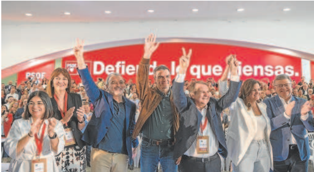
Pedro Sánchez junto a algunos de los alcaldes y candidatos municipales del PSOE