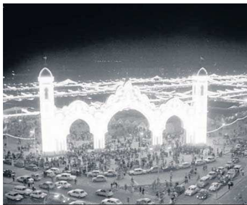
Primera Feria de Abril en los terrenos de Los Remedios en 1973.

En abril de 1981 Uruñuela era alcalde de Sevilla, Enrique Tierno Galván alcalde de Madrid y Julio Anguita de Córdoba. En esa época se había producido el contencioso del regidor cordobés con el obispo de la diócesis, monseñor Infantes Florido. Juan Fernández coincidía con Anguita en que “casi todas las leyes son buenas, donde fallan en la mayoría de los casos es en su aplicación. Y más cuando la ciudad no es un ente neutro, sino que está constituido por sujetos que en ocasiones tienen intereses contrapuestos. Ésa es una de las razones por las que sería un absurdo la visión del alcalde pastoril que a todos convenciera por igual”.