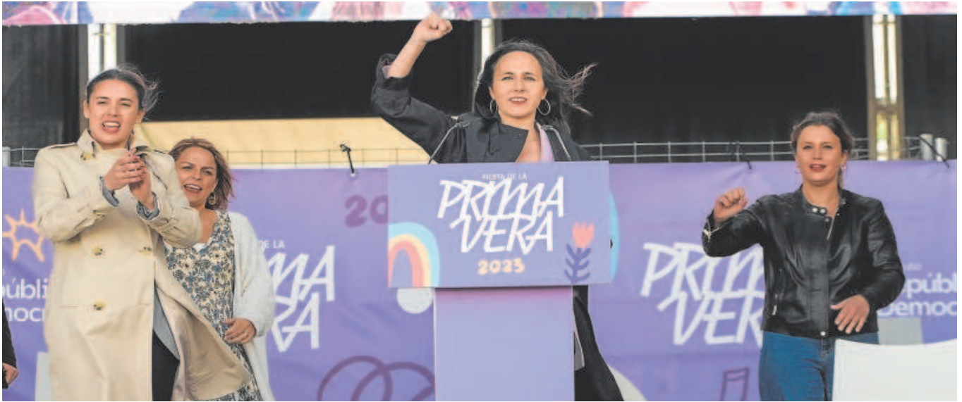
Irene Montero e Ione Belarra, ayer en la 'Fiesta de la Primavera' de Podemos en Zaragoza