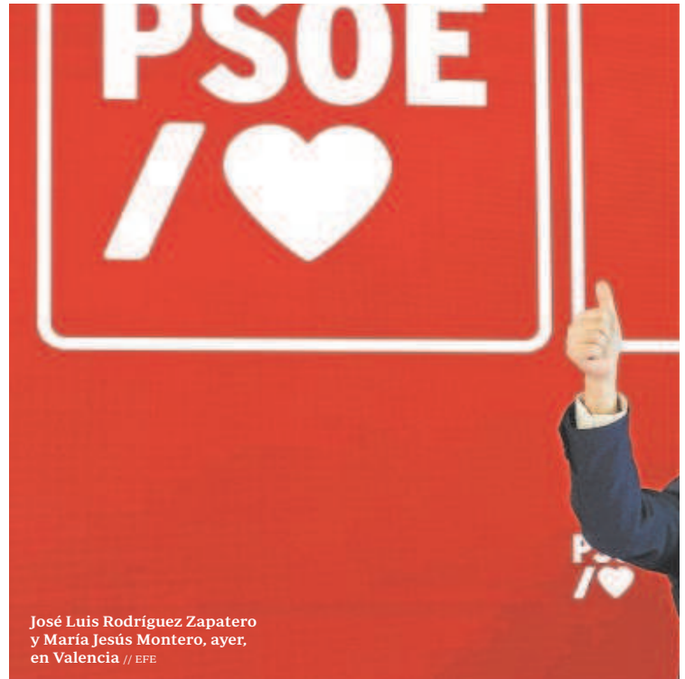
José Luis Rodríguez Zapatero y María Jesús Montero, ayer, en Valencia