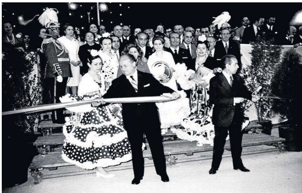
El alcalde Juan Fernández Rodríguez-García del Busto corta la cinta inaugural de la Feria en los Remedios en 1973.

Un alcalde visionario que 125 años después de su creación como feria de ganado se la llevó al antiguo meandro de los Gordales. Bien mirado, es el único alcalde que ha dado un paso importante cerca de Tablada. Intentó paliar las estrecheces espaciales del Ayuntamiento negociando con la Diputación Provincial y con el Arzobispado la posible cesión de locales en el hospital de las Cinco Llagas y el palacio de san Telmo. Visión de futuro, porque allí se ubicarían el Parlamento Andaluz y la Junta de Andalucía, respectivamente.