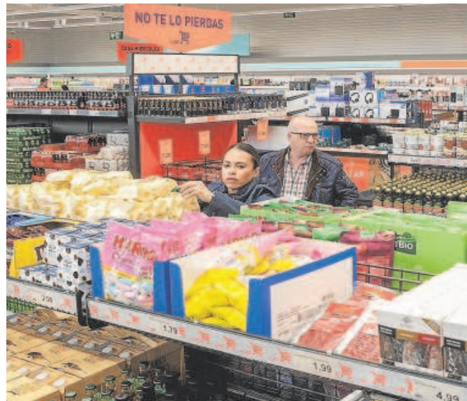
Interior de un supermercado en Córdoba

Tanto es así que el caso de Mercadona es paradigmático. La compañía valenciana, que ha defendido en varias