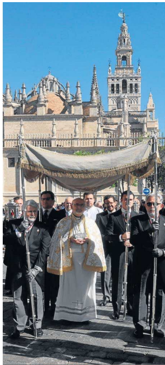
El Santísimo, bajo patio, recorre la Plaza del Triunfo, colmatada de turistas.

Y todo ello en un entorno colmatado (y muy afeado) con rútuolos franquiciados de heladerías, cafeterías y comida rápida. Con turistas que toman café con los pies en alto. Con el estridente sonido del chanqueteo. Y con axilas al aire cuando el termómetro le coge el gusto a los 30 grados. Definitivamente, la procesión de impedidos del Sagrario constituye una rémora del tiempo. Una joya pretérita amenazada por un centro en adoración perpetua a este nuevo dios de maletas y mochilas. Cantemos al amor de los amores.