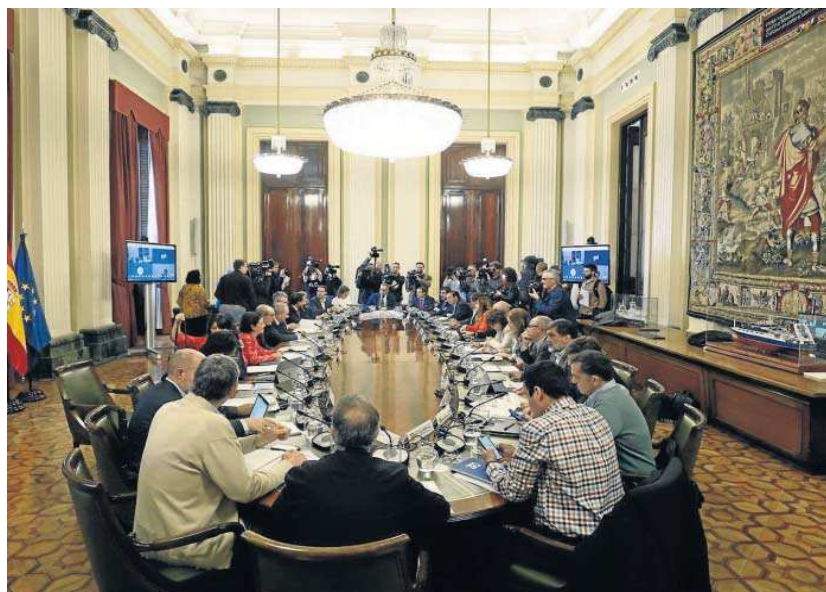
Mesa Nacional de la Sequía en el Ministerio de Agricultura.