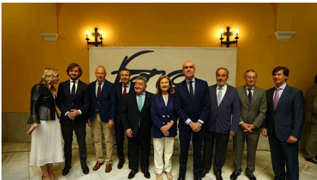
Antonio Muñoz ha participado en el Foro Gaesco.

El alcalde de Sevilla y candidato por el PSOE a revalidar en la Alcaldía, Antonio Muñoz, ha participado esta mañana en una conferencia-coloquio del Foro Gaesco con el tema 'Sevilla en marcha', donde ha presentado un plan de 35 medidas urbanísticas para acelerar la transformación de la ciudad, entre las que destaca una firme apuesta por la promoción de vivienda pública y por las infraestructuras. En este marco, ha anunciado que el parque público en alquiler de la empresa municipal Emvisesa se incrementará en los próximos años hasta las 12.000, pasando de su actual ratio de una vivienda en alquiler por cada 82 habitantes a 68; que ya se han captado los fondos suficientes para afrontar la segunda fase de la rehabilitación de las 144 viviendas de la barriada de Los Pajaritos con 5 millones de euros destinados a la instalación de ascensores y eficiencia energética; que se marca el objetivo de captar otros 300 millones de euros en fondos europeos para inversiones en la ciudad con preferencia para los barrios de transformación social; y el compromiso de inversión de 30 millones de euros en cuatro años para actuaciones en el sistema general viario, entre ellas SE-35, SE-20 o Ronda Urbana Norte.