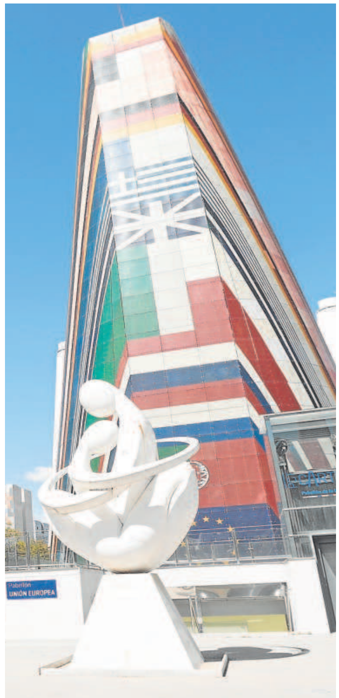
Pabellón de la Unión Europea, uno de los que serán recuperados

El espacio había permanecido nueve años cerrado por la falta de un proyecto y de interés de los inversores