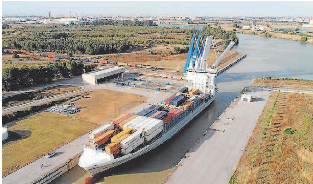
Un buque carguero entra en la esclusa para la salida del Puerto de Sevilla