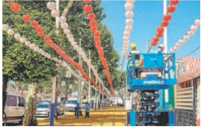
El montaje de la Feria encara su recta final

Metro de Sevilla iniciará su dispositivo especial con motivo de la Feria de Abril este sábado estableciéndose un servicio ininterrumpido de más de 200 horas para atender la demanda: desde las 7.30 horas de esa día hasta las 2 horas de la madrugada del domingo 30 de abril al 1 de mayo. El suburbano duplicará la oferta de servicio en un periodo ordinario gracias al refuerzo horario y la mayor disponibilidad de trenes. Durante la Feria circulará con trenes en doble composición durante la mayor parte del dispositivo, excepto en alguna franja de mañana, en la que se alternarán los trenes simples y dobles.