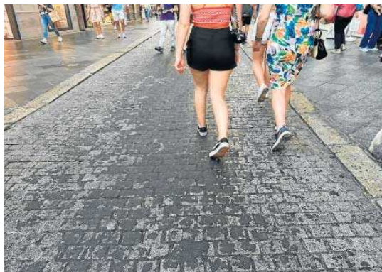
Cera acumulada en la zona peatonal del centro.

La delegada de Limpieza Pública y Educación explicó ayer que desde el final de la Semana Santa los trabajos de Limpieza Pública prolongan en torno a tres semanas para atender al conjunto de los itinerarios por los que han discurrido las cofradías, utili-