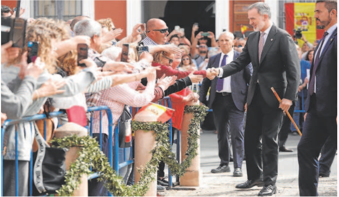
Felipe VI saluda a ciudadanos que se congregaron en torno a la Real Maestranza de Caballería de Ronda