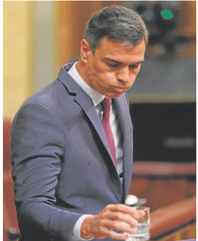
El presidente del Gobierno, Pedro Sánchez, ayer en el Congreso

En este contexto, Sánchez aprovechó una comparecencia parlamentaria sobre las últimas reuniones del Consejo de Europa para echar más leña al fuego de Doñana. Así, señaló que «la jurisprudencia española y europea son tajantes contra los planes que tratan de imponer la derecha y la ultraderecha en Andalucía» y recordó la iniciativa ha «encendido las alarmas» en la comuni-