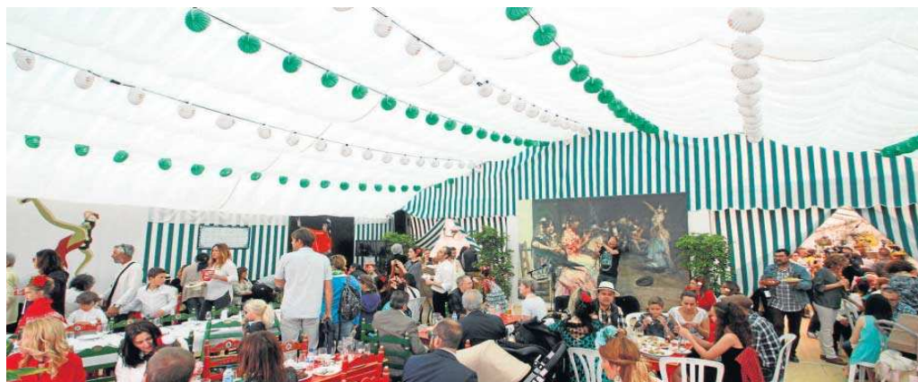
La caseta de los turistas durante la pasada edición de la Feria de Abril.