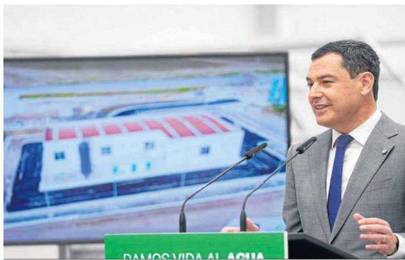
El presidente de la Junta, Juanma Moreno, durante la inauguración de una depuradora en la provincia de Granada.

● El presidente de la Junta recuerda al Gobierno las inversiones pendientes y a acusarle de “no tener una política hidráulica”