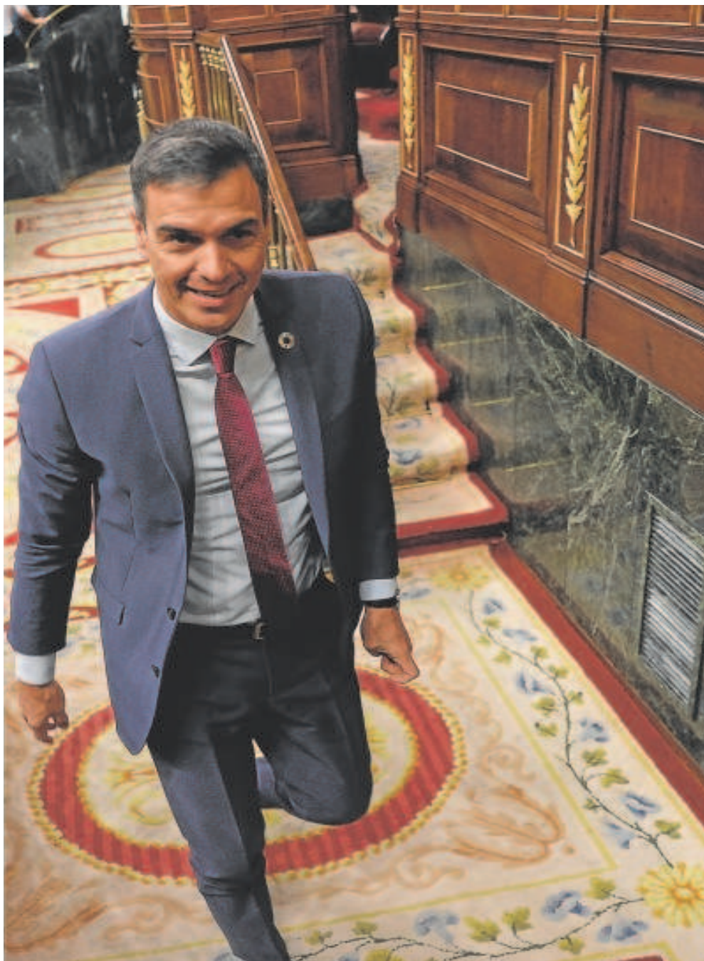
Pedro Sánchez, saliendo ayer del hemiciclo tras el debate

bernando, Sánchez haya descubierto «el drama de la vivienda» y «encontrado la solución en cuarenta y ocho horas». Y Aitor Esteban le reprochó que la ley de vivienda no aborde el problema de los pisos turísticos y que, a su juicio, el acuerdo cerrado con ERC y Bildu la semana pasada pueda afec-