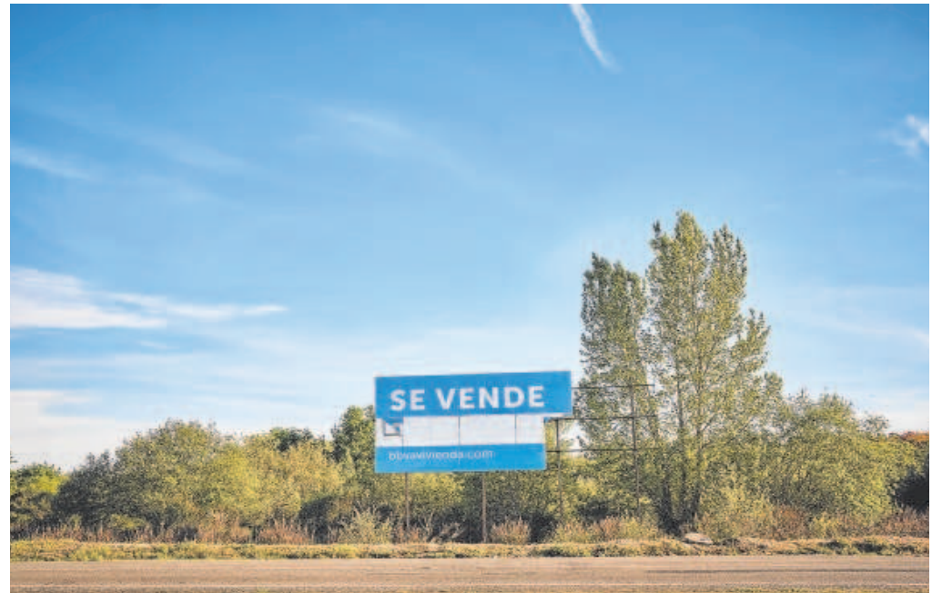
El Gobierno ha anunciado en los últimos días 93.000 viviendas para alquiler asequible

La idea del plan, como adelantó ayer Sánchez, es conseguir un parque mayor de vivienda social ante el déficit