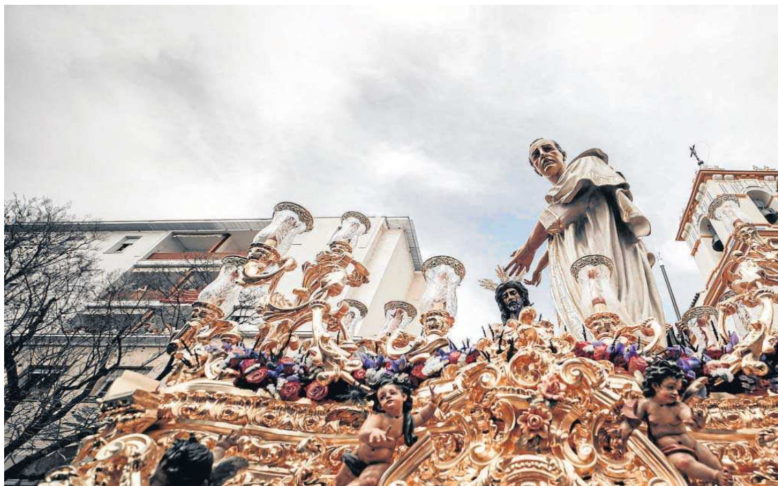
Salida de la Presentación al Pueblo, de la hermandad de San Benito.

Tampoco venden nada los de los globos de helio, un producto al que le ha llegado también el subidón del IPC. A siete euros cada uno. "Papá, yo quiero el de Bob Esponja". "Déjalo, niño, que vie-