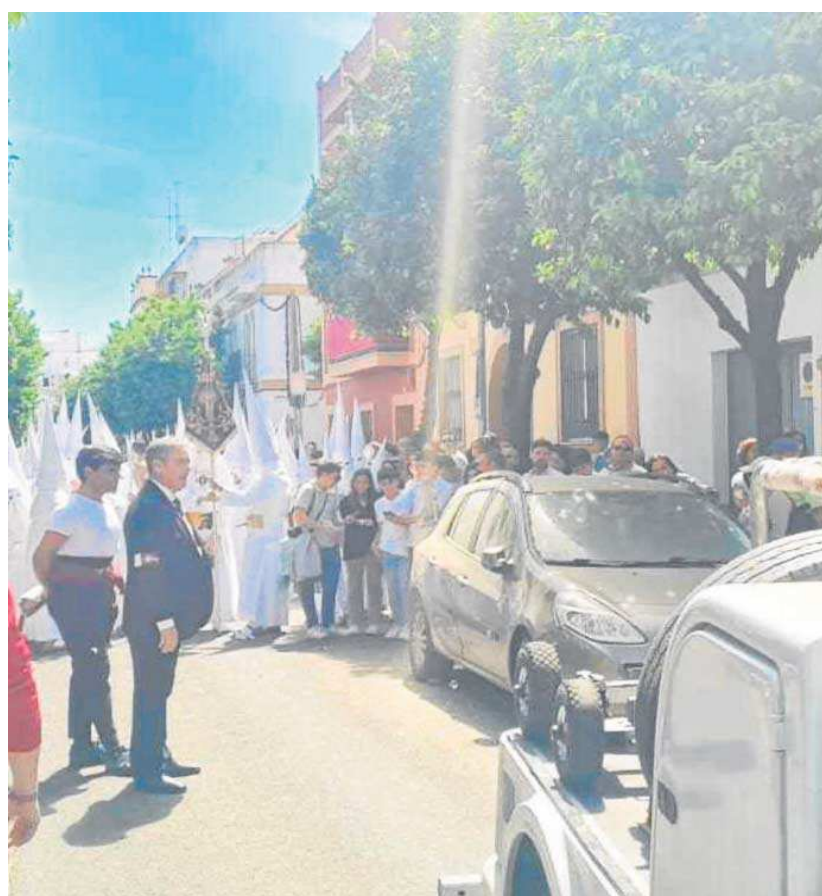
La grúa municipal retira un vehículo en la salida de la Hermandad de San Gonzalo.

En cambio, para otros servicios públicos tan relevantes en Semana Santa como Metro de Sevilla, se habían establecido servicios mínimos del 70% u 80%, según los ca-