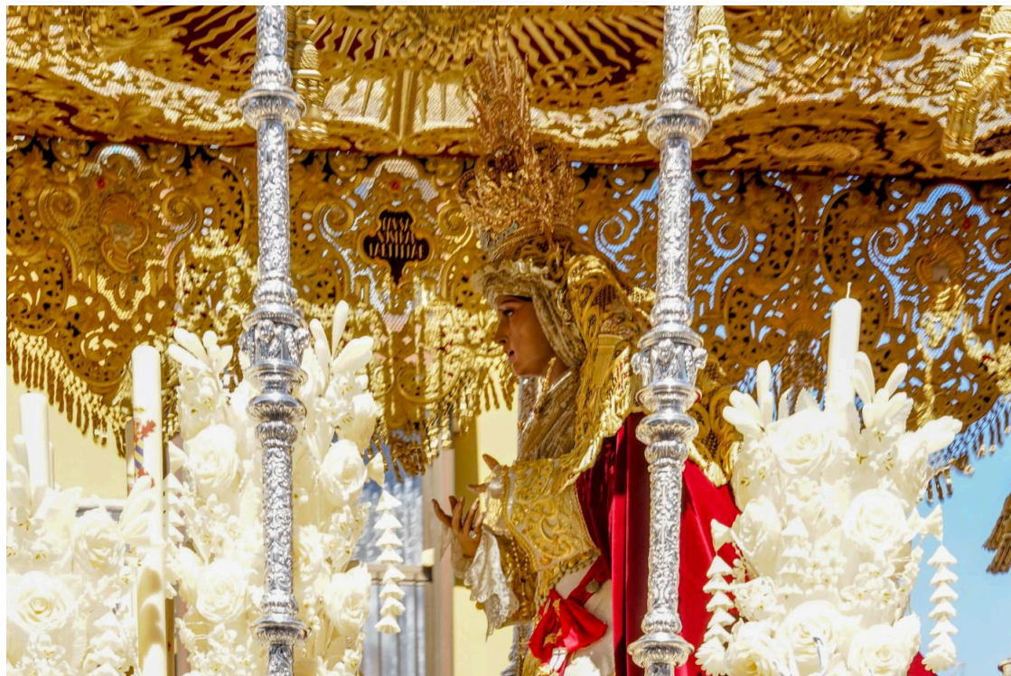
Lunes Santo en Sevilla.