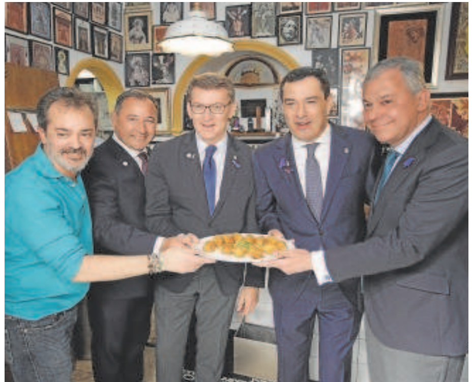
El presidente del PP degustó las croquetas de Casa Ricardo

La de ayer fue también una jornada pródiga en vistas institucionales a las hermandades del día. Hasta tres