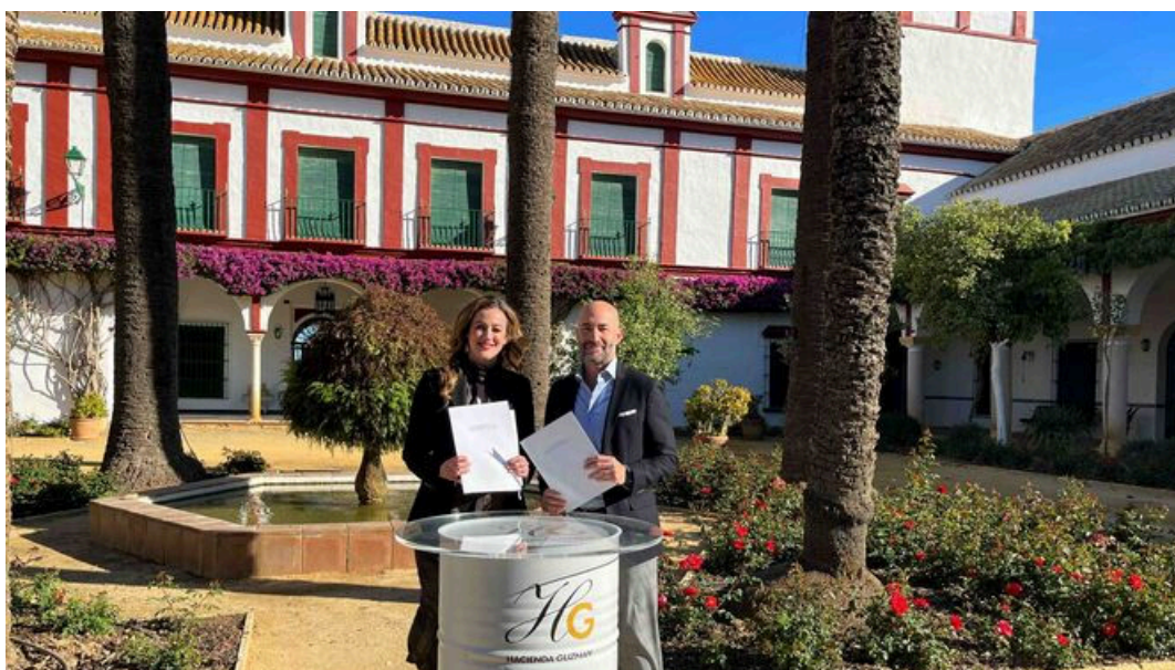
Firma del convenio entre la Fundación Juan Ramón Guillén y el Ayuntamiento de La Rinconada.

El Ayuntamiento de La Rinconada (Sevilla) participa en el programa Solidarios Coosur de la Fundación Juan Ramón Guillén.