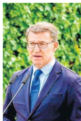
Alberto Núñez Feijóo.

“Nunca la política española y el número de partidos que apoyan al Gobierno han sido tantos, han estado tan divididos y han hecho tan débil al presidente”, sentenció. “Necesitamos un partido sólido con un presidente que pueda nombrar y cesar a los miembros de su