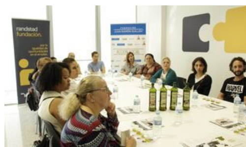
Una de las sesiones del programa Solidarios Coosur 2022.

Para ello ambas partes han suscrito un acuerdo con la finalidad de impartir en el municipio formaciones especializadas en el ámbito olivarero que permitan mejorar la empleabilidad de los vecinos en situación más vulnerable y, por tanto, incrementar sus posibilidades de encontrar un empleo en el entorno rural.