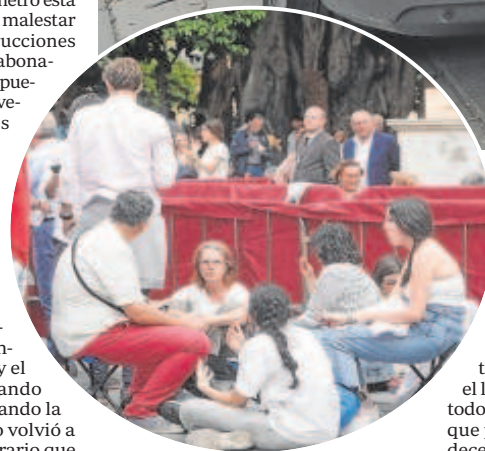
Arriba, vehículos mal estacionados en la Cartuja. Al lado, personas sentadas en sillitas plegables y en el suelo