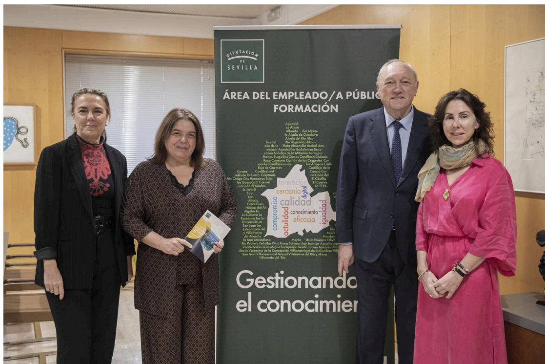
Jornadas sobre haciendas locales. - DIPUTACION DE SEVILLA