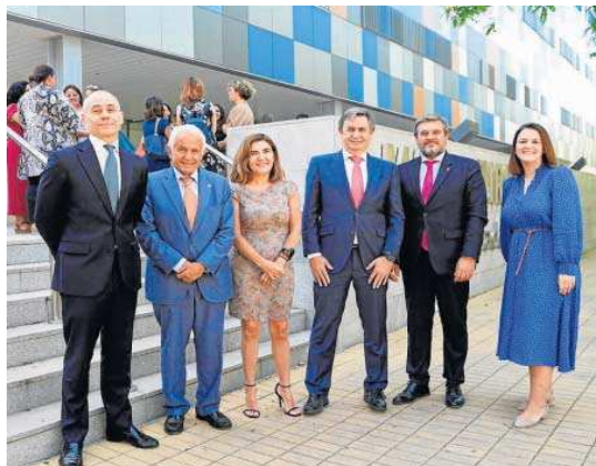
Los asistentes a la presentación del programa de la Fundación Endesa.

La Fundación Endesa, en su compromiso de promover acciones que mejoren la empleabilidad y la inserción laboral de personas en riesgo de exclusión social, en 2016 puso en marcha el programa Cambiando Vidas , en colaboración con la Fundación Integra, a través del cual acompañan y preparan a este colectivo para su incorporación en el mundo laboral. Esta iniciativa cuenta también con el apoyo de empleados voluntarios de Endesa, quienes reciben formación previa para poder ayu-