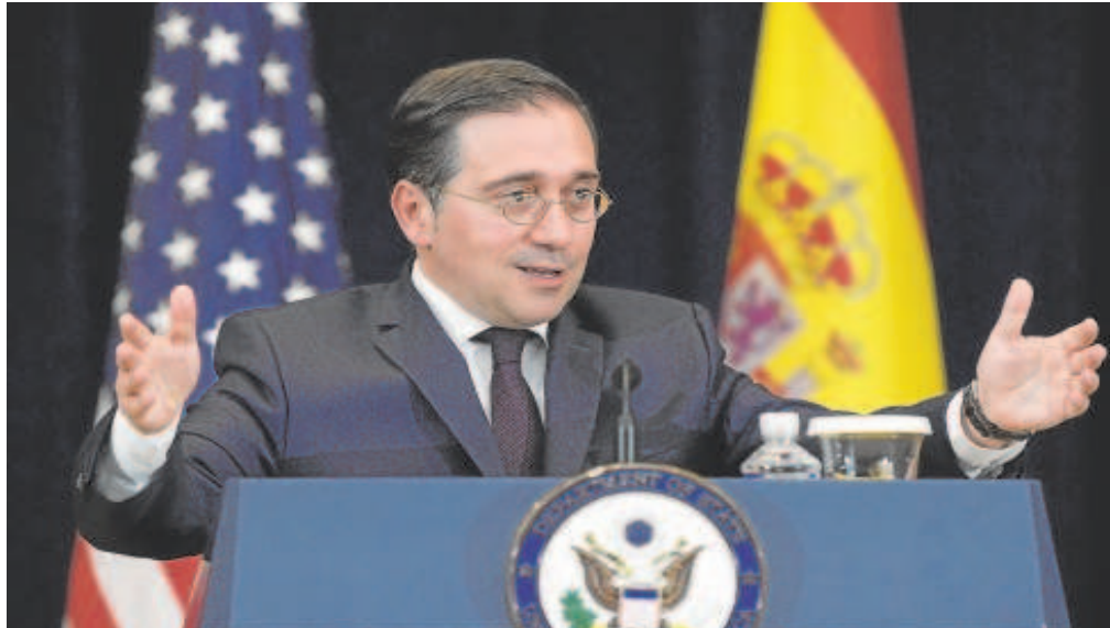
Albares, ministro de Exteriores, este miércoles en rueda de prensa durante su visita a Estados Unidos