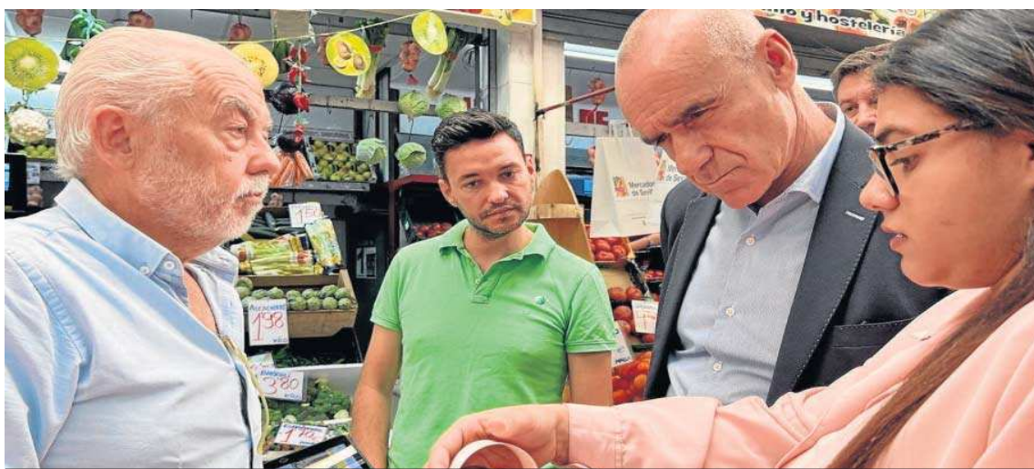
El alcalde de Sevilla, Antonio Muñoz, en una visita al sevillano barrio del Tiro de Línea.