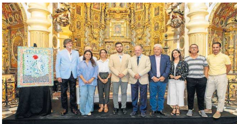
Artistas y representantes de las instituciones posan junto al cartel diseñado por Juan Romero para el festival.

● La cita incorpora el singular espacio del Cortijo el Cuarto, donde actuarán seis de las 14 compañías que integran su programación