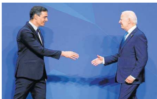
Pedro Sánchez saluda a Joe Biden en un encuentro anterior.

En este sentido, uno de los compromisos alcanzados por Sánchez y Biden en junio ya se ha cumplido. Este lunes, la ministra de Defensa, Margarita Robles, y la embajadora estadounidense, Julissa Reynoso, firmaron el acuerdo que permitirá el despliegue de dos buques adicionales de la Marina de Estados Unidos en la Base Naval de Rota.