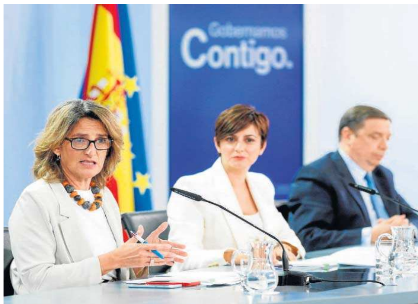
Teresa Ribera, Isabel Rodríguez y Luis Planas tras el Consejo de Ministros Extraordinario sobre la sequía.

● El Consejo de Ministros rebaja las peonadas para acceder al subsidio y subvenciona el seguro agrario ● La Junta califica las medidas de insuficientes y electoralistas