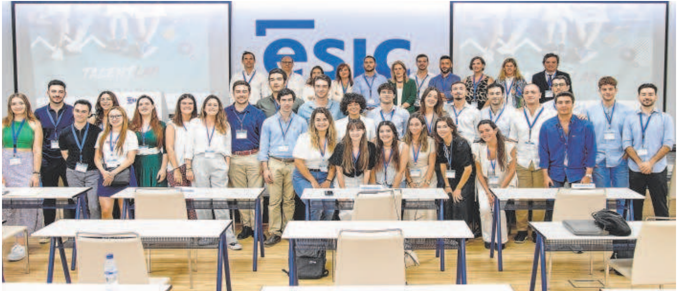
El grupo de candidatos de TalentLab Sevilla junto a los representantes de las empresas que participan en el programa