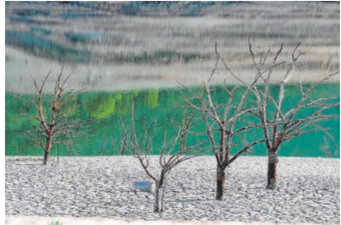
Bajo nivel del agua en el embalse de Sau, en Cataluña

«El objetivo principal es asegurar la continuidad productiva de nuestro sector primario, de nuestros agricultores y de la producción alimentaria, elemento fundamental para el abastecimiento pero también en relación con la evolución de los precios», apuntó Planas. Una lluvia de millones que no termina en estas partidas de Agricultura, sino que llega hasta los 2.190 millones totales del paquete si se suman las inversiones previstas por Transición Ecológica, cifradas en 1.400 millones de euros. Esta can-