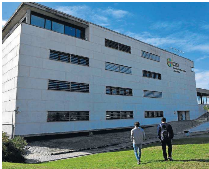
El edificio de la Fundación CEU que acoge el Centro Universitario Cardenal Spínola.

El CEU ha contestado con un "conforme con carácter general" a dicha misiva, aunque puntualizando ciertas premisas, especialmente la primera de ellas, en la que se pide a la fundación de enseñanza que se comprometa "por escrito" a que la desadscripción comience de forma gradual el curso 2024/25. Desde la entidad que gestiona el centro Cardenal Spínola se precisa que se hará posible siempre que para entonces se encuentre en marcha la futura universidad privada Fernando III, un hito que depende del trámite parlamentario. En principio, todo apunta a que se cumplirán los plazos.