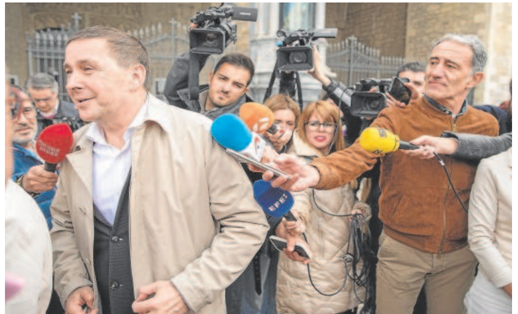
El líder de Bildu, Arnaldo Otegi, ayer en Vitoria con sus candidatos a las capitales y diputaciones vascas

Podemos Euskadi se desmarca de sus líderes nacionales y califica de «grave y lamentable» la presencia de terroristas