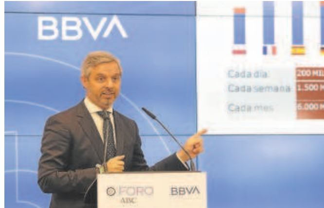
Juan Bravo presenta la hoja de ruta económica del PP