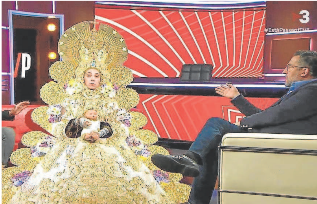
Un momento del 'gag' donde se recogieron las ofensas a la Virgen del Rocío

Distribuido para CONFEDERACIÓN DE EMPRESARIOS DE SEVILLA * Este artículo no puede distribuirse sin el consentimiento expreso del dueño de los derechos de autor.