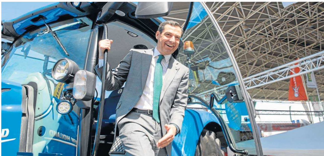
El presidente de la Junta, Juanma Moreno, ayer en Jaén.