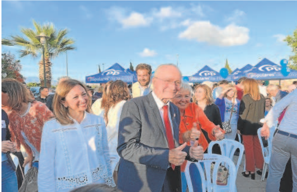
Francisco de la Torre, ayer en el inicio de campaña en Málaga