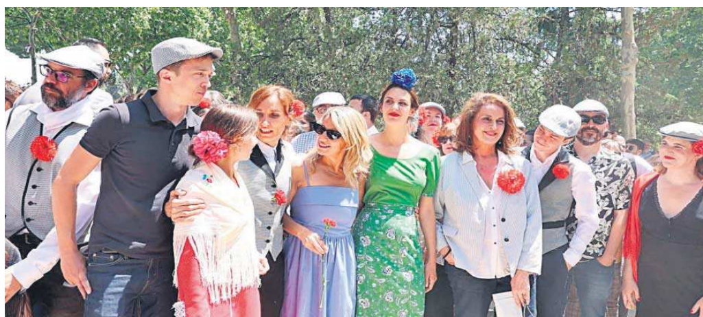
Yolanda Díaz e Iñigo Errejón acompañan a las candidatas de Más Madrid en la pradera de San Isidro.

Pese a la insistencia de la prensa, Díaz rehusó contestar a la pregunta de si, como el presidente del Gobierno, Pedro Sánchez, considera "indecente" que la coalición