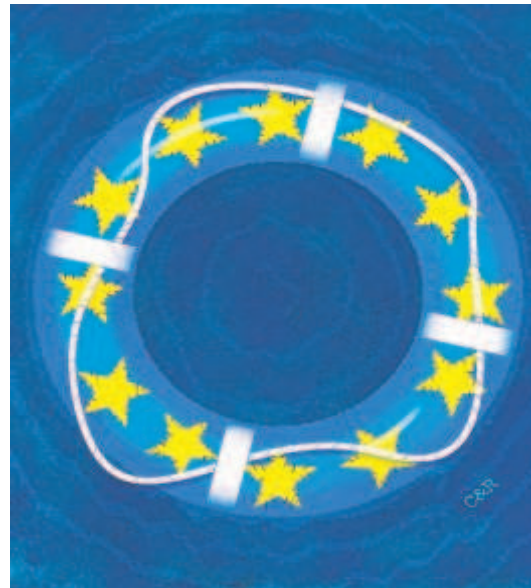
CARBAJO & ROJO

Las élites políticas del sur parecen haber renunciado al objetivo de hacer que nuestros países sean autosuficientes y nos podamos financiar por noso-