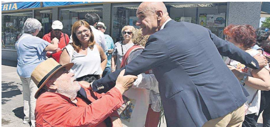
El alcalde de Sevilla, Antonio Muñoz, visitó ayer a los vecinos y comerciantes de la calle Marqués de Pickman.

El objetivo durante el próximo mandato es que en esta arteria se genere un espacio de convivencia, con equipamientos deportivos y zonas de esparcimiento para la ciudadanía. En definitiva, que la Ronda del Tamarguillo se convierta en el eje central de la conexión entre Cerro-Amate y Nervión. “En este momento se está redactando el proyecto y lo que se pretende es ganar un espacio más amable, con sombras, y que se pueda aprovechar como espacio público. Es verdad que, en estos momentos, es una arteria desaprovechada que apenas se utiliza salvo para pasar”, expresó el alcalde. El primer edil puso como ejemplo la reurbaniza-