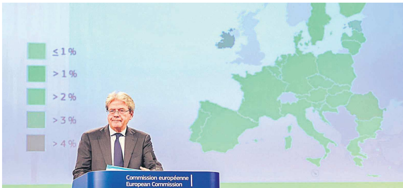
El comisario de Economía de la Comisión Europea, Paolo Gentiloni, en rueda de prensa, ayer en Bruselas.