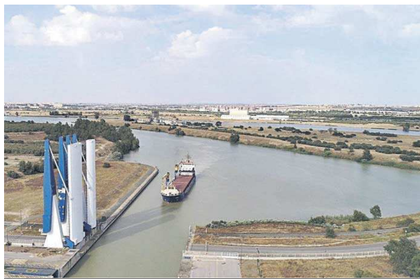
Esclusa del Puerto de Sevilla.

● Hay fondeados varios barcos en Sanlúcar de Barrameda a la espera de acceder a los muelles sevillanos