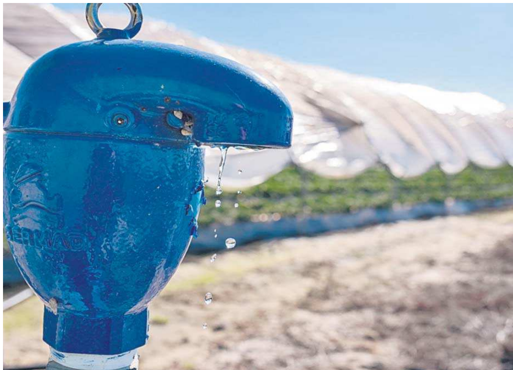
Boca de riego en una finca de cultivo de fresas ubicada en el término municipal de Lucena del Puerto (Huelva).

La situación está marcada por las fuertes restricciones impuestas por la sequía en esta campaña de riego, lo que hace que el agua que corresponde a algunos titulares les resulte insuficiente para sacar adelante sus cultivos.