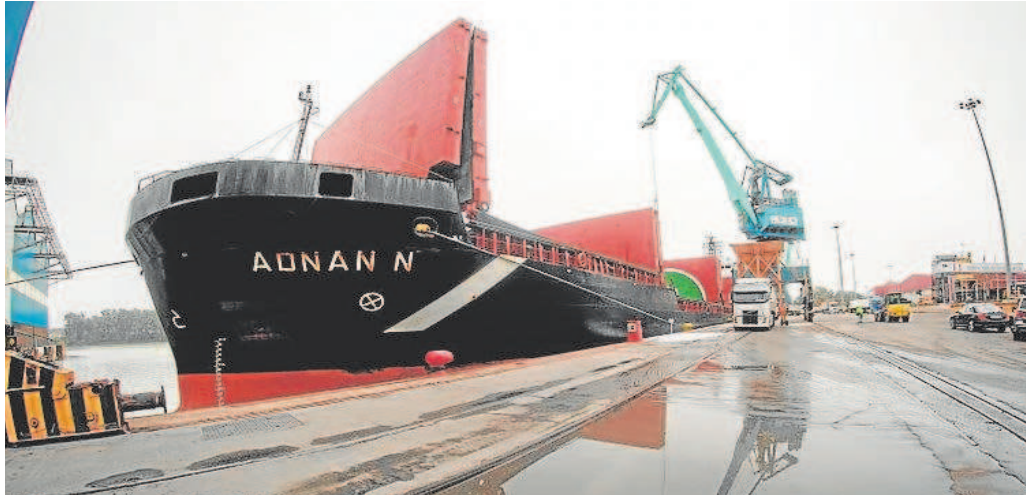
Uno de los grandes buques que accede al Puerto de Sevilla y que necesita del trabajo de los prácticos