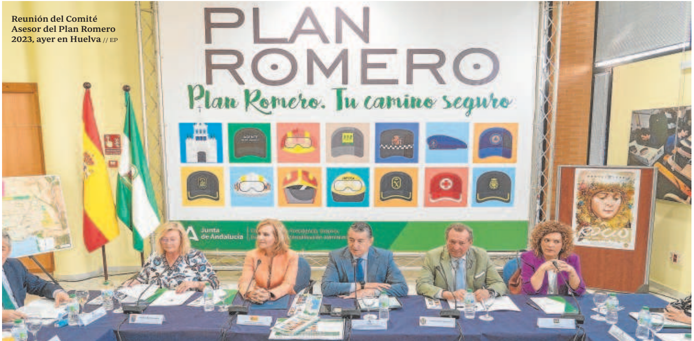
Reunión del Comité Asesor del Plan Romero 2023, ayer en Huelva

Distribuido para CONFEDERACIÓN DE EMPRESARIOS DE SEVILLA * Este artículo no puede distribuirse sin el consentimiento expreso del dueño de los derechos de autor.