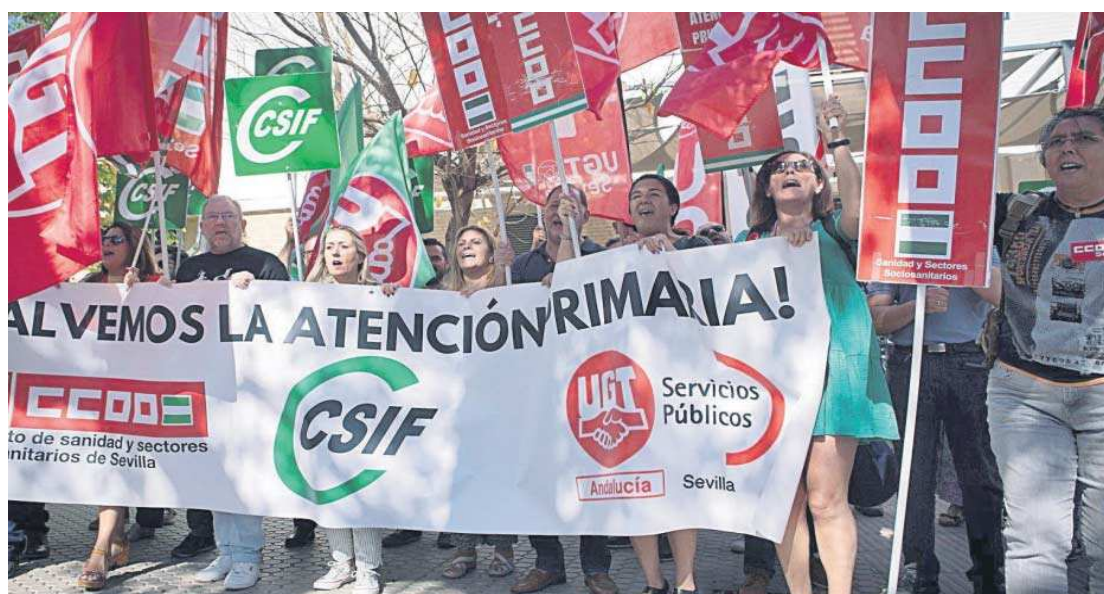
Concentración frente al centro de salud de Amante Laffón en Sevilla el pasado jueves.

● El gerente del SAS convoca para hoy un encuentro por separado con los sindicatos para avanzar las propuestas que propondrá en la mesa técnica prevista para mañana para firmar el acuerdo