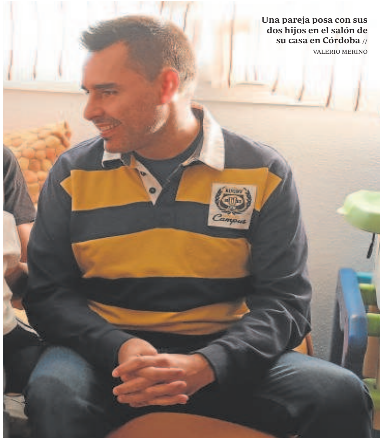
Una pareja posa con sus dos hijos en el salón de su casa en Córdoba //

Explican desde la Consejería de Igualdad que, en muchos casos, la ayuda que se puede prestar a las familias no tiene tanto que ver con las ayudas económicas directas —«que son importantes y hay que contar con ellas», aclaran— como con tener clara la apuesta por los hogares andaluces. Así, se pueden facilitar, señalan, que los niños tengan actividades deportivas en los centros municipales. O que los ayuntamientos reduzcan el IBI a los padres en el caso de familias numerosas. «Ponerse las gafas de familia», insisten en el departamento que dirige Loles López.