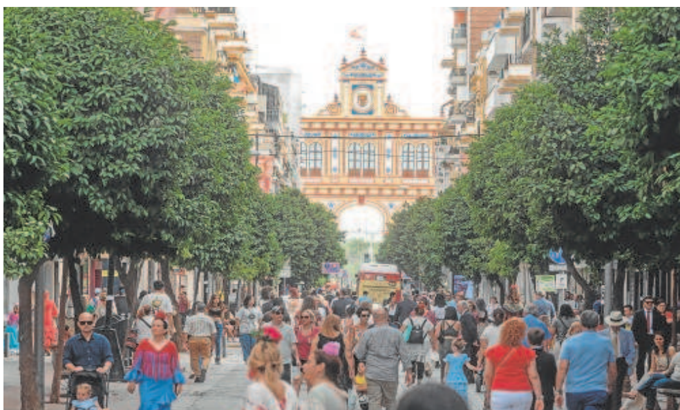
La afluencia a la Feria de Sevilla ha sido mayor este año // MAYA BALANYA

El candidato del PP, José Luis Sanz, apuesta por volver al formato anterior porque la Feria se queda vacía desde el jueves