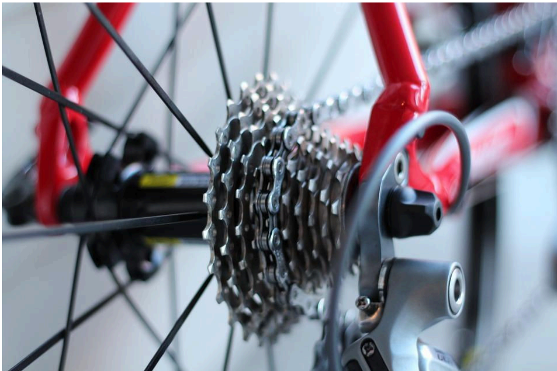
Bicicleta. - AI

El Ministerio de Sanidad destina este año 6,4 millones de euros a promover entornos saludables en el ámbito local para potenciar el transporte a pie y en bicicleta, así como la actividad física al aire libre.