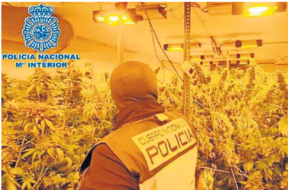
Interior de una casa de Guadacorte dedicada a cultivar cannabis.