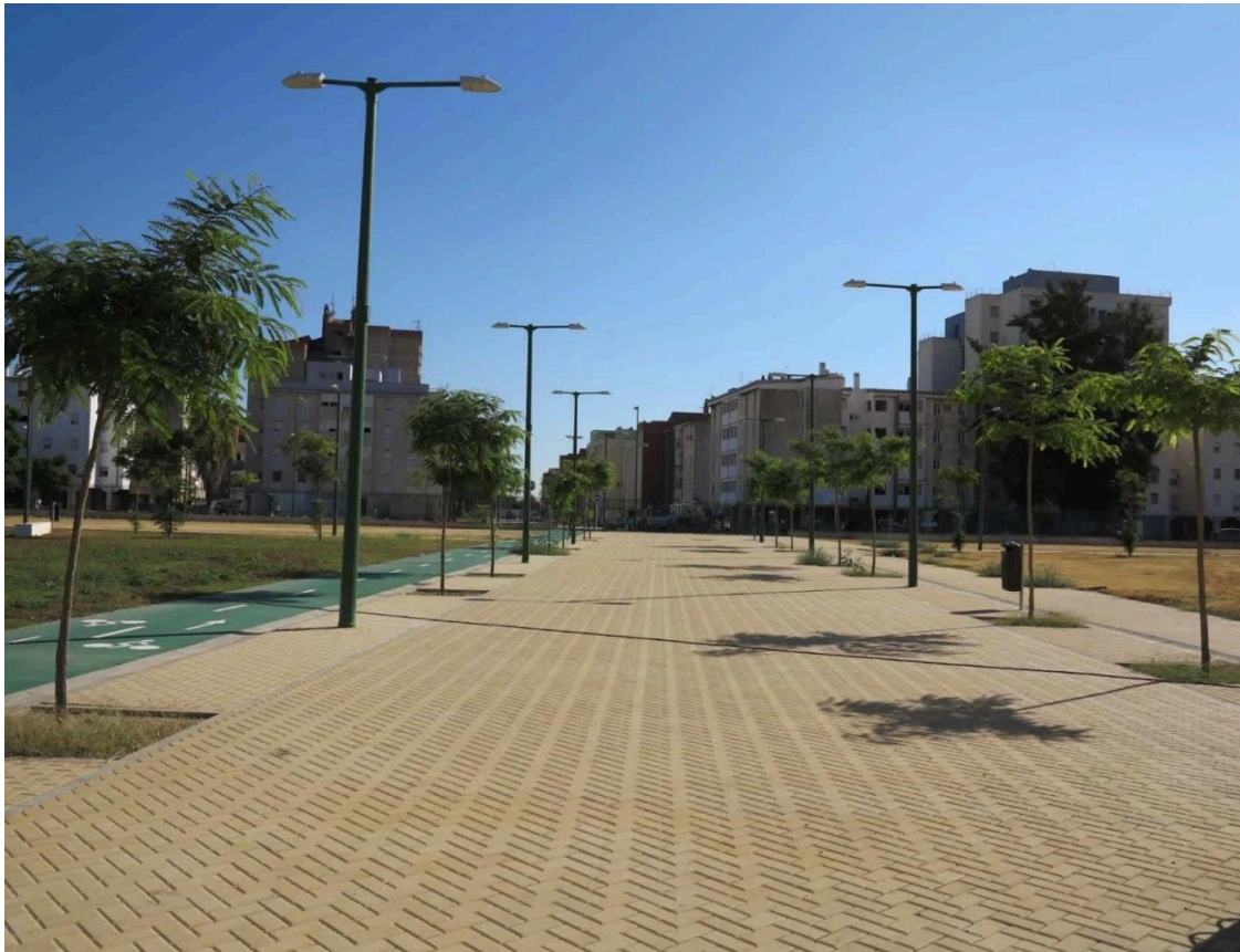
Barriada Martínez Montañés, en el Polígono Sur de Sevilla.

El Ayuntamiento de Sevilla, a través del Área de Empleo, ha iniciado la ejecución de dos de los seis itinerarios profesionales con certificados de profesionalidad en ámbitos sociosanitario y administrativo destinados a personas desempleadas de la ciudad, desarrollados en Polígono Norte, Polígono Sur y Torreblanca y que cuentan con un presupuesto de 324.648 euros.