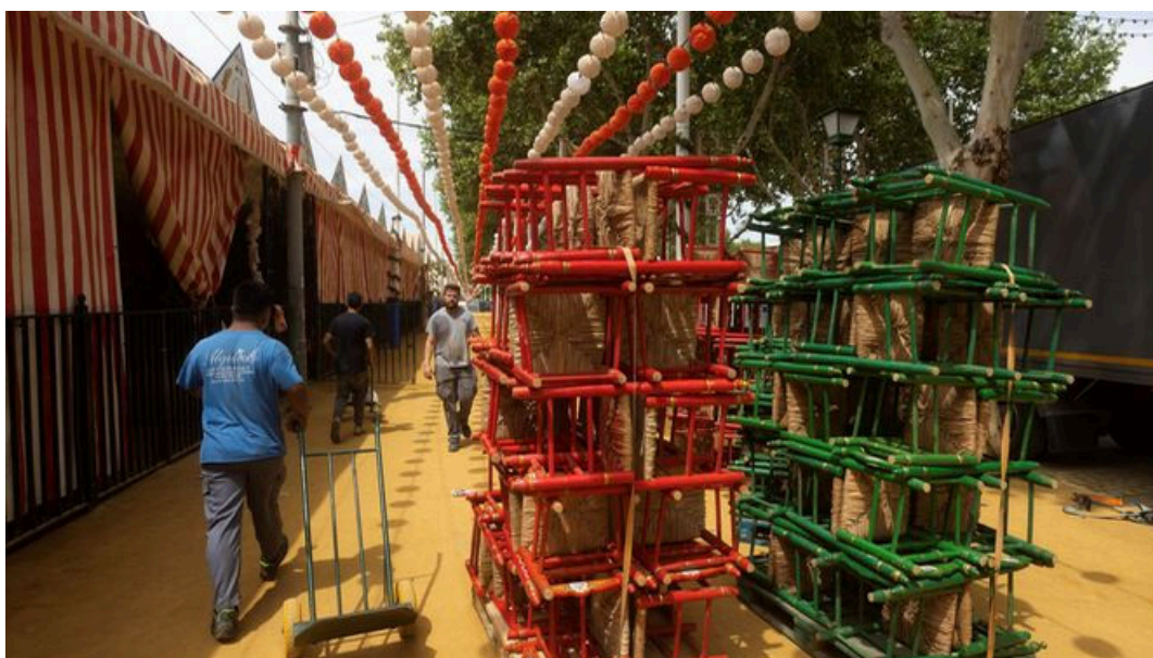
Desmontaje de la Feria este domingo.