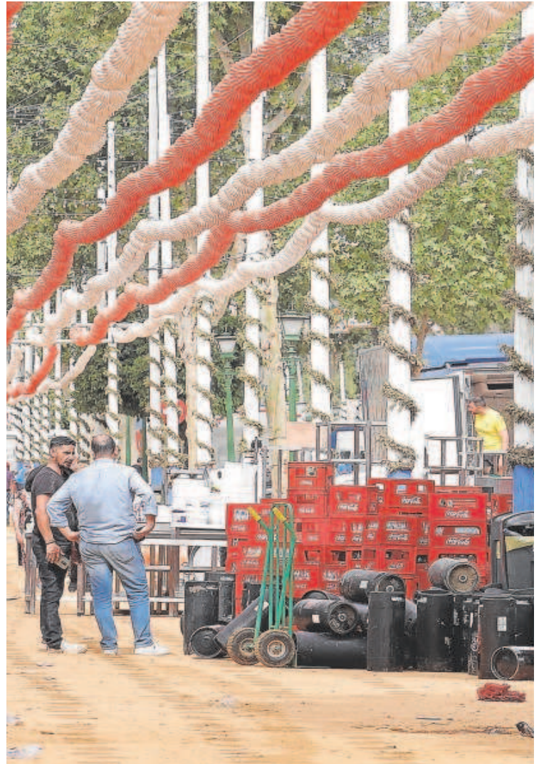
Trabajos de desmontaje de las casetas de la Feria en el día de ayer

Los montadores piden que el recinto se mantenga cerrado para evitar robos del material que trasladan a naves y contenedores