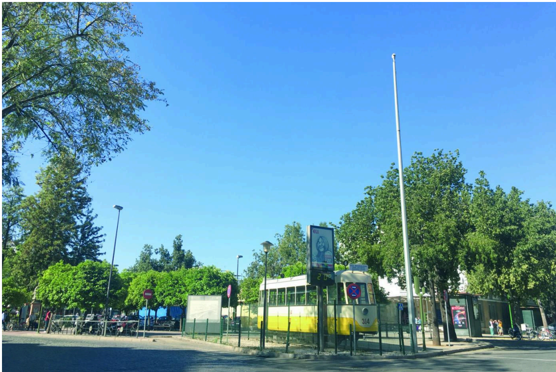
El tranvía 314 ya está en su antiguo emplazamiento. - CT