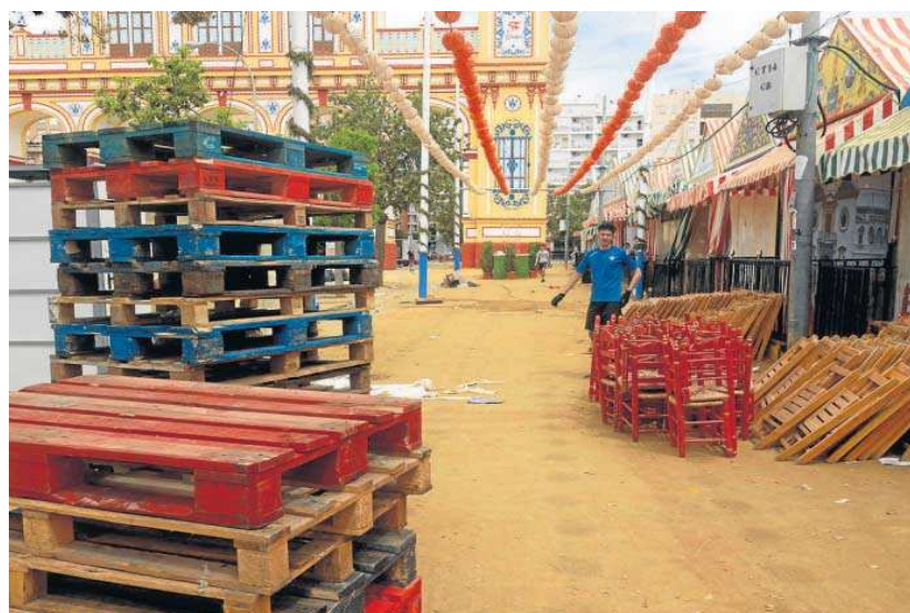
Trabajos de desmontaje de la Feria de Abril que se iniciaron ayer domingo.