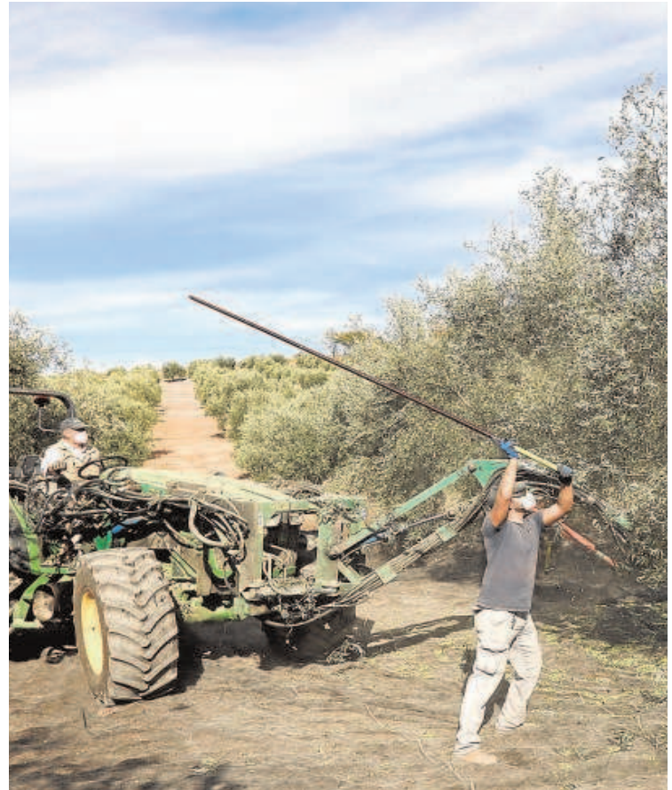
El olivar es uno de los cultivos con una rebaja en los rendimientos más acentuada

La consejera de Agricultura, Pesca, Agua y Desarrollo Rural, Carmen Crespo, anunció que el ejecutivo andaluz trabaja en un informe de correcciones que va a enviar al Gobierno de España para modificar la Orden de reducción de módulos del IRPF, que considera «insuficiente». En concreto, puntualiza que pedirán que la reducción general pase del 25% al 50% para 2022.