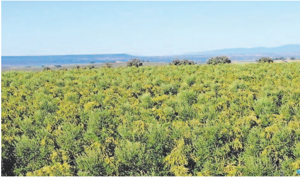
La jornada sirvió para explicar las ventajas de las plantaciones de olivar en seto de marco amplio // TODOLIVO