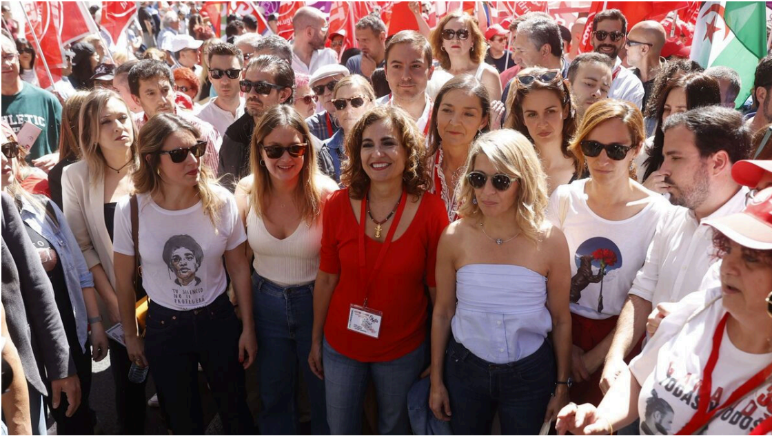
Imagen de la manifestación central convocada por los sindicatos en Madrid