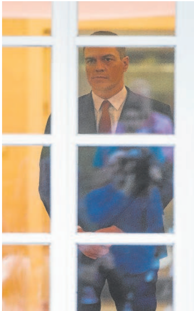
El presidente, Pedro Sánchez, en La Moncloa

Ocurre además que el contexto internacional, marcado indeleblemente desde hace ya más de un año por la invasión rusa de Ucrania, ha venido agudizando esa particular bipolaridad política del jefe del Gobierno español. En su Consejo de Ministros se sientan