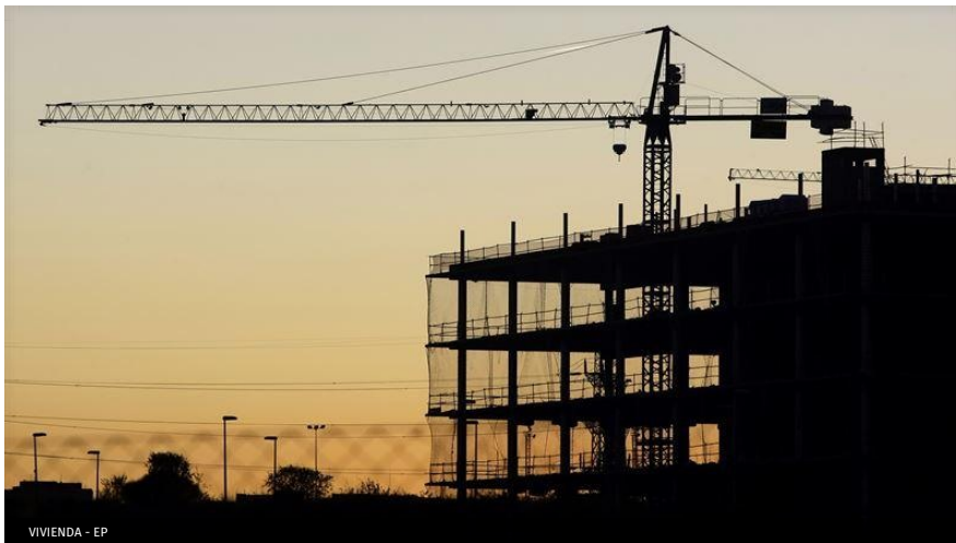
VIVIENDA - EP

El esfuerzo salarial que los ciudadanos tienen que realizar para acceder a una vivienda está muy por encima de lo que recomiendan los organismos