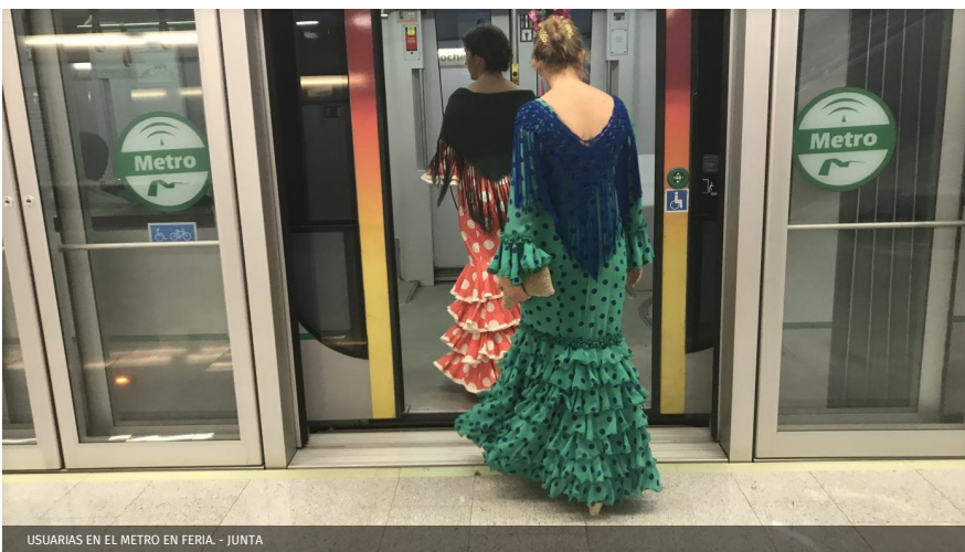
USUARIAS EN EL METRO EN FERIA. - JUNTA

El Metro de Sevilla ha batido su récord durante la Feria, con más de un millón de viajeros transportados, cifra que supera por primera vez en su historia