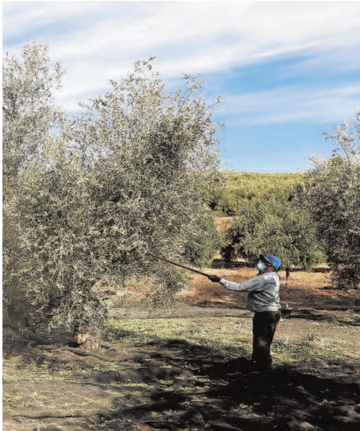
debido al efecto de la sequía y las olas de calor del año pasado

de la superficie por la falta de agua, por lo que la reducción en la provincia de Sevilla (en concreto, en Aznalcázar, Isla Mayor y Coria del Río), se ha pasado del 0,32 al 0,06.