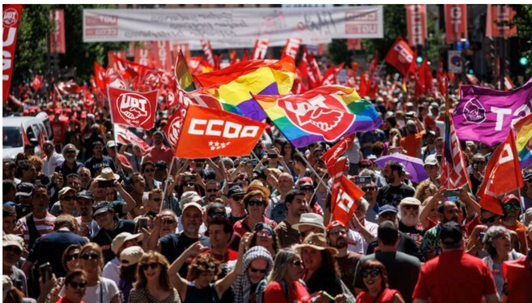
Imagen de la manifestación central convocada por los sindicatos en Madrid

Miles de personas han salido este Primero de Mayo a las calles en más 70 manifestaciones convocadas por UGT y CCOO, que han lanzado un ultimátum a la patronal CEOE para que cierre un acuerdo salarial o, han advertido, la conflictividad irá en aumento con huelgas en los sectores con convenios bloqueados.