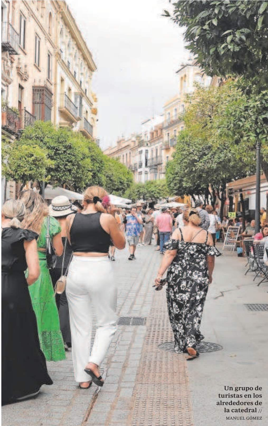
Un grupo de turistas en los alrededores de la catedral

Distribuido para CONFEDERACIÓN N DE EMPRESARIOS DE SEVILLA * Este artículo no puede distribuirse sin el consentimiento expreso del dueño de los derechos de autor.