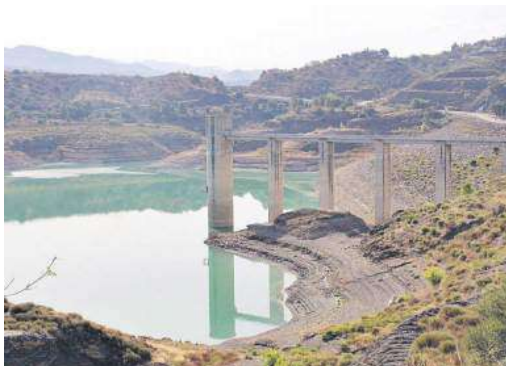
Presa de La Viñuela al 15,9% de su capacidad total.