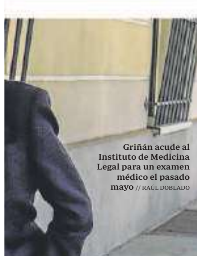
Griñán acude al Instituto de Medicina Legal para un examen médico el pasado mayo