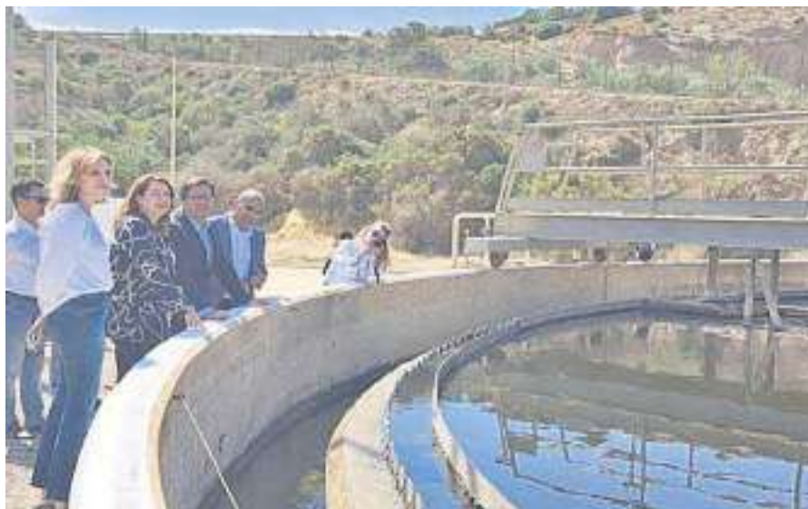
Visita de la consejera Carmen Crespo a la estación depuradora de aguas residuales Balerma (Almería).