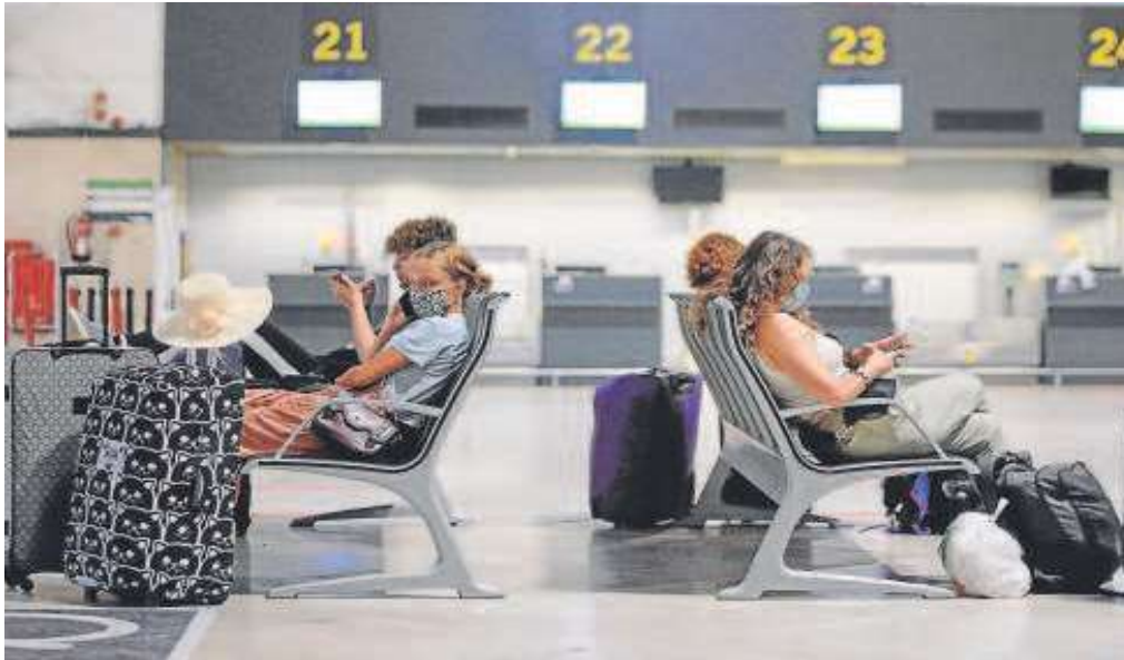
El robo se cometió el pasado miércoles cuando había en ese momento unos 200 vehículos