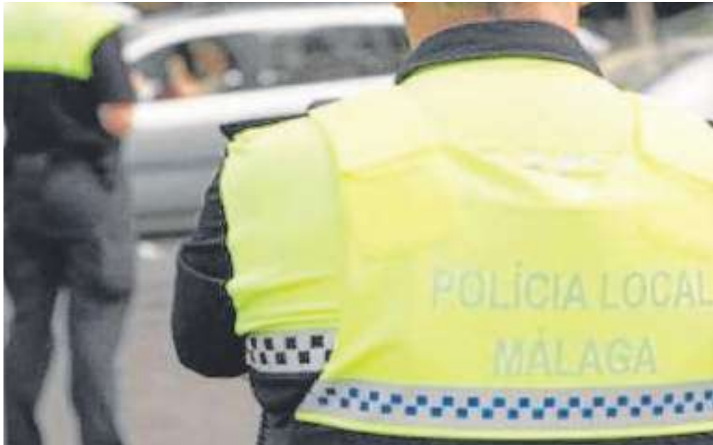
Agentes de la Policía Local de Málaga patrullando la ciudad