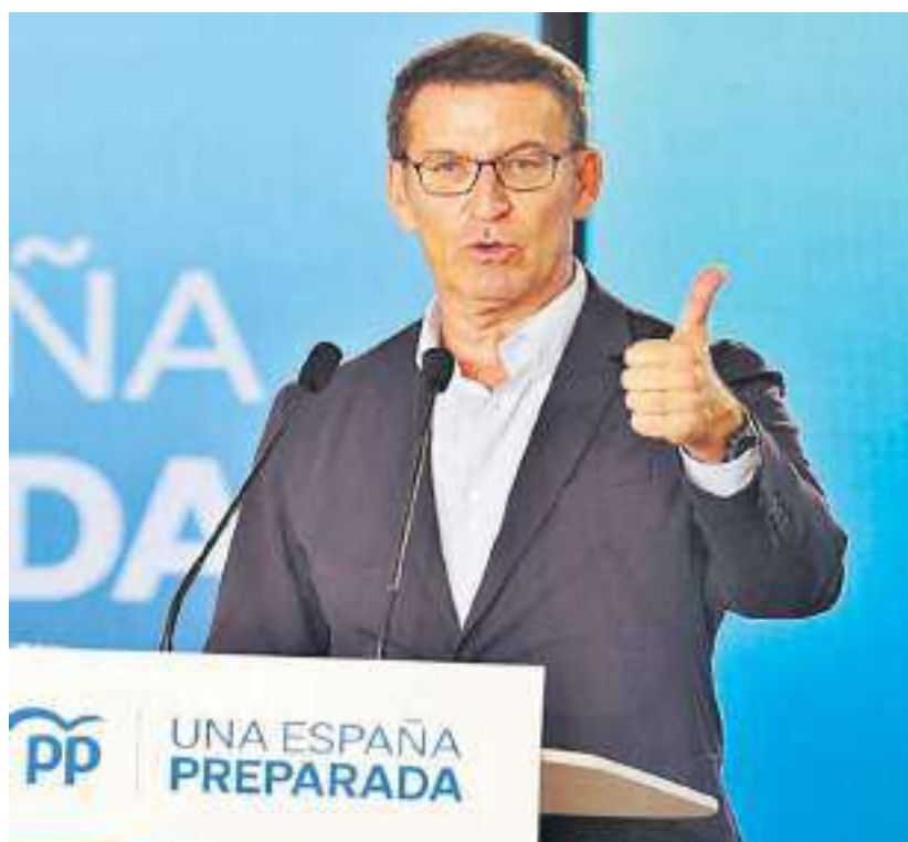
Alberto Núñez Feijóo presenta sus medidas económicas en Barcelona.

Entre las primeras medidas de su mandato, avanzó, estará la de impulsar una auditoría de las cuentas públicas, y reducir el número de ministerios y de altos cargos hasta prácticamente un 70% menos que ahora "No tendré 22 ministros, porque entre