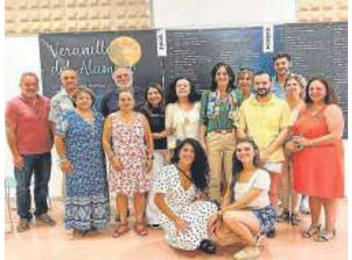
Presentación de la nueva edición de ‘Los veranillos del Alamillo’

Cayuelas, asistió ayer a la presentación del programa completo de ‘Los veranillos del Alamillo’, que se extenderán desde el 3 de julio hasta el 27 de agosto, poniendo en valor precisamente la principal novedad en la oferta de este año, tal como destacó la Junta en una nota de prensa: «El deporte no podía estar al margen de nuestros ‘veranillos’, en un lugar como este parque, principal referente para cientos de personas que habitualmente vienen aquí a practicar el ejercicio físico en sus distintas modalidades», explicó la delegada que, además, destacó la ubicación del Alamillo junto al Guadalquivir, «lo que hace de este recinto un lugar