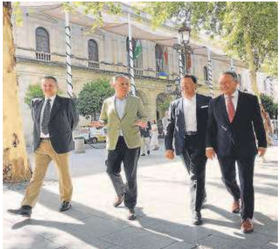
El alcalde con los tres gerentes tras los consejos de administración

En la etapa de Antonio Muñoz, las gerencias de estas dos sociedades municipales se la repartían dos personas, que cobraban cada una 70.000 euros brutos anuales. Torreglosa va a percibir 10.000 euros más que la suma de esas dos nóminas; si bien fuentes municipales sostienen que hay un ahorro en el coste de las nó-