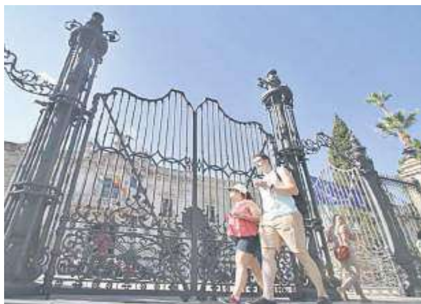
Acceso principal al Rectorado de la Universidad de Sevilla en el Prado de San Sebastián.