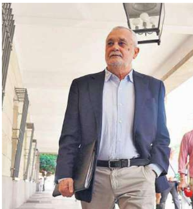
José Antonio Griñán, a su llegada a los juzgados de Sevilla el pasado 18 de mayo.

Los magistrados argumentan en su resolución que la concesión del beneficio de la suspensión de la ejecución de la pena privativa de libertad “es una potestad discrecional del juez o tribunal”, y señalan que, en el caso del artículo 80.4 del Código Penal, “en ese ámbito de discrecionalidad se debe atender a que el penado se encuentre aquejado de una enfermedad muy grave con padecimientos incurables”.