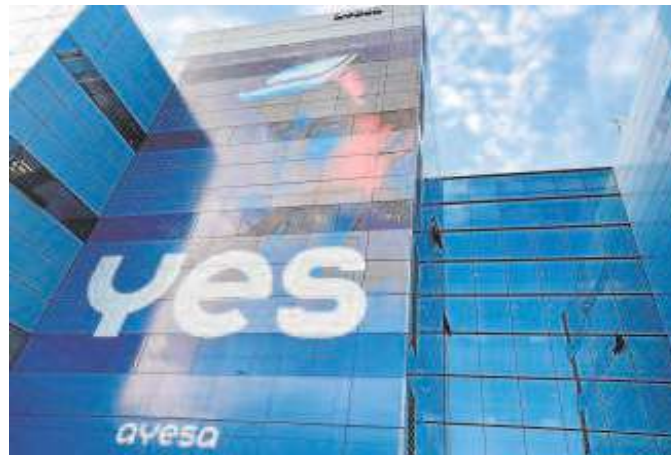
Sede de Ayesa en el Parque Científico Tecnológico Cartuja

La participación de la Junta en Ayesa AT tiene su origen en la creación de la ya extinta Sociedad Andaluza para el Desarrollo de Informática y la Electrónica (Sadiel) en 1984 por parte del Gobierno andaluz, para la gestión de sus sistemas informáticos. En el año 2000 se decidió abrir al sector privado tanto su labor, como su capital social. Actualmente, Ayesa AT sólo cuenta con dos socios: el Grupo Ayesa, con un 78%, y Soprea, con el 22%. Se trata, por tanto, de una empresa mayoritariamente privada, que ha visto cumplida su tarea como entidad estratégica para mantener una participación pública.