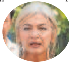
P. DEL POZO

De esta forma, como adelantó ABC, los alumnos andaluces cursarán durante su paso por la etapa educativa obligatoria un total de 875 horas de lectura. Ese tiempo, sin embargo, deberá estar integrado dentro de la forma-