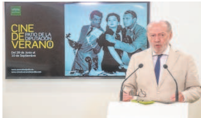
El presidente de la Diputación de Sevilla, Fernando Rodríguez Villalobos, ayer durante la presentación

Como es habitual en este festival veraniego, habrá una proyección diaria, cada día de la semana, incluyendo los domingos. En total habrá 75 proyecciones con el formato tradicional de este cine de verano. Los lunes estarán dedicados al cine español. Los domingos, al