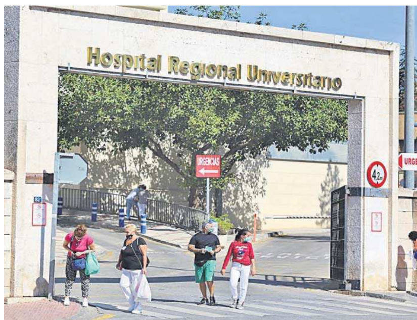
Hospital Regional de Málaga.

Dentro de estas contrataciones se encuentran los 12.000 profesionales de refuerzo Covid. En este sentido, cabe recordar que en enero se informó de la contratación de los facultativos (alrededor de 1.000 médicos) por un año hasta el 31 de diciembre de 2023. A estos 1.000, se suman otros 7.000 profesionales (8.000 en total) de diversas categorías que continuarán hasta el 31 de diciembre de este año y el resto de los profesionales, alrededor de