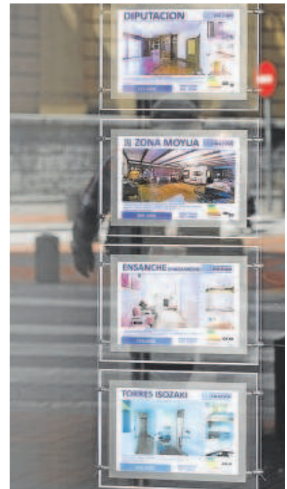
Una mujer en Bilbao frente a una inmobiliaria

El supervisor hablaba de una caída del 12,2% interanual de los préstamos en vigilancia hasta diciembre de 2022, hasta el 7,1% del total del crédito al sec-