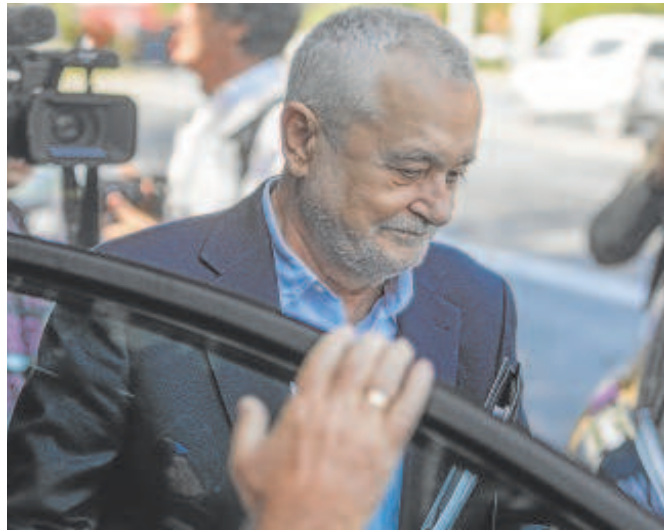
El expresidente de la Junta de Andalucía José Antonio Griñán

la jurisprudencia del Tribunal Constitucional que reconocía «un amplio margen de discrecionalidad o arbitrio en la concesión o denegación de la suspensión». Para tomar una postura se «precisa una motivación fundada en Derecho» que «pondera los bienes y derechos en conflicto, esto es, de un lado, la seguridad colectiva y, de otro, el derecho a la vida e integridad física del condenado», afirma en su escrito.