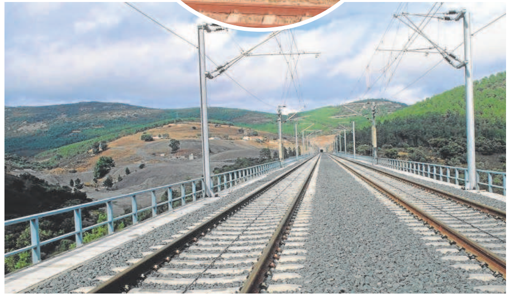
Un viaducto de la línea Madrid-Sevilla en Sierra Morena. Arriba, imagen captada por un viajero parado en Calatrava

tuvo que retrasarla hasta que el AVE llegó a Santa Justa.