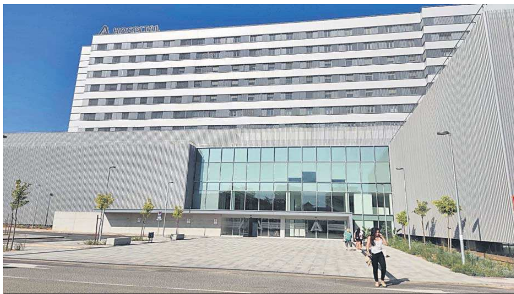
Varias personas, ayer, a las puertas del antiguo Hospital Militar, el más afectado por el cierre de camas del plan de verano del SAS.