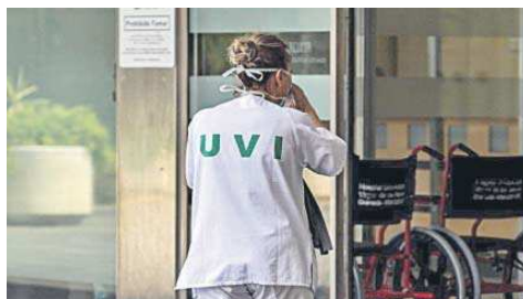
Personal sanitario en el interior de un hospital.

El plan de verano del SAS que tan criticado está siendo por sindicato y profesionales sanitarios no sólo incluye el cierre de plantas, quirófanos y consultas. Para ajustar las plantillas de cara a las vacantes previstas en los próximos meses por las vacaciones estivales, la Administración andaluza ha autorizado la contratación de 6.705 profesionales. La mayoría para atención hospitalaria, donde se