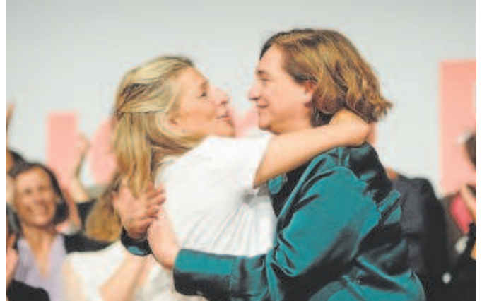
Yolanda Díaz y Ada Colau se abrazan en un mitin de Sumar