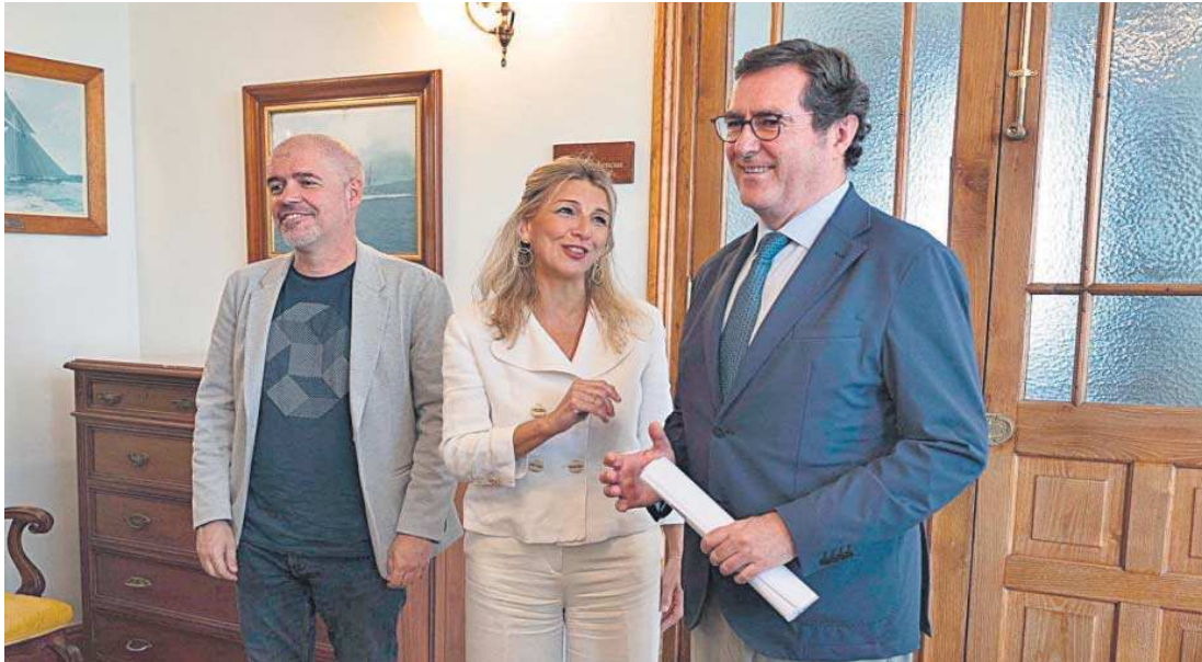
Unai Sordo, Yolanda Díaz y Antonio Garamendi, ayer, en Santander.