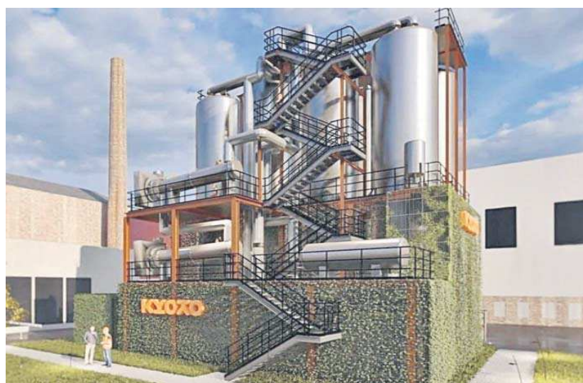
Representación gráfica de Heatcube, la solución desarrollada por Kyoto.