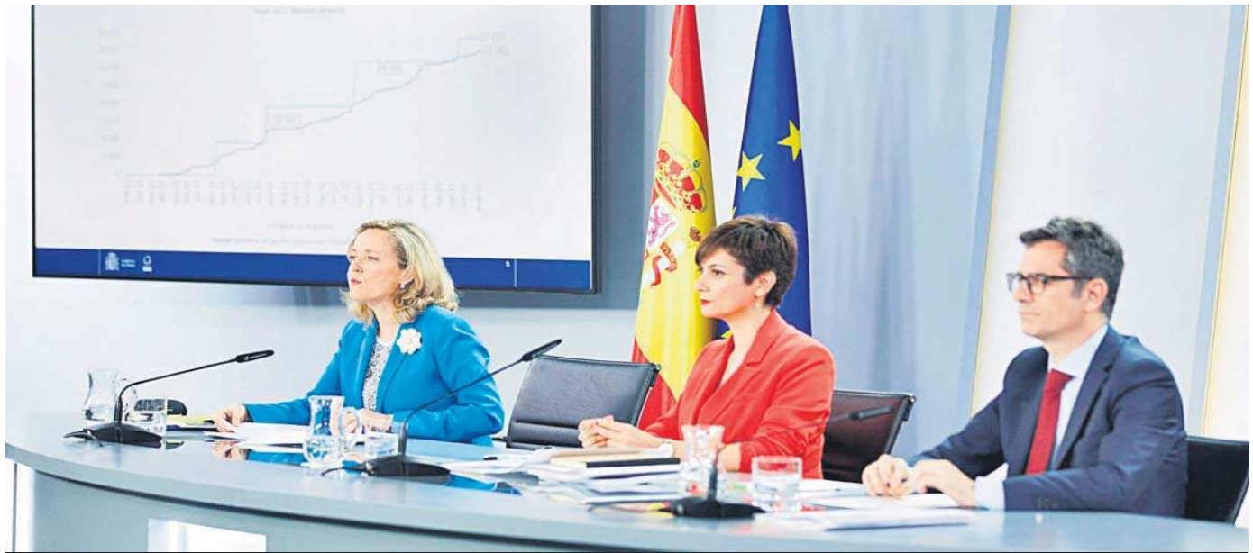
Nadia Calviño, Isabel Rodríguez y Félix Bolaños, ayer en rueda de prensa en la Moncloa.