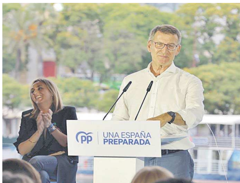
Alberto Núñez Feijóo durante un acto por la tarde en Sevilla.

E ironizó sobre el papel en el debate de Arnaldo Otegi (EH Bildu) u Oriol Junqueras porque para saber las cosas que “oculta” Sánchez en Euskadi o en Cataluña hay que escuchar a ambos líderes, que según el líder del PP han pactado un estado plurinacional o un referen-