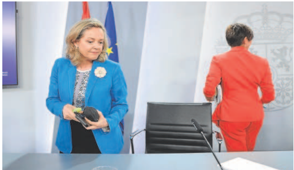
La ministra Portavoz, Isabel Rodríguez (de espaldas), junto a la vicepresidenta primera, Nadia Calviño

Tras la aprobación de la adenda ayer por parte del Consejo de Ministros, en los próximos días el Gobierno remitirá el texto a la Comisión Europea, que