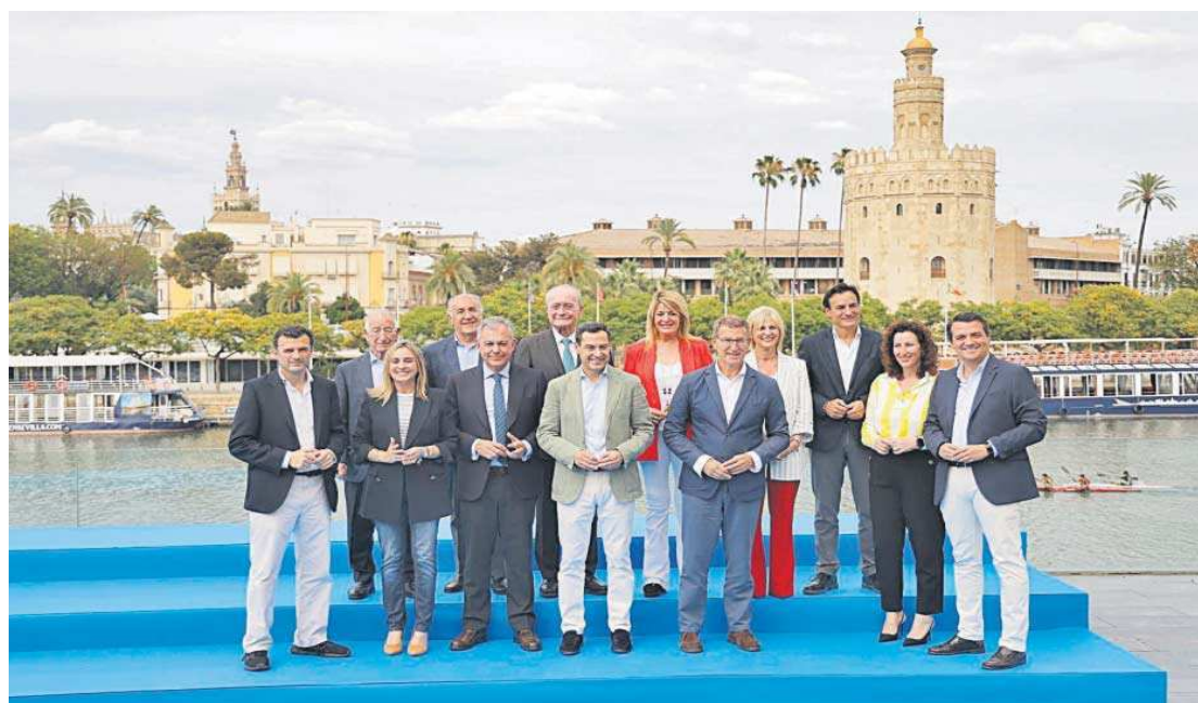
Juanma Moreno y Alberto Núñez Feijóo con los alcaldes populares de las ciudades andaluzas de más de 100.000 habitantes, ayer en Sevilla.