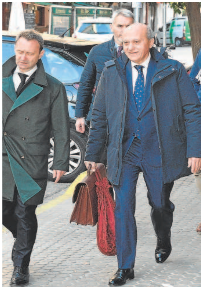
José María del Nido, llegando a los juzgados hace varios meses