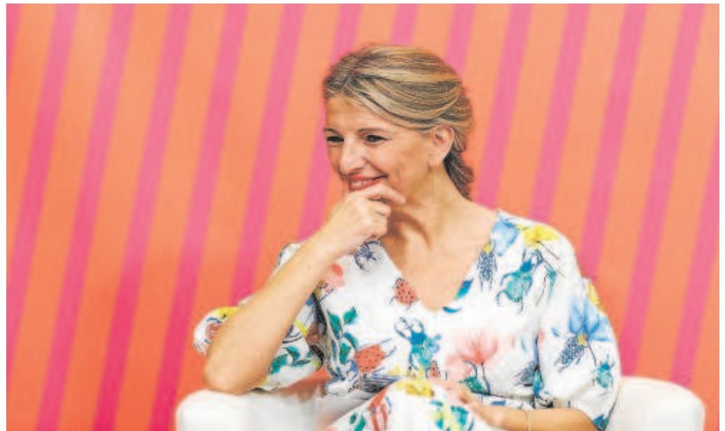
La vicepresidenta Yolanda Díaz, en un acto en su ministerio sobre igualdad efectiva entre hombres y mujeres

Si la semana pasada no lograron avanzar en nada, el comienzo de ésta solo ha servido para que el exlíder de Podemos, Pablo Iglesias, intoxique el ambiente y enfrente a su partido con los aliados de Sumar. La pérdida de poder territorial del partido morado después del 28M provoca que partidos regionalistas aliados de la vicepresidenta segunda, Yolanda Díaz, se presenten como líderes en sus territorios y reivindiquen los puestos de salida en sus circunscripciones. Pero el partido de