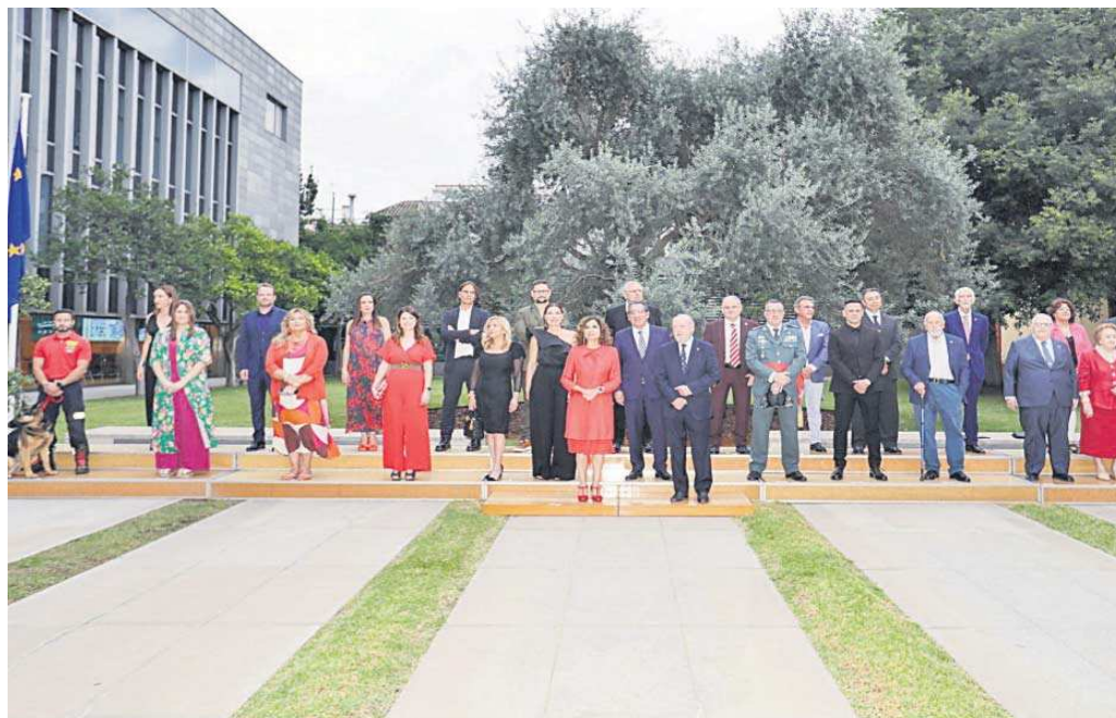
Los condecorados con las medallas de la provincia y con el título de hijo adoptivo en el patio del olivo de la sede de la Diputación.