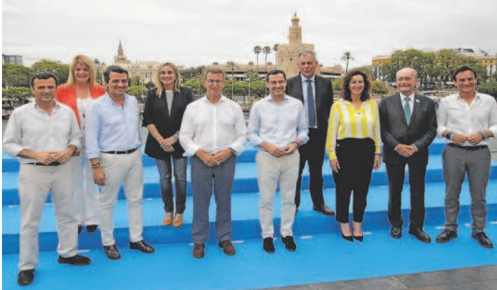
Feijóo y Moreno, con los alcaldables del PP de las principales poblaciones andaluzas, ayer en Sevilla