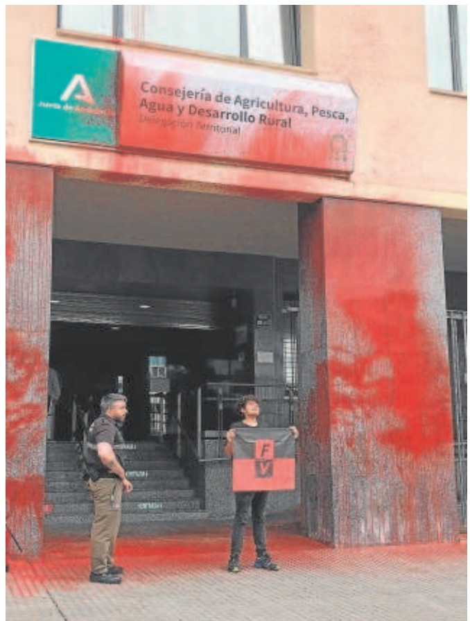
Un activista en la sede vandalizada de la Junta en Cádiz

Ribera atribuye las dudas que han alentado el boicot a la fresa a «una campaña de acoso a Doñana por parte del PP y Vox»