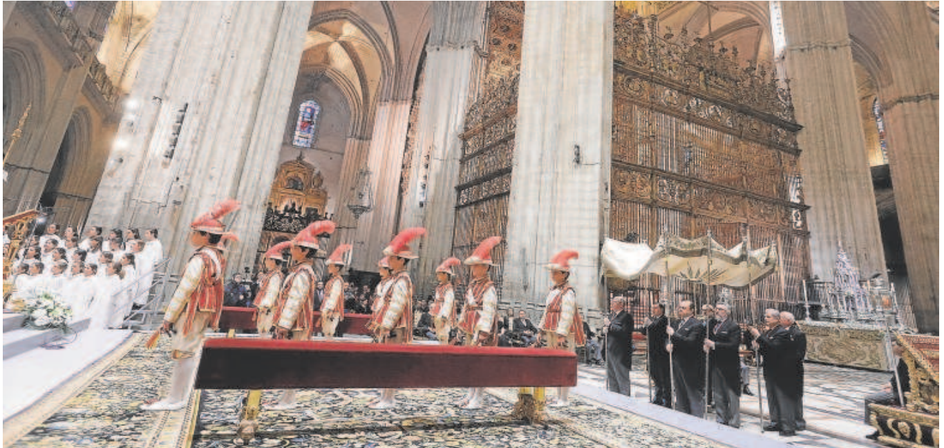
Los niños seises en el estrado del altar del jubileo delante del palo de custodia del Santísimo dispuesto para la procesión

▶▶▶ pejada tras la celebración pasada la una de la tarde.