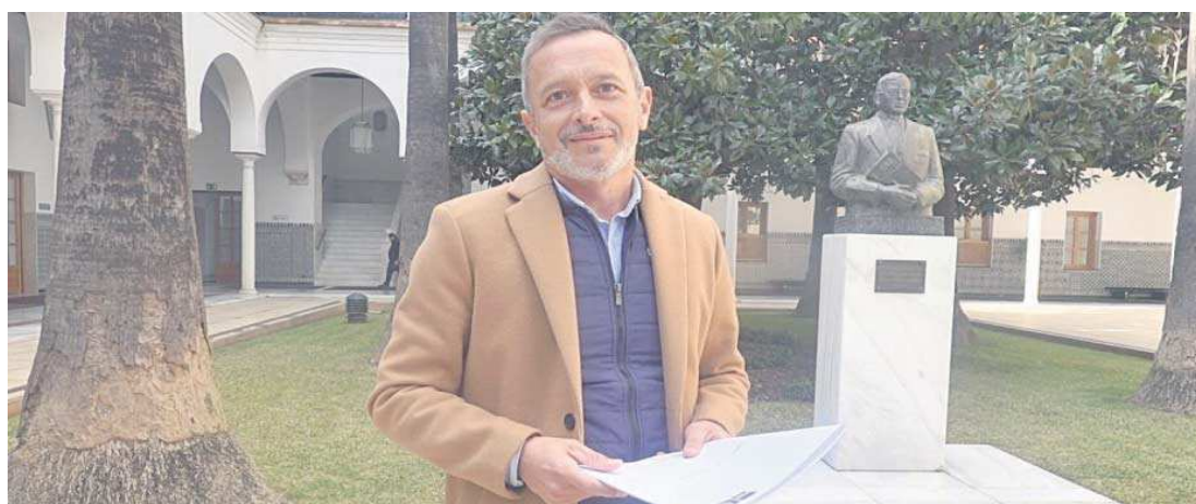
Rafael Recio, secretario de Organización del PSOE de Sevilla.