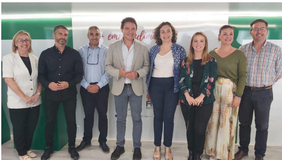
Autoridades y técnicos posaron desde el Autobús del Emprendedor.

El llamado Autobús del Emprendedor de Andalucía visitaba este jueves Arcos como parte de una iniciativa que arrancaba en Sevilla el 31 de mayo de la mano de la Asociación de Trabajadores Autónomos (ATA) y la Confederación de Empresarios de Andalucía (CEA) dentro del programa Más Emprendimiento, Más Andalucía.