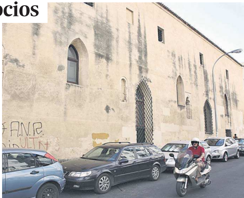
Un motorista circula junto a la fachada exterior del convento de San Agustín.

En el espacio que resta de la antigua iglesia, correspondiente con la nave central y la nave del evangelio, se situará la edificación considerada de nueva construcción, que alcanzará las seis plantas de altura y en la que se dispone el grueso de las habita-