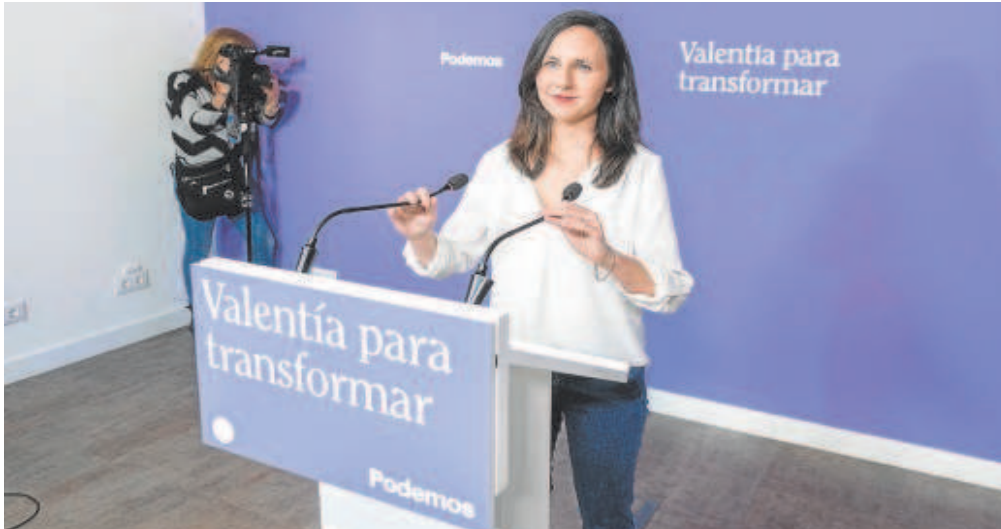
La ministra y líder de Podemos, Ione Belarra, está llevando la negociación con Sumar al extremo