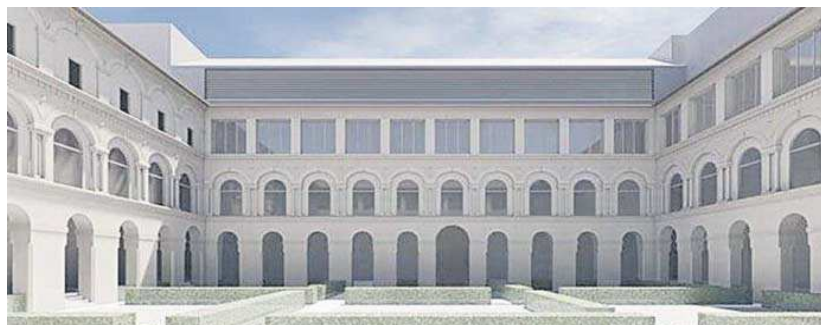
Recreación de la fachada Sur interior del histórico inmueble tras la rehabilitación.