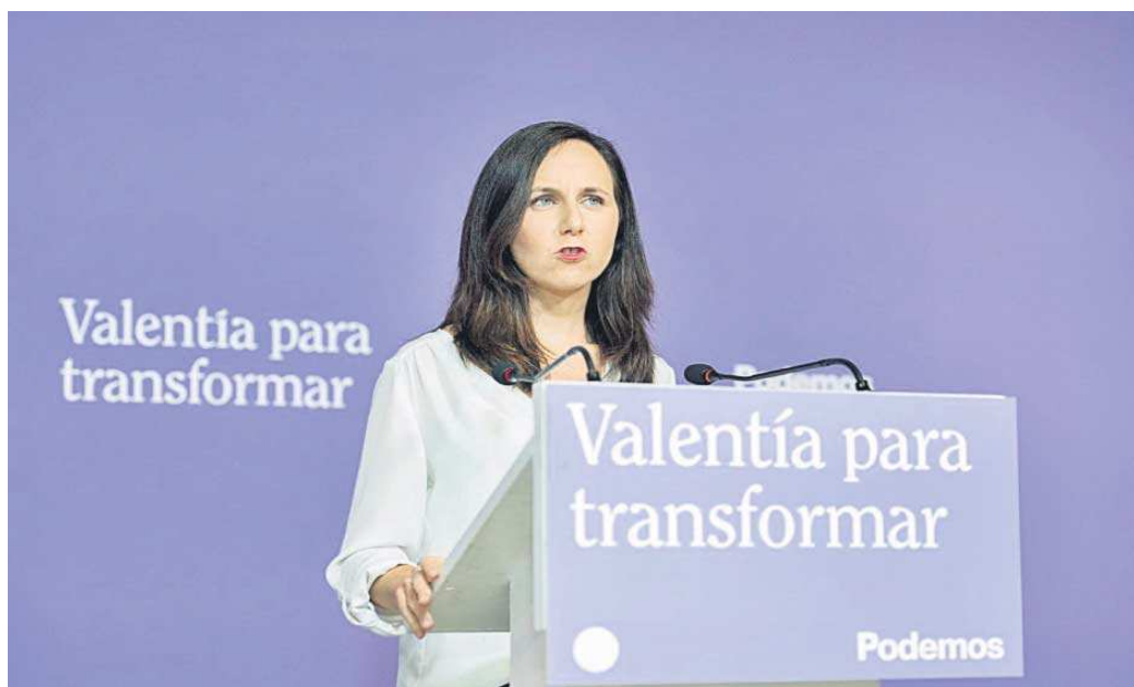
Ione Belarra atiende a los medios de comunicación en la sede de Podemos de Madrid.

“Como bien sabéis, las negociaciones no están siendo sencillas y por eso quiero pedirte tu