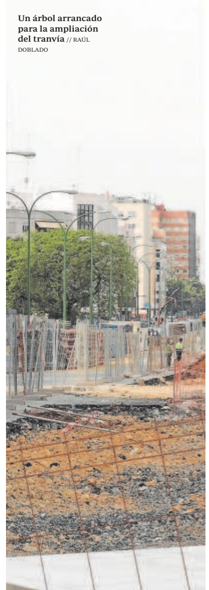
Un árbol arrancado para la ampliación del tranvía

Sobre la declaración de emergencia climática que tanta prisa se dio el Ayuntamiento por establecer también tiene algunas consideraciones: «se declaró, se hicieron muchas promesas, pero han pasado ya más de tres años desde que se convocó la última reunión oficial de la Mesa del Árbol, privando así de voz a las más de veinte asociaciones ecologistas y ciudadanas agrupadas en esa mesa». Y no es que en ese tiempo no haya habido motivos para convocarla, con numerosas reurbanizaciones que han afectado a los árboles como la plaza de la Magdalena, la avenida de la Cruz Roja o la propia Cartuja Qanat, que se ha construido sobre uno de los bulevares del parque tecnológico. En este tiempo también ha habido casos que han generado ruido mediático como la autorización para talar el ficus de San Jacinto, un procedimiento que se ha judicializado y que se intenta reconducir con los brotes que han salido tras la agresiva tala. Polémica fue también la decisión de arrancar la arboleda de la avenida San Francisco Javier para la ampliación del Metrocentro, un proyecto que tuvo en contra a la plataforma Salva tus árboles, quien acusó al Ayuntamiento de incumplir las indicaciones para trasplantarlos que marca el Plan Director. En concreto de no hacer las podas previas y elegir las fechas adecuadas, lo que puede suponer que todos esos ejemplares, que estaban sanos y eran adultos proporcionando buena sombra, se terminen secando.