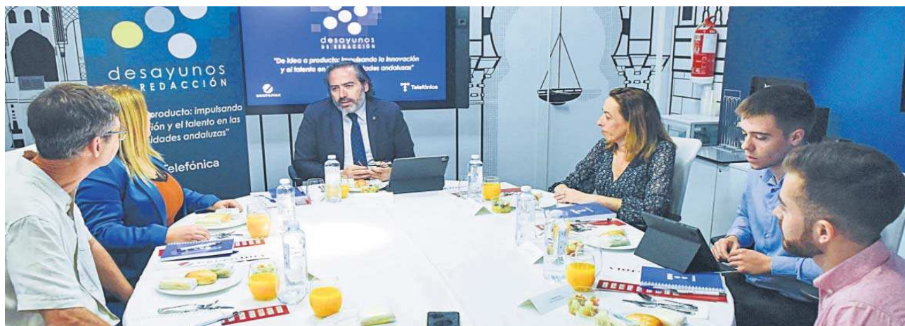
Uno de los instantes del desayuno, celebrado en el Centro de Innovación que tiene Telefónica en la calle Jiménez Aranda de Sevilla.

Distribuido para CONFEDERACIÓN DE EMPRESARIOS DE SEVILLA * Este artículo no puede distribuirse sin el consentimiento expreso del dueño de los derechos de autor.