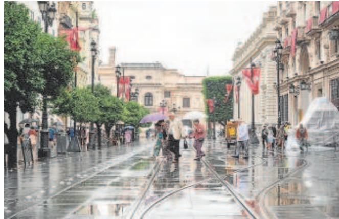
Algunos transeúntes bajo la lluvia en la avenida de la Constitución

La tormentosa mañana aguó la fiesta. Las calles estaban casi vacías, lo mismo que los bares. Sólo había paraguas y chubasqueros