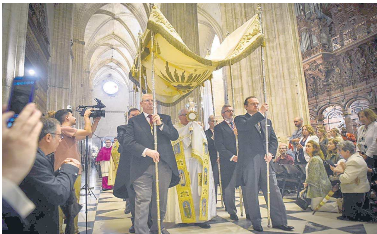
La procesión del Santísimo, bajo palio y portado por el arzobispo de Sevilla, discurre por las naves de la Catedral en un Corpus marcado por la lluvia.