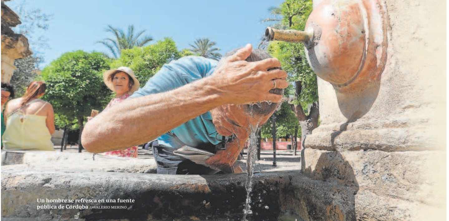
Un hombre se refresca en una fuente pública de Córdoba