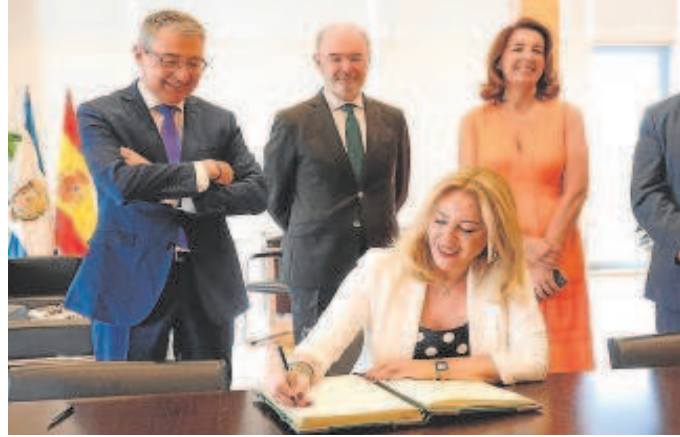
La consejera de Economía, con el presidente de la Diputación de Málaga