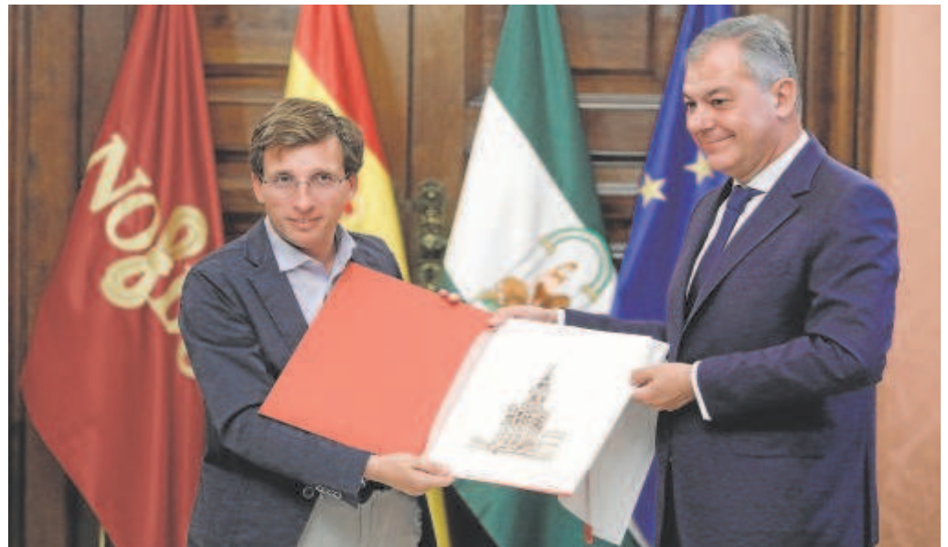
Martínez Almeida recibió un grabado de la Giralda y firmó en el Libro de Honor del Ayuntamiento de Sevilla

Por su parte, Martínez Almeida ha insistido en que «para Madrid es estratégico estar conectada con Sevilla y seguir intercambiando conocimientos y experiencias». «El alcalde de Sevilla contará con toda nuestra colaboración en esos cuatro puntos».