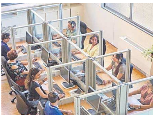
Operadores del Servicio Andaluz de Telesistencia.

Durante todo el verano se ofrecerá información y recomendaciones a las personas usuarias de telesistencia relacionadas con las altas temperaturas como, por ejemplo, evitar salir en las horas más fuertes de sol y permanecer en los lugares más frescos de la casa. También es muy importante mantener una correcta hidratación, para lo que se recomienda tomar agua aunque no tenga sed, zumos y bebidas frescas (sin alcohol). Una dieta equilibrada y ce-