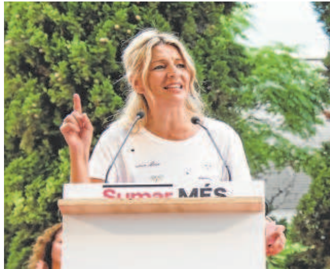
La vicepresidenta y ministra de Trabajo Yolanda Díaz ayer en Palma

En el decreto que también involucra al gabinete del ministro José Luis Escrivá se permite dotar el fondo con dinero procedente del superávit existente por la recaudación de cuotas de formación que pagan las empresas (cuyo remanente acumulado calculan los sindicatos asciende a 5.000