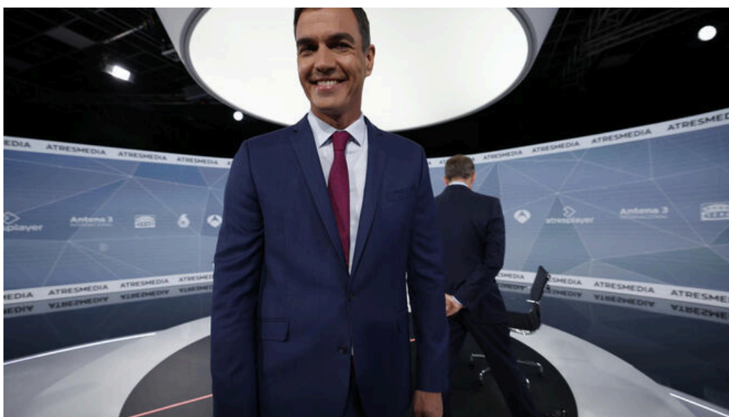
Pedro Sánchez, antes del debate

Pedro Sánchez y Alberto Núñez Feijóo han debatido este lunes en un bronco debate cara a cara organizado por Atresmedia, el único en el que ambos intervendrán durante la campaña. Estas son las diez frases más destacadas que el líder del PSOE ha cruzado con el candidato popular: