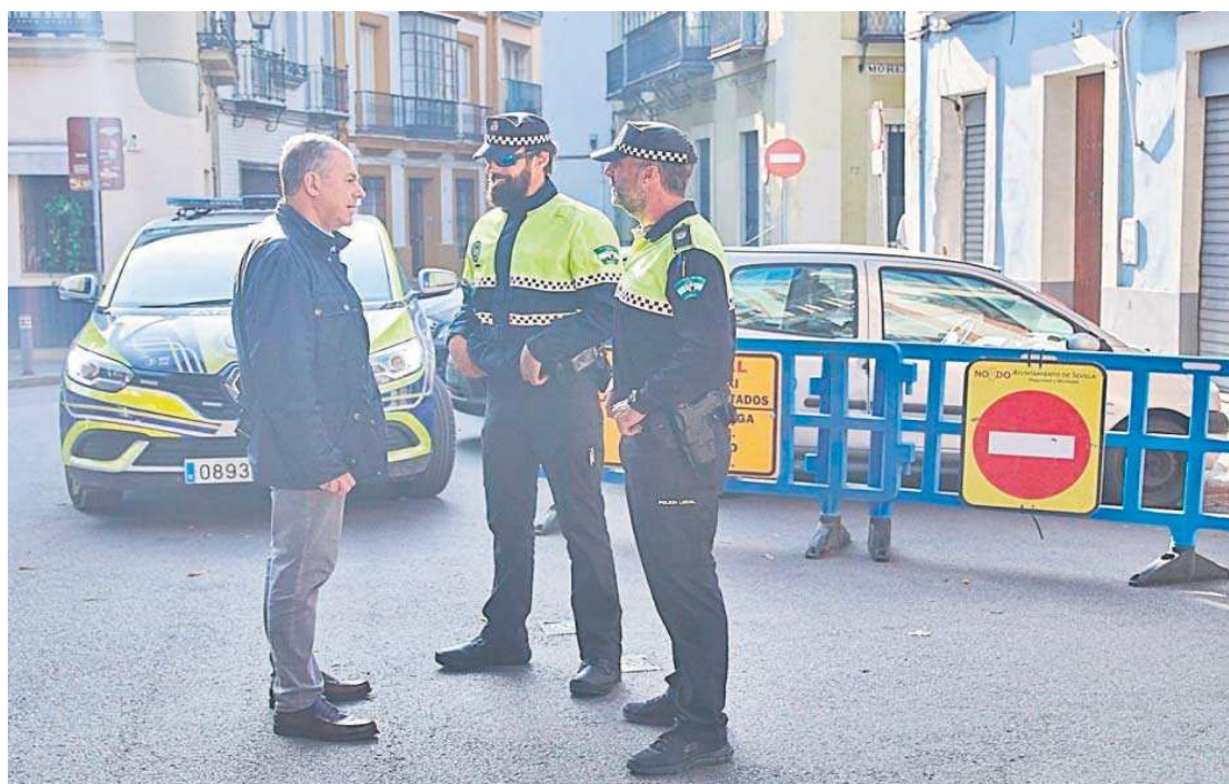
El alcalde de Sevilla, José Luis Sanz, conversa con dos agentes de la Policía Local, en una imagen de archivo.

● Informa a la juez de que con esta demora se causaría “el menor daño posible” al servicio de la Policía Local y también a los afectados que participaron “de buena fe” ajenos al amaño