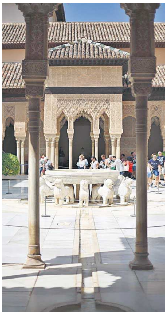
El Patio de los Leones de la Alhambra.

Sanz recordó que el Gobierno de la Junta aprobó recientemente poner en marcha la primera estrategia andaluza de inteligencia artificial. “Hoy ya hay 46 iniciativas de inteligencia artificial que estamos aplicando en diferentes ámbi-