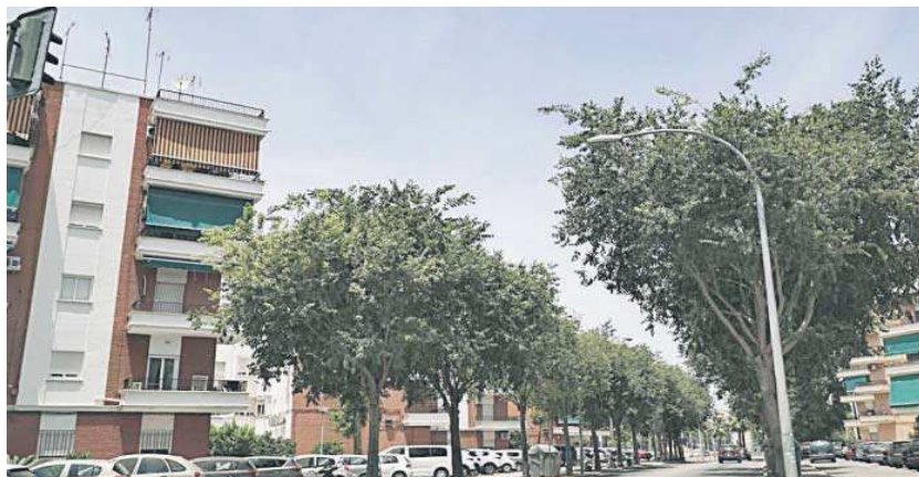
Árboles en la barriada de Tablada.