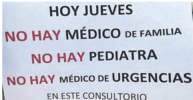
Cartel informativo en la Zona Básica de Estepa.

La reacción de la Marea Blanca no se ha hecho esperar: “La única respuesta del gobierno del PP de la Junta de Andalucía es intentar intimidar las movilizaciones y concentraciones por la sanidad pública. Al parecer les preocupa mucho, no vaya el exceso de ruidos a impedir el normal funcionamiento de la atención sanitaria. Como si la falta de personal no estuviera ya impidiendo el normal funcionamiento de la asistencia. Es más, en muchos centros es absoluto el silencio existente, pues simplemente están cerrados”.