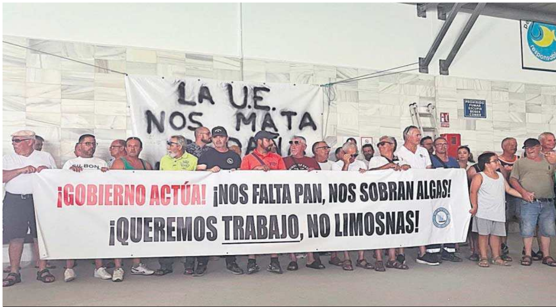
Protesta de trabajadores de la pesca en Barbate por el abandono de las administraciones.