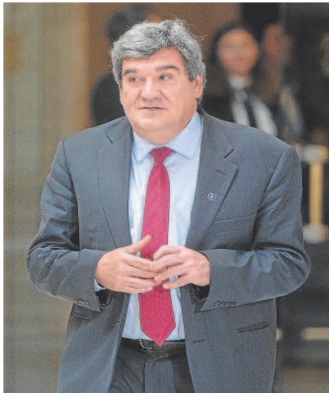
El ministro de Seguridad Social, José Luis Escrivá

Concretamente, el dictamen del Consejo de Estado al que ha tenido acceso ABC señala un puñado de defectos de forma en la redacción del texto que va