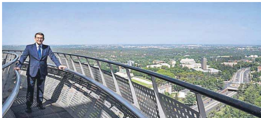
Alberto Núñez Feijóo, en el Faro de la Moncloa.