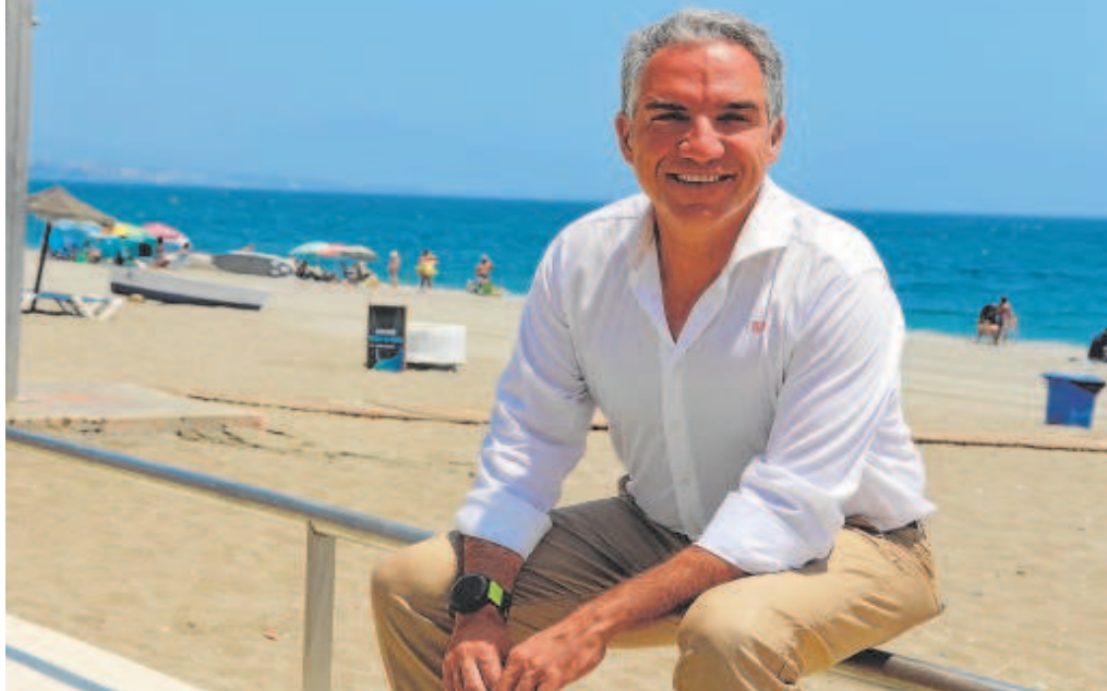
El coordinador general del Partido Popular, ayer en Manilva