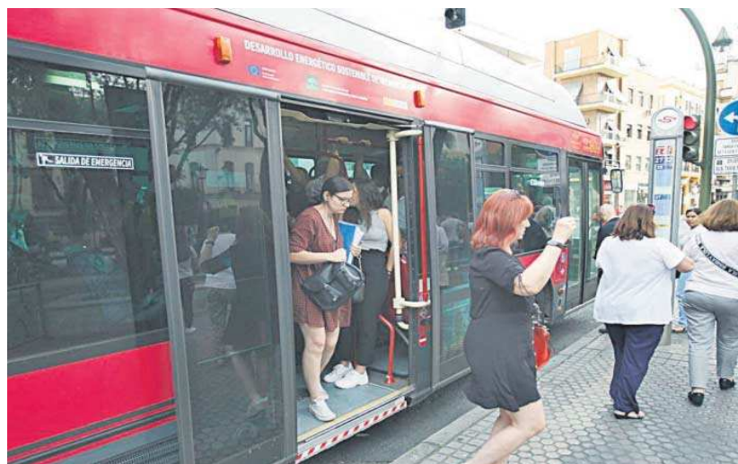
Viajeros bajando de un autobús de Tussam en una parada.