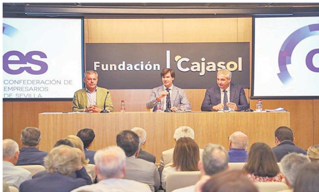
Reunión de la junta directiva de la CES.