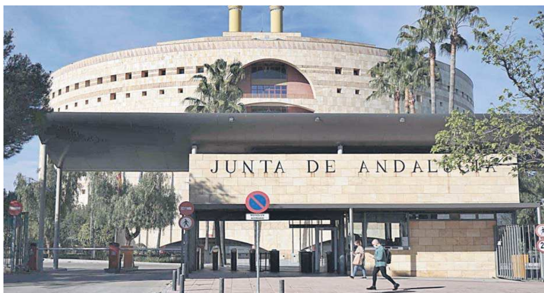
Edificio Torretriana, sede de la Junta de Andalucía en Sevilla donde trabajan unos 2.000 funcionarios.