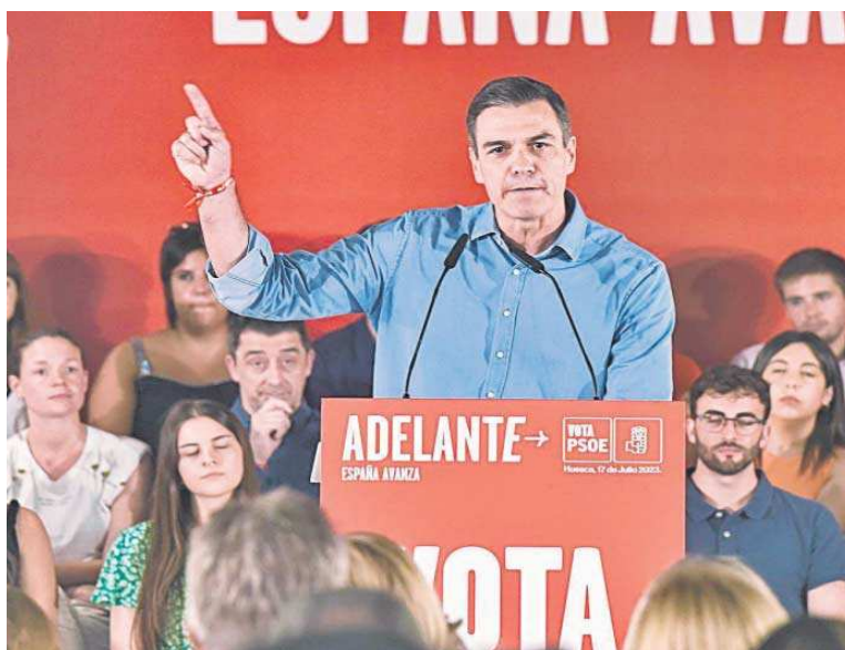
Pedro Sánchez participa, anoche, en un mitin en Huesca.

Sánchez hizo estas declaraciones antes de que el CIS publicara su última encuesta de esta campaña y en la que vuelve a otorgarle al PSOE una victoria, ahora con una ventaja de 1,4 puntos sobre el PP.