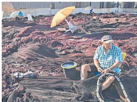
Pescadores trabajan con sus redes en Barbate.

Por otro lado, el Boletín Oficial del Estado (BOE) publicó ayer las ayudas a los pescadores y a los armadores por la paralización de la