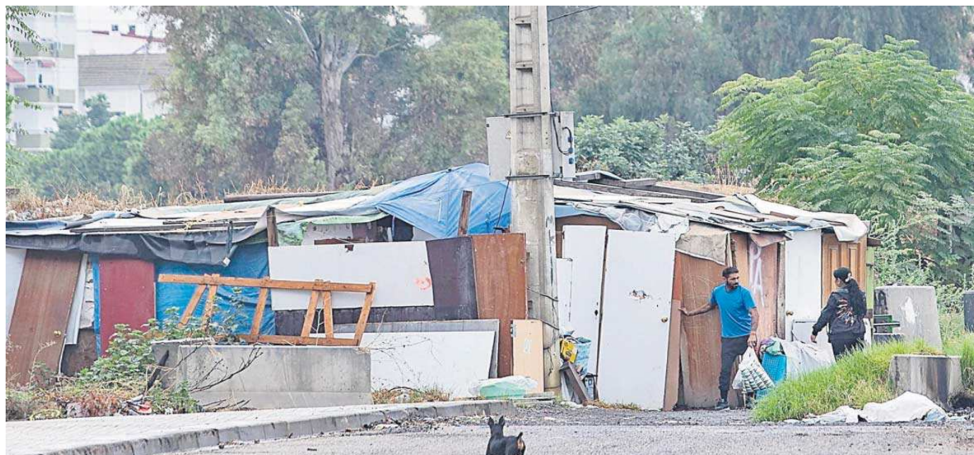
Dos personas en el asentamiento del Vacie, en una imagen de octubre del año pasado.