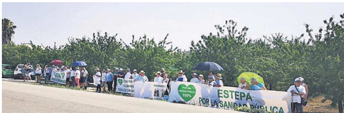
Vecinos reivindican asistencia sanitaria.