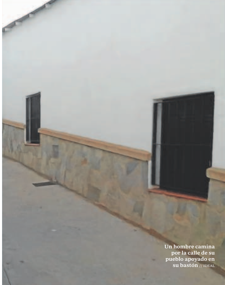
Un hombre camina por la calle de su pueblo apoyado en su bastón

diputaciones. Además, subrayó que un reparto más equilibrado de la población ayudará a la lucha contra el cambio climático y a mejorar la vida de los ciudadanos.