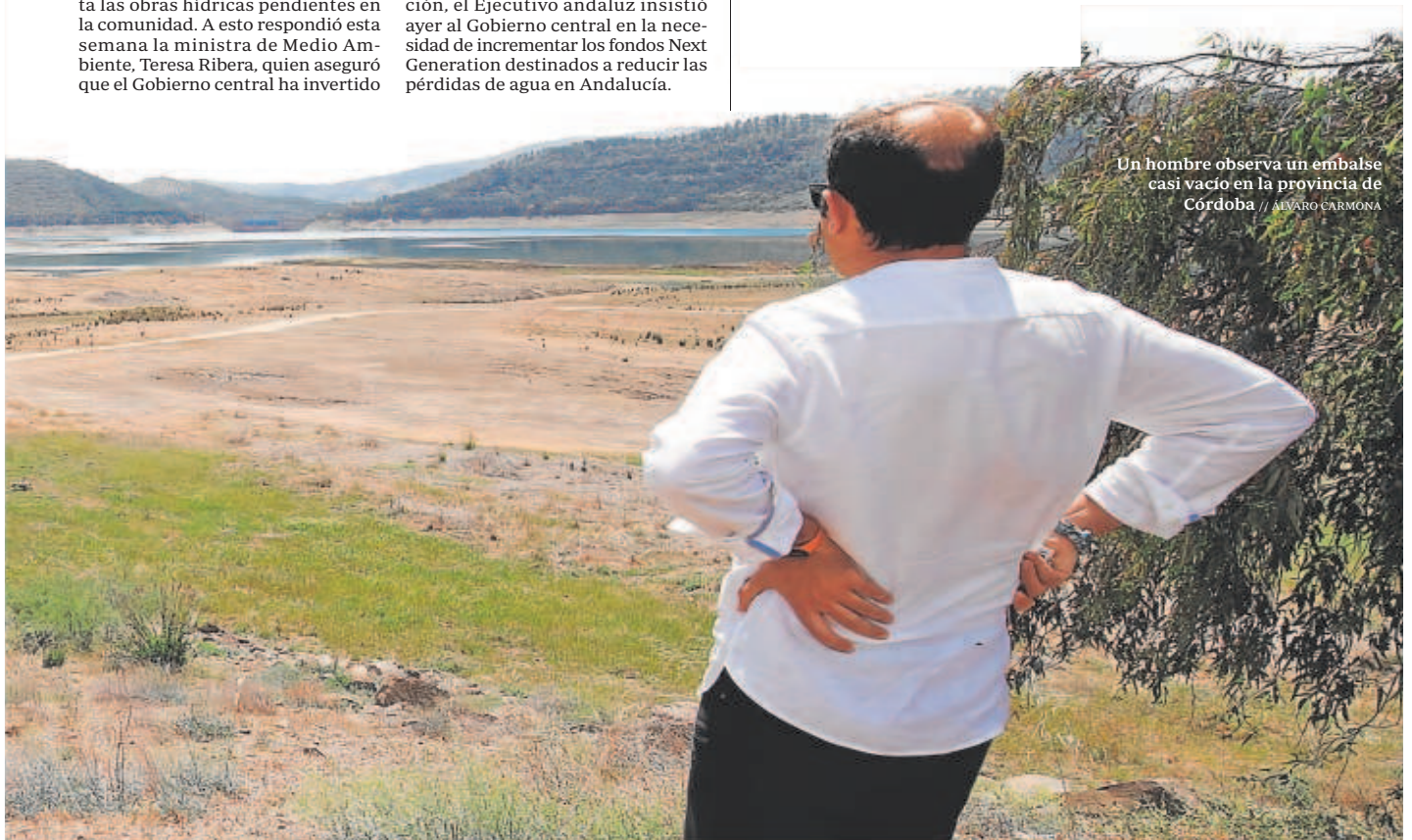
Un hombre observa un embalse casi vacío en la provincia de Córdoba