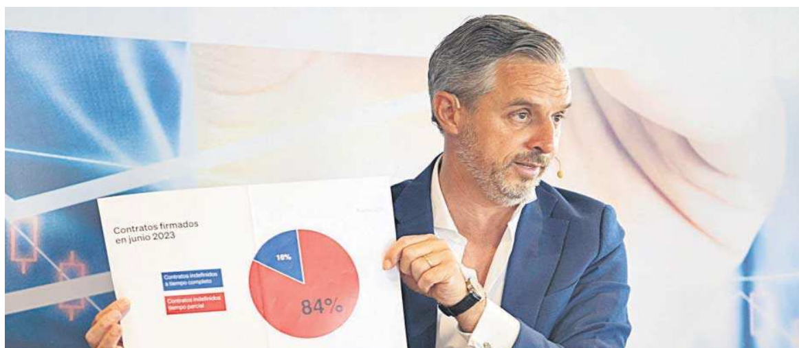
El vicesecretario de Economía del PP, Juan Bravo, durante su intervención ayer.

● El vicesecretario de Economía del PP, Juan Bravo, afirma que “el IMV no puede ser un inconveniente para trabajar, y ahora lo es”