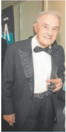
José María Carrascal