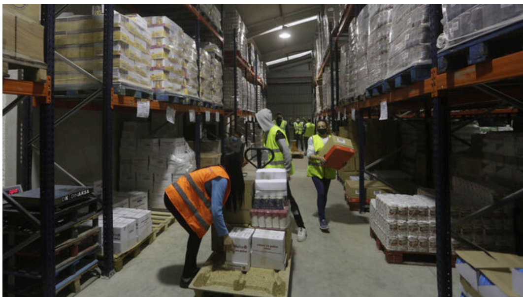
Varios voluntarios organizan los alimentos en el interior de los almacenes en el Polígono Store.