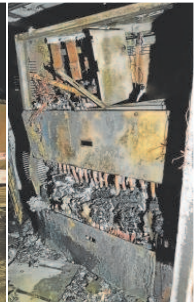
Así quedó el transformador de Torreblanca tras el incendio // ABC