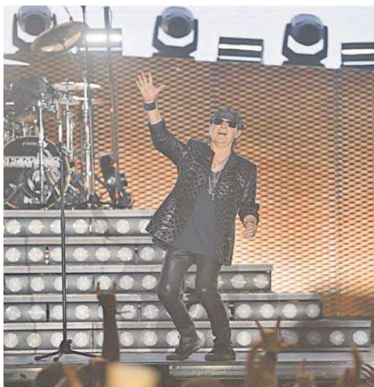
El grupo Scorpions actuó el pasado 11 de julio en Icónica Sevilla Fest.

Se consolida como el tercer evento en la capital tras la Semana Santa y la Feria