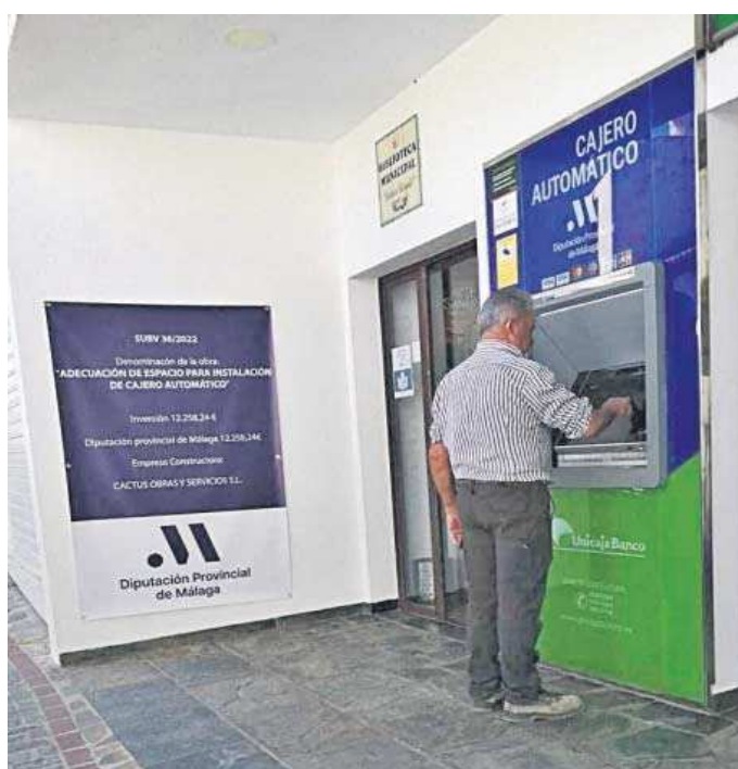
Un hombre utiliza un cajero en un pueblo de Málaga.

Este plan incentivará, junto a las diputaciones provinciales, no sólo la instalación de cajeros automáticos en los municipios y entidades locales autónomas de toda Andalucía que carezcan de oficinas bancarias físicas y cajeros