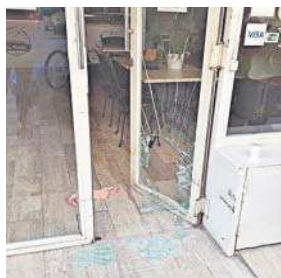
Fotograma de los dos ladrones robando en un bar de San Lorenzo.