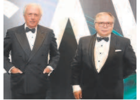
Javier Barcáiztegui y Luis Herrero