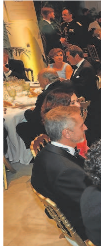
Sus Majestades los Reyes, durante la cena de los Cavia, acompañados por el resto de autoridades así como los ganadores de los premios Cavia, Luca de Tena y Mingote