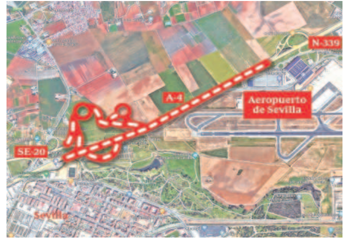
Zona en la que se va a actuar de la autovía del Sur o A-4, así como en la Ronda Supernorte o SE-20, cerca del aeropuerto de San Pablo

En abril de 2022, el Consistorio hispalense volvió a colocar a los terrenos de San Nicolás Oeste en el casillero de salida después de un lustro de bloqueo y donde llegó a haber un proyecto de rea-