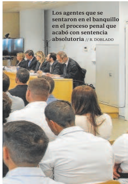
Los agentes que se sentaron en el banquillo en el proceso penal que acabó con sentencia absolutoria // R. DOBLADO

El desenlace del largo proceso del fraude de las oposiciones de la Policía Local de Sevilla con la expulsión de 33 agentes del Cuerpo va a terminar en una especie de repesca, de segunda oportunidad inmediata. Los implicados podrán presentarse de nuevo a las oposiciones y, de aprobar, volver y aquí no ha pasado casi nada. Hay resquemor en el propio grupo de agentes. No todos tenían el mismo grado de implicación en el fraude y puede que ahora no corran la misma suerte.