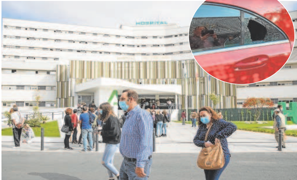
Los profesionales del centro hospitalario están optando por no acudir en sus vehículos a su jornada laboral, pese a que los transportes públicos siguen siendo «deficitarios», a la espera a la línea 3 del Metro