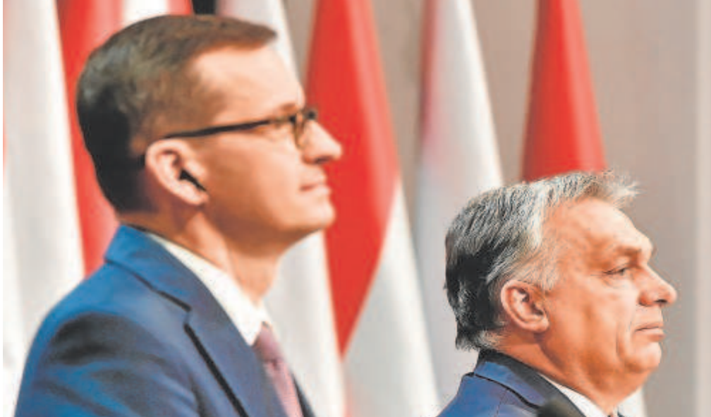
En una imagen de 2020, Morawiecki y Orbán, primeros ministros de Polonia y Hungría, que ayer pidieron votar a Vox