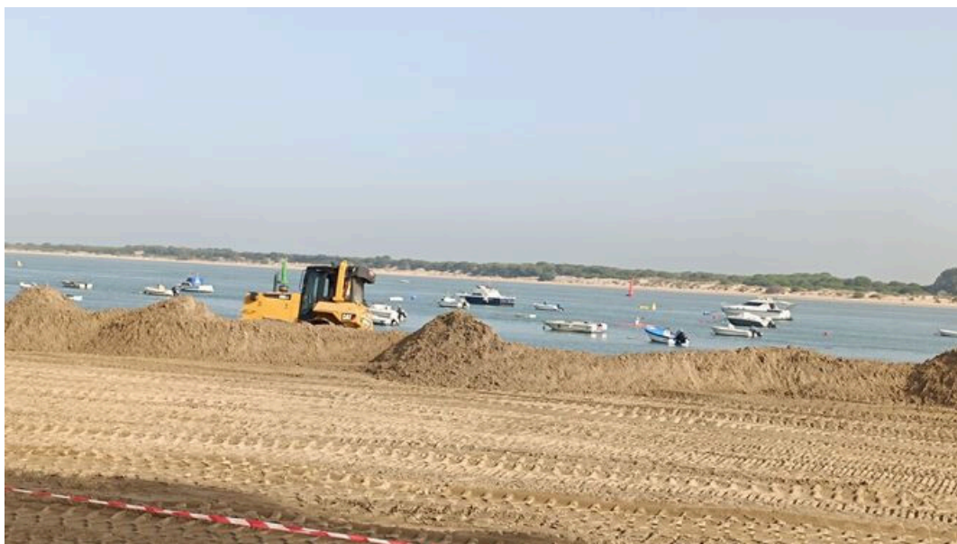
Labores de dragado en la desembocadura del Guadalquivir, en Doñana.

El Puerto de Sevilla está tramitando un convenio de investigación con una empresa ecológica de Málaga , Todobarro, especializada en la producción de cerámica y ladrillos, con el fin de estudiar la elaboración de ladrillos con parte de los sedimentos del dragado de mantenimiento que se realiza en el río Guadalquivir.