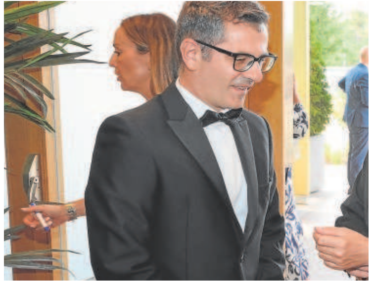
Félix Bolaños y José Luis Martínez-Almeida