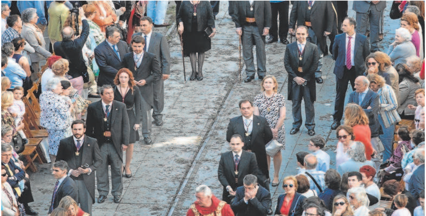
La corporación municipal en una representación reducida en el Corpus Christi de 2018 // VANESSA GÓMEZ