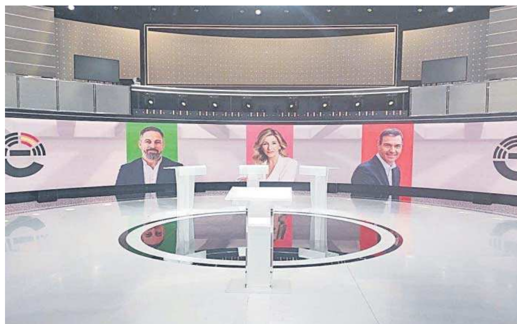
El estudio de TVE en Prado del Rey ya preparado para el debate de hoy.

"El bloque del no a Fernando López Miras en Murcia, que bloqueó la investidura de un partido con un 43% de voto, trabaja ahora en desgastar la imagen del candidato del Partido Popular como una única estrategia para