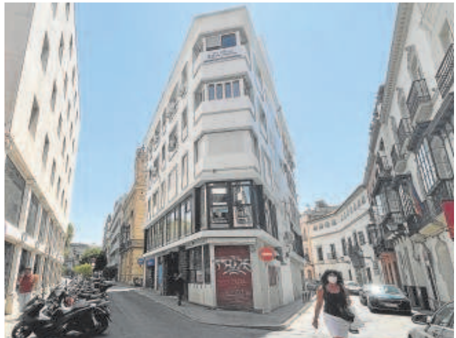
Una parte de la calle Zaragoza, la más cercana a la Plaza Nueva

Emasesa tenía previsto invertir 1,5 millones en renovar las redes de saneamiento, abastecimiento y riego.