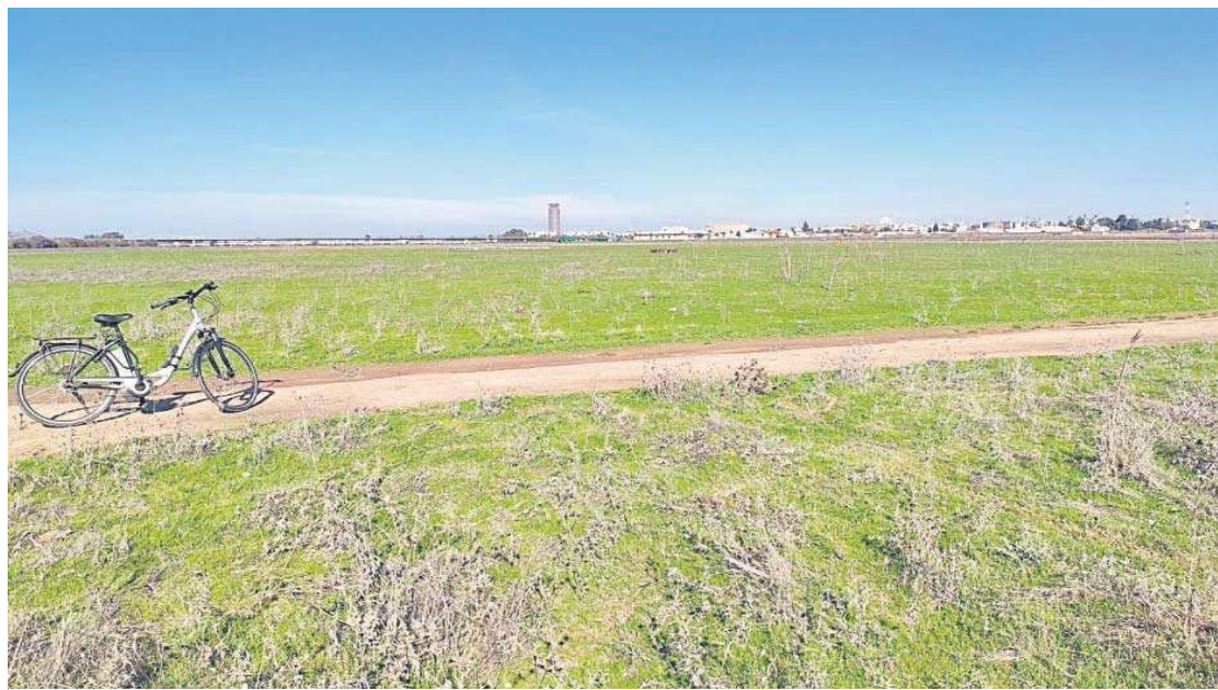
La extensa Dehesa de Tablada, que es motivo de confrontación entre el alcalde y el PSOE.

Distribuido para CONFEDERACIÓN N DE EMPRESARIOS DE SEVILLA * Este artículo no puede distribuirse sin el consentimiento expreso del dueño de los derechos de autor.