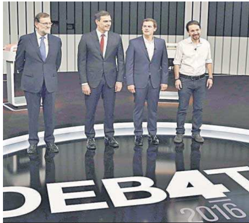
El debate a cuatro de 2016, el más seguido con Sánchez de participante.

dos en su momento por la Academia de TV, fueron también emitidos por las cadenas autonómicas o canales menores como Trece, de ahí esa cuota más baja del programa de anoche.