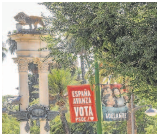
Carteles electorales del PSOE ayer en Sevilla, por donde no ha pasado Sánchez en campaña

se ausentó quien desde el 1 de julio es, además de jefe del Ejecutivo español, presidente de turno de la UE.