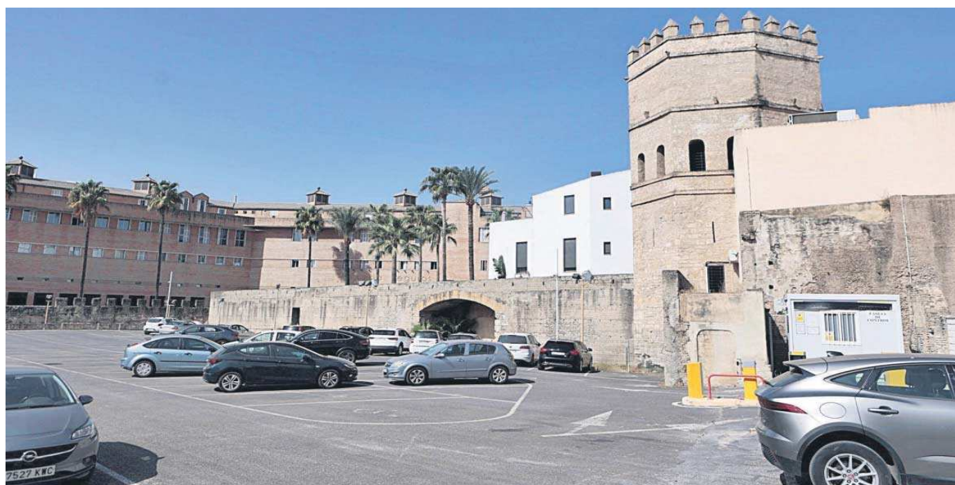
Coches aparcados en el día de ayer en este aparcamiento situado junto a la Torre de la Plata y la muralla islámica de Sevilla.

● La nueva Corporación mantendrá por el momento este equipamiento para los residentes mientras no se concrete un proyecto para recuperar uno de los espacios con más historia de la ciudad