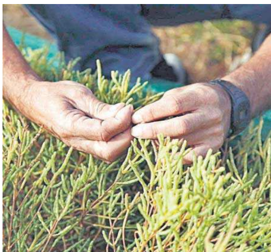
Un cultivo de espárragos de mar en Isla Cristina.

La salicornia es una planta marina con alto contenido en polifenoles. Por su parte, la homocisteína es un aminoácido de origen animal (leche, carne, huevos, etcétera) que puede aumentar el riesgo de enfermedades cardiovasculares y neurovasculares. "La suplementación con salicornia fue efectiva en la reducción de los niveles de homocisteína tras tres meses de