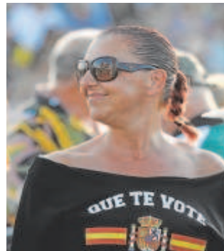
Una mujer en un mitin de Vox con una camiseta con el lema