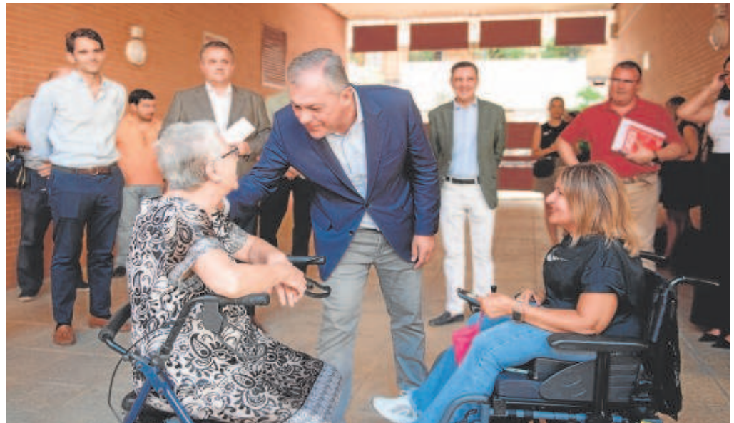
El alcalde de Sevilla, José Luis Sanz, junto con los vecinos del edificio de Cross Pirotecnia

El alcalde, José Luis Sanz, insistió ayer en la idea de «un pulmón verde en Tablada con equipamientos» tras la propuesta del PSOE de que estos suelos tengan la consideración definitiva de públicos y usos compatibles con su clasificación de suelo no urbanizable especialmente protegido. En declaraciones a los periodistas, apuntó que «solamente hice un comentario señalando que sería un grandísimo pulmón de Sevilla con equipamientos culturales, deportivos y evidentemente, residenciales». Por otro lado, ha destacado que «las ciudades que no crecen, se quedan estancadas en su desarrollo urbano».