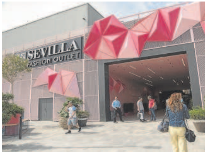
El centro comercial está ubicado junto al aeropuerto de Sevilla

Entre los objetivos que se marcan para esta nueva etapa está el de elevar la experiencia de compras para estar en sintonía con la estrategia sostenible de hospitalidad de VIA Outlets, que interpela al cliente Premium. La compañía, que es líder europeo en destinos de moda, quiere contribuir al posicionamiento de la provincia en este segmento. En la actualidad, el cliente turístico representa un 10% de la cuota