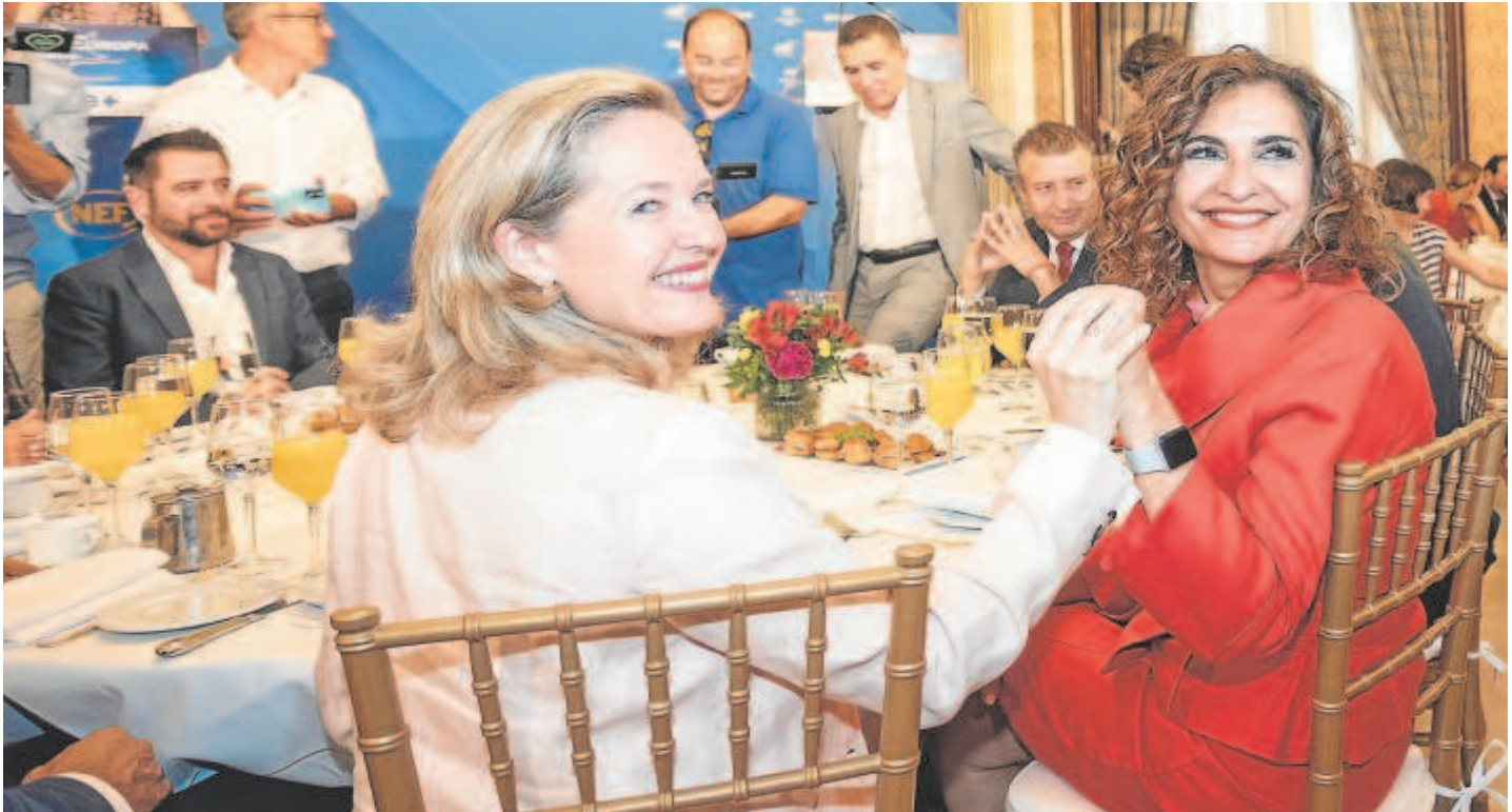
Las ministras Nadia Calviño y María Jesús Montero en un acto en el que participaron ayer en Sevilla