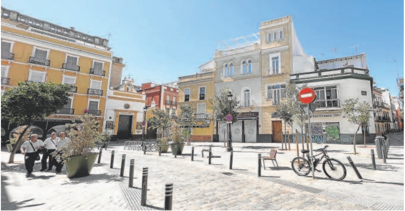
Estado actual de la plaza de Montesión tras la reurbanización realizada en los meses de verano de 2022