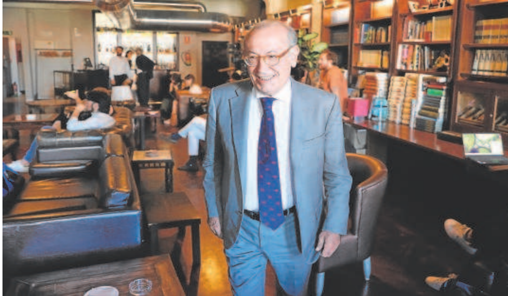
Nicolás Redondo, antes de comenzar su rueda de prensa en Madrid