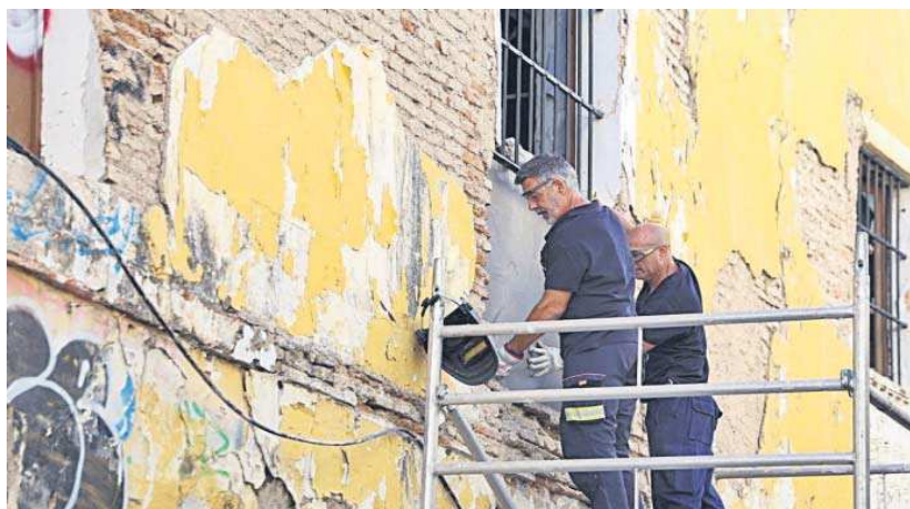
Los trabajadores durante la intervención en el edificio de la calle Vascongadas.

La actuación conjunta de los servicios municipales ha permitido asegurar el edificio y se han llevado a cabo labores de adecuamiento y limpieza integral. Fruto de esta intervención, la Policía Local ha desalojado a