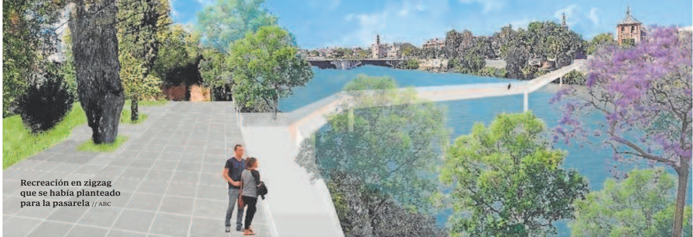
Recreación en zigzag que se había planteado para la pasarela