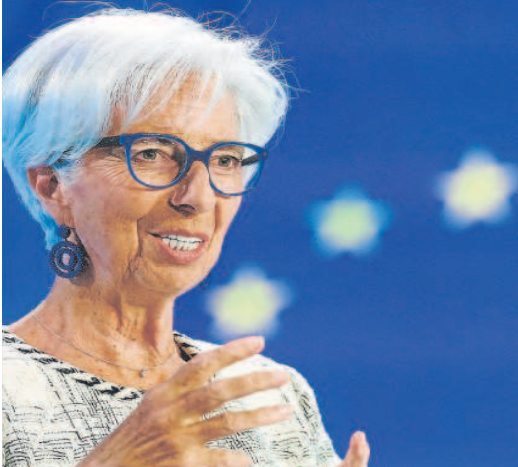
Christine Lagarde, presidenta del Banco Central Europeo

a la dificultad de predecir cuándo la inflación volverá al objetivo del 2% desde el 5,5% actual.