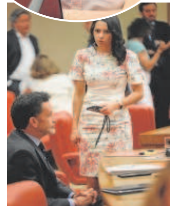
Arriba, Echenique (Podemos); abajo, Arrimadas saluda a Bal (CS)

Eso sí, la expresidenta de Ciudadanos y su última portavoz en el Congreso no dejó pasar la oportunidad de lanzar un mensaje a los españoles, durante su intervención en el debate sobre la convalidación del real decreto ley de medidas económicas para paliar los efectos de la inflación. En alusión al papel clave de Junts, el partido de Carles Puigdemont, tras el paso por las urnas, mostró su preocupación por la posible conformación de «un Gobierno Frankenstein con peluca».