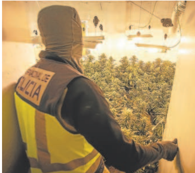
Plantaciones ilegales generan la sobrecarga y rotura de la red

Endesa explica que esta importante sobrecarga de la red eléctrica satura sus transformadores, que habitualmente salen ardiendo porque «los sistemas de iluminación y ventilación utilizados para acelerar el crecimiento de las plantas necesitan electricidad las 24 horas del día y la obtienen mediante engan-