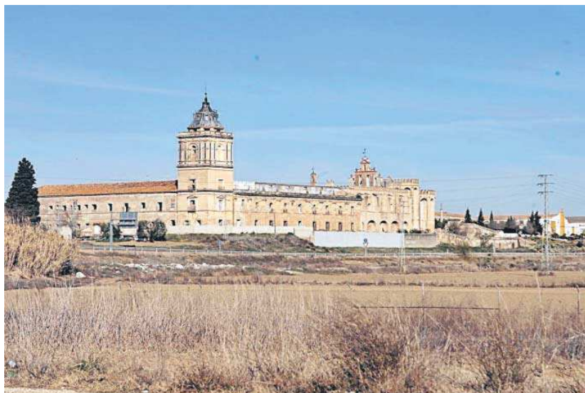
Vista del monasterio de San Isidoro del Campo, en Santiponce.

● La comisión autoriza la intervención en el pósito y la almazara enmarcadas en el proyecto integral de recuperación del monasterio por parte de la Junta de Andalucía