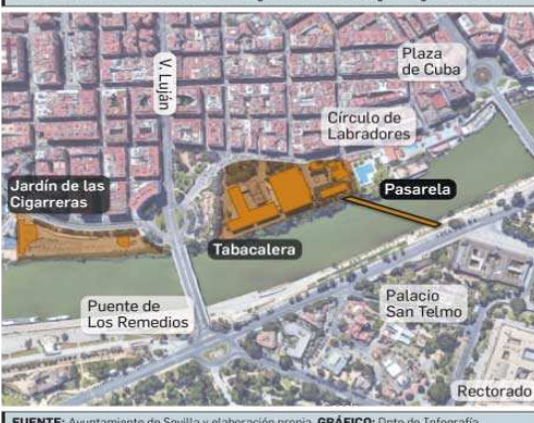
FUENTE: Ayuntamiento de Sevilla y elaboración propia. GRÁFICO: Dpto de Infografía.

encuentros o cabeceras, para estudiarlas en relación con su entorno más inmediato.