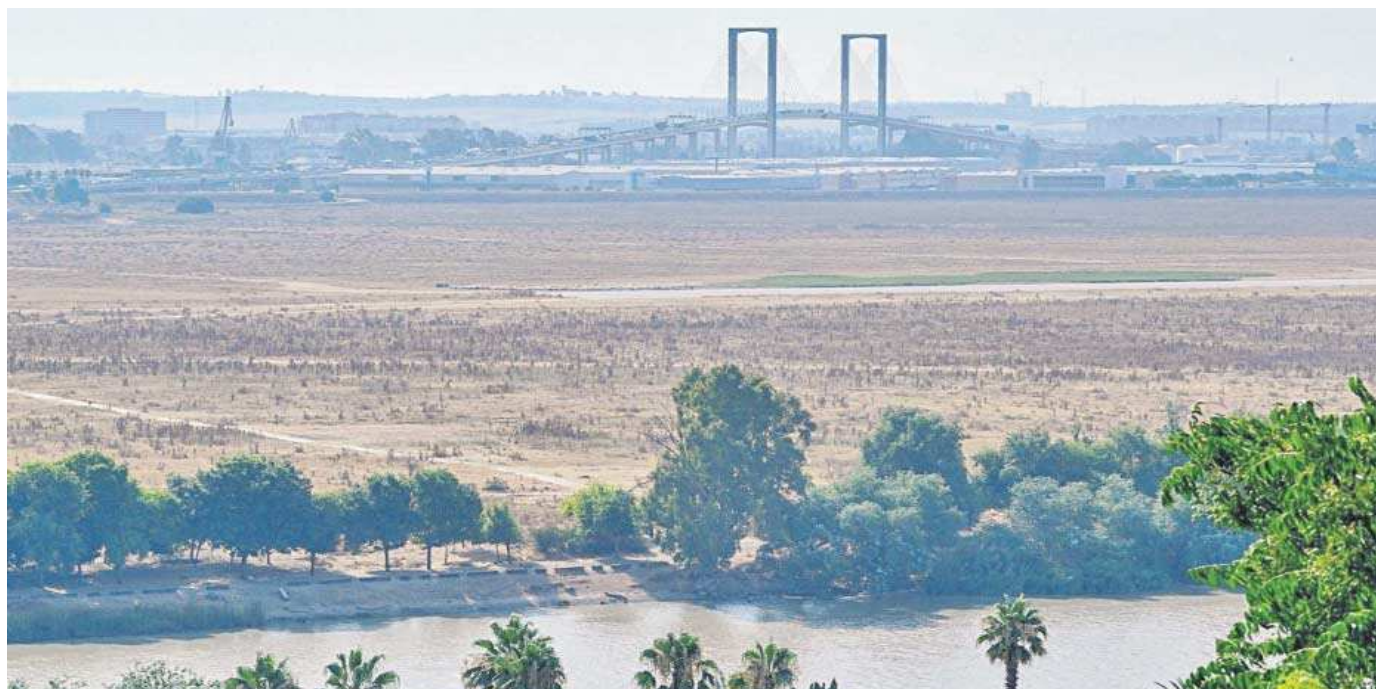
Vista de la dehesa de Tablada y del río Guadalquivir.