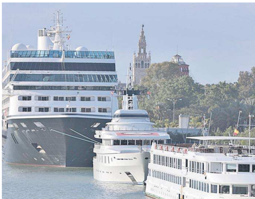
Cruceros atracados en el Puerto de Sevilla la primavera pasada.

En concreto, en los primeros seis meses del año llegaron a la capital andaluza en cruceros 11.551 pasajeros. En el mismo periodo de 2022 lo hicieron 9.756, es decir, 1.795 personas más, lo que en términos porcentuales supone un incremento del 18,4%. La subida en sí es positiva e importante. Ahora bien, si se compara con el total nacional, que fue del 87,1% o con otros puertos del país, resulta aún demasiado baja.