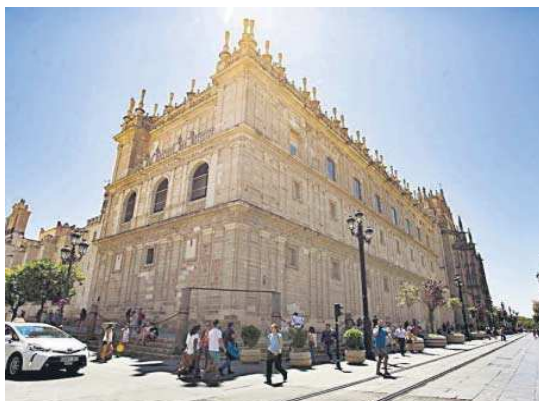
La parroquia del Sagrario de la Catedral.

Catedral de Sevilla consta de tres puertas de acceso público, pero es la fachada exterior oeste, la que se sitúa en la Avenida de la Constitución, la única de las tres que se establece como acceso independiente posible para la actividad parroquial, y de la que dependen los fieles asistentes al culto. Este espacio previo cuenta con tres escalones para salvar la diferencia de cota entre la co-