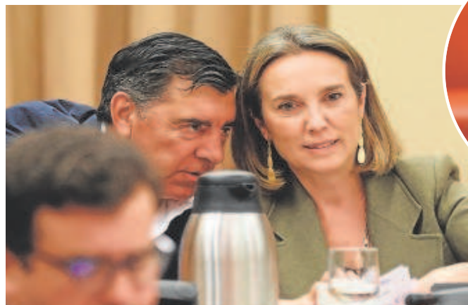
Bermúdez de Castro comenta un detalle de la sesión con Gamarra

El hielo entre Arrimadas y Bal, solidificado tras su enfrentamiento en las primarias de Ciudadanos, el pasado enero, no parece haberse derretido con las altas temperaturas del verano. Ambos recibieron más cariño de compañeros de otros partidos, hasta ahora rivales, que se despidieron de ellos amablemente y deseándoles suerte en lo personal. Arrimadas conversó largamente con los portavoces en el Congreso de PP y Vox, Cuca Gamarra e Iván Espinosa de los Monteros, mientras Bal se marchaba entre risas y elogios de socialistas como María-Je-