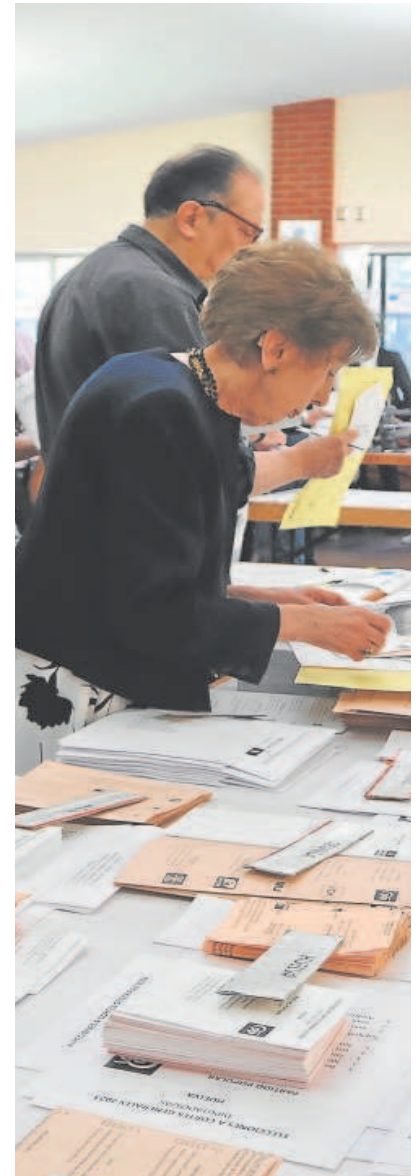
Ciudadanos escogiendo papeletas durante las pasadas elecciones generales