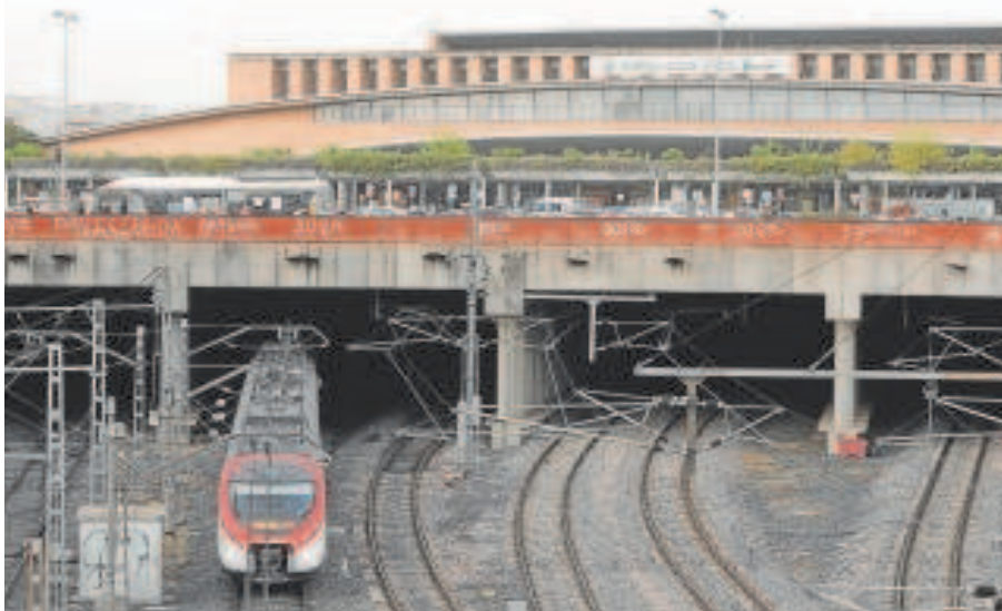
El proyecto soterra vías y reurbaniza el entorno de la estación