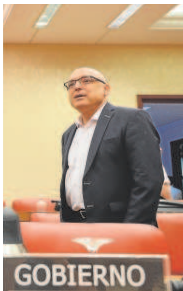
El ministro Bolaños saluda a un diputado; Simancas observa

mentarismo, aunque es uno de esos días raros, tristes para unos, alegres para otros, en los que unos diputados regresan al trabajo y otros respiran con nostalgia un último soplo de servicio a quienes los votaron hace ya cuatro años.