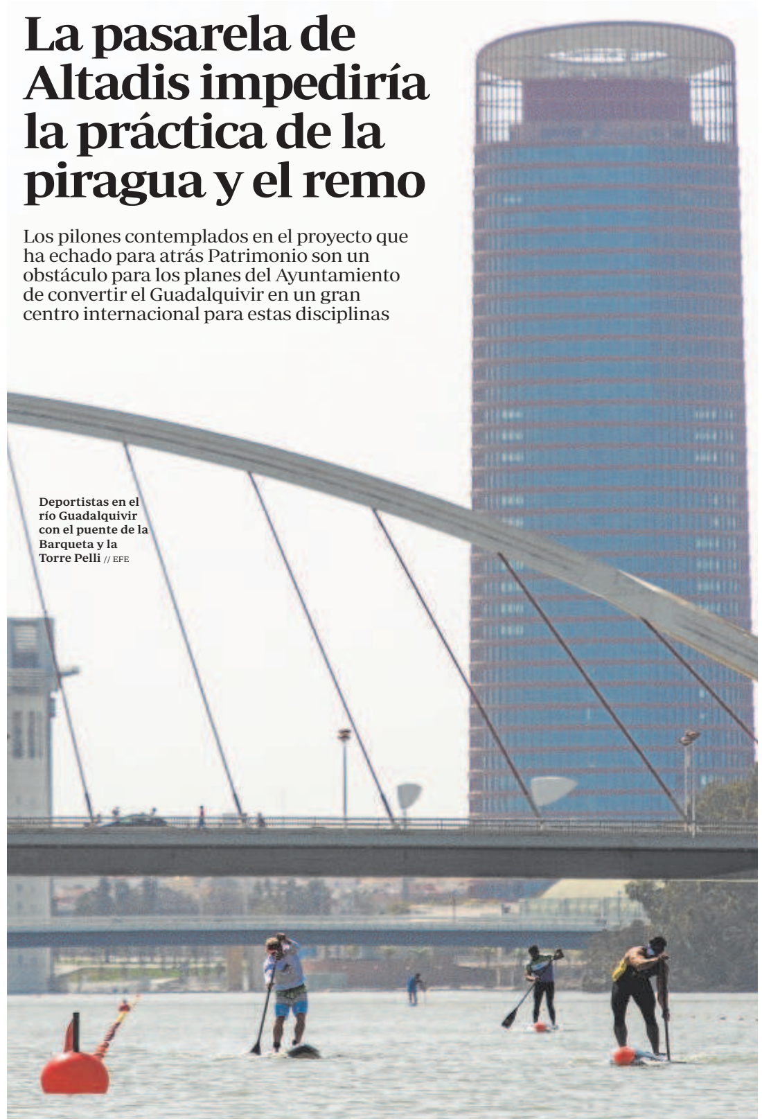
Deportistas en el río Guadalquivir con el puente de la Barqueta y la Torre Pelli

Los pilones contemplados en el proyecto que ha echado para atrás Patrimonio son un obstáculo para los planes del Ayuntamiento de convertir el Guadalquivir en un gran centro internacional para estas disciplinas