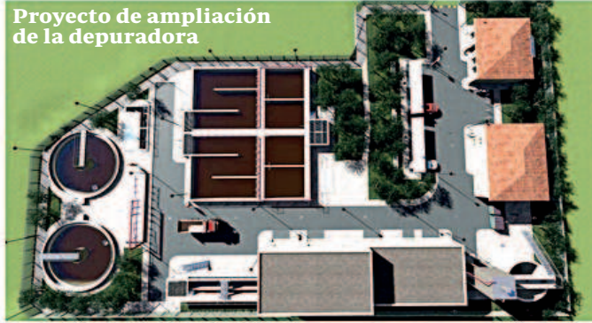
Proyecto de ampliación de la depuradora

El proyecto para frenar los vertidos irregulares ha tardado cinco años en ver la luz. Su redacción se encargó en septiembre de 2018 a la empresa Ayesa Ingeniería y Arquitectura SAU y el documento definitivo estaba en poder del ministerio que dirige Teresa Ribera desde mayo de 2021, según el relato de antecedentes que recoge el pliego de prescripciones técnicas para contratar la infraestructura, consultado