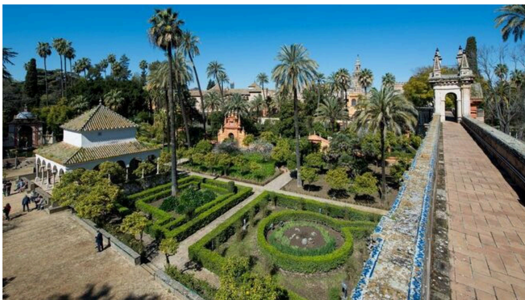
Los jardines del Real Alcázar de Sevilla.

La Comisión Provincial de Patrimonio de la Junta de Andalucía ha informado "desfavorablemente" el proyecto técnico para el evento Naturaleza encendida. Corrientes en el Real Alcázar de Sevilla , previsto desde el 27 de octubre de este año al 24 de febrero de 2024, por "producir una afección al Bien de Interés Cultural -BIC-". "A pesar del interés de la iniciativa y del justificado carácter reversible de la misma", la Comisión argumenta que la intervención propuesta y los elementos figurativos planteados "no se identifican con los valores patrimoniales del Alcázar, interfiriendo en su contemplación y apreciación", tal como recoge este organismo autonómico en las actas publicadas y consultadas por Europa Press.