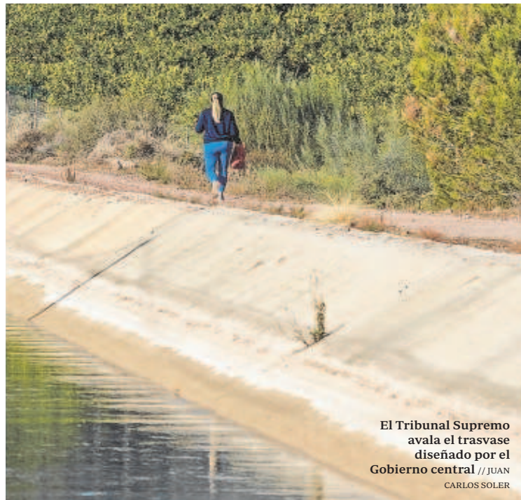
El Tribunal Supremo avala el trasvase diseñado por el Gobierno central