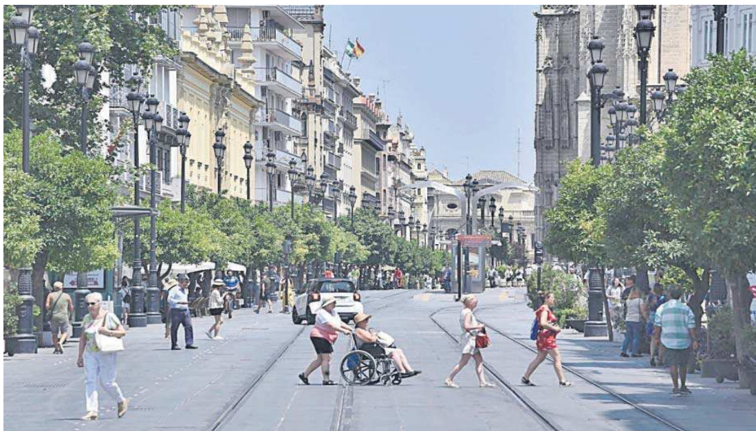
La poco sombreada Avenida de la Constitución de Sevilla.