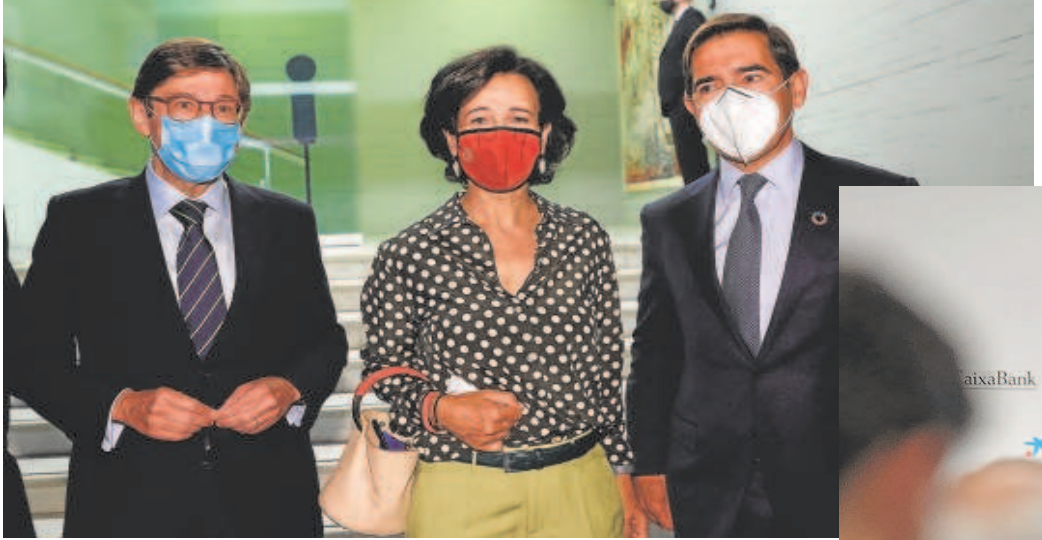
Tres presidentes de la gran banca española: Górriz (Caixabank), Botín (Santander) y Torralba (BBVA)