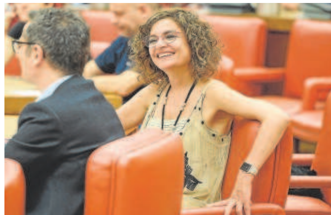
Los ministros Félix Bolaños y María Jesús Montero

¿Significaría esto que esas medidas no se podrían pagar? No, pero sí puede significar que los nuevos gastos en los que se ha embarcado el Gobierno no puedan ser cubiertos con los ingresos extra disponibles y que por tanto el déficit de las cuentas públicas se ensanche más de lo previsto, como por otra parte ya advirtió la Airef cuando elevó del 3,3% al 4,2% su previsión de déficit de 2023 precisamente por estas medidas.