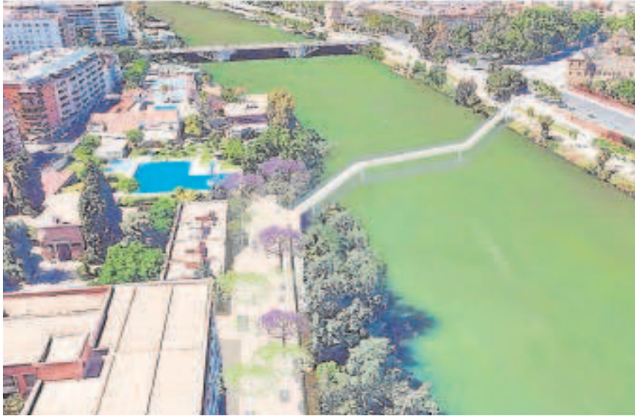
Recreación de la pasarela de Altadis sobre el río

El Plan General de Ordenación Urbana contempla hasta seis puentes y ninguna corporación municipal ha construido alguno en más de tres décadas