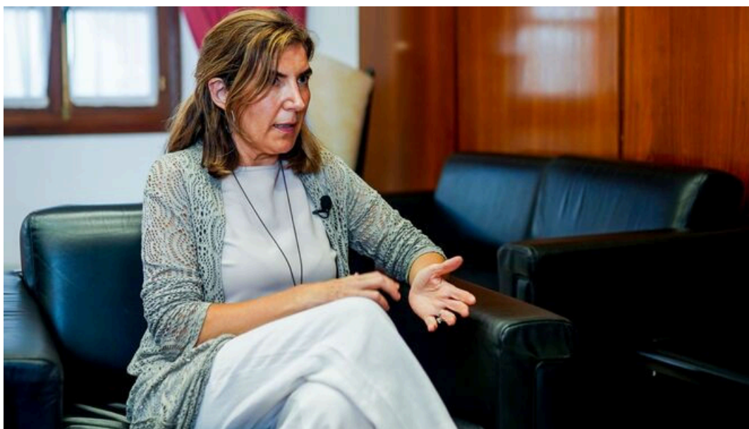
La consejera de Empleo de la Junta de Andalucía, Rocío Blanco. / Eduardo Briones / Europa Press (Sevilla)

El Boletín Oficial de la Junta de Andalucía (BOJA) ha publicado la Orden de la Consejería de Empleo, Empresa y Trabajo Autónomo para las subvenciones de la denominada cuota cero y las ayudas al inicio de actividad de los trabajadores por cuenta propia en Andalucía, un incentivo que puede alcanzar los 5.500 euros y que prioriza a las mujeres, a los jóvenes y a los emprendedores que inicien su actividad en pequeños municipios.