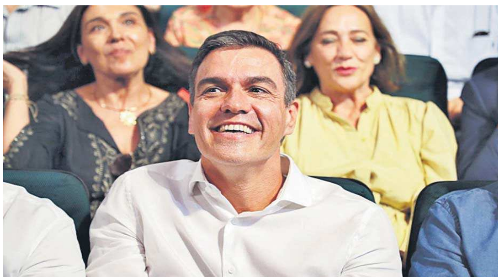
Pedro Sánchez durante un evento de su partido.

E hizo alusión a este principio de la mayoría en su vídeo dirigido a la militancia socialista, donde subrayó que las urnas han evidenciado que quienes plantean "derogación y retroceso no son mayoría", en referencia a PP y Vox.