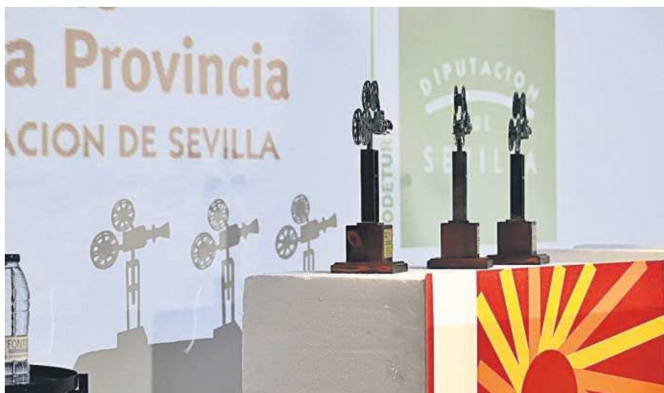
Uno de los premios del certamen de cortos en una edición pasada. M. G.

● El certamen de cortos convocado por la Diputación y que va por la séptima edición, admite obras hasta el 7 de noviembre