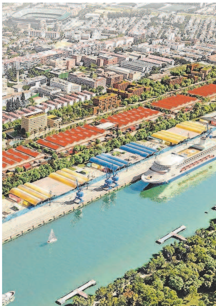
las Delicias y el Centenario será un nuevo barrio de Sevilla // ABC

Eusa imparte grados como Periodismo, Publicidad y Relaciones Públicas, Comunicación Audiovisual y Turismo. Junto a su actual campus en la calle Plácido Fernández Viagas, también realiza actividad