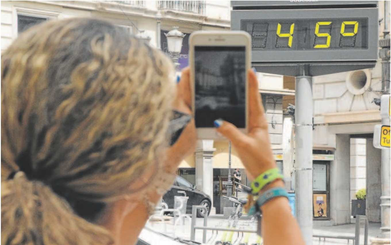
Los termómetros de Andalucía registraron este miércoles las máximas más elevadas de este verano