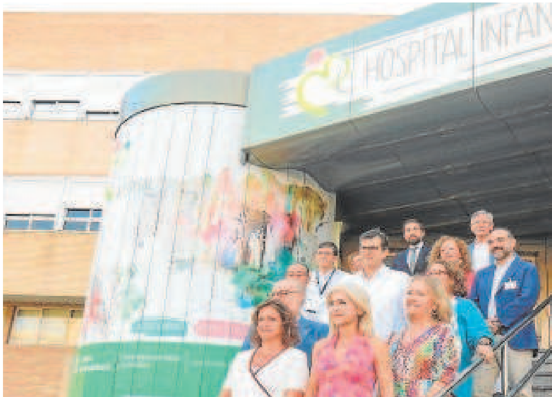
HOSPITAL UNIVERSITARIO VIRGEN DEL ROCÍO