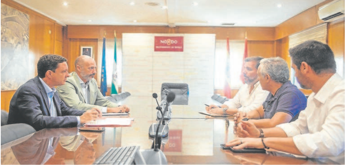
Un momento de la reunión del delegado y el gerente de Urbanismo con directivos de la Asociación de Hosteleros