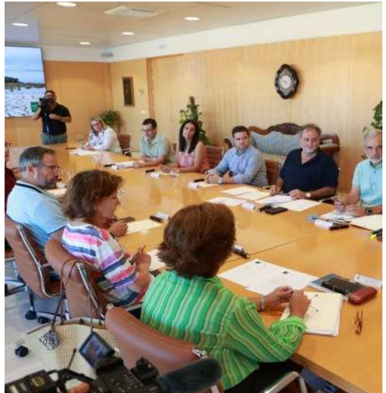
El presidente de la Diputación, Javier Fernández, presidió ayer la Mesa de la Sequía de

En Montellano se contemplan diferentes actuaciones complementarias para el suministro de este municipio: