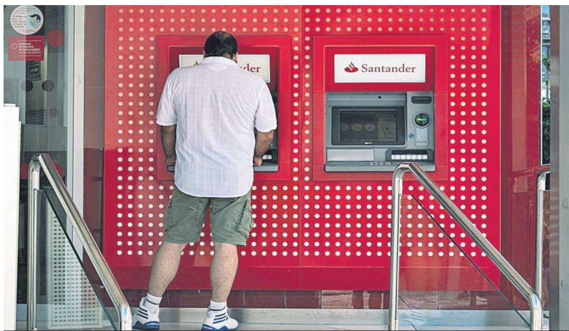
Un hombre saca dinero de un cajero automático de un banco. RAFA DEL BARRIO

● En el caso de los hogares el volumen total en lo que va de ejercicio se ha reducido un 2% y en el de las compañías un 6%