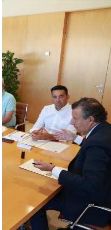
la Provincia // ABC

supone realizar una mejora del abastecimiento a los municipios de la Sierra Sur de Sevilla a través del bombeo existente en Osuna, que eleva el agua hasta el depósito de cabecera en El Saucejo desde el que cual se distribuye el agua al resto de municipios: Algámitas, Los Corrales, Martín de la Jara, Pruna y Villanueva de San Juan y El Saucejo. El Consorcio de Aguas 'Plan Écija' está desarrollando el modificado del proyecto sobre el que se estima una inversión de 2,3 millones de euros.