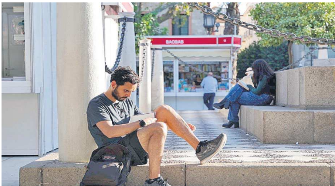
Un joven lee un libro en la Plaza Nueva, enclave principal de la Feria del Libro de Sevilla.