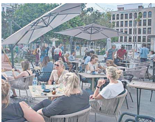
Clientes en un velador de la plaza de la Magdalena.

El delegado de Urbanismo reiteró el compromiso del equipo de gobierno en agilizar la elaboración de la ordenanza que se elaborará de manera consensuada con el sector. Adelantó que se analizará previamente todos los casos de ampliación de veladores llevados a cabo en es-