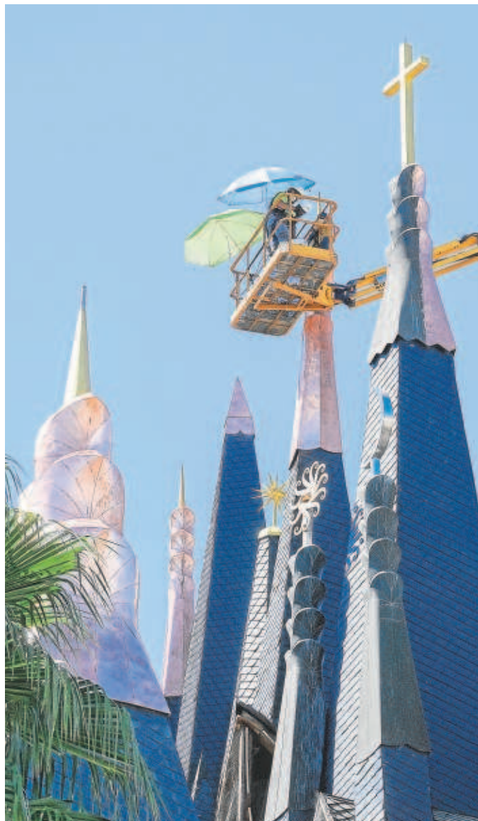
Imagen del pabellón de Hungría en el día de ayer

Fue la Consejería de Cultura de la Junta de Andalucía, tras la polémica surgida por la demolición de varios pabellones de la Expo 92, la que decidió proteger el inmueble incluyéndolo en 2009 en el Catálogo General de Patrimonio Histórico Andaluz, siempre con el fin de evitar cualquier modificación sin el visto bueno de la Comisión Provincial de Patrimonio Histórico, incluyendo la prohibición de desmontarse y trasladarse a otro lugar al estar catalogado.