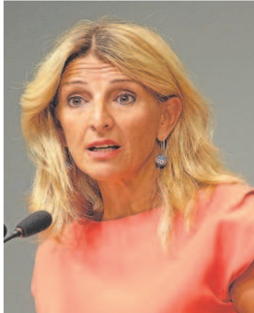
Yolanda Díaz y Miquel Iceta