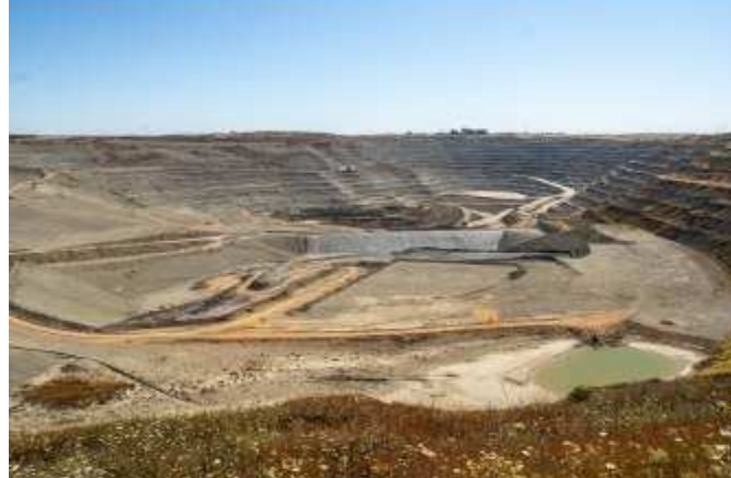
Andalucía tiene 465 explotaciones mineras activas // VANESSA GÓMEZ