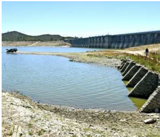
Imagen reciente del pantano de Aracena, que abastece a Emasesa

Del total de pantanos que abastecen a Emasesa, los de menor tamaño La Minilla, el Gergal y Cala (entre 35 y 58 hectómetros cúbicos), tienen almacenada entre un 38 y un 59 por ciento de su capacidad de embalse. De los grandes pantanos, el de Zufre, el segundo en capacidad, es el que menos agua almacena en este momento, con menos de 18 hectómetros cúbicos, a un 10,2 por ciento de su capacidad. Aracena, está al 20 por ciento con 25,80 hectómetros cúbicos de reserva, y Melonares, el último en construirse y el