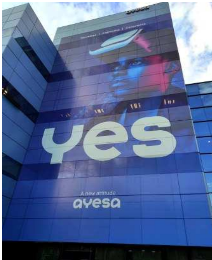
En la isla de la Cartuja está la sede del grupo Ayesa

En el caso de Ayesa, anteriores gobiernos socialista ya intentaron vender a la matriz de Ayesa ese paquete de Ayesa AT, sin que se llegara a un acuerdo para cerrar la operación. ¿Por qué tiene la Junta una participación en Ayesa AT? Los hechos se remontan a 1984, cuando el Gobierno autonómico creó la Sociedad Andaluza para el Desarrollo