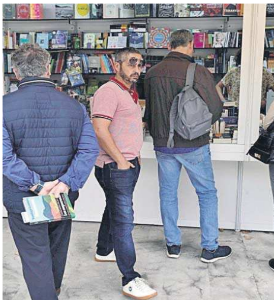
Una de las casetas de la Feria del Libro de Sevilla.

Por tanto, el Consistorio hispalense ha confirmado a este periódico que el ICAS ha aprobado que la presente edición de la Feria del Libro se celebre en los