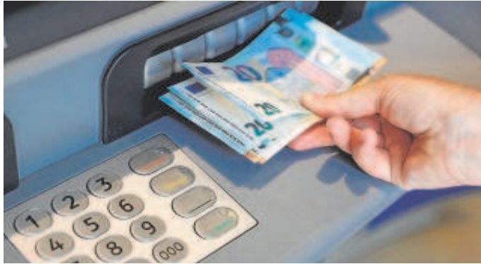
Usuario sacando dinero de un cajero automático