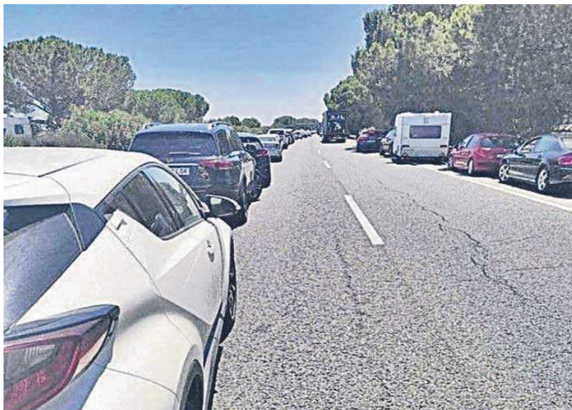
Uno de los atascos de la AP-4 en sentido a Cádiz.

vez mayor que las utiliza de forma frecuente y reiterada”. El Gobierno anunció en marzo de este año que el tramo de la autopista entre Sevilla y Las Cabezas tendrá un tercer carril a lo largo de 41 kilómetros, pero indicó que las obras durarían entre cinco y siete años. Por eso la Cámara considera que pasa el tiempo y las inversiones “se adormecen y parece que no avanzan”. La ministra de Transportes, Raquel Sánchez, aseguró en Sevilla durante la presentación de las actuaciones que la liberalización de la autopista en enero de 2020 incrementó el tráfico un 50% y el paso de vehículos pesados se ha multiplicado por tres, situación que provoca retenciones especialmente durante el verano. Pero la Cámara de Sevilla volvió ayer a reclamar el avance de las obras y la ejecución de la inversión para acortar los plazos, reclamando así la adopción de medidas urgentes de mejoras en esta infraes-