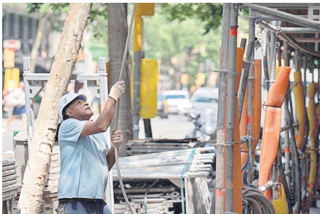
Un trabajador de la construcción en una obra.

En concreto, este acuerdo recomienda subidas salariales del 4% en 2023 y del 3% tanto para 2024 como para 2025, con una cláusula de revisión salarial que, en caso de desviación de la inflación, podría implicar alzas adicionales de hasta el 1% para cada uno de los años del acuerdo