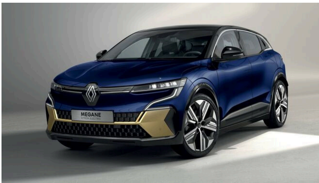
Las ventas de Renault Group en el mundo, más de 1,1 millones en el primer semestre

Las ventas mundiales de Renault Group suponen 1.133.667 vehículos en el primer semestre de este año. Esta cifra supone un crecimiento interanual de un 13,2 por ciento respecto a 2022. Por otro lado, en Europa, las ventas del grupo aumentan un 24 por ciento en un mercado que crece un 17 por ciento.