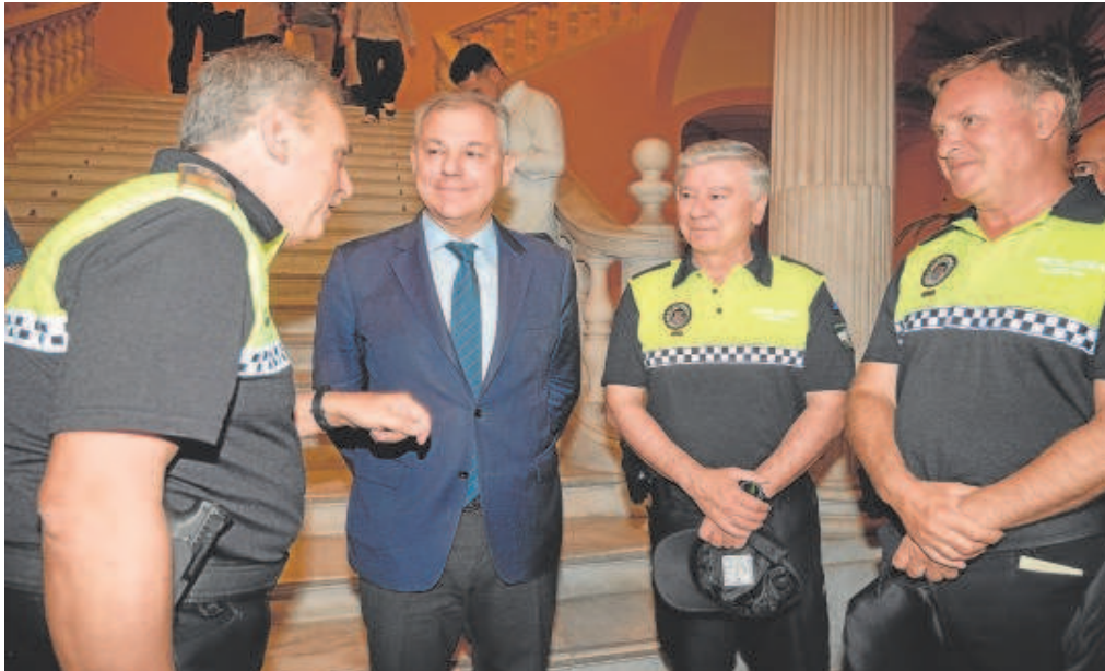
El nuevo jefe de la Policía Local, a la derecha de la imagen en la última toma de posesión de policías