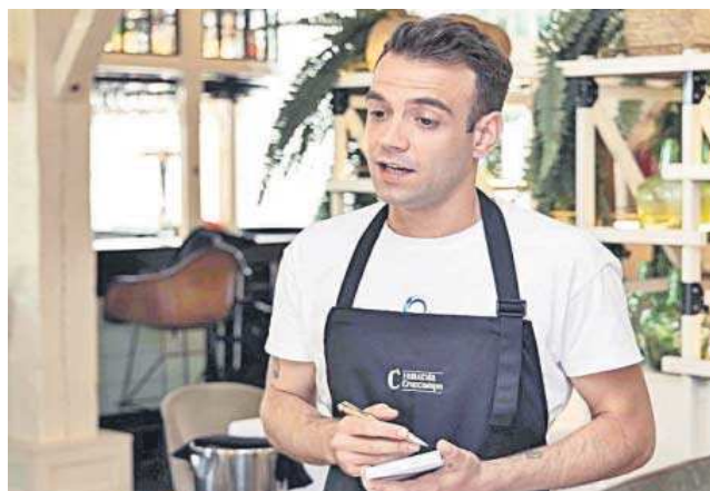
Uno de los jóvenes de prácticas en un restaurante.

El programa formativo, que cuenta con un 90% de inserción laboral para sus participantes, tiene abierto el plazo de inscripción para su cuarta edición, que dará comienzo en septiembre y en la que Fundación Cruzcampo asume el 90% del coste de cada joven admitido y otor-