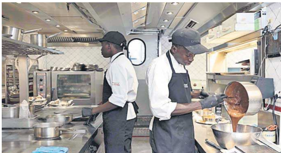
Dos de los cocineros preparados en la Fundación Cruzcampo en un restaurante de Dani García.