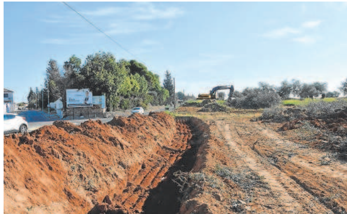
Imagen de algunas de las obras hechas hasta ahora

Mientras se procede a la resolución de contrato y se licita el nuevo proyecto actualizado, la Dirección General de Infraestructuras Viarias ha resuelto reabrir hoy al tráfico de manera provisional esta carretera a fin de minimizar los perjuicios ocasionados con su cierre a los más de 70.000 habitantes que suman las poblaciones de Tomares, Castilleja de la Cuesta y Bormujos, para los que este tramo de la A-8063 constituye la principal vía de comunicación interna entre los tres municipios de la corona sevillana del