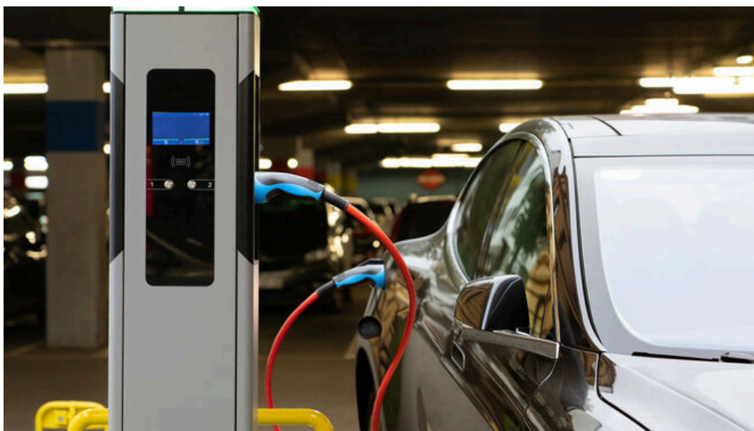
Las matriculaciones de eléctricos superan a las de los Diesel en Europa

El sorpaso de los eléctricos a los Diesel ya se es una realidad. En Europa y, por primera vez, ya se vendieron en junio más eléctricos que Diesel, según los datos que proporciona la asociación que reúne a los fabricantes europeos. Así, las matriculaciones de los eléctricos aumentaron un 66,2 por ciento respecto a junio de 2022, lo que supone 158.252 coches. Esto representa una cuota del 15,1 por ciento de las nuevas ventas frente al 10,7 de junio del año pasado.