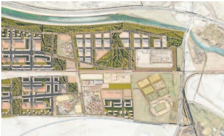
Una recreación del nuevo barrio, junto a mapas de su localización

Las bolsas de suelo que preveía el PGOU de 2006 ya están en carga. Sevilla afrontará de aquí a 2030 la construcción de todas las pastillas urbanizables, más de una decena de promociones que suman 20.000 viviendas. Todas están desbloqueadas, salvo la parcela de Santa Bárbara, situada en el este, junto a Guadalpark, donde estaba previsto que se levantarán 13.000 pisos y cuyo proyecto fracasó al quebrar la empresa. Villanueva del Pítamo es la última que queda y que puede verse retrasada si la justicia obliga a realizar los trámites pendientes.