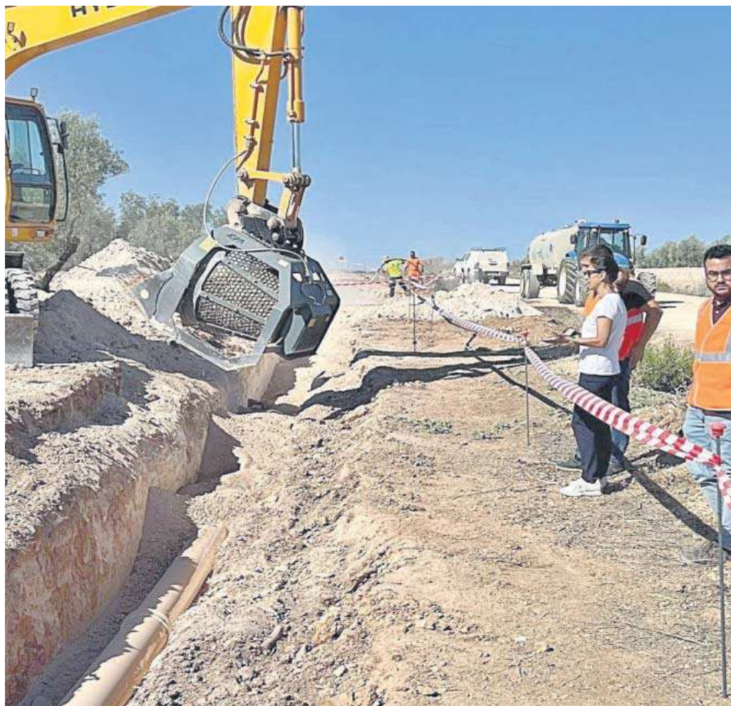
Los trabajos de mejora en Herrera.