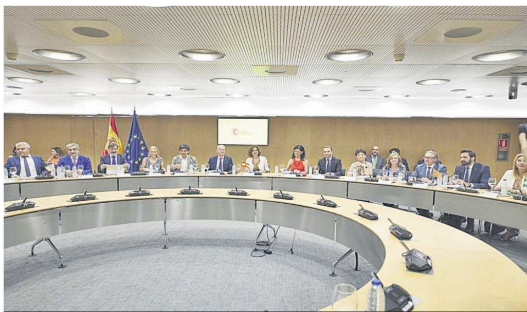
Reunión del Consejo de Política Fiscal y Financiera presidido por la ministra de Hacienda.