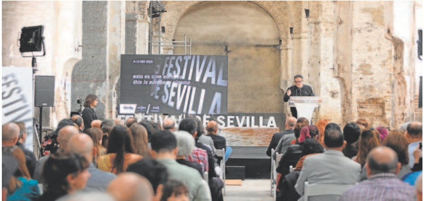
Imagen de una de las actividades de la pasada edición del Festival de Cine, que tuvo lugar en la Fábrica de Artillería