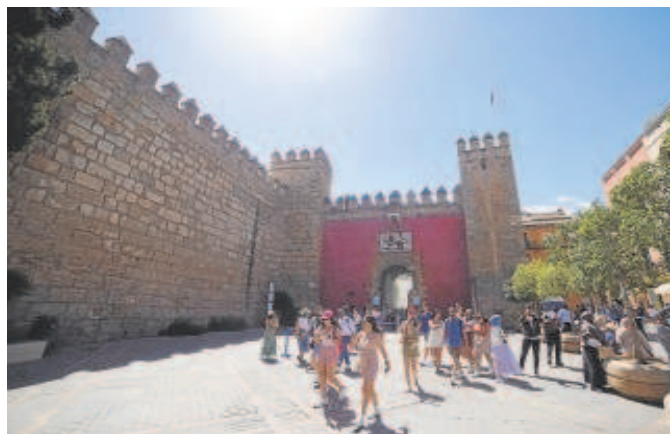
Fibes, la Casa Pilatos, la Fábrica de Artillería o el Real Alcázar son algunos de los espacios públicos donde se celebrarán eventos de los Grammy // ABC

do en cuenta para la celebración, pues la organización ha optado por el patrimonio público. No obstante, en esta casa palacio se ha previsto uno de los eventos vinculados a los premios, según el calendario que maneja el Consistorio. Entre los que se ajusta al espacio está el encuentro de mujeres líderes de la industria de la música.