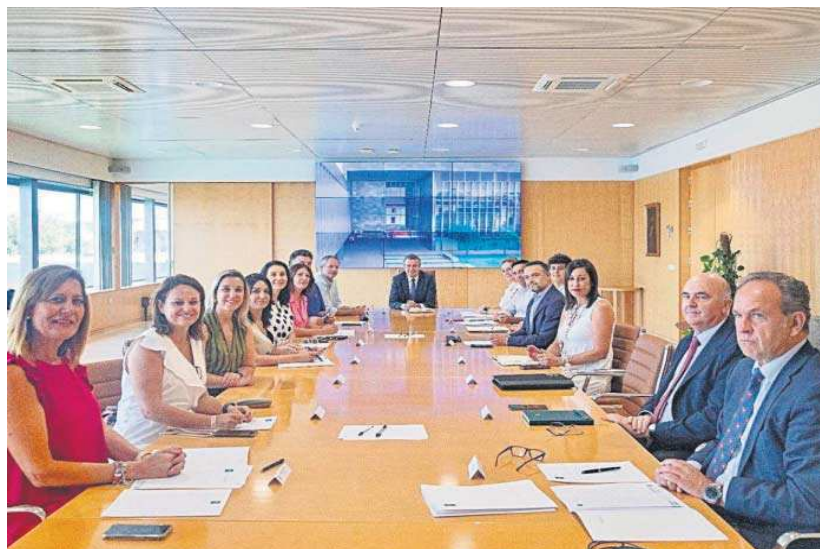
Equipo de gobierno de la Diputación Provincial de Sevilla.

Respecto al programa de ayudas a los municipios para el programa extraordinario de emergencia social, al que la Diputación aporta cinco millones de euros. De ellos, 3,5 millones irán desti-