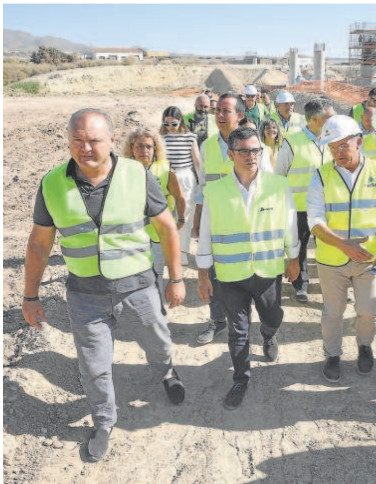
Félix Bolaños, durante su visita ayer a Almería

Bolaños sostuvo que con Pedro Sánchez Andalucía recibe 6.000 millones de euros más cada año de financiación autonómica