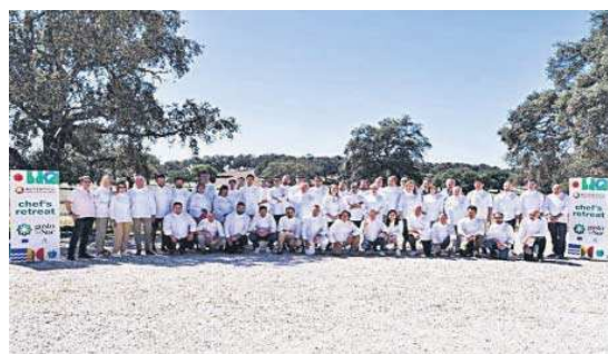
Foto de familia durante el primer retiro de chefs Michelin de toda España.

Por ello, avanzó que la Junta de Andalucía va a pedir ostentar en 2024 la vicepresidencia o presidencia de Arepo, asociación de la regiones europeas de los productos de origen, que es un "lobby de la alimentación en la UE" donde se establecen la nor-