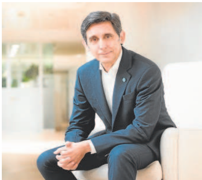
El presidente de Telefónica, José María Álvarez-Pallete

En este sentido, según estas mismas fuentes, Calviño incidió particularmente en las oportunidades de inversión que pueden surgir al calor de la creciente competitividad de dos sectores fundamentales, el digital y el de la transición verde, alentadas tanto por las inversiones de los fondos europeos como por la reducción de los costes energéticos en España.