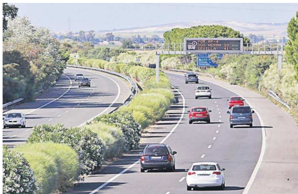
Vehículos en la autopista entre Sevilla y Cádiz.

● Las Cámaras de Comercio de ambas provincias y las patronales mantendrán una reunión el próximo 9 de octubre