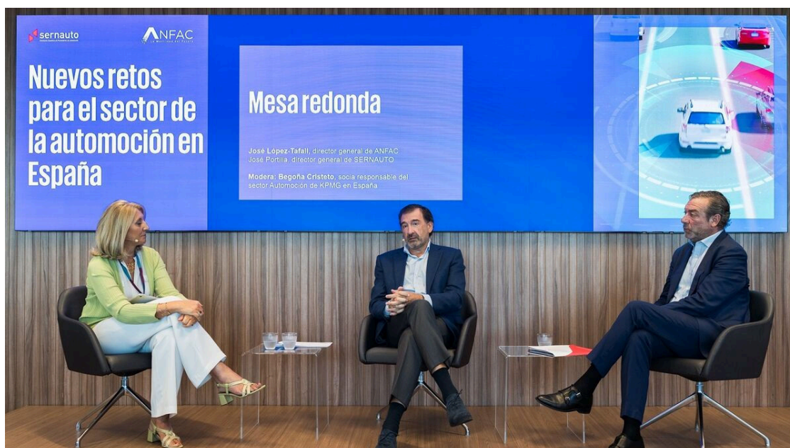
En la mesa redonda intervinieron los directores generales de las asociaciones patrocinadoras del informe junto a la socia de KPMG, la asesoría encargada de redactarlo.

A partir de ahí establece cinco líneas de actuación a seguir bajo una nueva política única y coordinada para poder revertir la situación