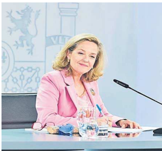
Nadia Calviño, en rueda de prensa, ayer, en la Moncloa.

En este sentido, Calviño hizo hincapié en que el Gobierno ha movilizado hasta ahora casi 50.000 millones de euros de re-