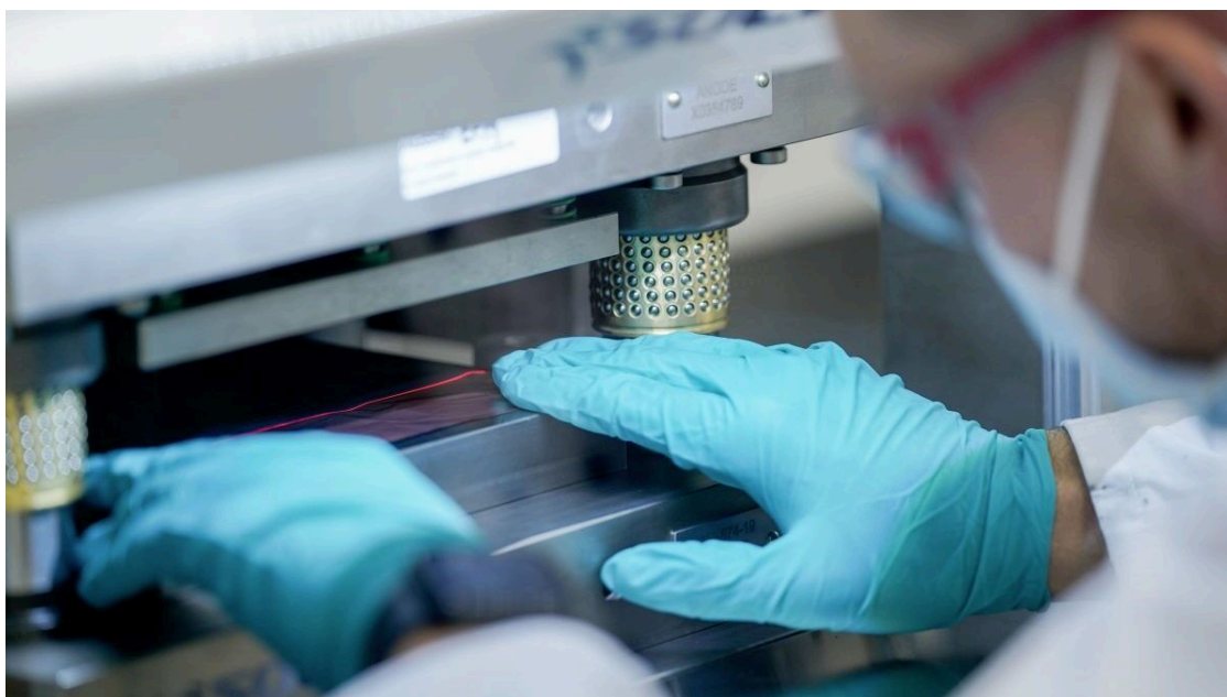
El documento señala la necesidad de potenciar la inversión en I+D+i como base del crecimiento industrial.

Adicionalmente, el informe apuesta por avanzar en la generación, retención y aprovechamiento del ecosistema de innovación y crecimiento industrial pasando por establecer un sistema que potencia las deducciones fiscales en I+D+i, fomente la digitalización e incentive la implantación de centros de desarrollo tecnológico y conocimiento.