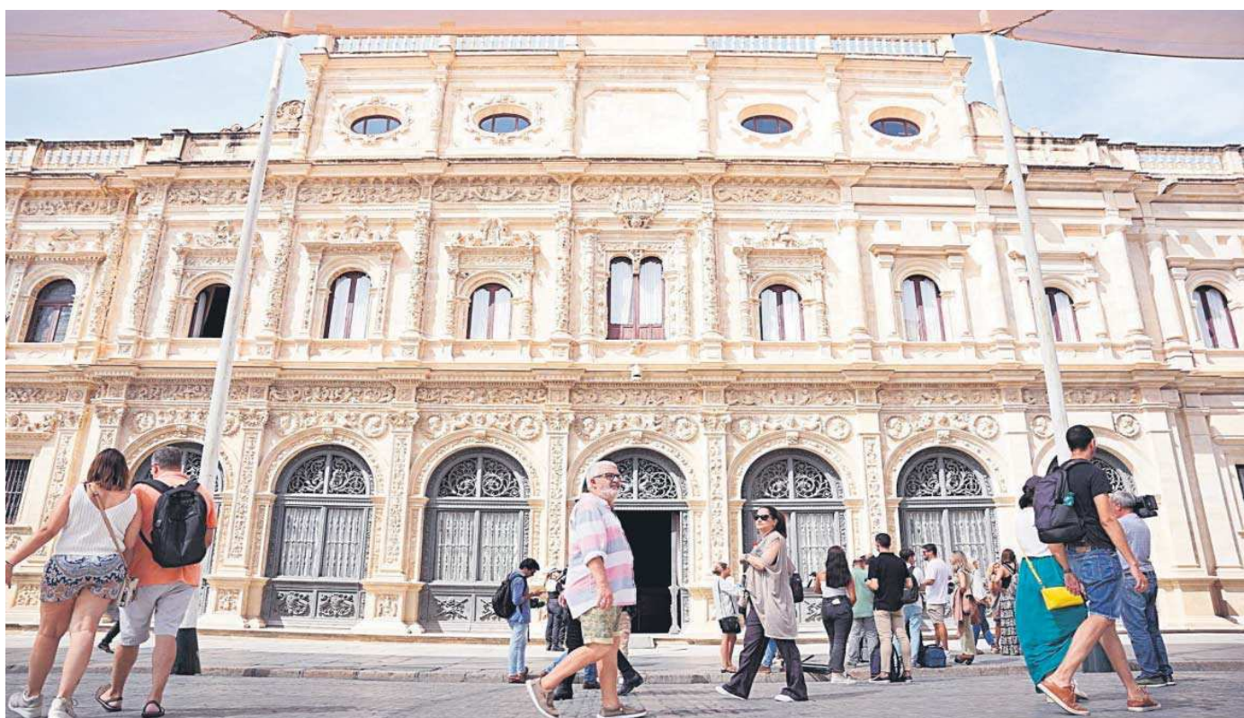
Varias personas caminan junto a la fachada de la Casa Consistorial que mira a la plaza de San Francisco.

● El presupuesto para 2024 cuenta con 1.024 millones, lo que supone un incremento de 29 millones ● Sanz baraja aumentar las tasas del cementerio y las instalaciones deportivas