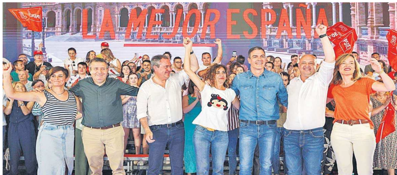
Pedro Sánchez, junto a Isabel Rodríguez, Javier Fernández, Juan Espadas, María Jesús Montero, Francisco Rodríguez y Pilar Alegria.