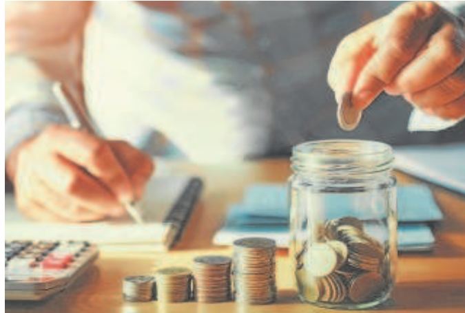
Familias y empresas andaluzas tienen más dinero depositado en bancos