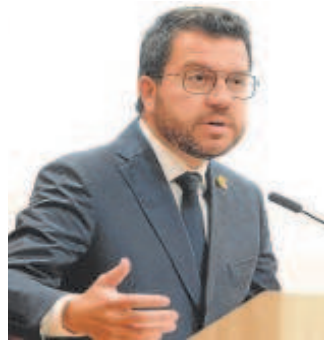
Pere Aragonès

Antes, había reconocido también que ya «corren documentos» entre los partidos que plantean la amnistía, lo que corroboraría esa luz verde política al olvido legal de los delitos del referéndum