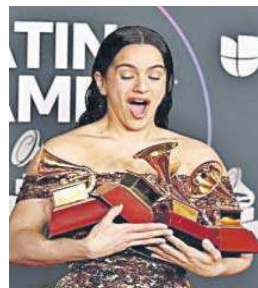
Rosalía, en una edición anterior.

“Sevilla llegó a ser puerta de entrada del nuevo mundo y capital de ese entente iberoamerica-