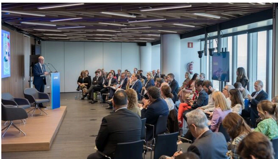
ANFAC y SERNAUTO definen la hoja de ruta hacia la nueva movilidad

ANFAC, la patronal de los fabricantes españoles de automóviles y camiones; y SERNAUTO, asociación de proveedores de automoción, han publicado un informe en colaboración con KPMG que identifica las áreas de actuación y donde es necesario invertir recursos, con el objetivo de establecer una visión sobre una nueva política industrial coordinada. Para ANFAC y SERNAUTO, señalar estos retos permitirá abordar el proceso de transformación tecnológico e industrial con que se enfrenta la automoción en España.