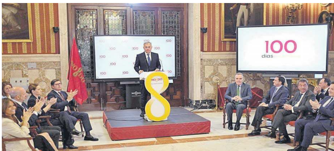
José Luis Sanz durante su balance de los cien primeros días de gobierno en Sevilla.

“La dejadez lo inundaba todo”, lamentó el alcalde en referencia a cómo se encontró la ciudad al hacerse con el mando de ella. Para ejemplificar tal situación, recordó dos casos recientes que han protagonizado los titulares de los perí-