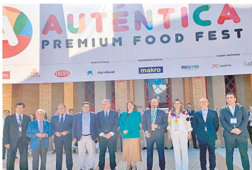
La consejera de Agricultura y el alcalde de Sevilla, en el centro, junto al resto de representantes del sector.

También este evento, según la consejera, es la "mejor forma de empujar a un sector agroalimentario que sufre los problemas derivados de la sequía y de los costes de producción" y proclamó la fortaleza de este sector en Andalucía, que es la "cuna fundamental de la alimentación" con unas exportaciones agroalimentarias por valor de más de 14.000 millones en 2022.