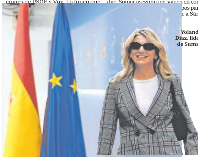
Yolanda Díaz, líder de Sumar