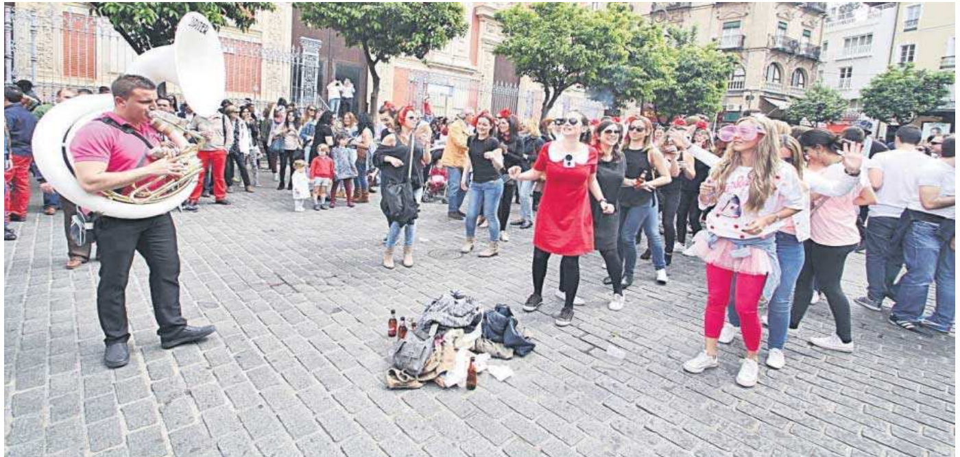
Una de las muchas despedidas de soltera que se celebran en la Plaza del Salvador.