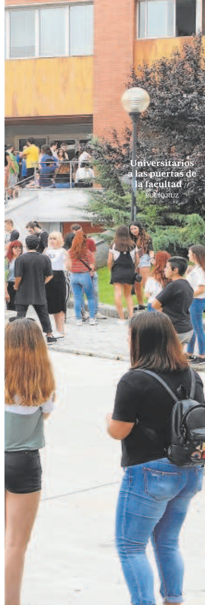
Universitarios a las puertas de la facultad // Rolo.roz