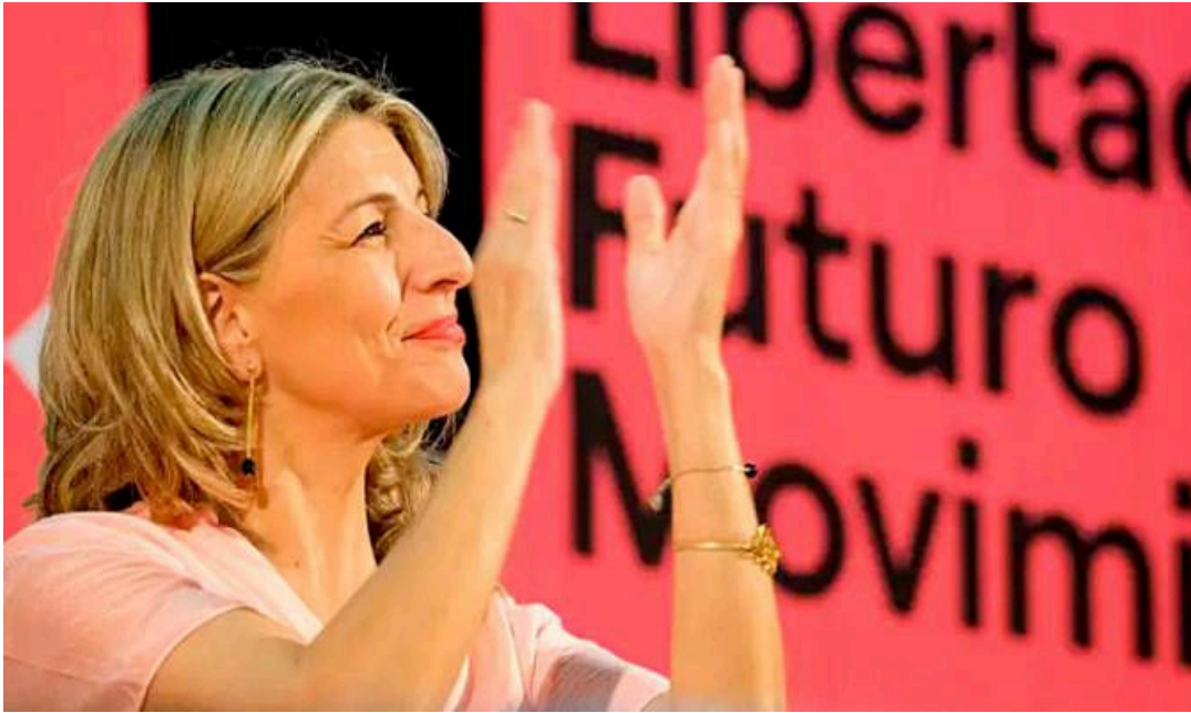
Yolanda Díaz.