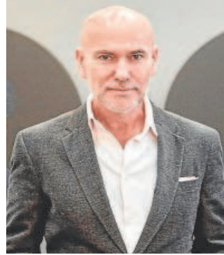
Salustiano García

su página web la galería Stoa, «Salustiano es un pintor sevillano, maestro del ámbito figurativo, que cuenta con un merecido reconocimiento internacional. Sus obras, retratos impactantes, sobresalen por la brillante técnica de ejecución y esa fina elegancia que solo consiguen los clásicos. En la contemplación de su obra, resulta inequívoca la reminiscencia al Renacimiento más sublime, con una composición de invocación cuatrocentista, en la que deslumbran