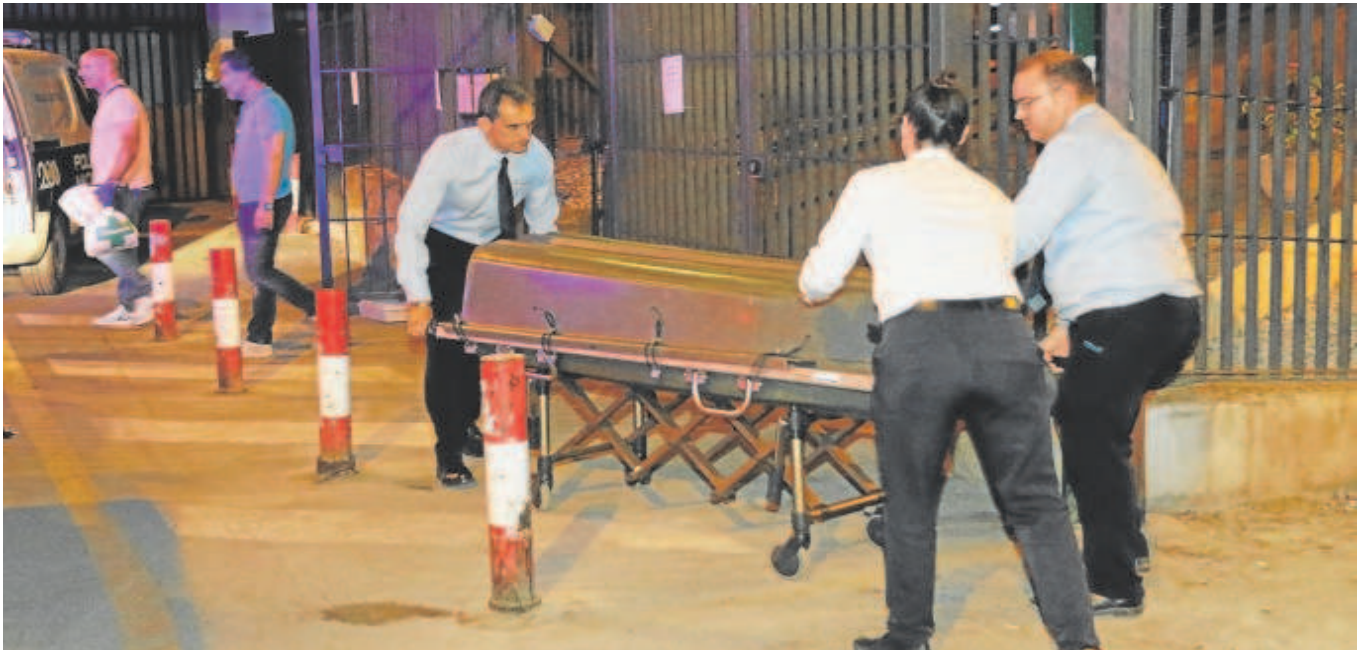
Momento en el que sacan el féretro en Granada con la última víctima de la violencia machista en Andalucía