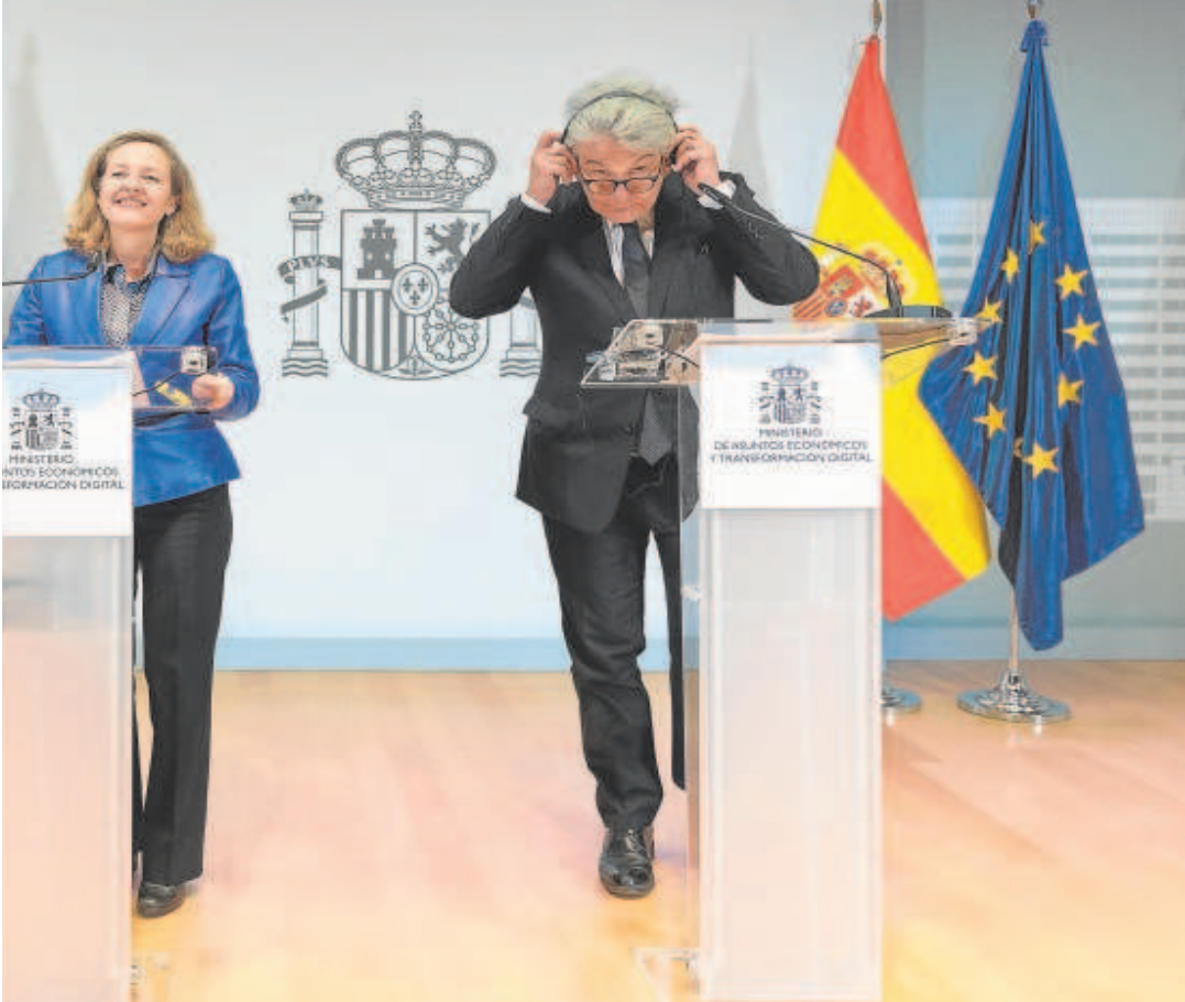
Nadia Calviño y el comisario de Mercado Interior, Thierry Breton

sector público cuenta con recursos y es el origen en muchas ocasiones de la morosidad indeseada entre pequeñas empresas.