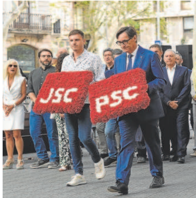
Ofrenda floral en el monumento a Rafael Casanovas

Aunque Puigdemont fue claro y exigió la amnistía como una condición necesaria para alcanzar un posible acuerdo con el bloque de izquierdas, Jaume Asens confesó que «van muy justos». «Es verdad que los plazos legalmente se pueden cumplir, pero no se puede forzar la máquina», advirtió durante una entrevista en TVE el negociador de Sumar. En la misma línea se expresó su portavoz, Ernest Urtsun en una rueda de prensa posterior. «Es una cosa que habrá que ver», respondió acerca de los plazos que manejan, añadiendo que «los trámites parlamentarios tienen sus tiempos». Según explicó, el equipo de una veintena de juristas, con Asens a la cabeza, continúa trabajando en las cuestiones jurídicas, las cuales harán públicas una vez esté listo el dictamen. No obstante, Urtsun insistió en que tienen claro que una posible ley de amnistía tiene encaje en la Constitución. «No la prohíbe», señaló el portavoz.