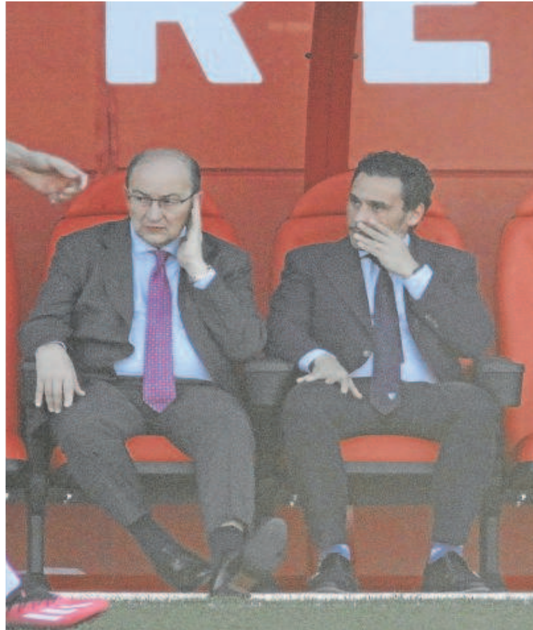
asisten a una sesión reciente del equipo sevillista en la ciudad deportiva

cimiento a nivel internacional, transformando los medios de comunicación digitales en una plataforma de contenido, creciendo en cantera y consiguiendo éxitos deportivos. Básicamente un club que crezca a nivel económico y siga dando resultados deportivos al club a través de las diferentes líneas de negocio en las que todos estamos trabajando».