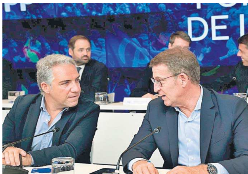
Feijóo conversa con Elías Bendodo en la junta directiva del PP.

Por eso, arengó a los suyos a los que dijo que “la respuesta al desafío separatista no es ni puede ser un mero enfrentamiento dialéctico entre Génova y Ferraz” sino que “la responsabili-