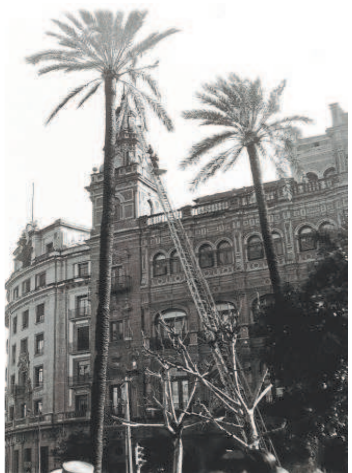
Daños en un edificio de la Plaza Nueva tras el terremoto de 1969 en Sevilla

El Ayuntamiento admite que sólo hay un capítulo dentro de las emergencias generales desfasado y que trabaja en elaborarlo