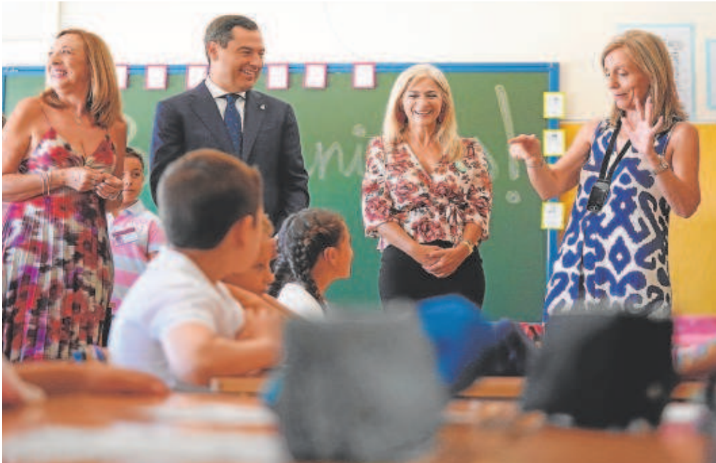
El presidente de la Junta, Juanma Moreno, inauguró el curso en el CEIP Cándido Nogales de Jaén