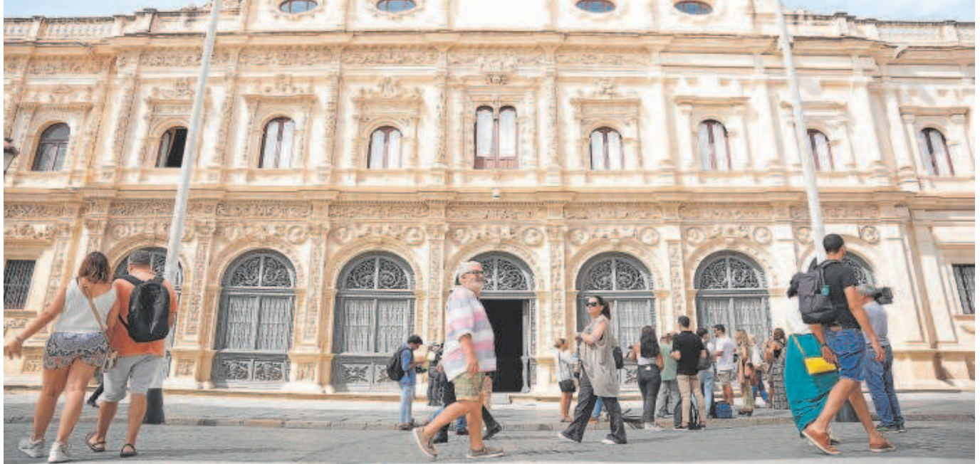
Fachada del Ayuntamiento de Sevilla de la plaza de San Francisco, acceso provisional al Consistorio por obras en la cara de la Plaza Nueva