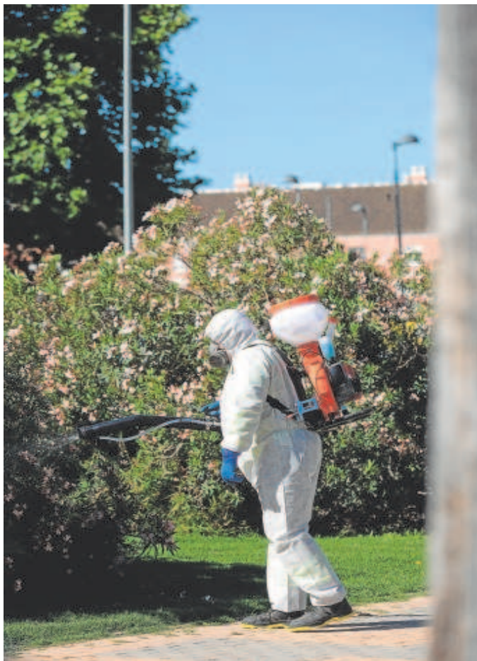
Un operario realiza tareas de fumigación contra el mosquito

«Tenemos trampas puestas en 26 municipios distintos —en toda Andalucía— y, como nos ha pasado durante este verano, hemos detectado picos de densidad en ciertos lugares. Cuando detectamos el número de mosquitos hembras, que son las que poten-