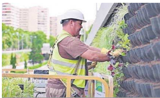
Colocación de plantas en el jardín vertical de la M-30. TERAPIA URBANA

do, desarrollado y monitorizado el jardín, basado en el sistema Fytotextile, que ofrece altas prestaciones para un comportamiento excelente de la vegetación. Los jardines verticales fijan contaminantes del aire (NOx, CO, PM, VOC), reducen la temperatura en su entorno y aportan humedad relativa mediante evapotranspiración (mitigando así el efecto isla de calor en las ciudades). Mejoran el aislamiento acústico y térmico de las fachadas, reduciendo el consumo energético de los edificios. Nos permiten conectar con elementos vivos, mejoran nuestro bienestar.