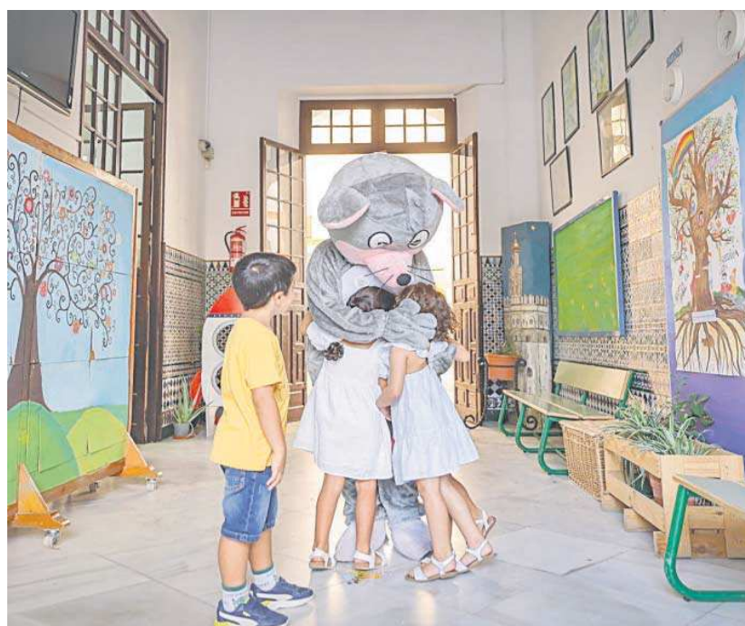
La mascota del CEIP San Jacinto recibe a los alumnos en el primer día de clase.

Hasta no hace mucho a este colegio acudían 500 niños. La crisis de la natalidad que sacude a España tiene su efecto directo en las