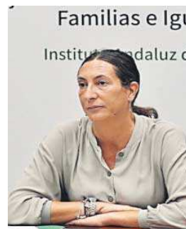
Loles López ayer en Sevilla.

“Las políticas se deben evaluar y hay que ser más flexible en algunos temas”, dijo la titular de Igualdad, que añadió que se trata de “un tema muy sensible en el que se emplean fondos públicos y que es responsabilidad de todos, empezando por el