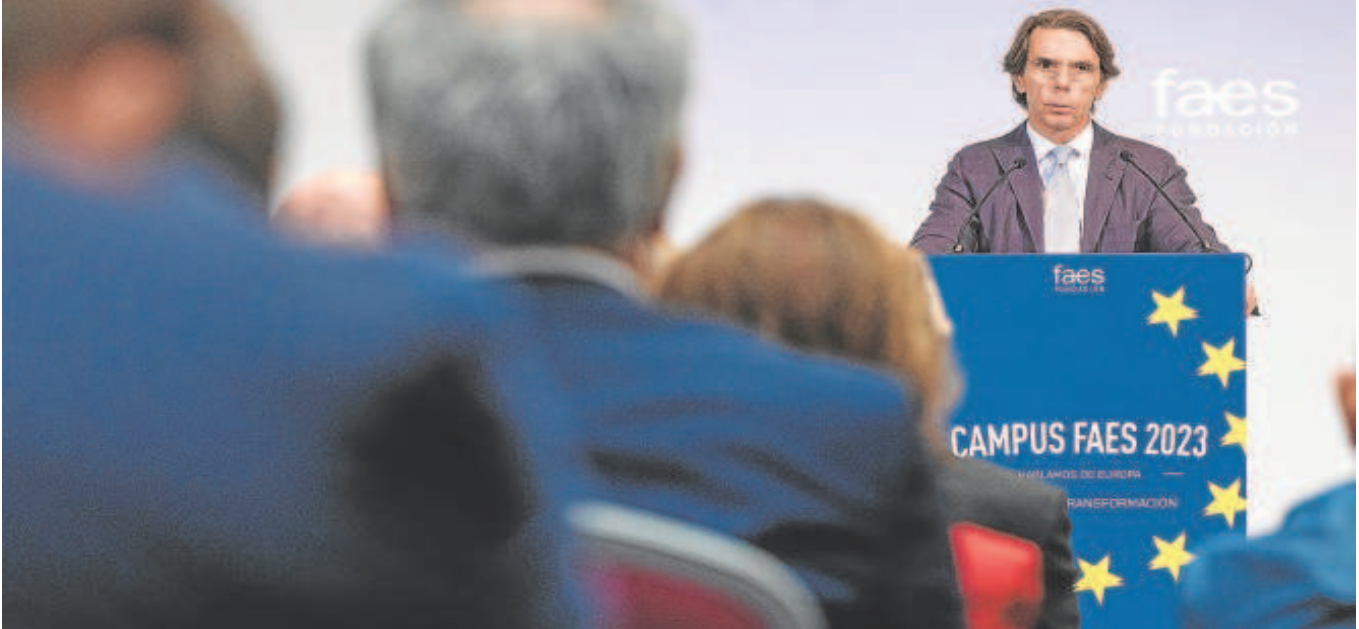
José María Aznar, durante su discurso de ayer en FAES