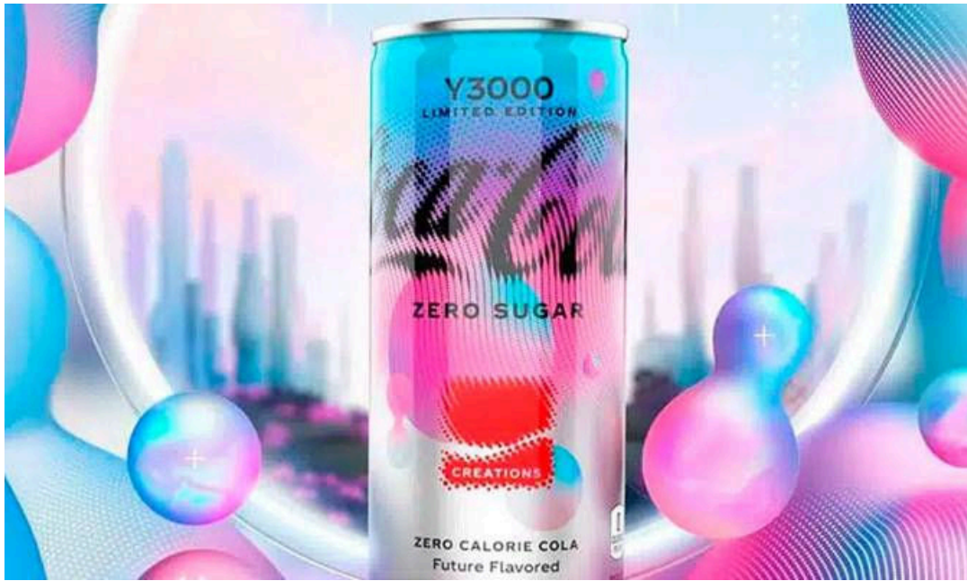
La nueva Coca-Cola 3000.