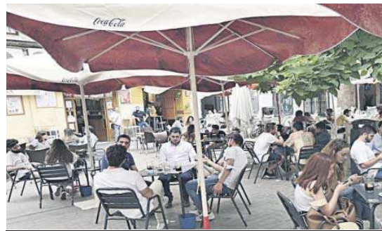
Un mar de veladores en el centro de Sevilla.

Sobre la ampliación de veladores, las entidades señalan en el escrito su "indignación" por la