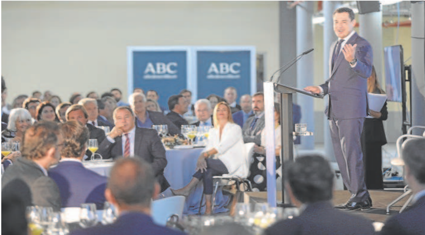
El presidente de la Junta, Juanma Moreno, ayer, en el Foro ABC patrocinado por Cepsa, en la Casa de ABC de Sevilla