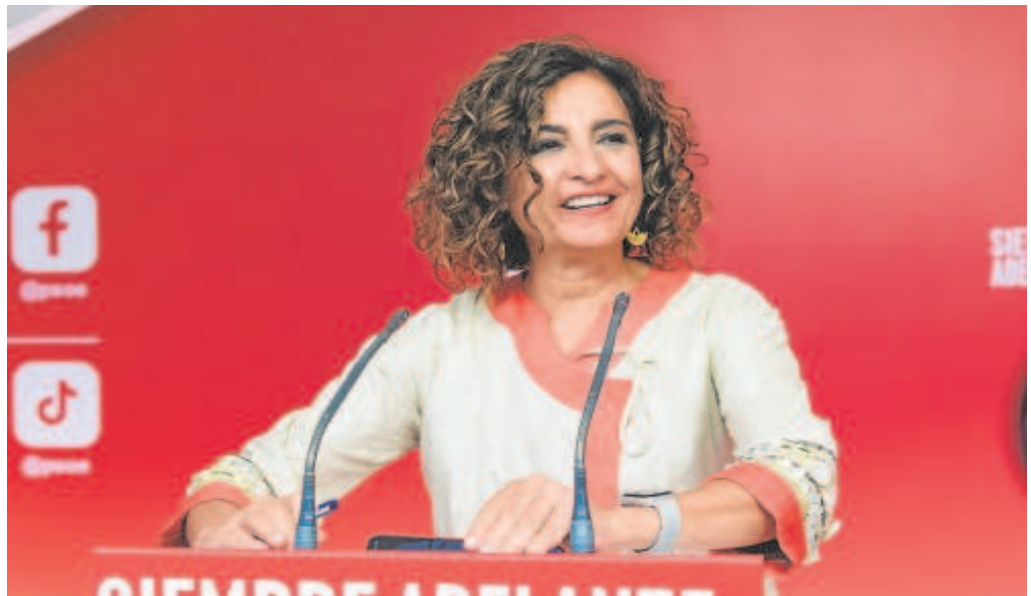
La ministra de Hacienda en funciones, María Jesús Montero

El Gobierno necesita que las CC.AA. cierren 2024 con un déficit cero y Cataluña ya ha dicho que prevé un desequilibrio del 0,3%