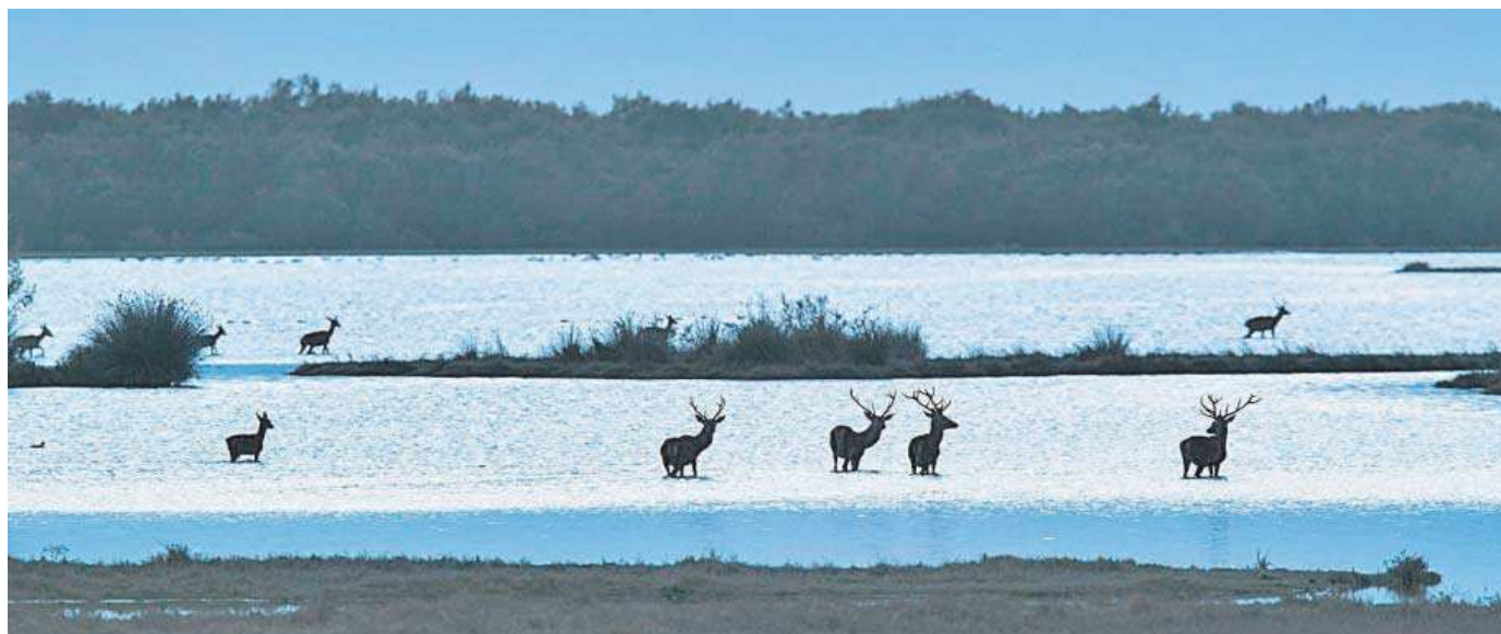
Ciervos en uno de los parajes de la finca Veta la Palma.