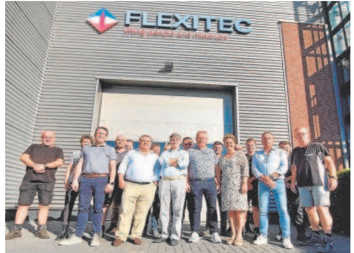
Instalaciones de Flexitec en Países Bajos, adquirida parcialmente por Hidral

Hidral, participada por la compañía Chacartegui Gómez, tiene como actividad principal la construcción