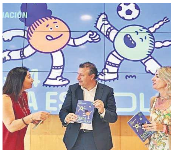
El presidente de la Diputación durante la presentación de la Agenda Escolar. M. G.

“Es necesario que desde la infancia y la adolescencia se aprenda a expresar los sentimientos y las emociones y a amar de una forma sana y no tóxica, potenciando las relaciones basadas en la confianza, el respeto, la tolerancia y la aceptación mutua. Y que las niñas y adolescentes sepan que pueden hacer