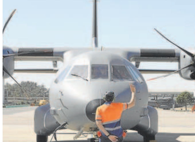
C295, avión de transporte militar de Airbus