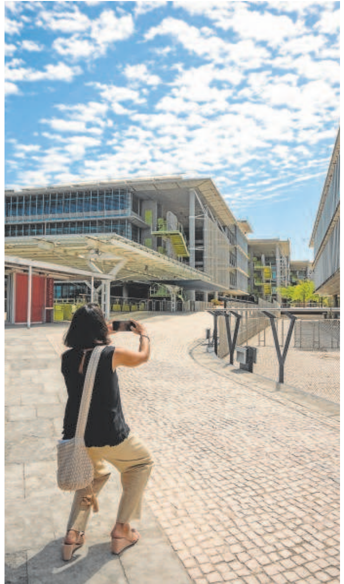
Dependencias de la Ciudad de la Justicia de Palmas Altas

«Me dicen los técnicos que es la operación de mayor envergadura que ha acometido la Consejería en toda su historia, no sólo por las obras sino por la complejidad del traslado. Ha costado mucho llegar aquí y pido a los implicados, jueces, fiscales, abogados, funcionarios y ciudadanos que comprendan que, al principio, en un proceso tan complicado, puede haber incidencias», concluyó.