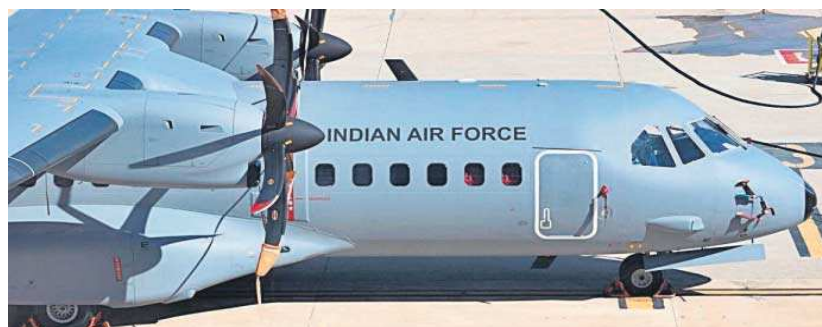
Avión C295 entregado a la India en vuelo.

Airbus entregó ayer miércoles en Sevilla en condiciones de vuelo el primero de los 56 aviones C295 a la Fuerza Aérea de la India (IAF) para comenzar a sustituir su flota de Avros-748, dentro de una alianza que está previsto que aumente con nuevos pedidos en los próximos años.