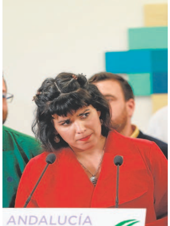
La política de Adelante Andalucía Teresa Rodríguez