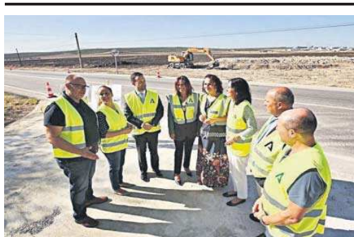
Visita de la consejera de Fomento a las obras en la A-92.

El cruce entre la autovía A-92 y la carretera Arahal-Morón (A-8125) ha experimentado un importante crecimiento de tráfico en los últimos años, ya no sólo por ser una de las entradas del municipio, sino porque se trata de un tramo donde confluye numeroso tráfico agrícola, sobre todo en época de verdeo, y camiones procedentes de fábricas metalúrgicas y de un polígono industrial próximo. El cruce no está dimensionado al actual flujo de tráfico, ya que permite giros a la izquierda que entrañan un riesgo de accidentes por colisión.