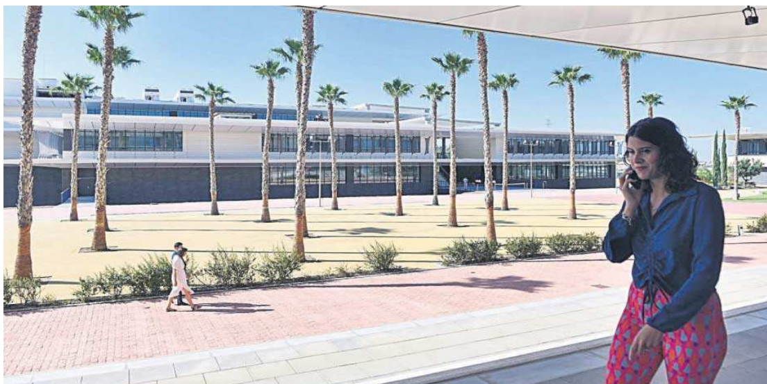
El nuevo edificio que conforma el Campus Sevilla de la Universidad Loyola.