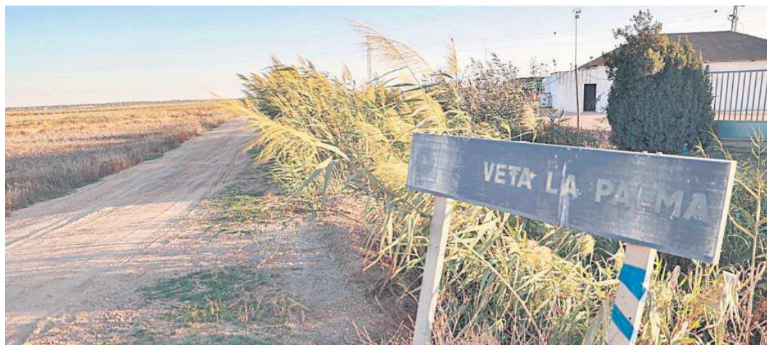
Imagen de los accesos a la finca Veta la Palma que será comprada por la Junta de Andalucía.