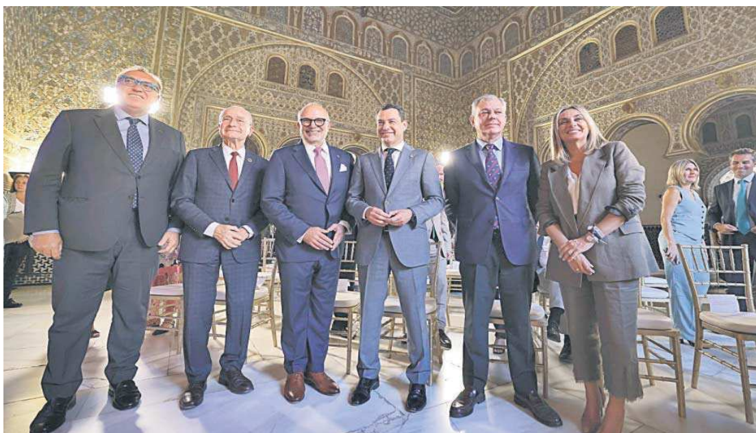
El presidente de la Junta, Juanma Moreno; el consejero de Cultura, Arturo Bernal; y el CEO de la Academia, Manuel Abud; junto a los alcaldes de Sevilla, Málaga y Granada.

● Ambas ciudades acogerán las sesiones previas a la gala, que se celebrará el 16 de noviembre en Sevilla