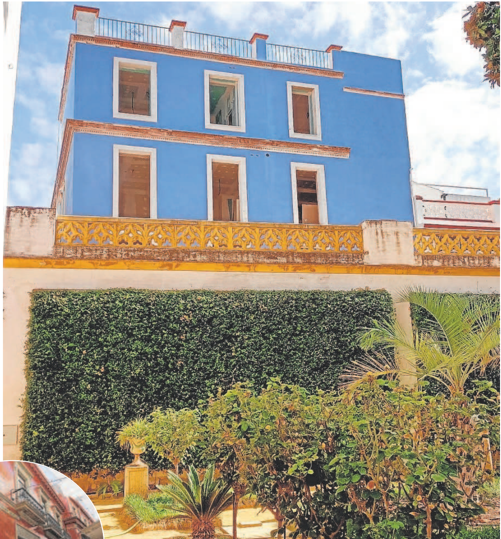
Arriba, el edificio de la calle Imperial pintado de celeste visto desde el Jardín Chico de la Casa de Pilatos. A la izquierda, el Circolo de Labradores de la calle Sierpes

En esta ocasión, el color de esta fachada se observa en una calle transi-