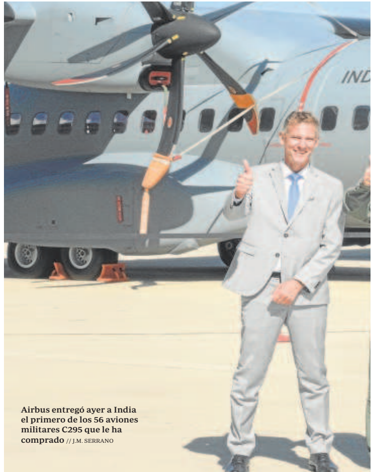
Airbus entregó ayer a India el primero de los 56 aviones militares C295 que le ha comprado