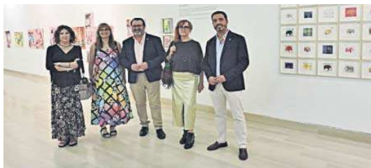
Las tres artistas durante la inauguración de la exposición.

Este proyecto triangular abarca pintura, escultura y fotogra-