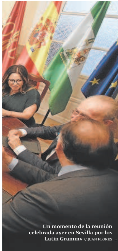
Un momento de la reunión celebrada ayer en Sevilla por los Latin Grammy