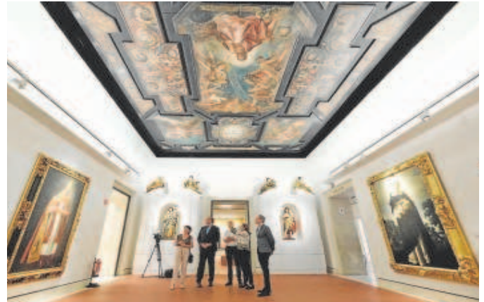
El techo de Juan de Arguijo, ya expuesto en su nueva sala

Esta adaptación para su exposición, para la que se ha reducido la altura del