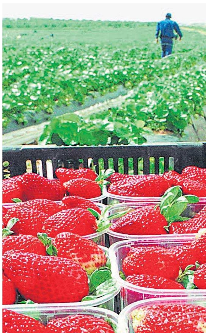
Imagen de archivo de una campaña de frutos rojos.

Como consecuencia de las distintas pesquisas efectuadas por los investigadores, los agentes detuvieron entre los días 25 y 26 de septiembre a 23 personas en Sevilla, Écija, Córdoba y Jerez de la Frontera. A los arrestados se