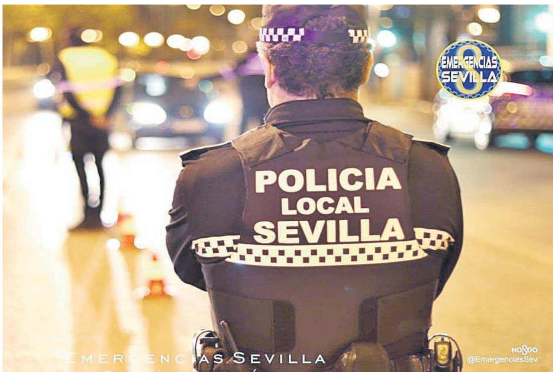
Un agente de la Policía Local, de servicio.