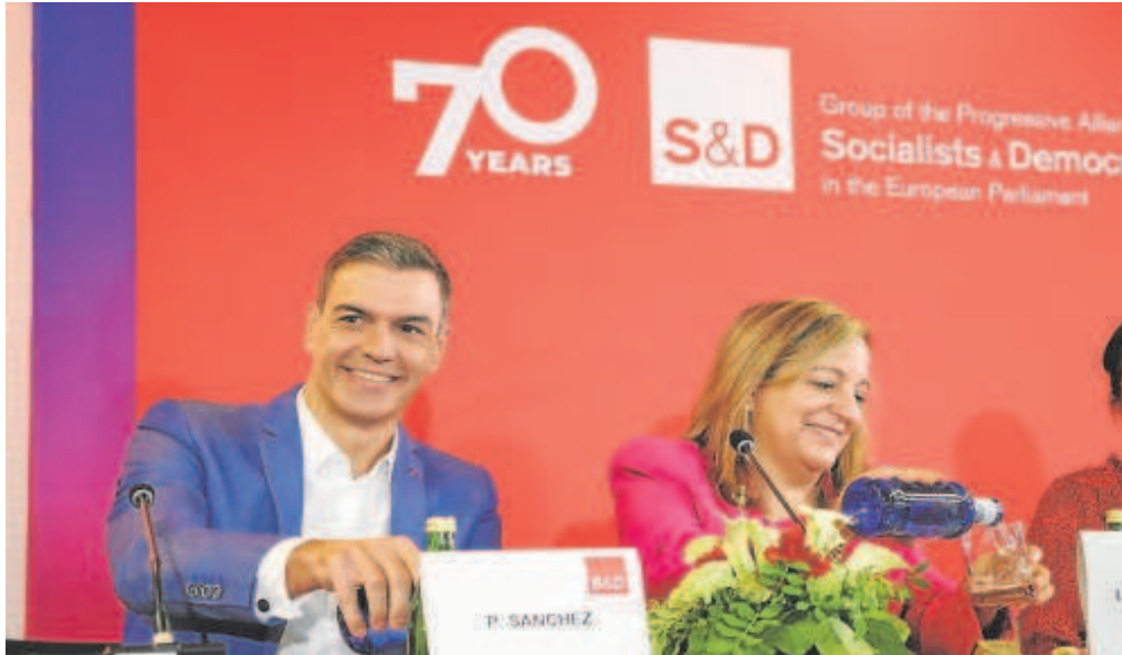
El líder del PSOE, Pedro Sánchez, y la eurodiputada socialista Iratxe García ayer en Madrid