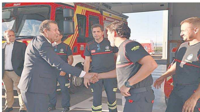
El presidente de la Diputación y el alcalde de La Rinconada en el momento de la inauguración del nuevo Parque Comarcal.

Está dotado con cinco vehículos de primera intervención, tanto para emergencias en el ámbito urbanos como de carácter rural. Conforman esta dotación una autobomba urbana ligera (BUL), una autobomba nodriza pesada (BNP), una autobomba rural pesada (BRP), un furgón de salvamentos varios (FSV) y una embarcación semirrigida de rescate. El personal de guardia está integrado por dos bomberos/as y un cabo, 24 horas los 365 días del año y,