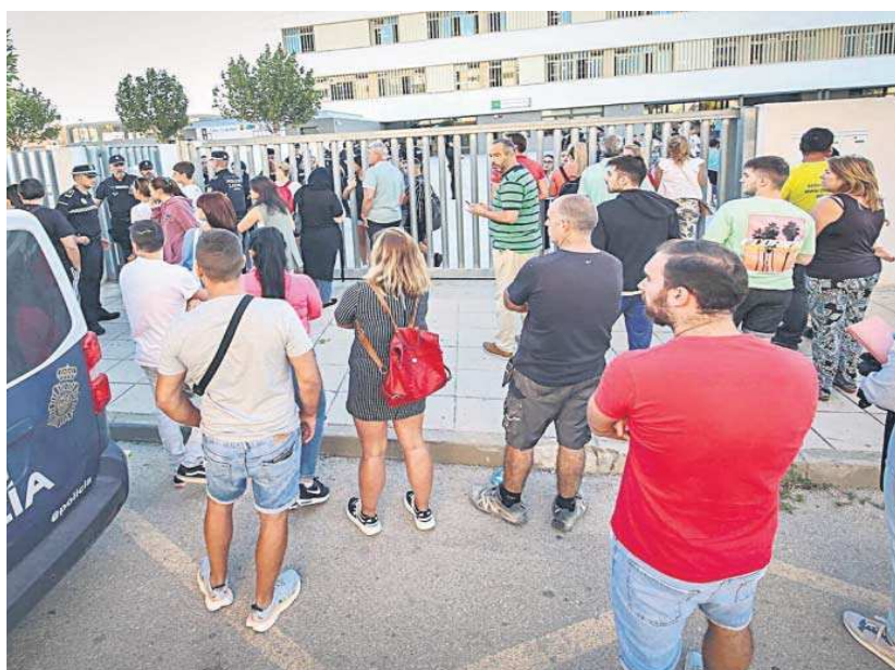
Padres y madres de alumnos, a las puertas del centro a primera hora de la mañana.

El presidente de la Junta, Juanma Moreno, deseó la pronta recuperación de los heridos y se mostró cauto a la espera de que la investigación policial dé datos sobre lo ocurrido. "Al final, es un susto que nos llevamos todo en el cuerpo y que nos recuerda episodios que aquí en España no han pasado, pero que sí suceden en otras partes del mundo", afirmó.