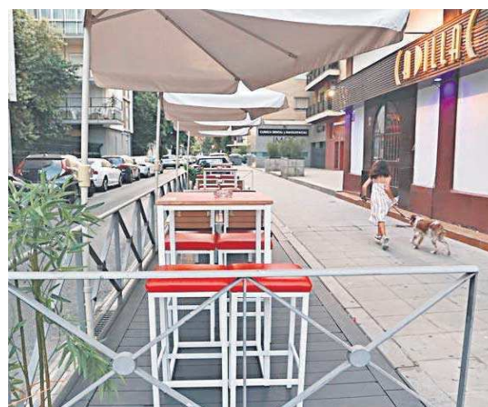
La superficie máxima es de 100 metros cuadrados.

Todos los casos de ampliación de veladores llevados a cabo en estos años serán analiza-