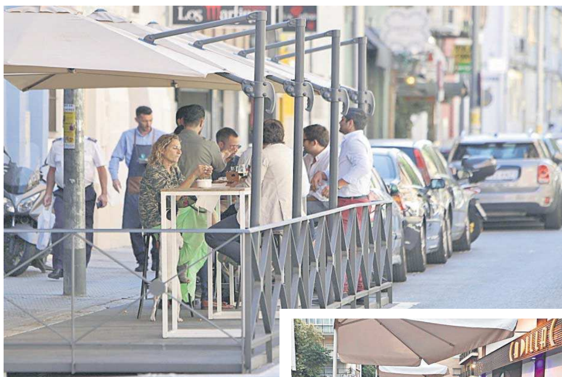
Varios clientes en el velador de un bar instalado en un aparcamiento.

Urbanismo también considera que “hay que tener en cuenta que los usos de los consumidores se han visto alterados por las condiciones sanitarias ya superadas, generando demanda de consumo en el exterior de los establecimientos”. Todas estas argumentaciones concluyen en que se seguirá posibilitando “la instalación de ter-