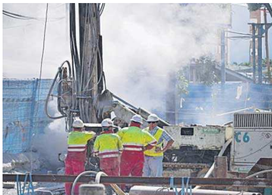
Maquinaria en funcionamiento en Las Razas.

Para la asociación vecinal Bermejales Activa, tiene más sentido que se abriera en octubre hasta la gasolinera, y no solo hasta el IES Punta del Verde, para descongestionar la zona. Para Foro de Heliópolis, lo esencial es recuperar la normalidad del tráfico en toda la extensión de Las Razas para aliviar el colapso y acabar con los malos olores y fuertes ruidos de día y de noche que sufre Heliópolis. Desde Parque Vivo del Guadaira se recalca que “ya se podía llegar desde Lagoh al IES Punta del Verde”, por lo que reabrir solo este tramo no mejorará la circulación del entorno.