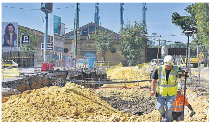
El tramo de Las Razas con las obras más intensas.

Los vecinos del entorno se quejan de que llevan un año con graves problemas de tráfico y saturación de Reina Mercedes y La Palmera