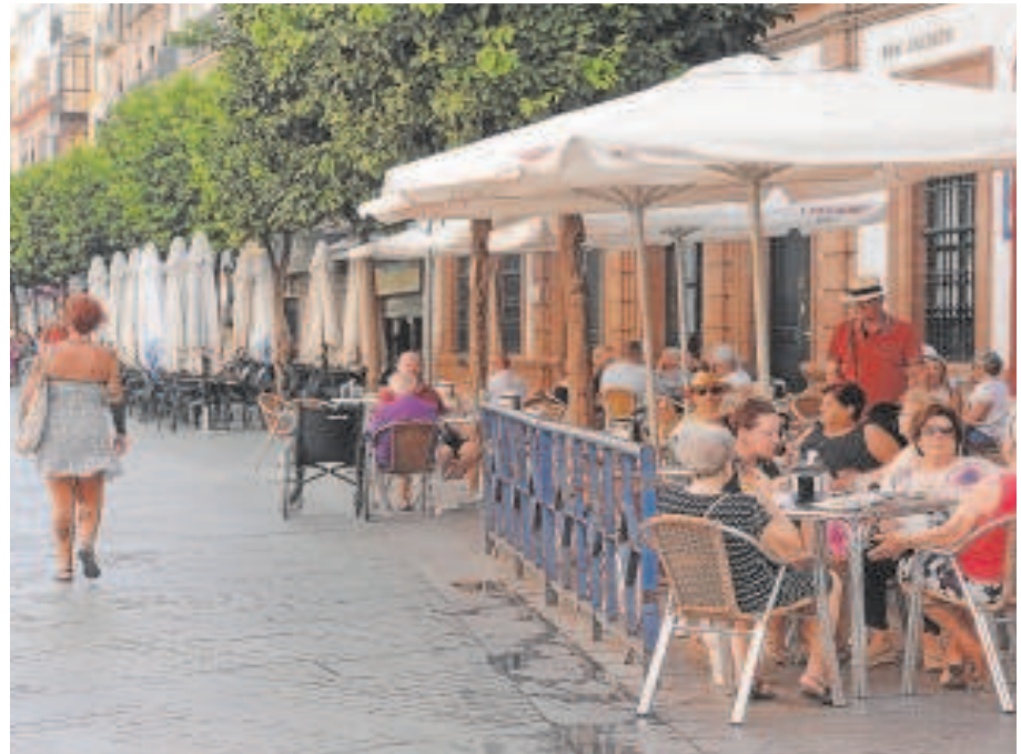
Veladores en la calle San Jacinto

Aunque las condiciones sanitarias derivadas de la pandemia que motivaron esta medida excepcional y temporal de ocupación de la vía pública por veladores «han quedado sin vigencia», el acuerdo de 2020, según el Ayuntamiento, «se adoptó no sólo motivado» por esas excepcionales circunstancias sanitarias sino «también por las circunstancias de índole económica y sociales