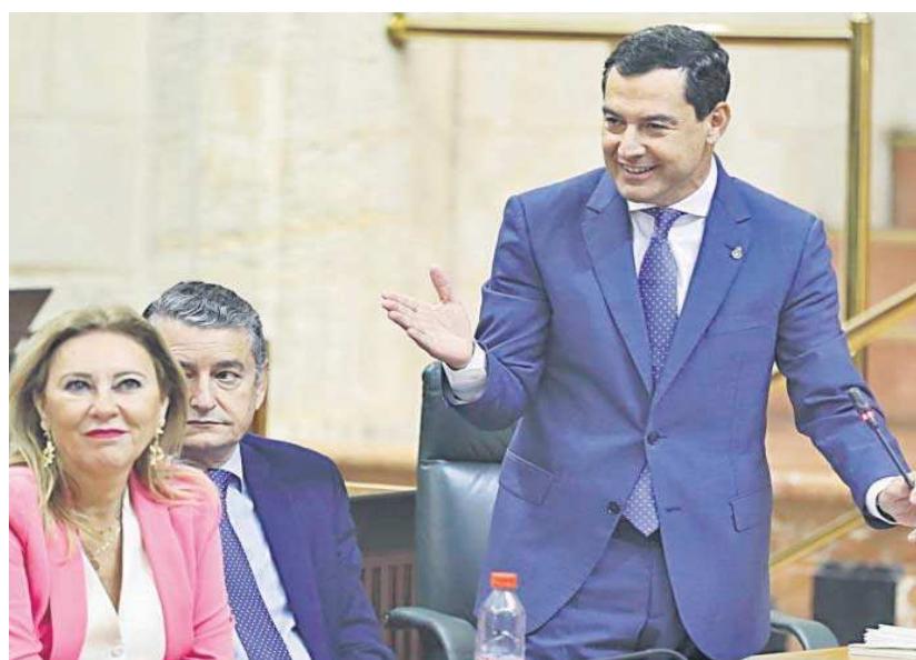
Juanma Moreno, en la sesión de control de ayer.