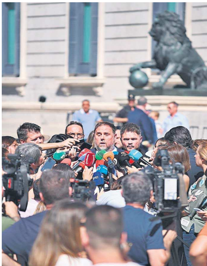
Oriol Junqueras atiende a los periodistas a las puertas del Congreso, ayer.

La exigencia encontró pronto la respuesta negativa de los socialistas. El PSOE y el PSC replicaron a Junts y ERC, que por el camino de la ruptura y la discordia "no hay avance posible", y rei-