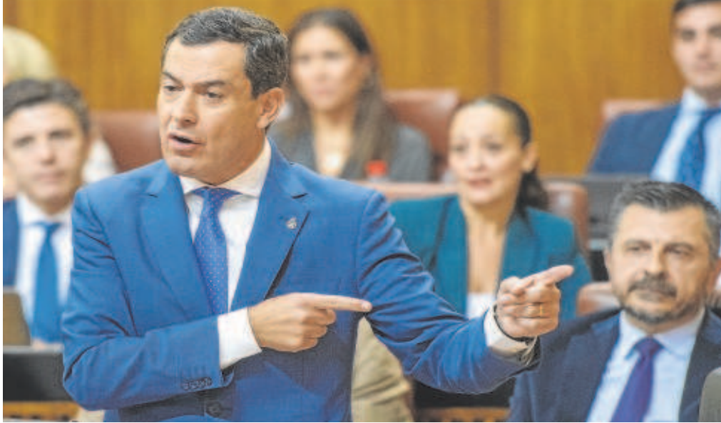
El presidente de la Junta, Juanma Moreno, ayer en el Parlamento de Andalucía