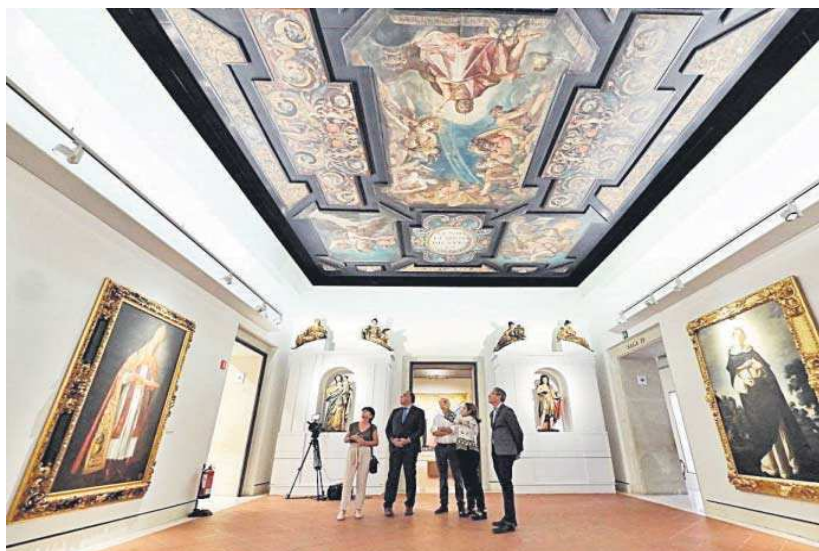
El consejero de Turismo, Cultura y Deporte, Arturo Bernal, visitó ayer el Museo de Bellas Artes.

La obra refleja el triunfo de la cultura clásica en Sevilla a través de las imágenes dedicadas a los dioses del Olimpo y las musas. Una