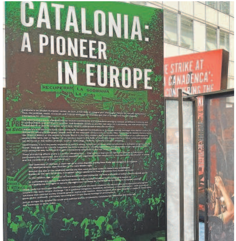
Carteles retirados de la Eurocámara a petición de Ciudadanos // ABC

«Insistir en que en 1714 Cataluña tenía características de un Estado independiente es falso. No tiene base histórica»