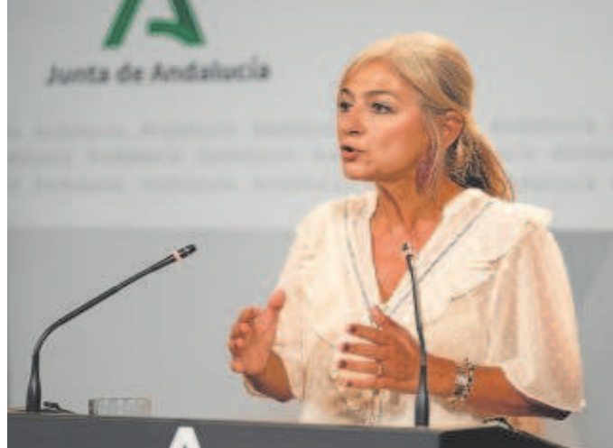
La consejera de Desarrollo Educativo, Patricia del Pozo // EP