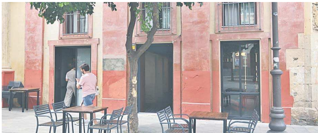
La terraza de veladores del nuevo negocio de la Plaza del Salvador.