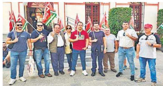
Concentración de trabajadores de Santa Bárbara.

Los trabajadores de la planta alcalaíense mantuvieron un piquete informativo a las puertas de la factoría desde las 06:30 y posteriormente se concentraron a las puertas del Ayuntamiento de la localidad sevillana. Si no hay acuerdo, CCOO tiene planteado un calendario de huelgas que seguirá los días 12, 19 y 26.