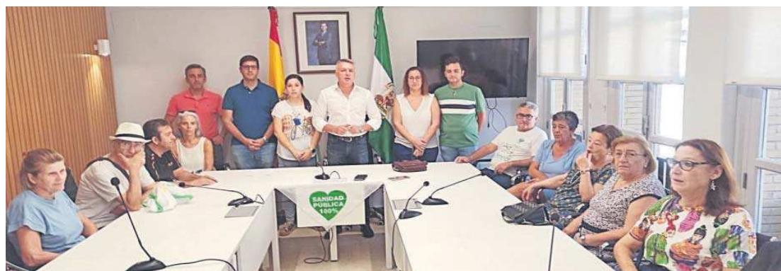
Vecinos y representantes de la corporación municipal de Herrera en el interior del salón de plenos del Ayuntamiento.