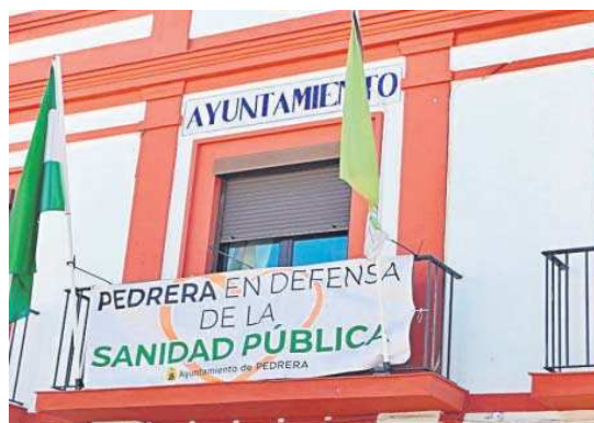
Carteles en defensa de la sanidad pública en el Consistorio de Pedrera.

La indignación por la falta de médicos de los vecinos de ocho municipios de la Sierra Sur de Sevilla, incluidos en la Zona Básica de Salud de Estepa, se tradujo ayer en un encierro en sus ayuntamientos. La protesta, convocada