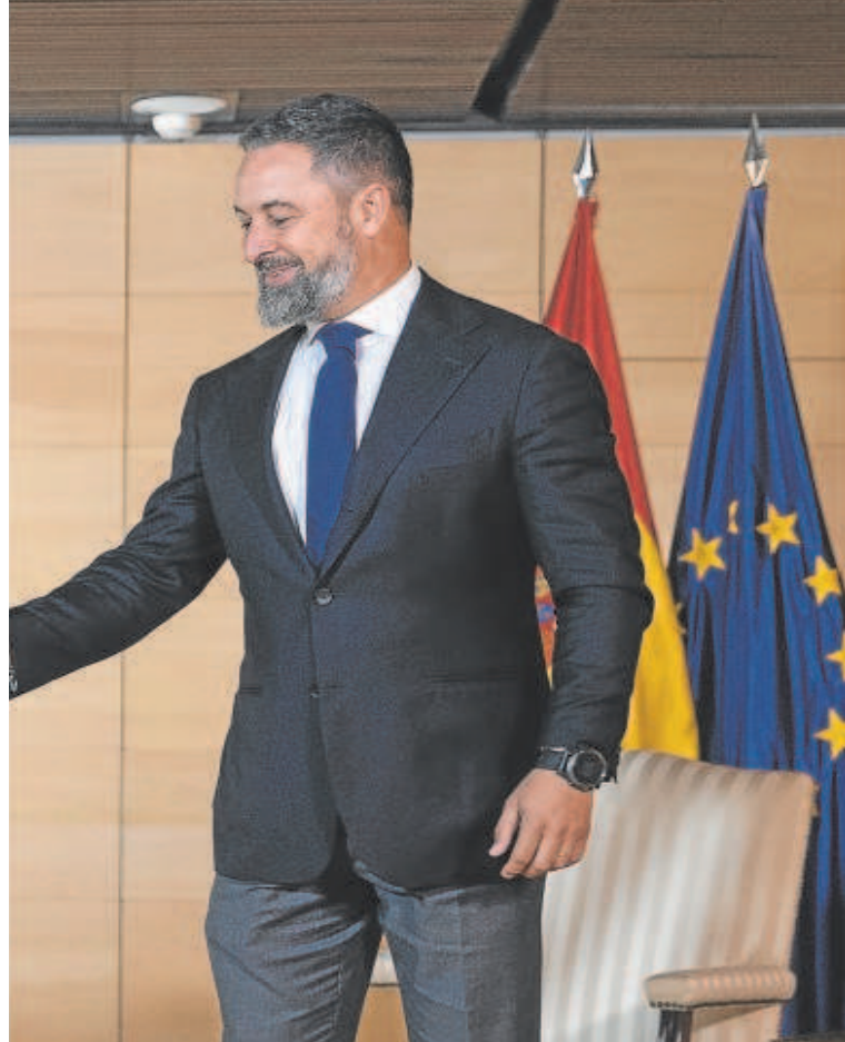
Alberto Núñez Feijóo y Santiago Abascal, ayer, en el Congreso

en el Congreso de los Diputados se vio claramente condicionada por las palabras de Puigdemont. Pero más allá de eso era un encuentro de gran relevancia. El primero oficial y público de los dos líderes desde que Feijóo preside el PP desde hace año y medio.