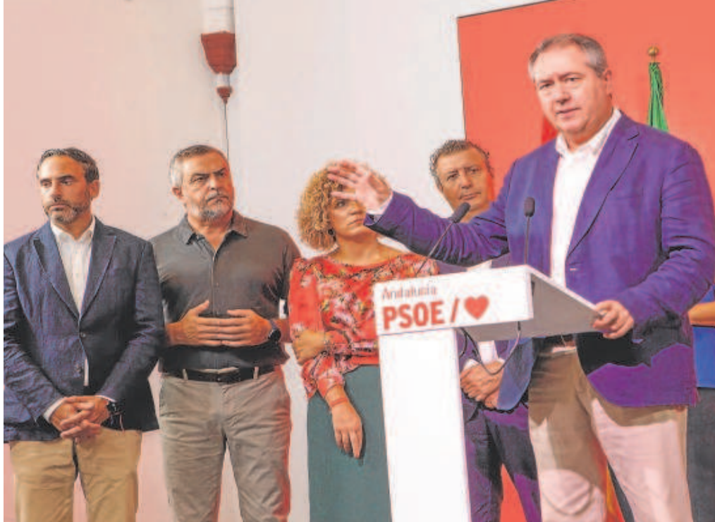
El secretario general del PSOE andaluz, Juan Espadas, ayer rodeado por sus líderes provinciales en Sevilla