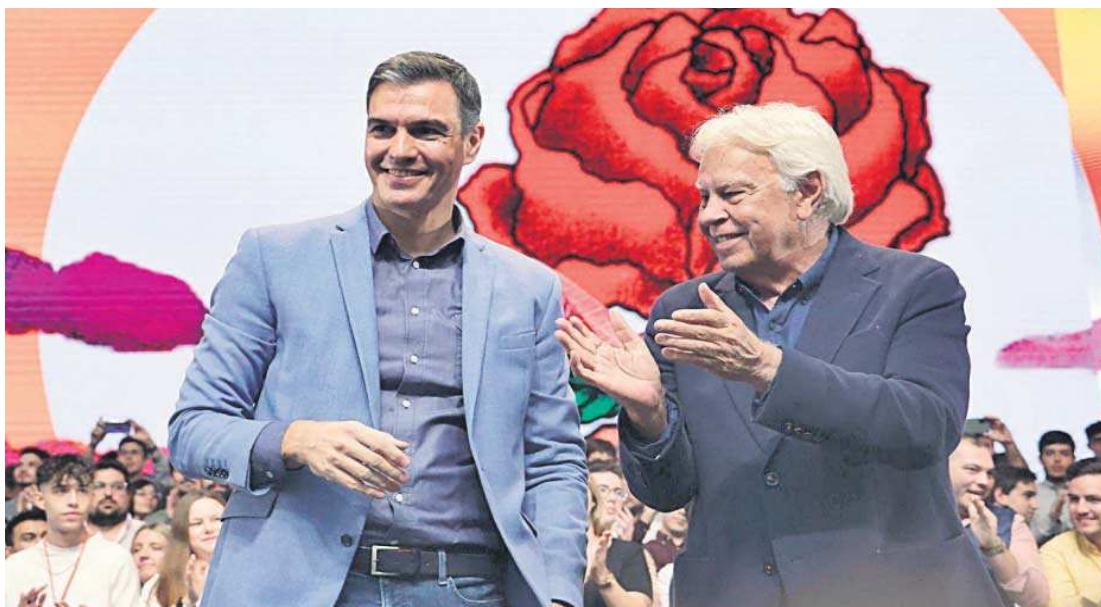
Pedro Sánchez y Felipe González, en un acto del PSOE en Sevilla hace menos de un año, cuando se conmemoró el 20º aniversario de su victoria en 1982.