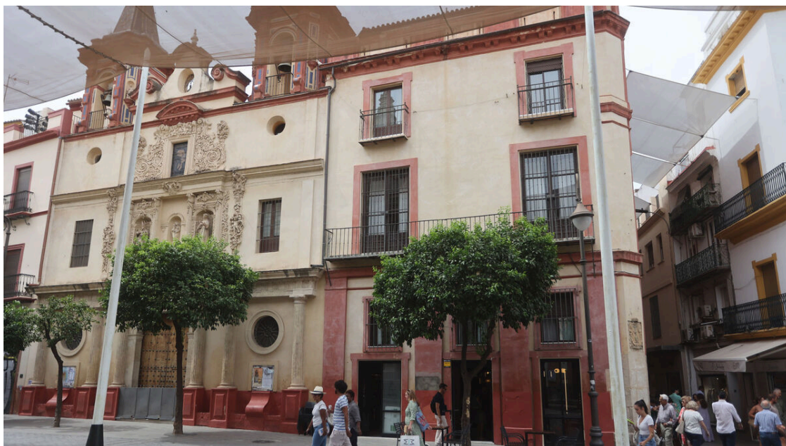
El nuevo negocio está en el local de planta baja de la Residencia de San Juan de Dios. / José Ángel García (Sevilla)

Sagasta genera cinco empleos y nace con la intención de cubrir ese vacío de cafeterías que hay en el centro de la ciudad de los bares por excelencia. No lleva ni cinco días de apertura y ya cuenta con un notable trasiego de clientes. El Salvador ha sido una plaza tradicionalmente marcada por las cervecerías ubicadas en el tramo de los soportales. Es una plaza con mucha vida, en ocasiones no sin polémica por las despedidas de soltero, los efectos del turismo excesivo y el consumo de alcohol en la vida pública. Pero también ha acogido durante décadas con terrazas de calidad como la de La Alicantina , un negocio que tradicionalmente ha tenido una oferta gastronómica muy popular con la ensaladilla y los mariscos.