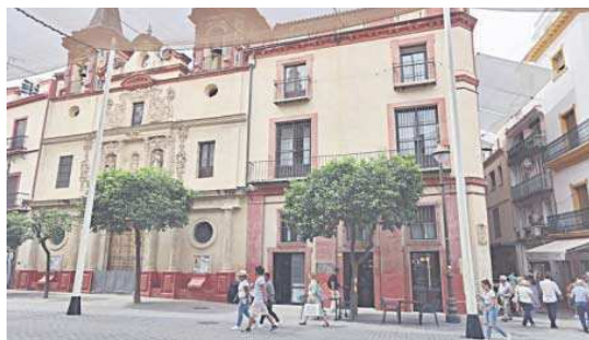
El nuevo bar está en el bajo comercial del BIC de San Juan de Dios.

La plaza recuperará en breve el popular negocio de La Alicantina, en cuyo local se aprecia ya que se ha respetado el gran azulaje de los vinos jerezanos de Maestro Sierra. El decorador de la obra de La Alicantina, por cierto, es el mismo que el de Sagasta. El nuevo negocio del Salvador abrió el jueves. El local, que aco-