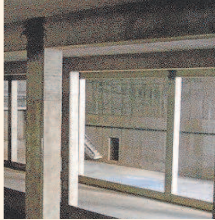
Plaza Félix Rguez de la Fuente

La capacidad de este depósito es de 10,9 millones de litros, y el domingo recogió 3,9, el 36% del total.