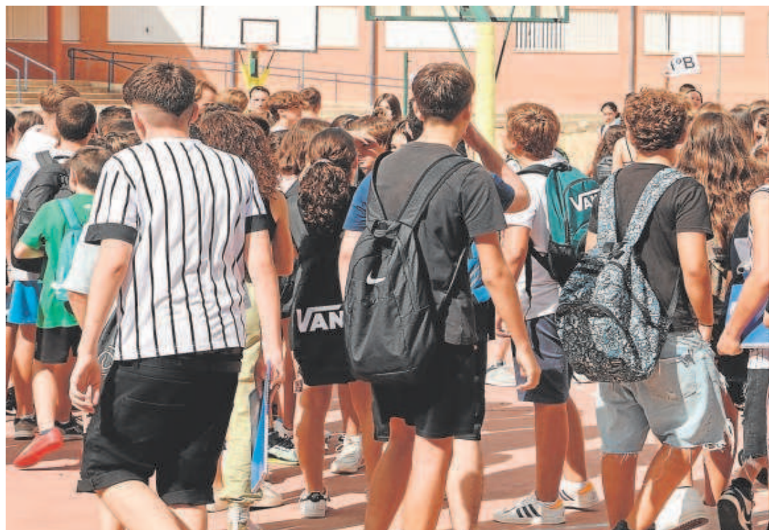
La caída de la natalidad tendrá sus efectos este curso en un descenso de las cifras de alumnos en los colegios andaluces // ROCÍO RUIZ