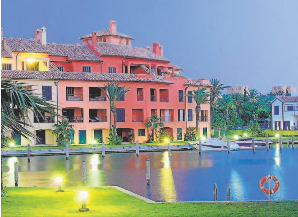
Viviendas de lujo en la urbanización Sotogrande, en el municipio gaditano de San Roque