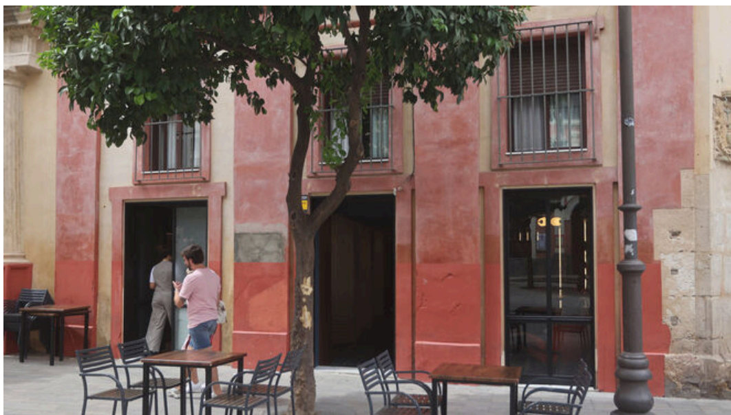
La terraza de veladores del nuevo negocio de la Plaza del Salvador