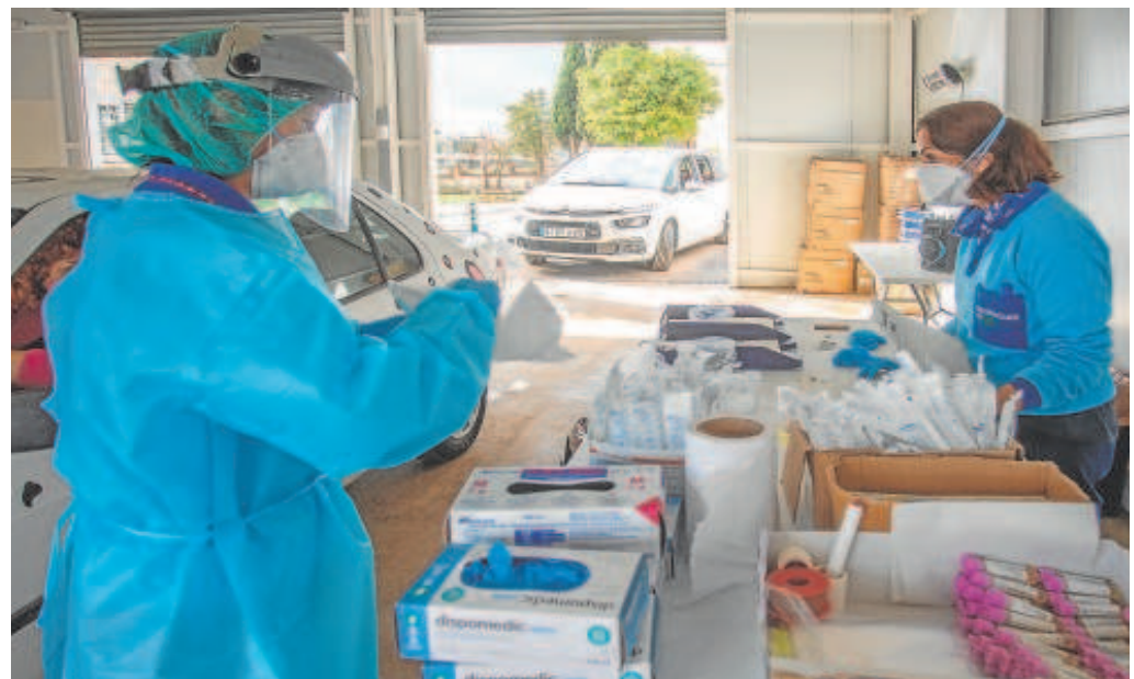
Pruebas para la detección del covid en el hospital militar de Sevilla en diciembre de 2021

García reconoció que, actualmente, predomina la variante de Ómicron XBB 1.5. y que «ahora mismo no existe ninguna vacuna que le dé cobertura». Sin embargo, mostró su «confianza» en que las dosis efectivas «lleguen a tiempo» y que la campaña de vacunación se pueda desarrollar con la estimación de un porcentaje de éxito elevado. Más allá, insistió en que «nuestra obligación es seguir protegiendo a los más vulnerables», recordando que, cuando se quitó la obligatoriedad de las mascarillas, «sacamos una instrucción para centros sanitarios y socio-sanitarios recomendando su utilización por parte de los profesionales y de las personas que visitaban a esos enfermos en los hospitales».