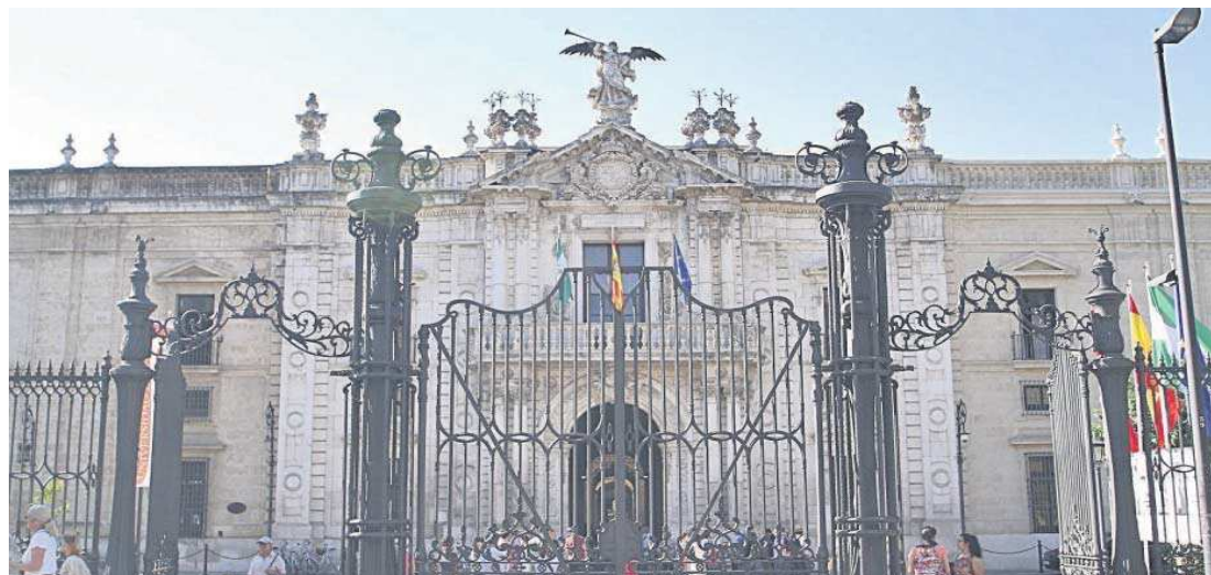
Entrada principal del Rectorado en la Calle San Fernando.