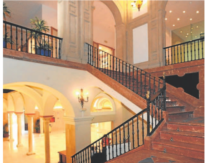
Interior de la Casa de la Provincia // LA CASA DE LA PROVINCIA

'Ensamblajes II' trata sobre encajar la vida en cajas y es un tributar un homenaje al autor Italo Calvino, uno de los escritores más universales de nuestro tiempo, con una obra literaria extensa, versátil e innovadora, del que se cumplirá el próximo mes de octubre el centenario de su nacimiento, y a cuya obra Martín Gugliemino le de-