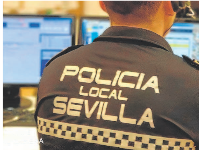
El sistema de servidores del Ayuntamiento está en La Ranilla// ABC

Una revista especializada llegó a premiar al Ayuntamiento por el nuevo Centro de Protección de Datos que puso en marcha