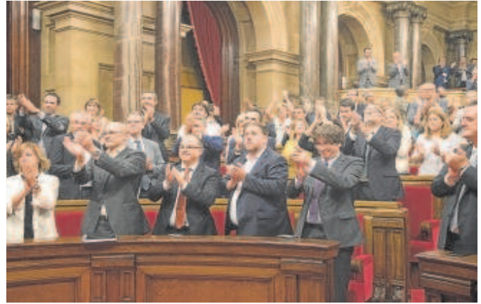
Puigdemont, el día de la aprobación de la ley de Transitoriedad Jurídica

concedió la amnistía por delitos políticos y sociales a las treinta mil personas condenadas por las revoluciones de Asturias y País Vasco y la secesión catalana de octubre del 34: una «medida de pacificación conveniente al bien público y la tranquilidad de la vida nacional», argumentaba el texto gubernamental. A la amnistía se añadió un decreto del 28 de febrero que obligaba a readmitir a los trabajadores condenados y abonarles los sueldos que no cobraron durante su ostracismo. Los ayuntamientos vascos que participaron en el golpe revolucionario fueron reconstituidos. Sirva el episodio histórico para constatar que en la idolatrada II República hubo más golpistas (izquierda bolchevique,