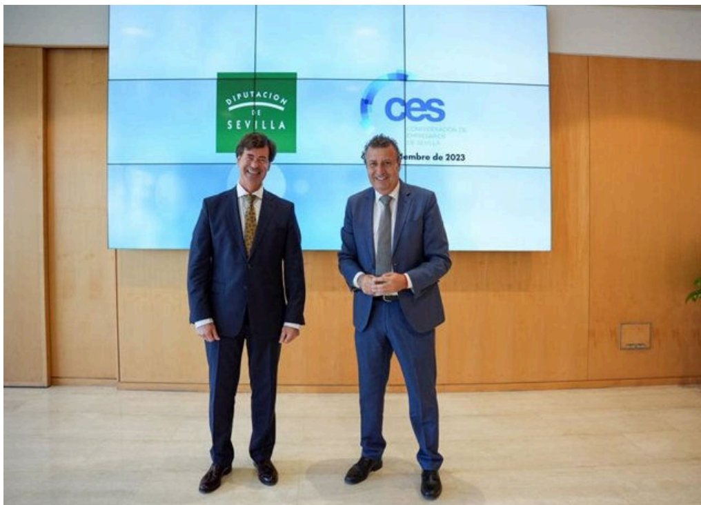
Diputación de Sevilla apuesta por el "abordaje cooperativo" con agentes sociales y económicos para lograr avances