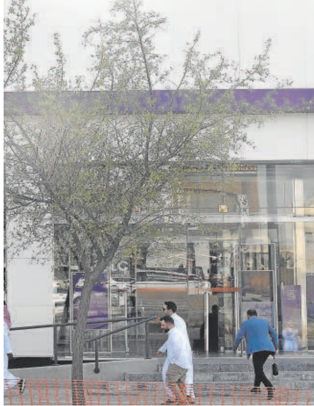
Sede central del operador saudí STC en Riad

Y se da la circunstancia de que Telefónica es un proveedor crítico de servicios de telecomunicaciones y seguridad del Ministerio de Defensa, con el que en las últimas semanas ha formalizado contratos por una valor conjunto cercano a los 200 millones, y forma parte de la principal plataforma de empresas contratistas del sector de la defensa, Aesmid.