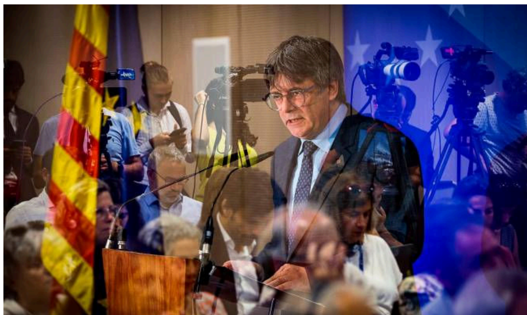
El expresidente de la Generalitat y eurodiputado de Junts, Carles Puigdemont.

La autoridad política y moral de Puigdemont -que pronunció su conferencia en un escenario sin el logotipo de JxCat- dentro de su partido sigue siendo máxima y, mientras tanto, ERC se ve relegada y sin protagonismo negociador, aunque sus votos son también claves.