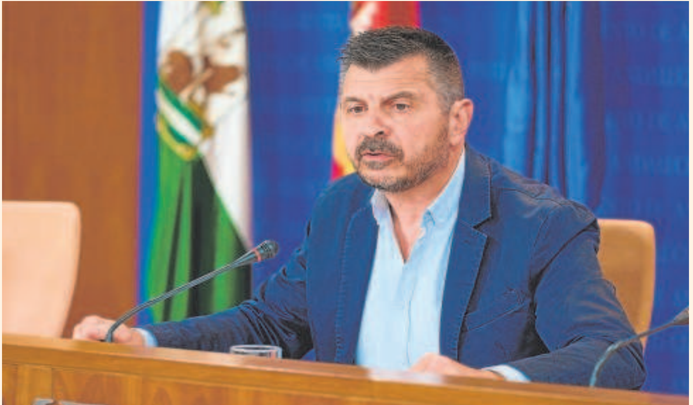
El portavoz del PP en el Parlamento andaluz, Toni Martín, ayer en una rueda de prensa