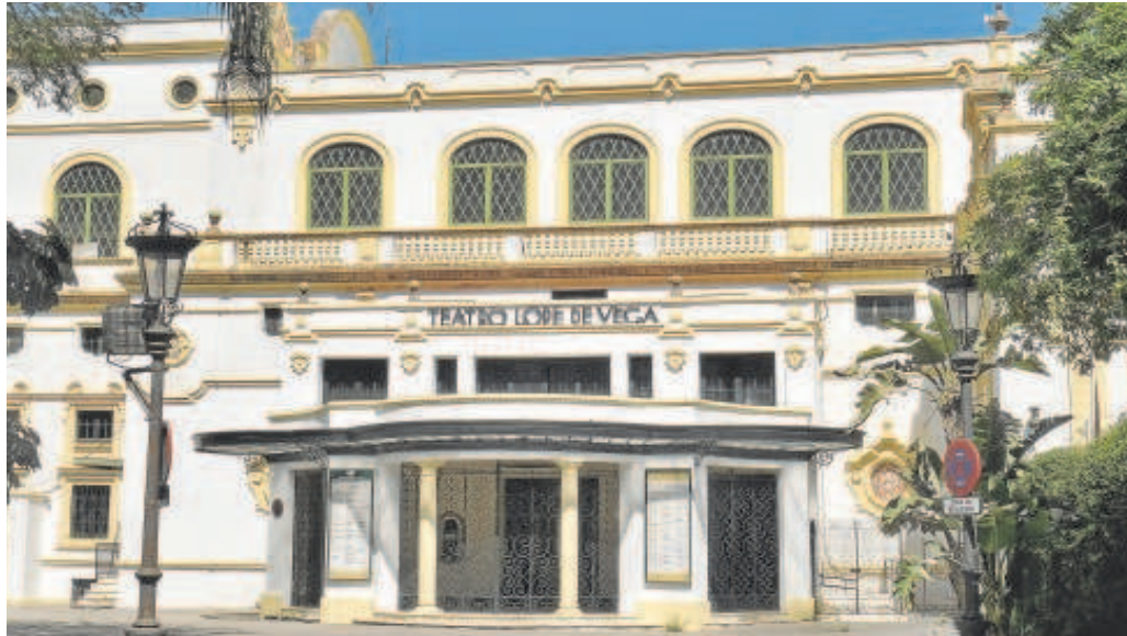
La nueva programación de la temporada 2023/2024 del Teatro Lope de Vega no se ha anunciado aún