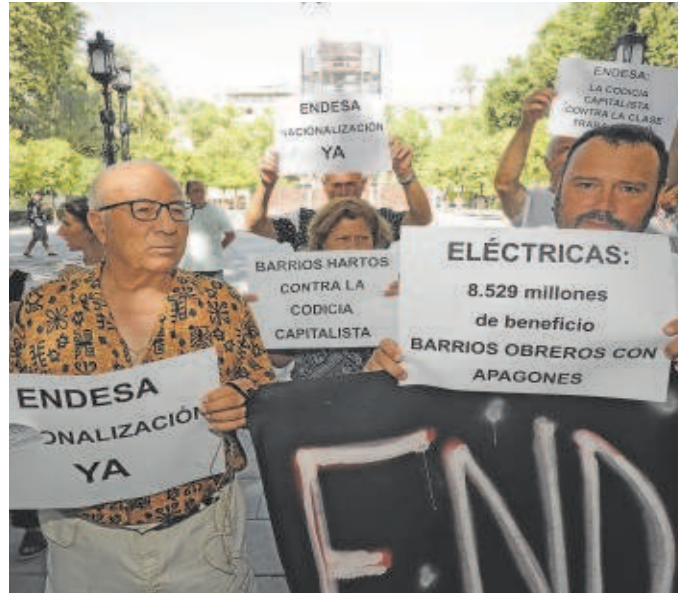
Manifestaciones de los vecinos afectados por los cortes de luz

El consejero de Industria señaló que, a falta de conocer el balance de este plan de verano 2023, «estamos convencidos de que en lo numérico estaría-