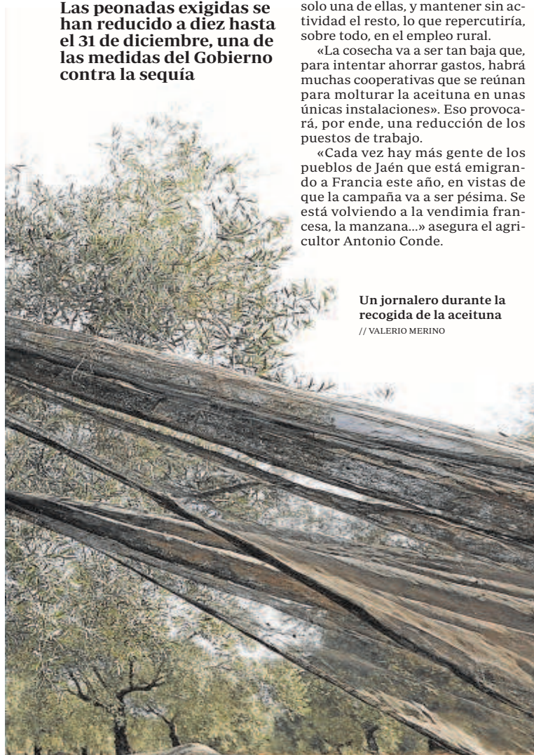
Un jornalero durante la recogida de la aceituna