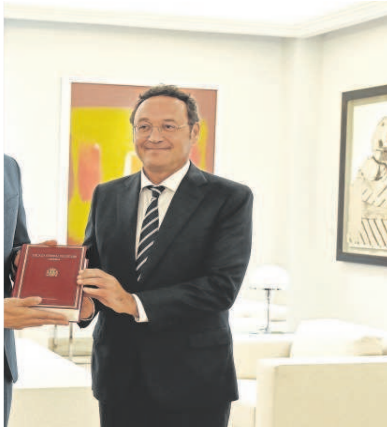
Sánchez y el Fiscal General del Estado, Álvaro García Ortiz

del 'procés' (los que no habían huido, como Puigdemont) y que por entonces afirmó con toda rotundidad, en una entrevista televisiva, que la amnistía «no cabe, porque esta es una cuestión que es muy técnica, pero que es muy reveladora. La amnistía es el olvido, aquí [refiriéndose a los indultos] no hay olvido, aquí hay perdón, para construir un futuro mejor». Pero incluso al margen de ese encaje legal de la medida, la amnistía presenta problemas de entrada que ni siquiera tenían los indultos. Para las medidas de gracia concedidas hace dos años no había duda de quiénes eran los potenciales beneficiarios, cosa que ahora no ocurre. Baste decir que incluso sectores del independentismo han reclamado que se incluya a la expresidenta del Parlament, Laura Borrás, condenada por falsedad y prevaricación por un asunto de contratación pública totalmente ajeno al 'procés'. Si bien esta reclamación ha sido desestimada tanto por los partidos de la izquierda nacional como por ERC.