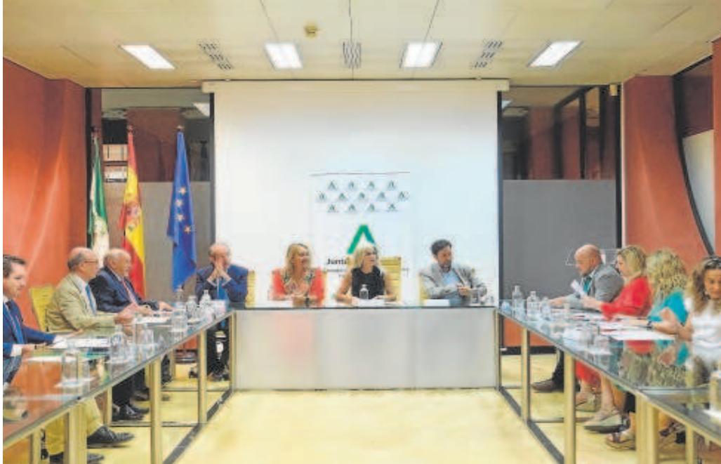
Firma del acuerdo entre la Consejería de Desarrollo Educativo y los sindicatos y la patronal de la concertada