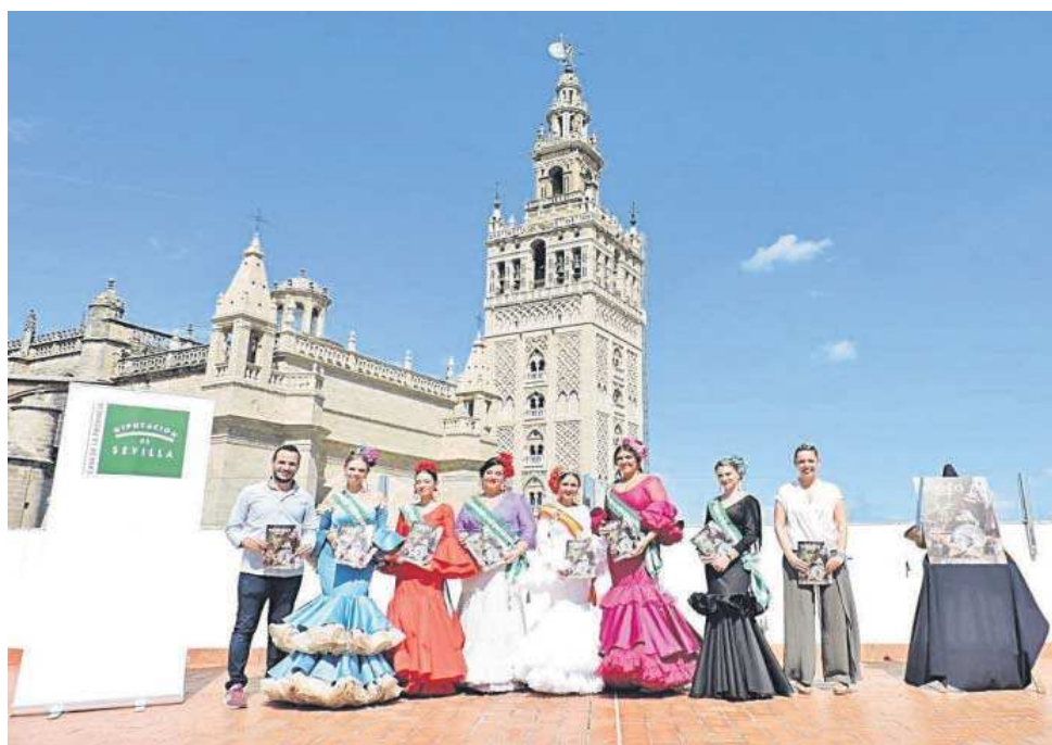
Acto de presentación de la Fiesta del Verdeo de Arahal en el entorno de la Casa de la Provincia de la Diputación. M. G.

● El municipio celebra desde ayer y hasta el domingo la 55 edición de este evento, declarado de Interés Turístico Nacional de Andalucía