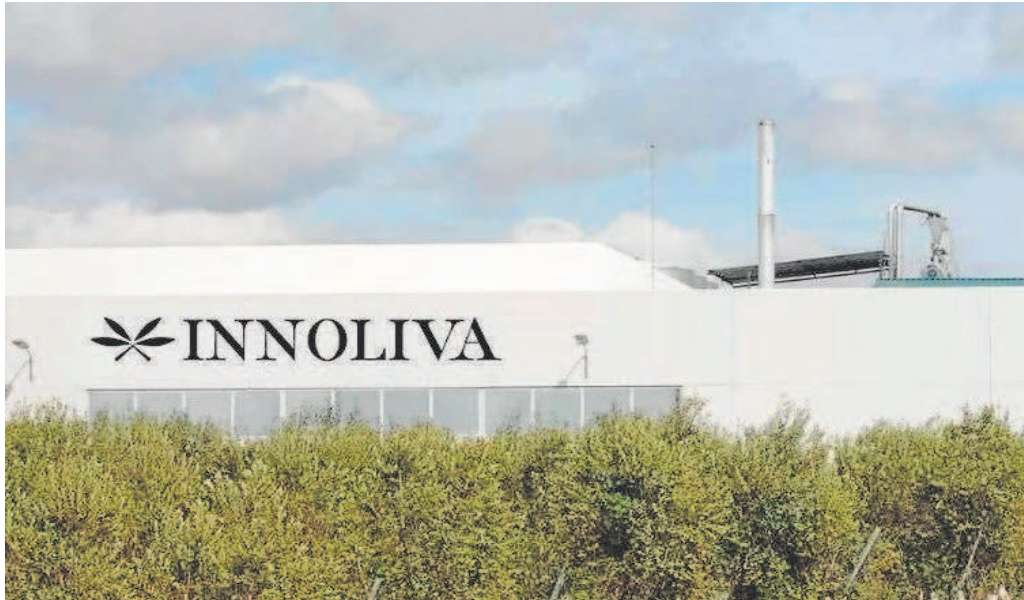
Instalaciones de Innoliva, el grupo adquirido al fondo Cibus por Fiera Comox