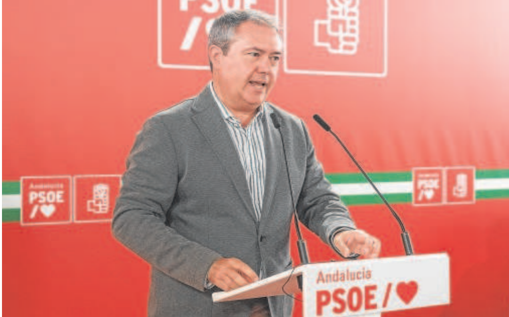
Juan Espadas, líder del PSOE andaluz, se reúne con Moreno hoy en San Telmo