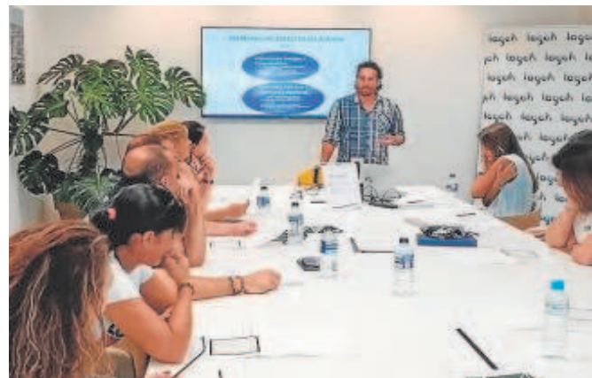
Autismo Sevilla imparte un curso a los trabajadores de Lagoh