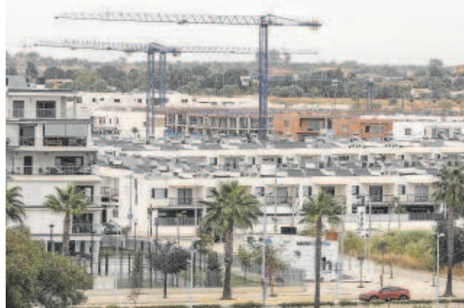
Promoción inmobiliaria en un municipio andaluz