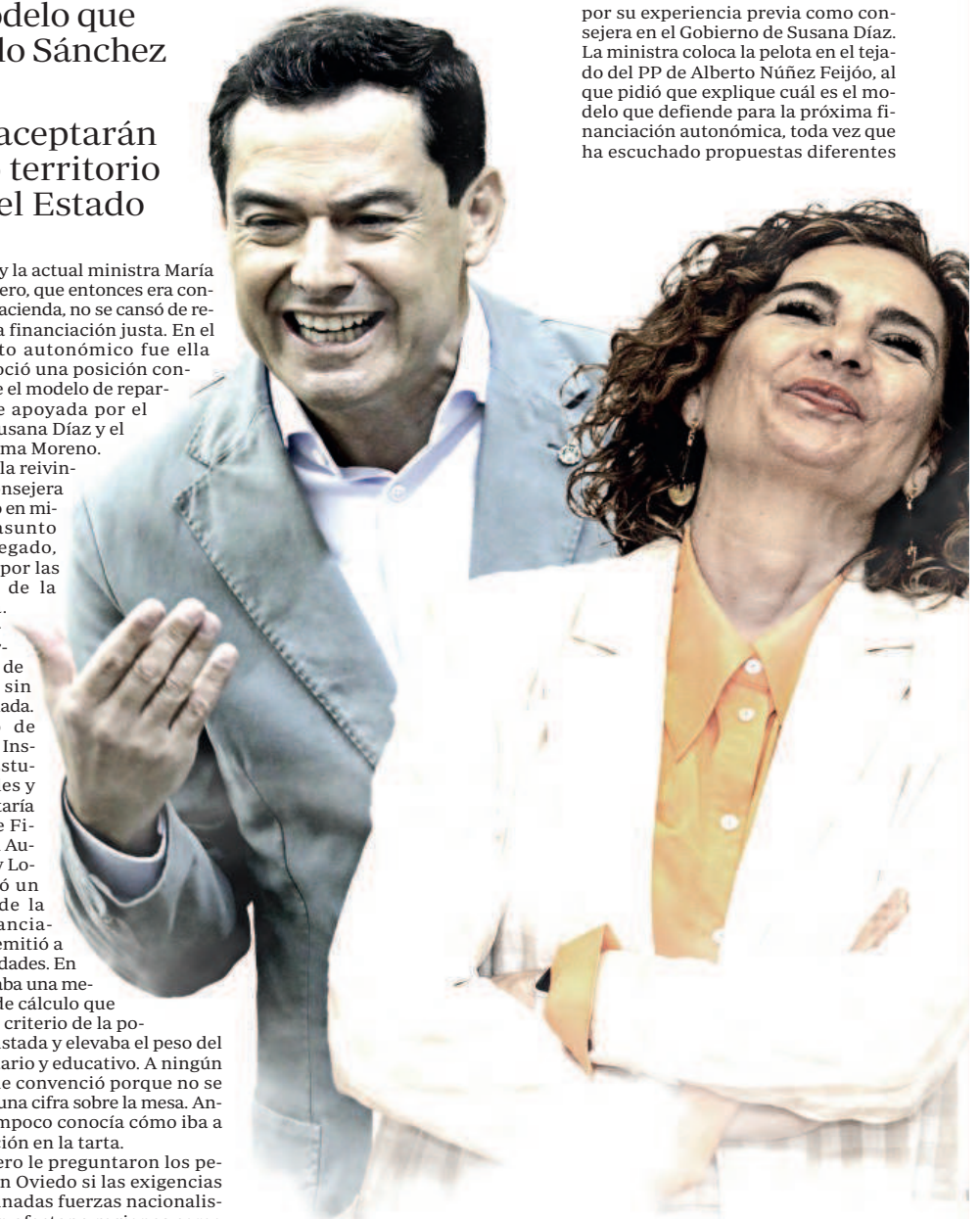
Juanma Moreno y María Jesús Montero

Siga o no como ministra, Montero ha puesto sobre aviso a las comunidades de que tendrán que ceder y abandonar su posición de máximos, de tal forma que se pueda llegar a un acuerdo «en el que todo el mundo gane» y que los gobiernos regionales que se consideran que están mal financiados puedan tener recursos para sostener el estado del bienestar. Recordó que ella tiene un «gran conocimiento» del modelo de financiación autonómica por su experiencia previa como consejera en el Gobierno de Susana Díaz. La ministra coloca la pelota en el tejado del PP de Alberto Núñez Feijóo, al que pidió que explique cuál es el modelo que defiende para la próxima financiación autonómica, toda vez que ha escuchado propuestas diferentes