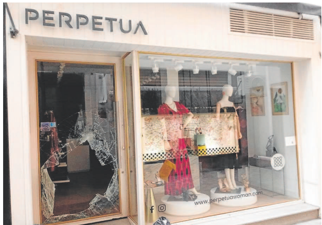
Vista desde la calle Muñoz Olivé del estado en el que quedó el escaparate de la tienda afectada por el robo

Por último, el alcalde José Luis Sanz, anunció el pasado mes de julio de la activación de un dispositivo especial de la Policía Local para vigilar las calles del Centro ante la oleada de robos que se llevan produciendo desde hace meses en numerosos establecimientos del entorno de la Magdalena, la plaza Nueva o la calle Francos.