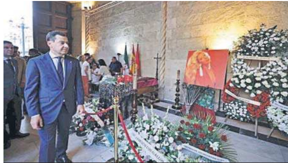
Juanma Moreno, presidente de la Junta, visita la capilla ardiente.