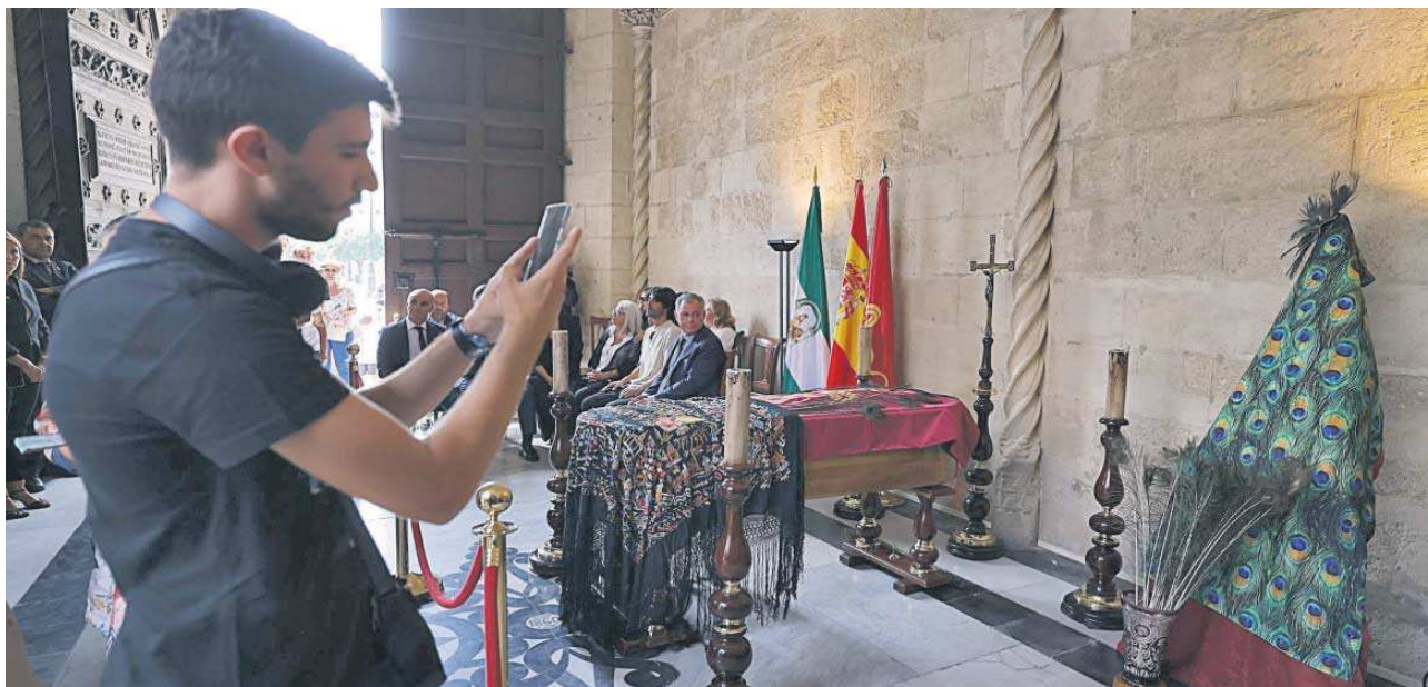
Un visitante fotografía la capilla ardiente en la Sala del Apeadero del Ayuntamiento de Sevilla.